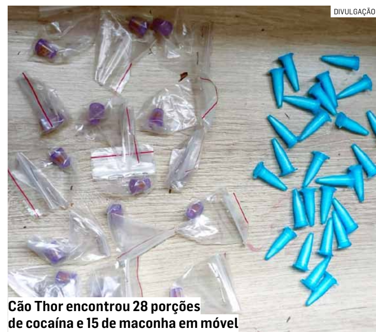
Cão Thor encontrou 28 porções de cocaína e 15 de maconha em móvel

de foram encontradas 28 porções de cocaína e 15 de maconha. Diante dos fatos, a mulher, que está acolhida com quatro crianças, foi detida e encaminhada ao 1º Distrito Policial de Hortolândia, permanecendo à disposição da Justiça. O Conselho Tutelar foi acionado e assumiu a responsabilidade pelas crianças.