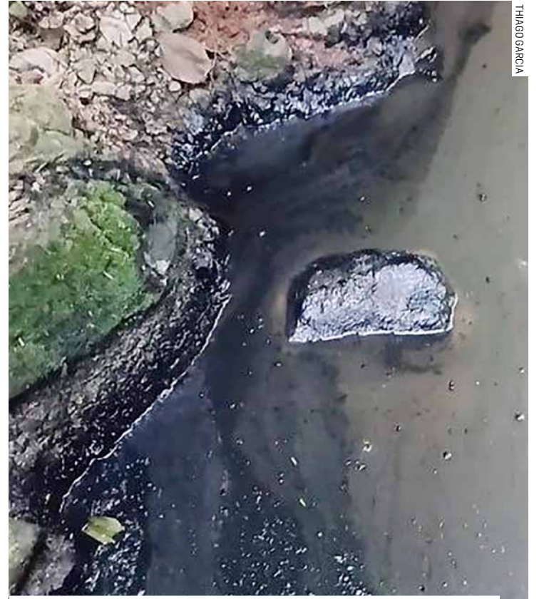
Morador flagrou material despejado ilegalmente na água

ficar resíduos no local e acionar autoridades. O trecho afetado fica entre os bairros Vila Bertini e Parque Nova Carioba, próximo à saída de efluentes de uma empresa. Indícios apontam possível origem industrial. PÁGINA 09