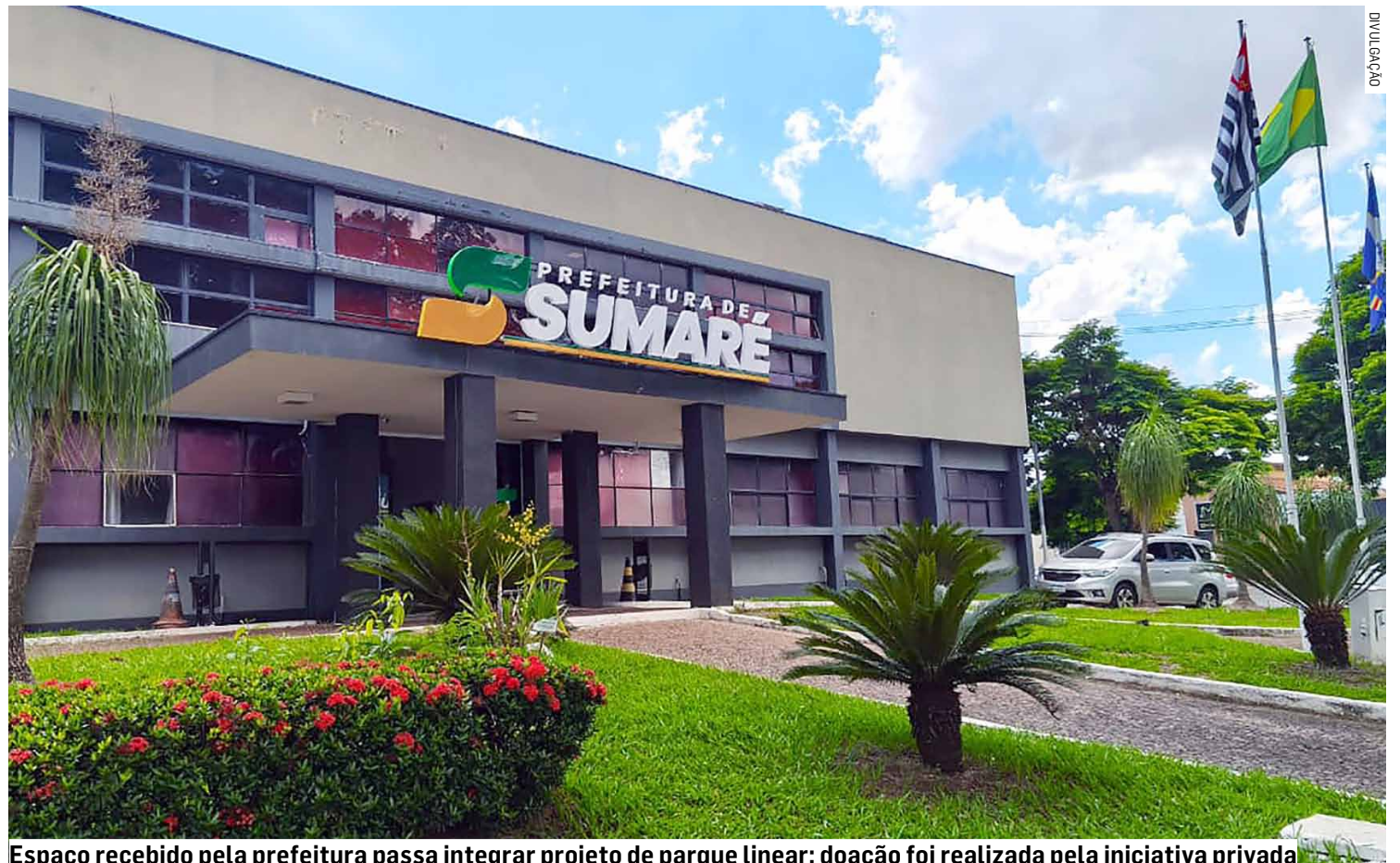
Espaço recebido pela prefeitura passa integrar projeto de parque linear; doação foi realizada pela iniciativa privada

Segundo a justificativa do ato, a doação atende à necessidade de proteção permanente do leito do afluente do Córrego da Velosa e está alinhada às dire-