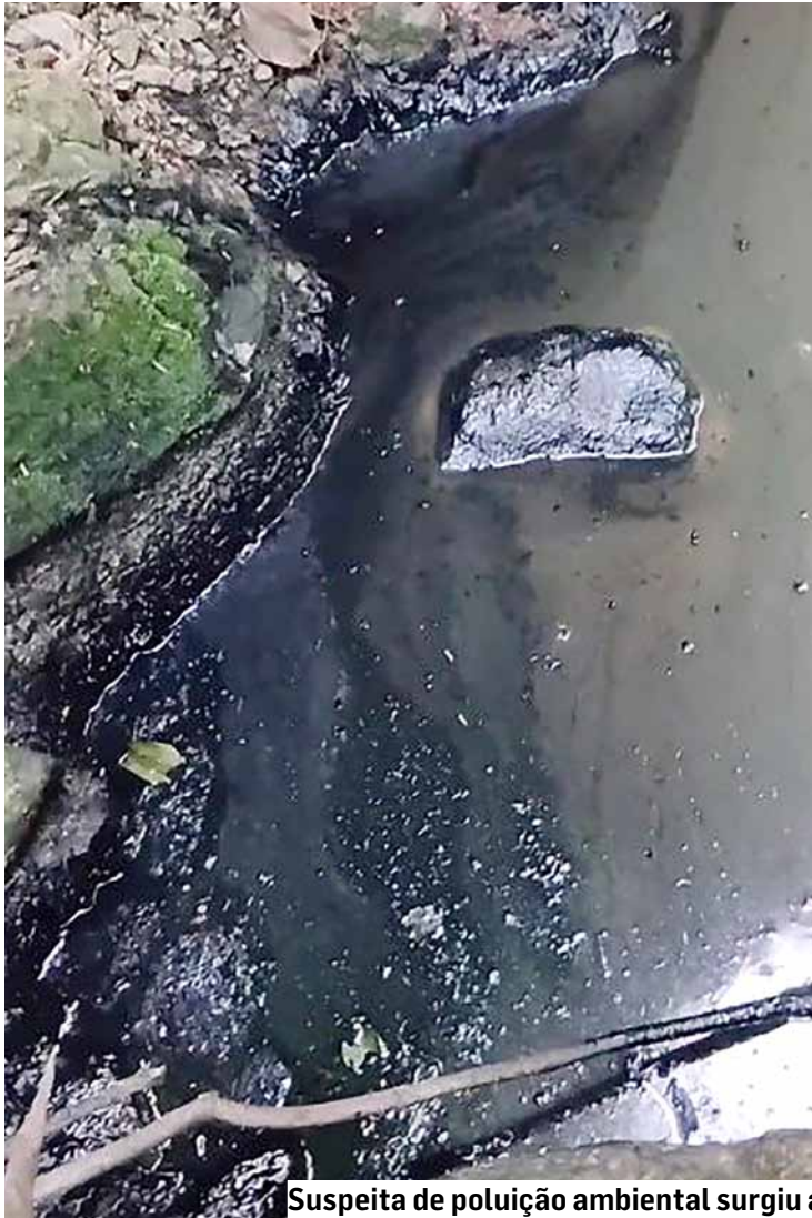
Suspeita de poluição ambiental surgiu após morador identificar resíduos no local

Órgão de fiscalização ambiental apura despejo de substância escura em ponto do Córrego Bertini; área afetada fica entre bairros Vila Bertini e Parque Nova Carioba, próxima ao local de saída de efluentes tratados de uma empresa