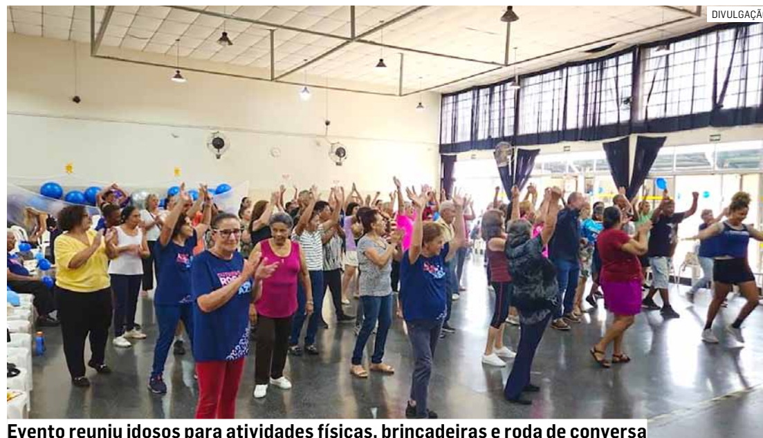
Evento reuniu idosos para atividades físicas, brincadeiras e roda de conversa