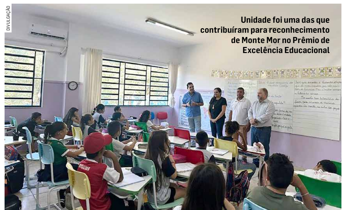
Unidade foi uma das que contribuíram para reconhecimento de Monte Mor no Prêmio de Excelência Educacional

As duas escolas devem receber recursos do Governo do Estado, com repasse aproximado de R$ 100 por aluno matriculado, como incentivo pelos resultados obtidos.