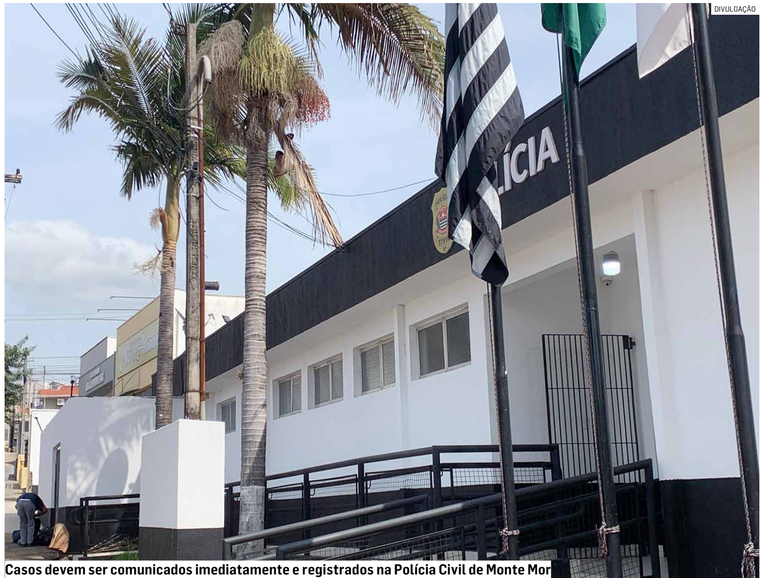
Casos devem ser comunicados imediatamente e registrados na Polícia Civil de Monte Mor

Caso alguém receba esse tipo de contato, a recomendação é procurar imediatamente a polícia e registrar um boletim de ocorrência.