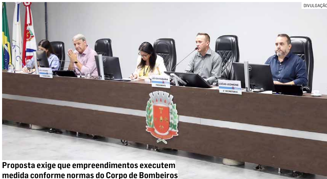
Proposta exige que empreendimentos executem medida conforme normas do Corpo de Bombeiros

Na justificativa do projeto, o autor aponta que os veículos elétricos dependem de uma infraestrutura preparada para serem recarregados de maneira segura. A lei não obriga a instalação imediata de equipamentos de recarga, mas exige que os empreendimentos executem a previsão técnica adequada, em conformidade com as normas técnicas vigentes e com as exigências do Corpo de Bombeiros, com a responsabilidade exclusiva do empreendedor ou construtor. A proposta não se aplica a edificações e em-