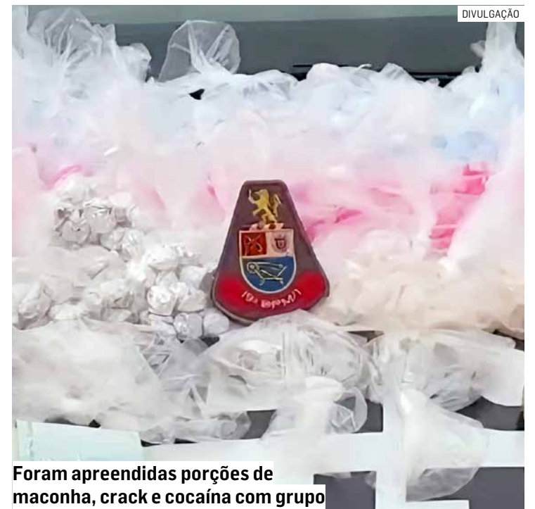
Foram apreendidas porções de maconha, crack e cocaína com grupo

Todo o material apreendido, bem como o dinheiro e anotações encontradas, ainda está sendo contabilizado pelas autoridades. Os envolvidos permanecem à disposição da Justiça.