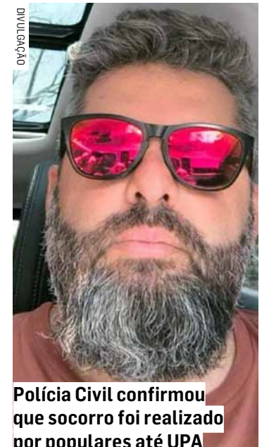
Polícia Civil confirmou que socorro foi realizado por populares até UPA

Posteriormente ao crime, a Polícia Civil confir-