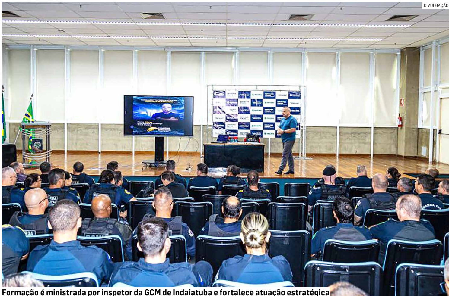
Formação é ministrada por inspetor da GCM de Indaiatuba e fortalece atuação estratégica

Além do efetivo de Paulínia, o curso conta com a participação de guardas municipais das cidades de Valinhos, Atibaia, Cosmópolis, Hortolândia, Jandira, além de representantes de