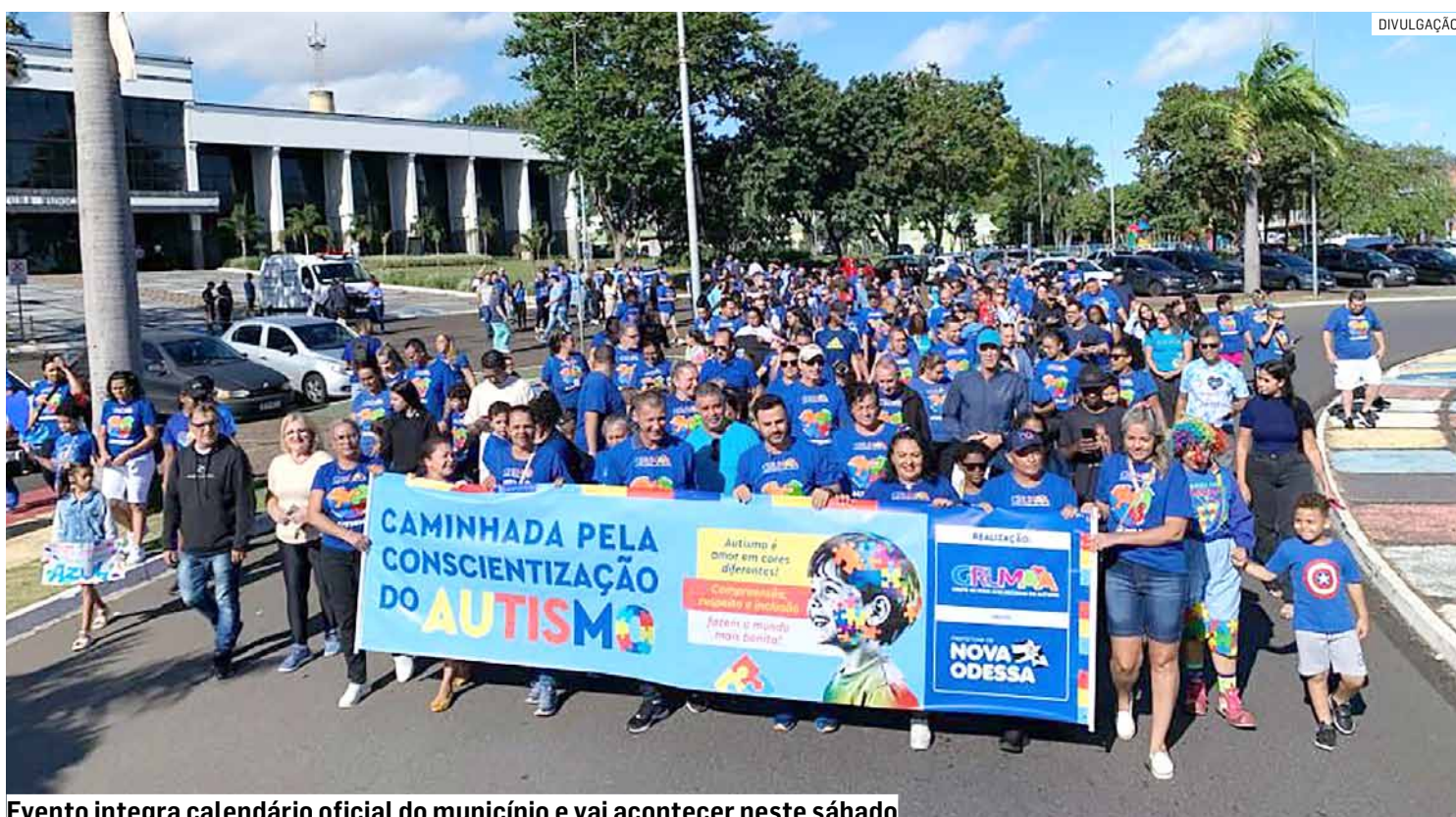
Evento integra calendário oficial do município e vai acontecer neste sábado

Da Redação • NOVA ODESSA tribunaliberal@tribunaliberal.com.br