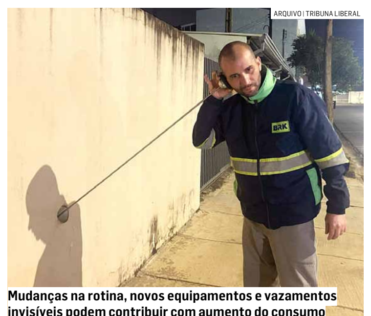
Mudanças na rotina, novos equipamentos e vazamentos invisíveis podem contribuir com aumento do consumo

Já os vazamentos após o relógio (internos) são de responsabilidade do proprietário/inquilino do imóvel. Ao suspeitar ou confirmar um vazamento dentro