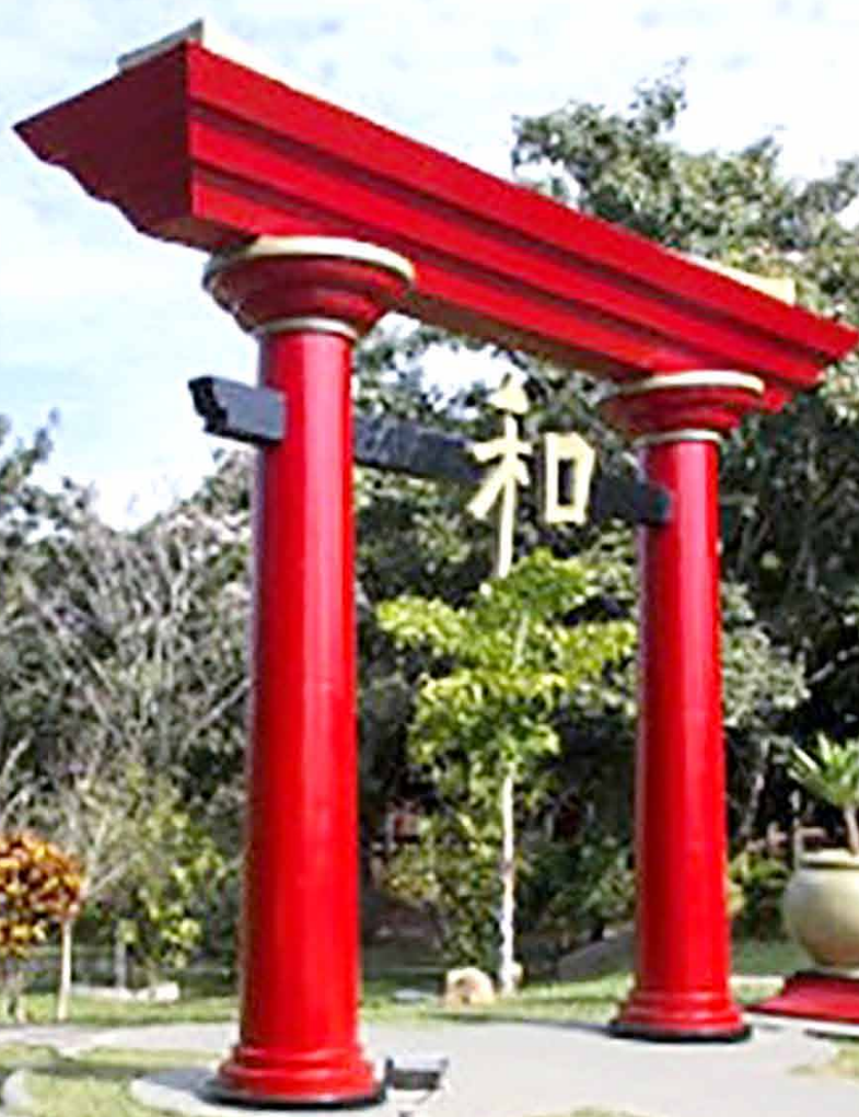
Na foto: Jardim Oriental, em Piedade (SP)

Entre os atrativos do município de Piedade destacamos o Jardim Oriental de Piedade. É parte de um conjunto turístico que está localizado no km 101 da rodovia SP-250. Já o seu Parque Ecológico, palco de diversas atividades culturais e socioambientais, está localizado na Vila Nova Olinda. Em Piedade também está o Parque Estadual do Jurupará, criado em 1992, com 26 mil hectares. Trata-se de uma reserva da Biosfera da Mata Atlântica considerada unidade de conservação do Estado de São Paulo, integrante do sistema Estadual de Florestas, e onde são desenvolvidos projetos de ecoturismo. Conheça os aromas e sabores de Piedade.