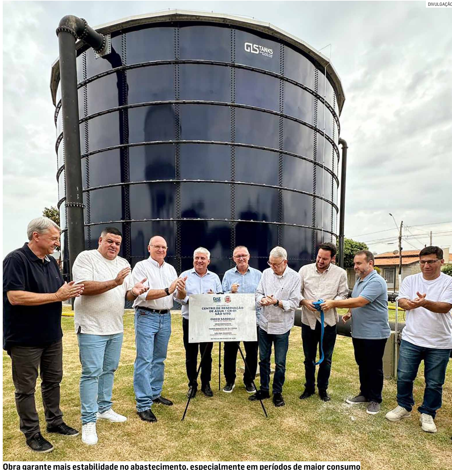
Obra garante mais estabilidade no abastecimento, especialmente em períodos de maior consumo

Estrutura instalada no São Vito aumenta a capacidade de armazenamento de água, passando de 1,6 milhão para 3,7 milhões de litros; cerca de 20 mil moradores de diversos bairros serão diretamente beneficiados com investimento