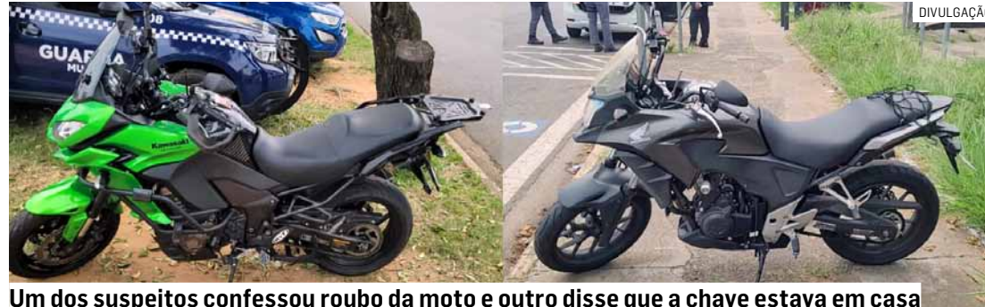
Um dos suspeitos confessou roubo da moto e outro disse que a chave estava em casa

De acordo com a PM, após o crime, os suspeitos abandonaram a motocicleta em uma área de mata na Rua Quito. Imagens de monitoramento auxiliaram na identificação e na informação de que os envolvidos