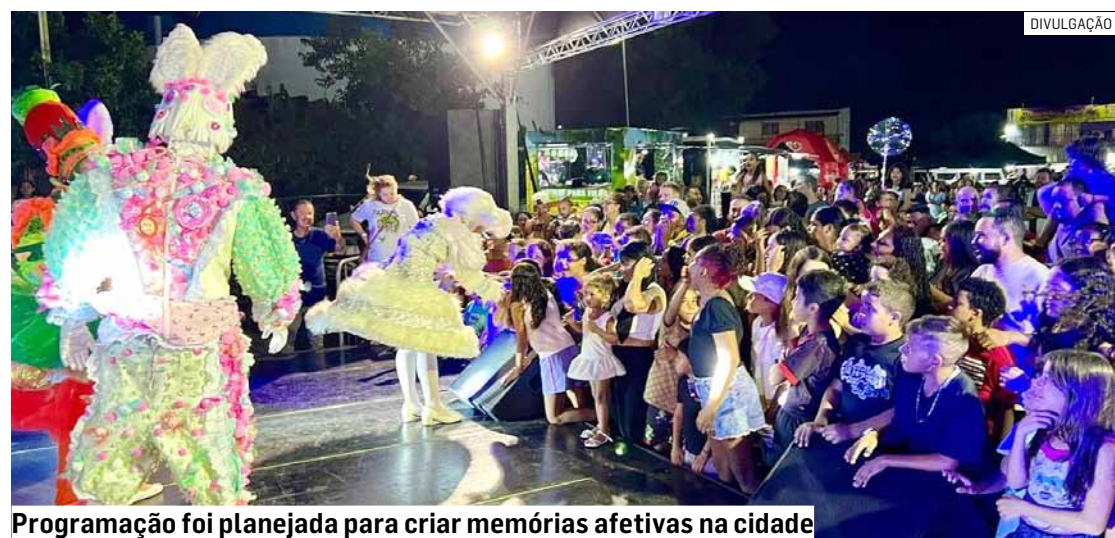
Programação foi planejada para criar memórias afetivas na cidade

Da Redação • SUMARÉ tribunaliberal@tribunaliberal.com.br