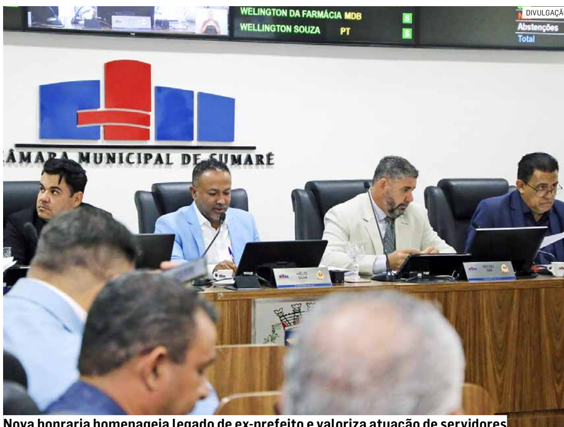
Nova honraria homenageia legado de ex-prefeito e valoriza atuação de servidores

A Câmara Municipal de Sumaré aprovou a criação da Medalha "Prefeito Professor José Antônio Bacchim", destinada a homenagear servidores públicos. A honraria consta no Projeto de Decreto Legislativo nº 01/2026, apresentado de forma conjunta pelos 21 vereadores da Casa e aprovado em regime de urgência na sessão ordinária desta terça-feira (31). A iniciativa tem como objetivo reconhecer profissionais da administração direta e indireta que tenham contribuído significativamente para a melhoria dos serviços públicos prestados à