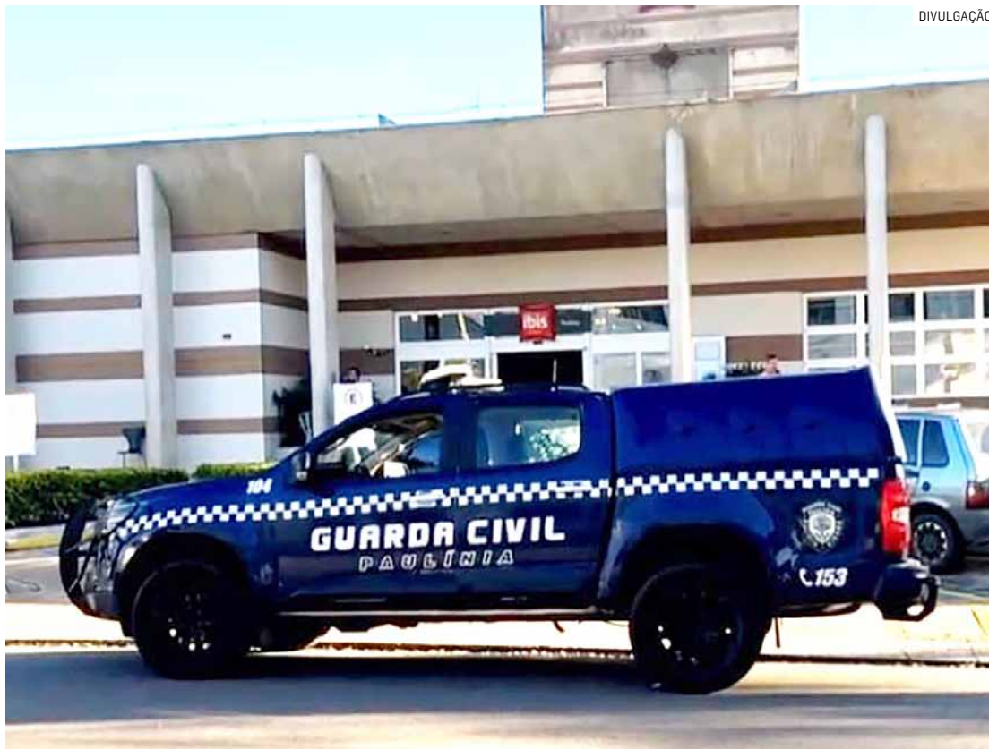
Ataque aconteceu em um hotel localizado na Avenida 31 de Março, no Jardim Santa Cecília

A ocorrência foi registrada e encaminhada ao 1º Distrito Policial de Paulínia, que ficará responsável pela investigação das circunstâncias e da motivação do crime.