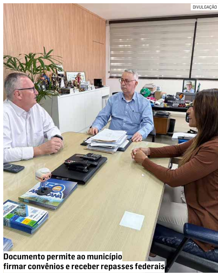
Documento permite ao município firmar convênios e receber repasses federais