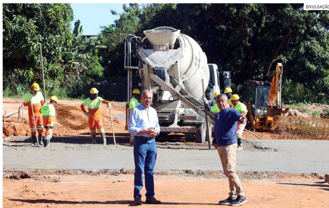
Zezé conferiu obras do parque, como concretagem e preparação da calçada de pedestres

A transformação, porém, vai muito além da paisagem. Ela representa um novo capítulo para uma região que, ao longo dos anos, passou a receber investimentos estruturantes da Prefeitura ca-