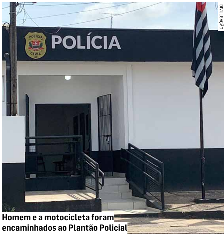
Homem e a motocicleta foram encaminhados ao Plantão Policial