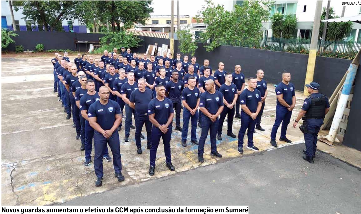
Novos guardas aumentam o efetivo da GCM após conclusão da formação em Sumaré

Ao longo da capacitação, os guardas receberam formação teórica e prática voltada às atribuições da Guarda Civil Municipal. O curso abordou disciplinas como legislação, direitos humanos, técnicas operacionais, atendi-