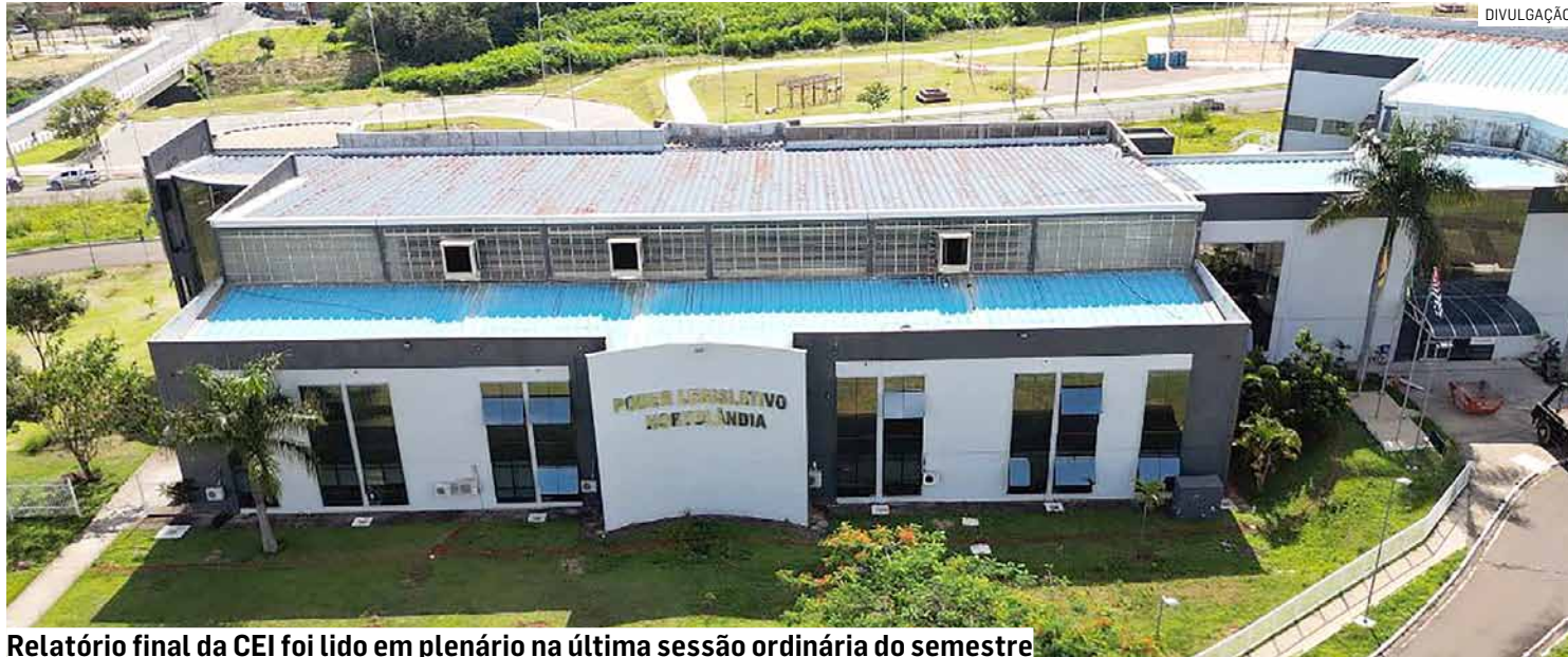
Relatório final da CEI foi lido em plenário na última sessão ordinária do semestre