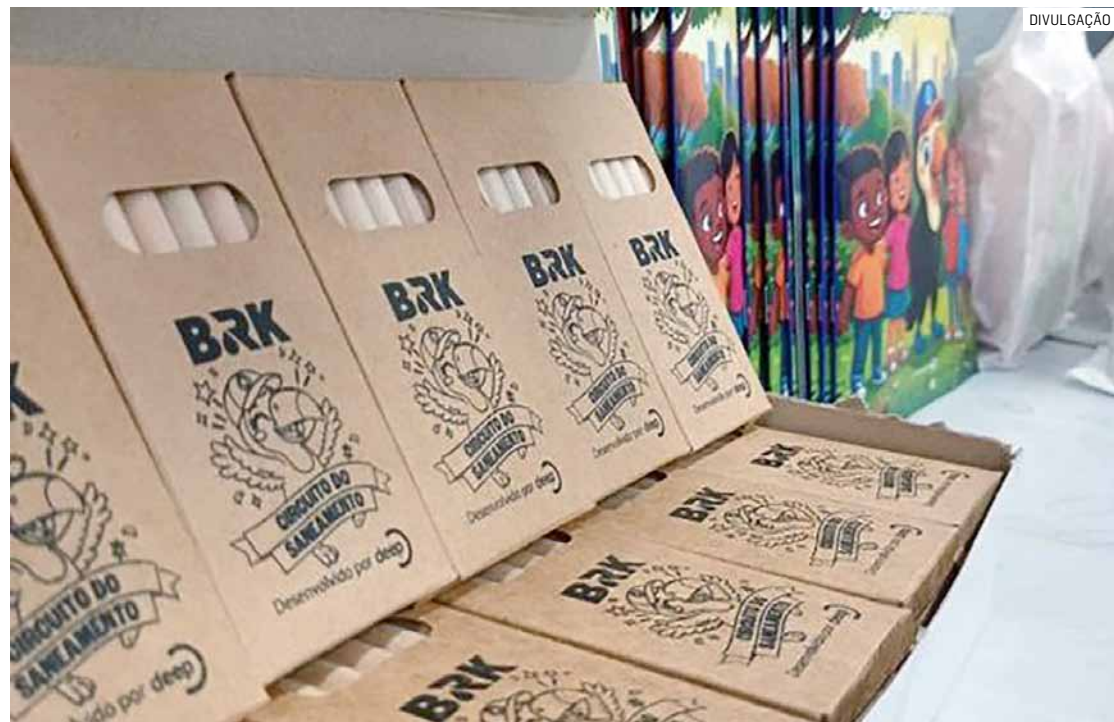
Iniciativa da BRK utilizou atividades lúdicas e interativas para conscientizar sobre saneamento

“O saneamento está presente em diversos momentos do nosso dia a dia, mas nem sempre as pessoas conhecem sua importância e o caminho que a água percorre até chegar às tornei-