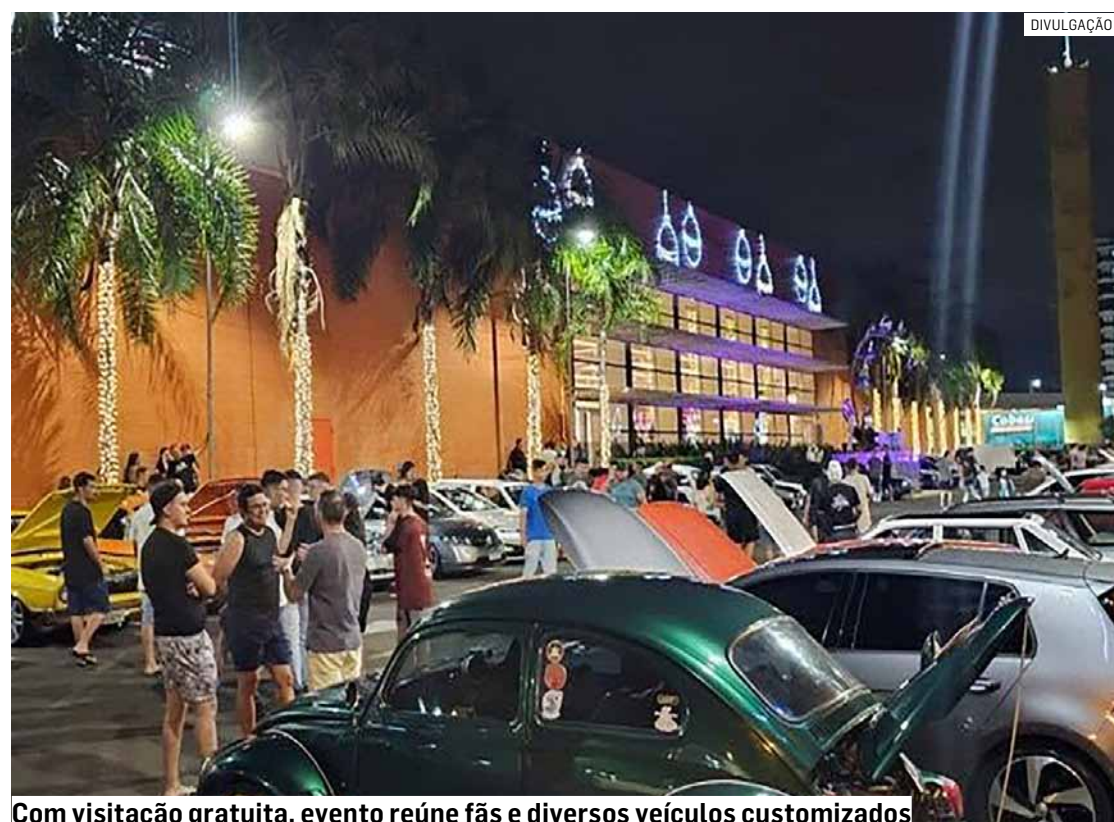
Com visitação gratuita, evento reúne fãs e diversos veículos customizados

Para garantir a segurança e o conforto do público,