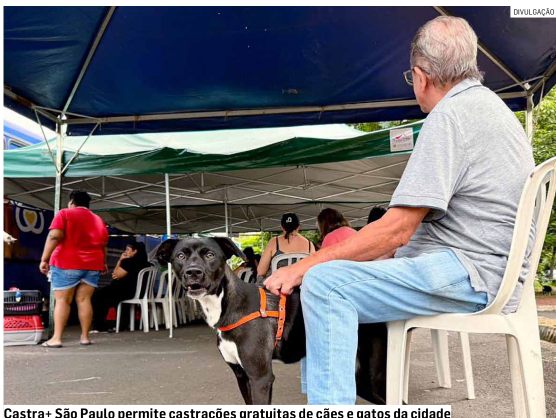
Castra+ São Paulo permite castrações gratuitas de cães e gatos da cidade