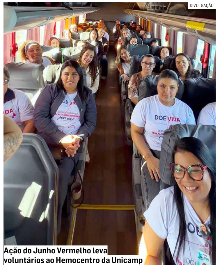
Ação do Junho Vermelho leva voluntários ao Hemocentro da Unicamp

“Cada doação representa esperança para quem enfrenta um tratamento ou uma emergência. O Fundo Social tem o compromisso de incentivar ações que promovam a solidariedade e o cuidado com o próximo. Agradecemos a todos os voluntários que participaram da Caravana Solidária e fizeram a diferença na vida de muitas pessoas”, destacou.