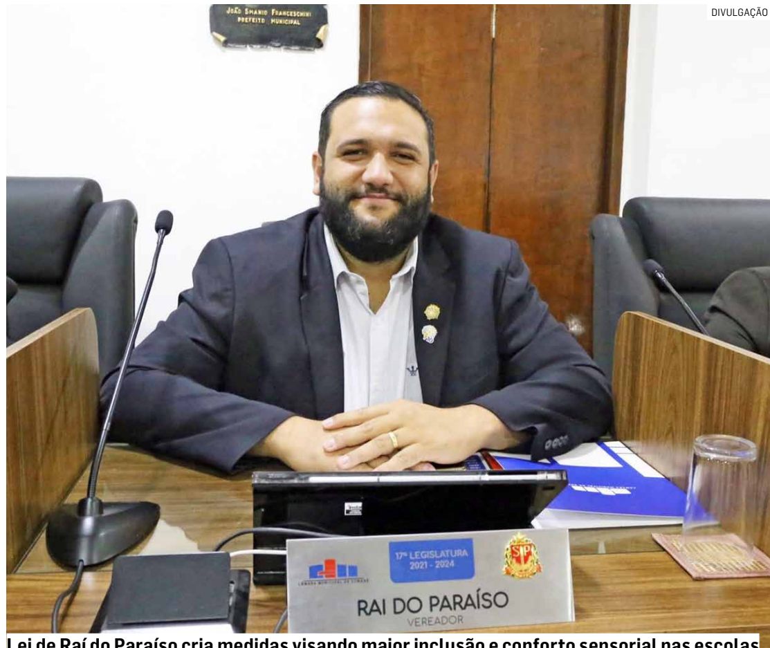
Lei de Raí do Paraíso cria medidas visando maior inclusão e conforto sensorial nas escolas

Legislação em vigor institui projeto que é voltado à inclusão de estudantes com Transtorno do Espectro Autista e outras condições de hipersensibilidade sensorial, prevendo adaptações, capacitação de profissionais e espaços de acolhimento