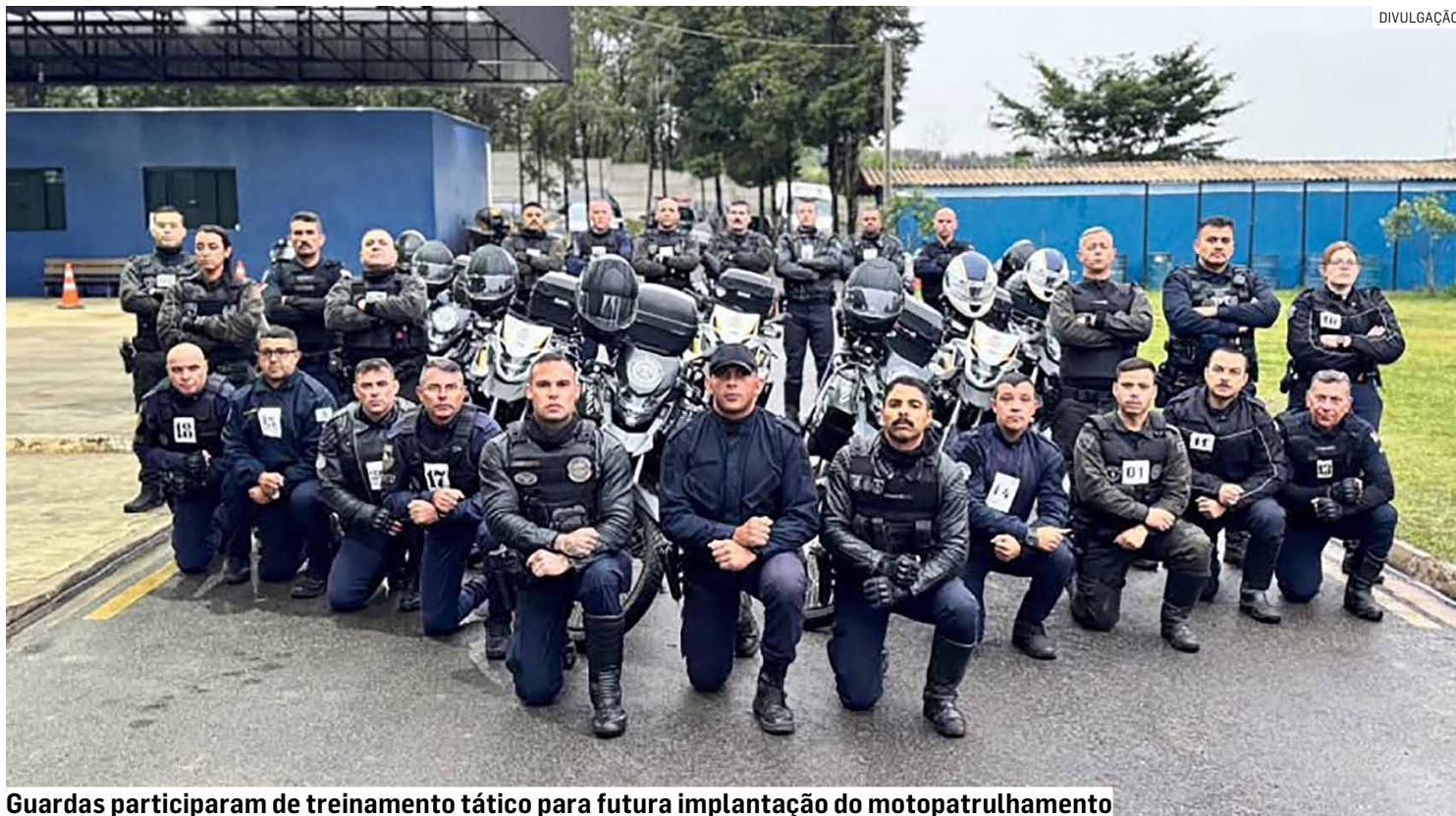
Guardas participaram de treinamento tático para futura implantação do motopatrulhamento

Durante os três dias de treinamento, os agentes receberam aulas teóricas e práticas voltadas à condução operacional de motocicletas, técnicas avançadas de pilotagem, deslocamentos táticos, abordagens policiais, posicionamento estratégico durante o patrulhamento e protocolos de segurança. O curso também abordou procedimentos específicos para