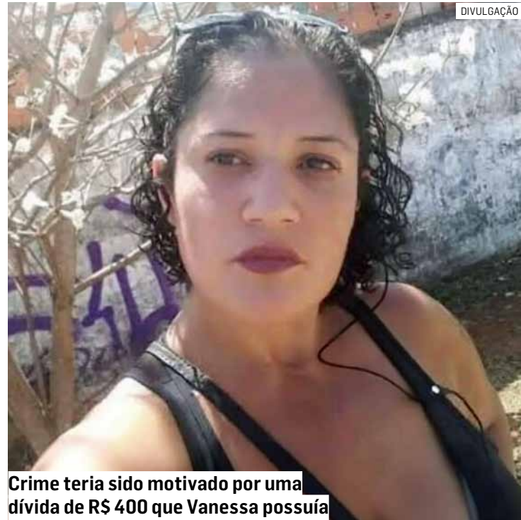
Crime teria sido motivado por uma dívida de R$ 400 que Vanessa possuía

Cézar Oliveira • REGIÃO tribunaliberal@tribunaliberal.com.br