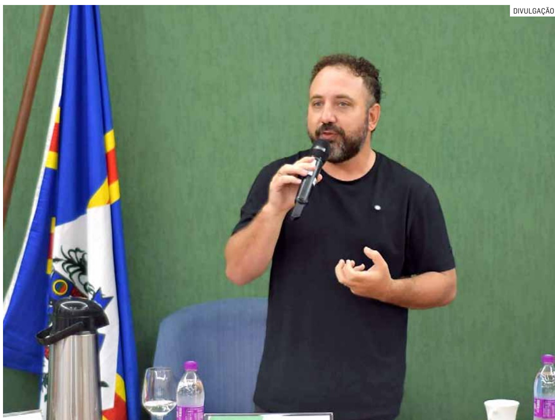
Convênios reforçam serviços da assistência social em diferentes regiões de Sumaré

Os serviços de convivência e fortalecimento de vínculos também concentram parte significati-