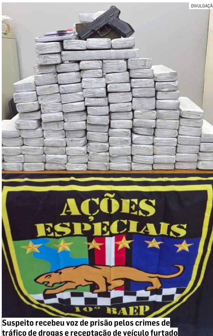
Suspeito recebeu voz de prisão pelos crimes de tráfico de drogas e receptação de veículo furtado

O morador autorizou a entrada da equipe e acom-