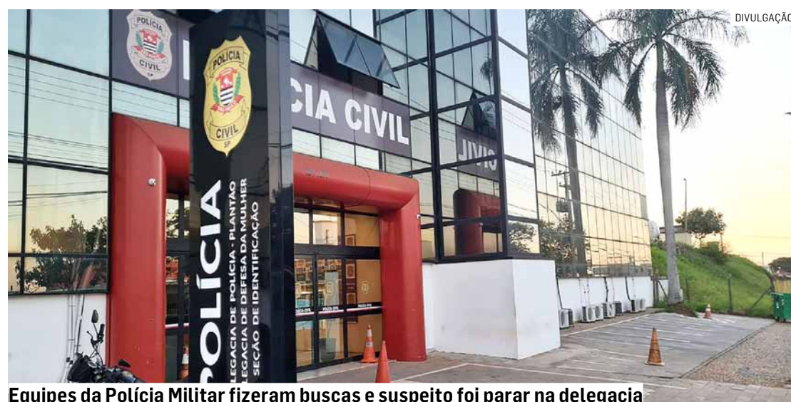
Equipes da Polícia Militar fizeram buscas e suspeito foi parar na delegacia

do sua respiração. Em seguida, deu um soco em seu rosto. Com o impacto da agressão, a mulher caiu no chão junto com a criança, que estava em seus braços no momento dos fatos.