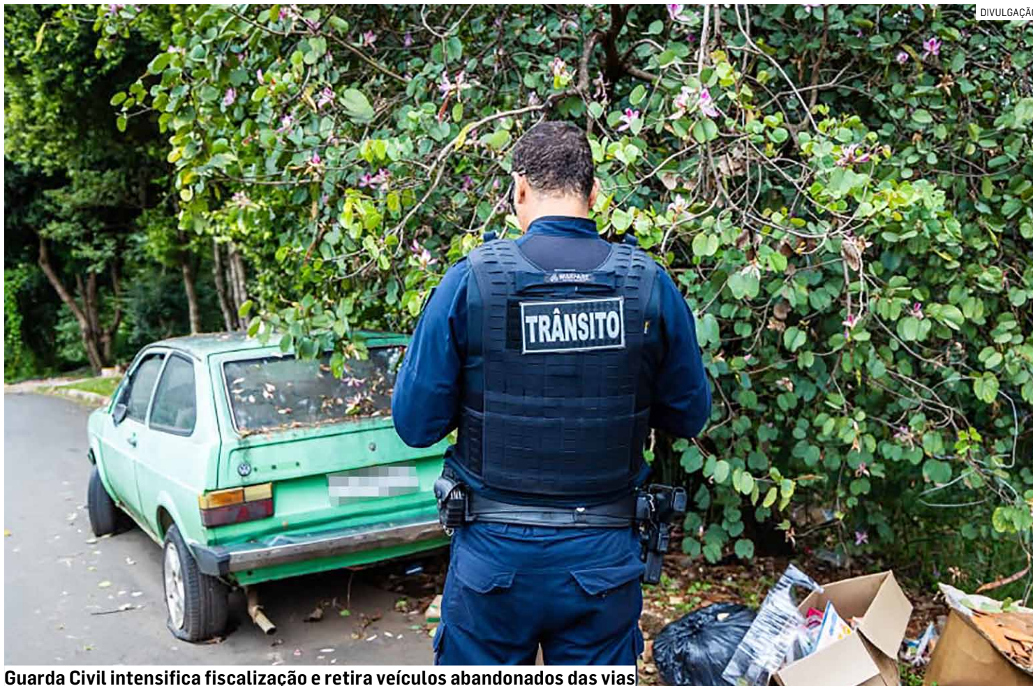
Guarda Civil intensifica fiscalização e retira veículos abandonados das vias

A retirada desses veículos é autorizada pelo artigo 279-A do Código de Trânsito Brasileiro (CTB), que permite ao órgão compe-