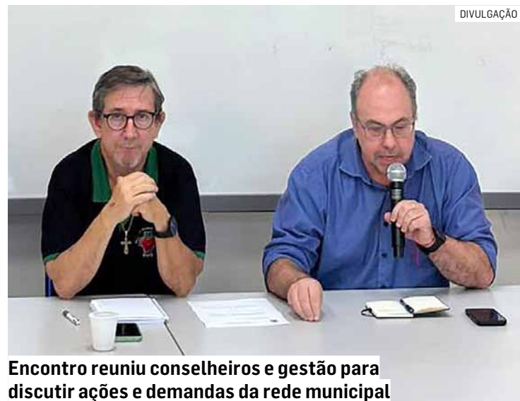
Encontro reuniu conselheiros e gestão para discutir ações e demandas da rede municipal

Da Redação • SUMARÉ tribunaliberal@tribunaliberal.com.br