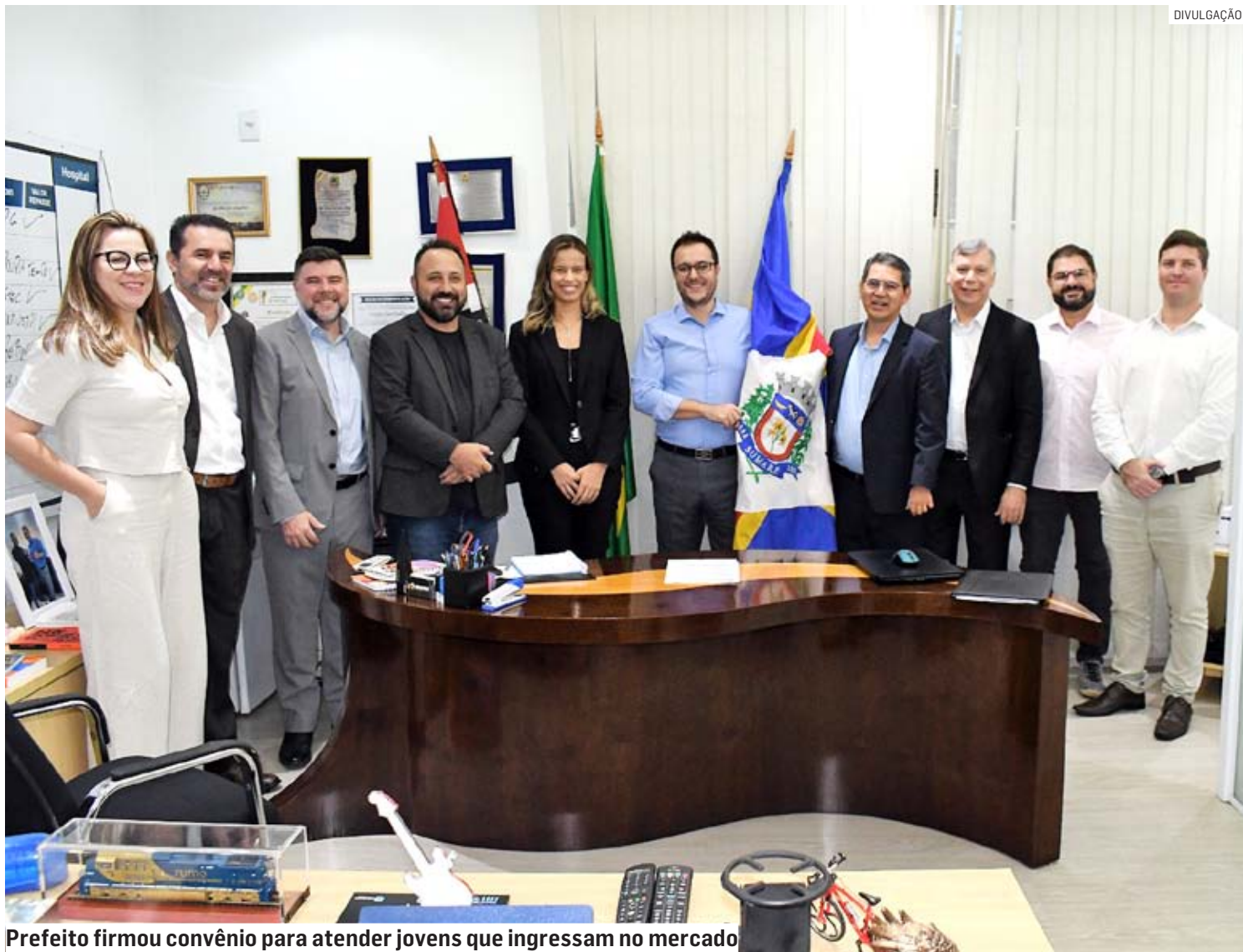
Prefeito firmou convênio para atender jovens que ingressam no mercado