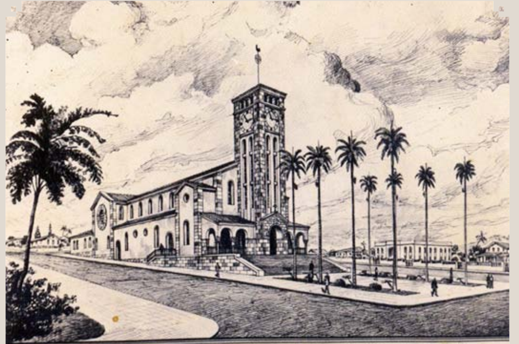
IGREJA MATRIZ DO SUMARÉ - CAMPINAS