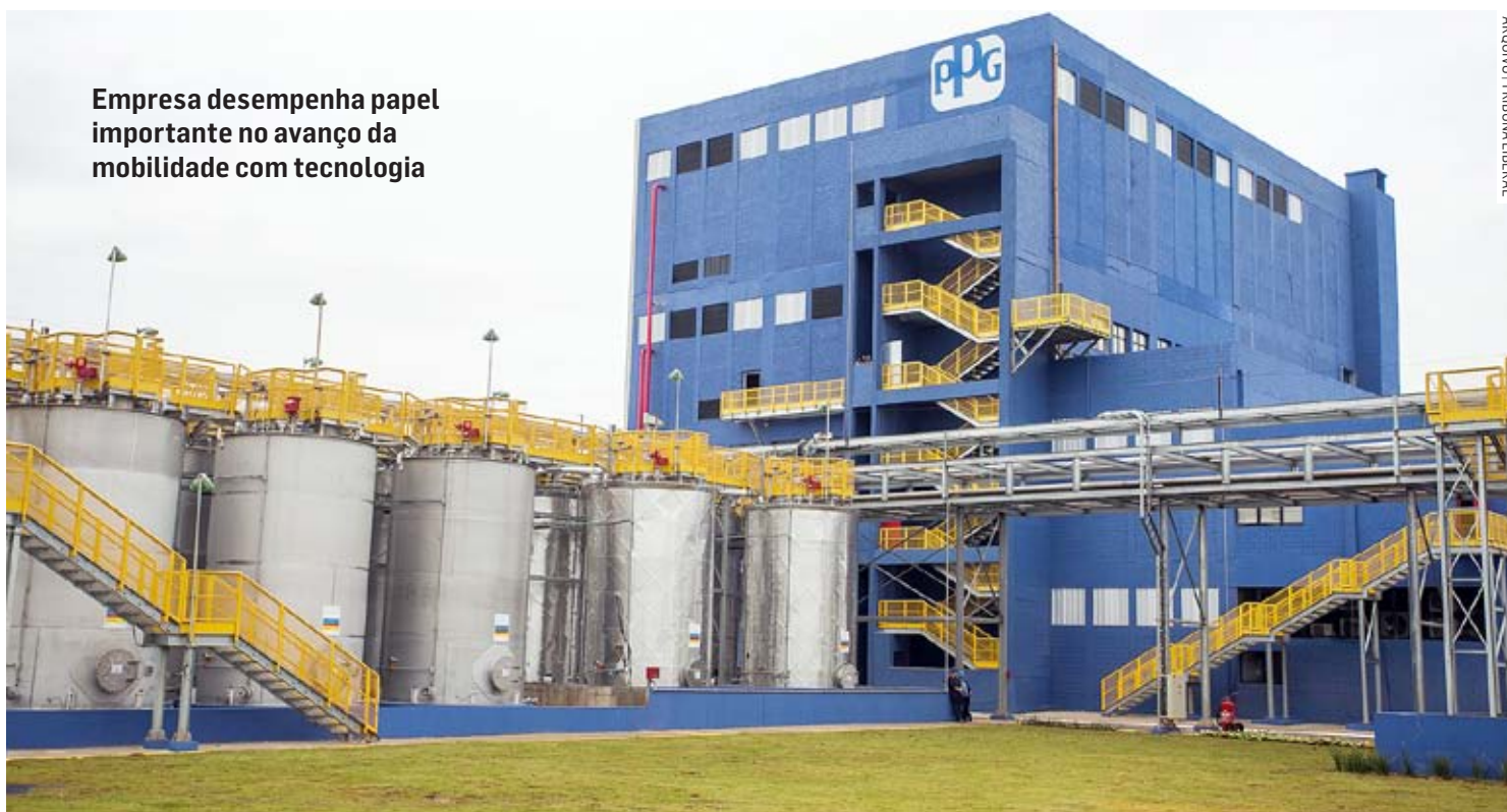
Empresa desempenha papel importante no avanço da mobilidade com tecnologia

Uma das soluções que a PPG tem apresentado ao mercado de BEV são os revestimentos funcionais para baterias, cujo objetivo é o de melhorar a segurança e o gerenciamento térmico destes equipamentos. A empresa lançou recentemente seu primeiro programa de produção para revestimentos de proteção contra incêndio de baterias (BFP) com Corachar®, linha de revestimentos intumescentes que permitem que os fabricantes automotivos possam revestir as tam-