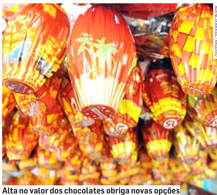
Alta no valor dos chocolates obriga novas opções

A uma semana da Páscoa, consumidores da região buscam alternativas mais baratas para substituir tradicionais alimentos da época, como o bacalhau e chocolates. É que os itens "queridinhos" desta temporada estão com preços 14,8% mais altos neste ano, conforme dados acumulados nos últimos 12 meses até fevereiro. A variação está acima do IPS que aumentou 14,2% no mesmo período.