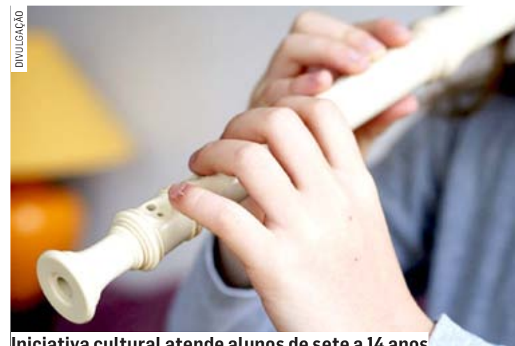
Iniciativa cultural atende alunos de sete a 14 anos

A realização é da Secretaria de Cultura e Economia Criativa do Estado de São Paulo, com produção da Sexteto Produções, via ProAc (Programa Ação Cultural), e apoio da Secretaria Municipal de Cultura de Sumaré.