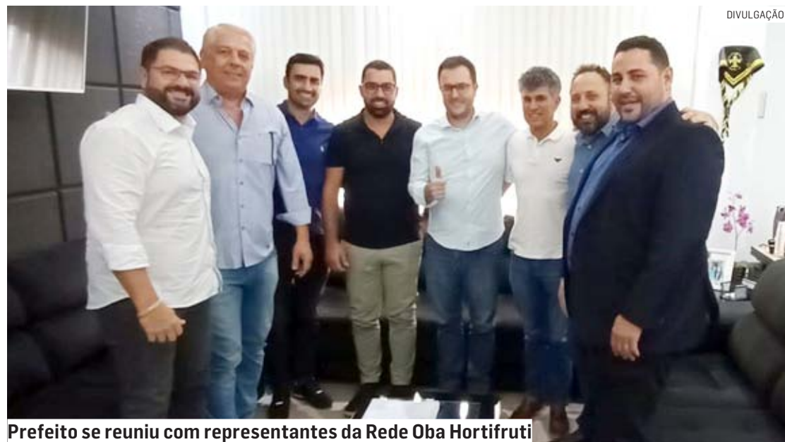
Prefeito se reuniu com representantes da Rede Oba Hortifruti

Paulo Medina | SUMARÉ paulo.medina@tribunaliberal.com.br