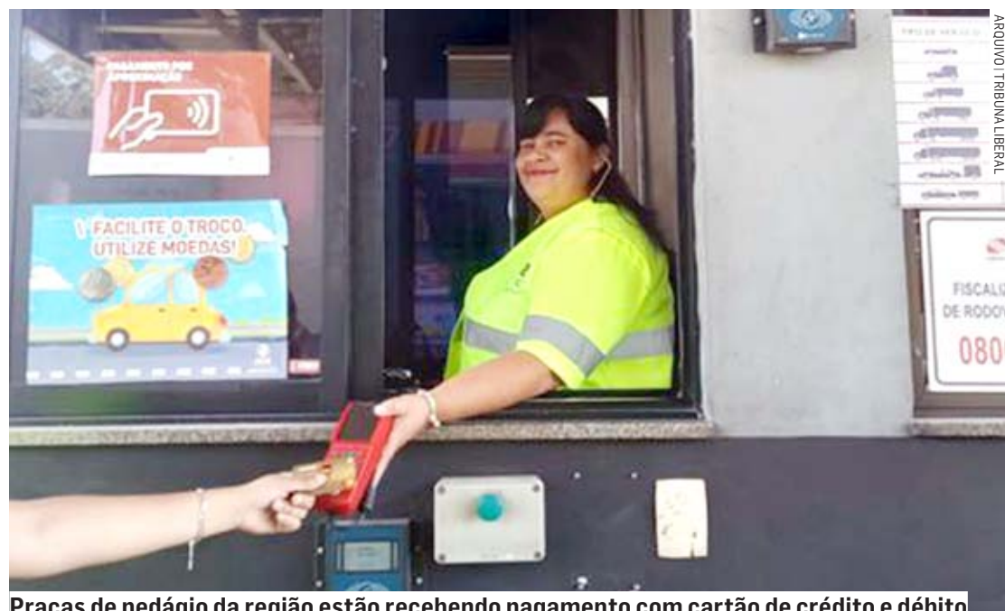
Praças de pedágio da região estão recebendo pagamento com cartão de crédito e débito

A Artesp informou que já está prevista a implan-