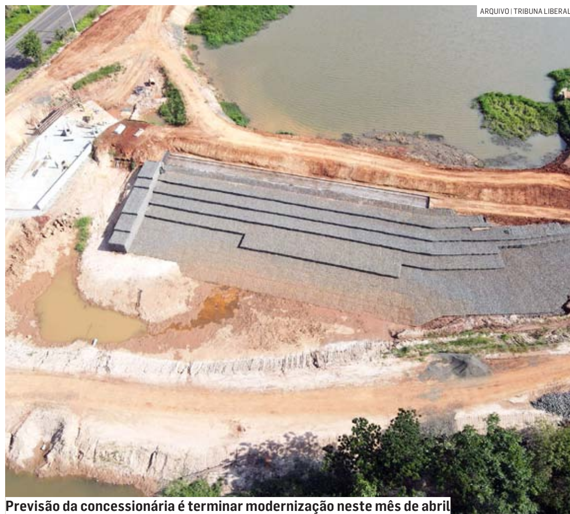
Previsão da concessionária é terminar modernização neste mês de abril

Em seguida, na terceira fase, que está com 15% dos serviços concluídos, serão instaladas as comportas, grades e as válvulas previstas no projeto, além da instrumen-