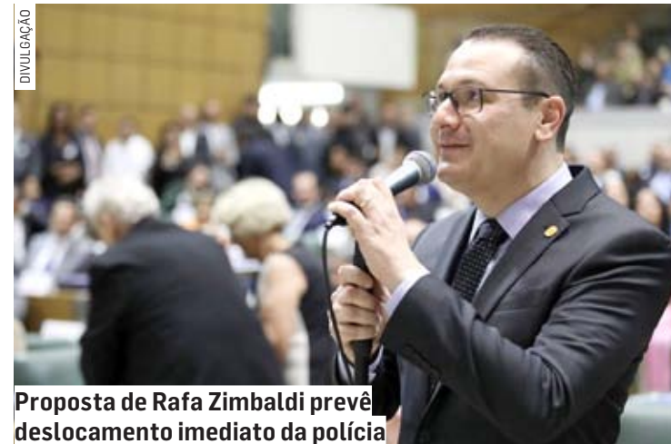
Proposta de Rafa Zimbaldi prevê deslocamento imediato da polícia

“O botão de pânico é uma medida simples e eficiente para permitir o contato direto entre a escola e a polícia local em casos de emergência, garantin-