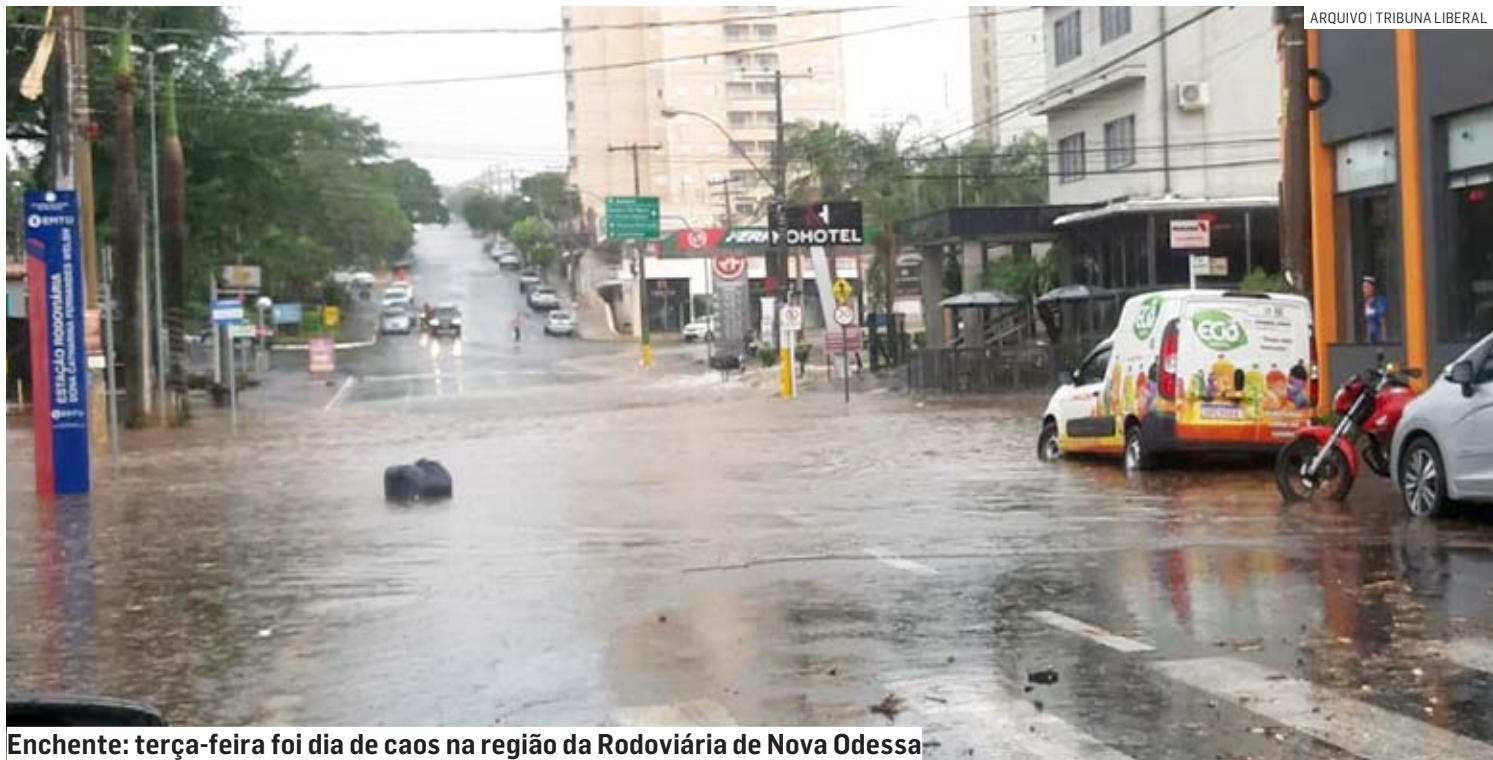
Enchente: terça-feira foi dia de caos na região da Rodoviária de Nova Odessa

vias, motoristas ainda chegaram a transitar pela contramão da avenida Ampelio Gazzetta, que teve trechos prejudicados. Motoristas se arriscaram enfrentando o grande volume de água. As regiões alagadas são cortadas por córregos com o Palmital e Capuava, além do Ribeirão Quilombo.