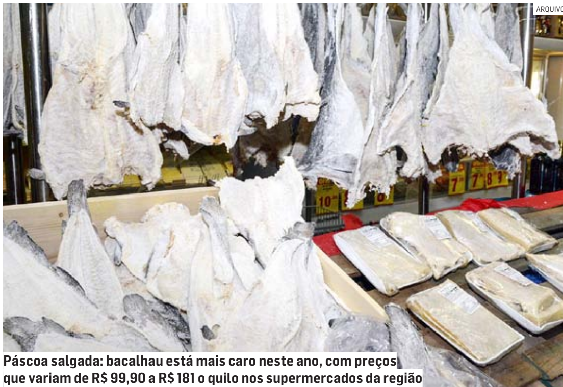
Páscoa salgada: bacalhau está mais caro neste ano, com preços que variam de R$ 99,90 a R$ 181 o quilo nos supermercados da região

O levantamento aponta que o bacalhau - prato tradicional e tão requisitado pelas famílias brasileiras para o feriado da Sexta-feira Santa -, apresenta um aumento de 7,4% nos últimos 12 meses. Esse tipo de peixe é o grande vilão entre as