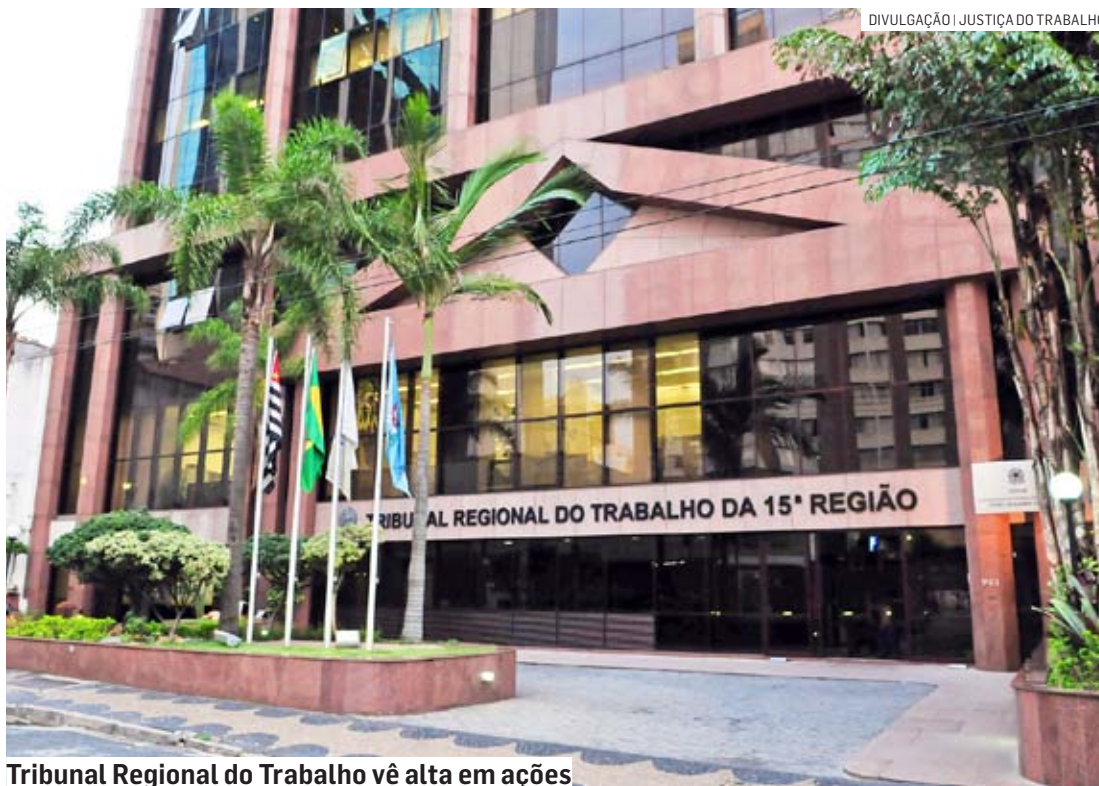
Tribunal Regional do Trabalho vê alta em ações

A lei, que completou seis meses no último dia 23 de março, estabelece que a empresa deve criar procedimentos, além de