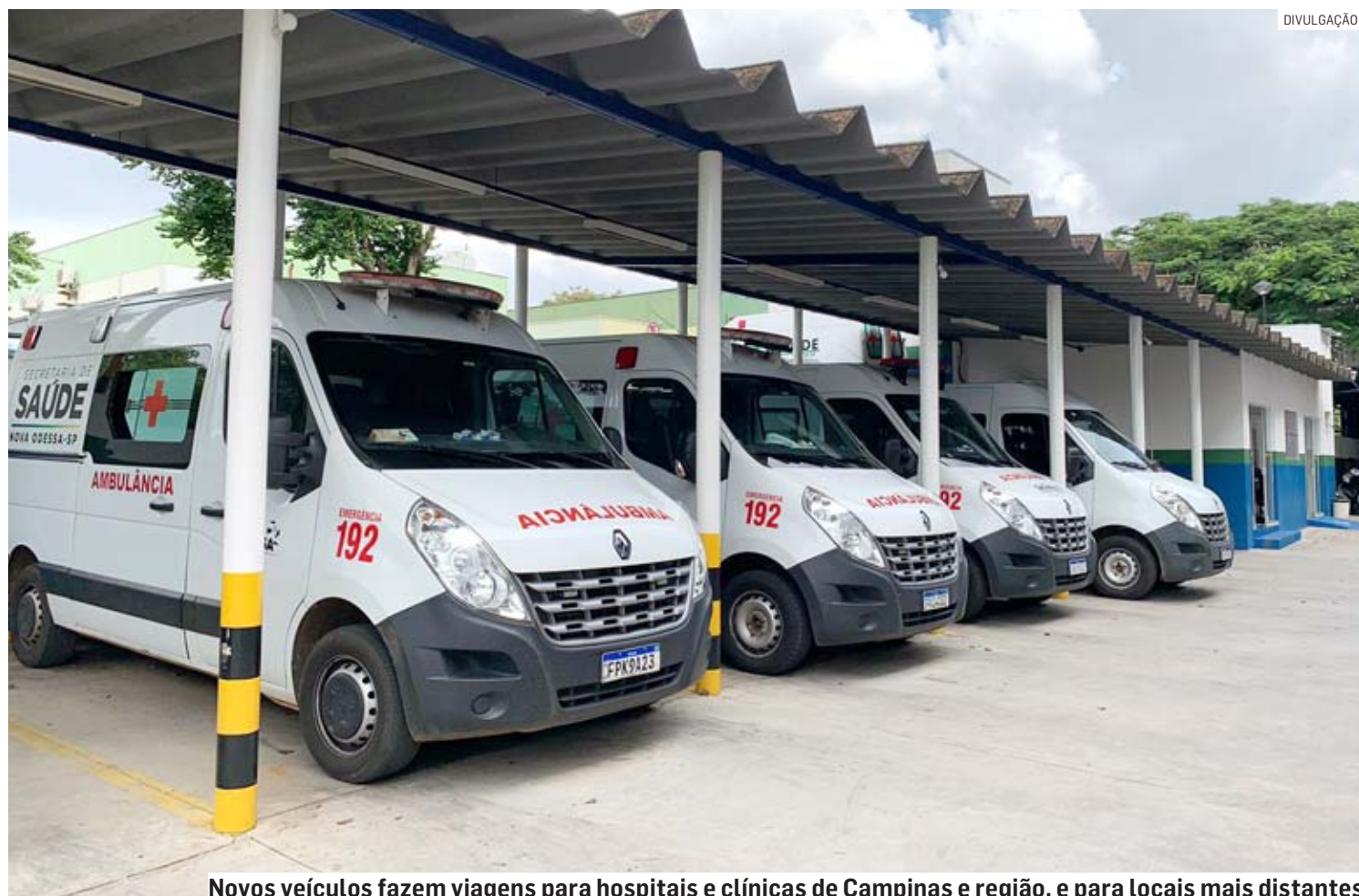
Novos veículos fazem viagens para hospitais e clínicas de Campinas e região, e para locais mais distantes

Atualmente, a frota do setor conta com cinco ambulâncias zero-quilômetro para a Central 192, além de micro-ônibus, três vans (uma delas adaptadas para o transporte de pacientes