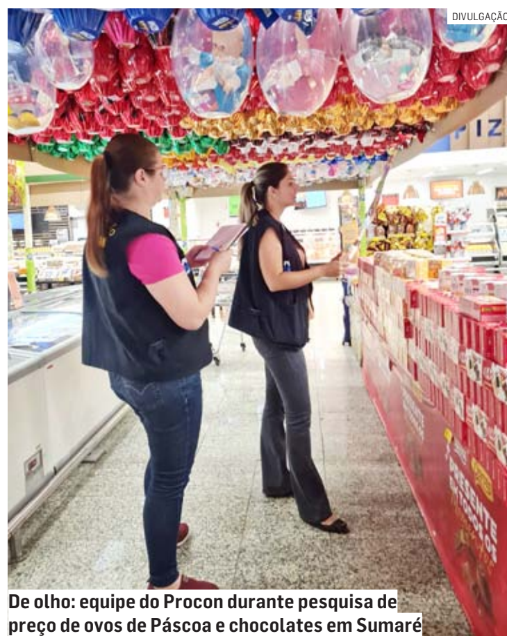
De olho: equipe do Procon durante pesquisa de preço de ovos de Páscoa e chocolates em Sumaré

“Os preços praticados atualmente podem ser