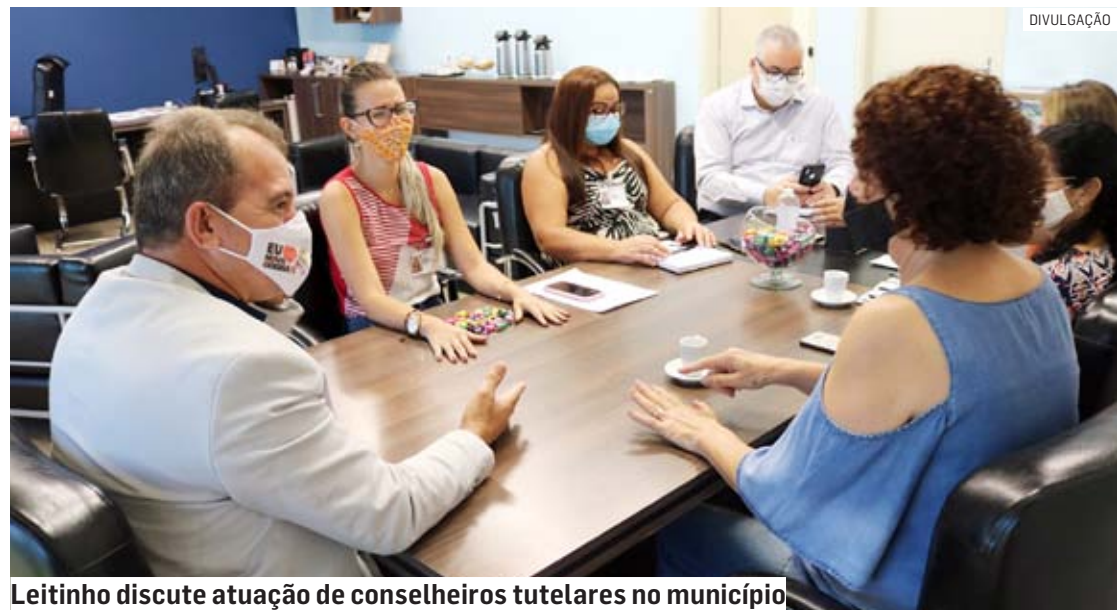
Leitinho discute atuação de conselheiros tutelares no município

Da Redação | NOVA ODESSA tribunaliberal@tribunaliberal.com.br