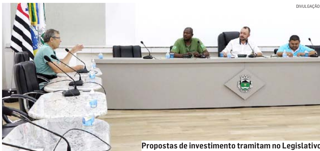
Propostas de investimento tramitam no Legislativo

Da Redação | MONTE MOR tribunaliberal@tribunaliberal.com.br