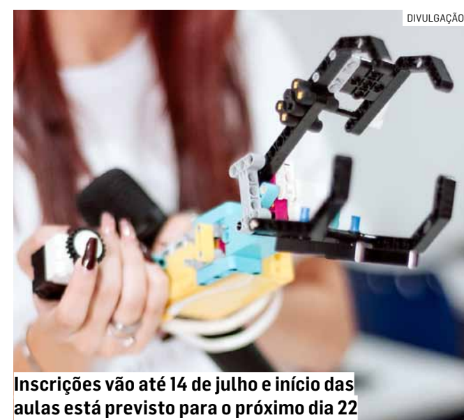
Inscrições vão até 14 de julho e início das aulas está previsto para o próximo dia 22

As aulas serão realizadas na Avenida da Amizade, 2869, no Parque Virgílio Viel, em Sumaré. Os participantes poderão escolher entre duas turmas no período noturno: a primeira terá aulas às segundas e quartas-feiras, das 19h às 21h, enquanto a segunda será às terças e quintas-feiras, no mesmo horário.