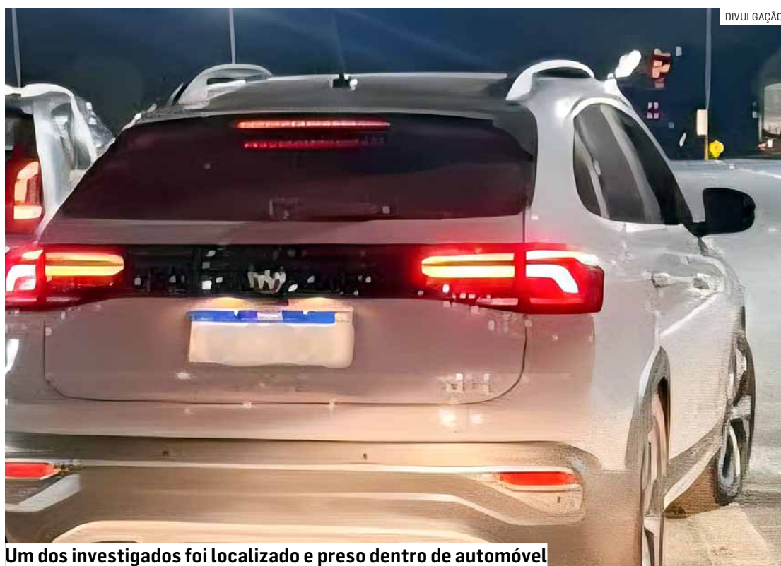
Um dos investigados foi localizado e preso dentro de automóvel

Conforme o relato policial, a abordagem evoluiu para um confronto físico, quando os suspeitos passaram a resistir e tentaram desarmar um dos policiais. Em seguida, a dupla se separou: um fugiu correndo,