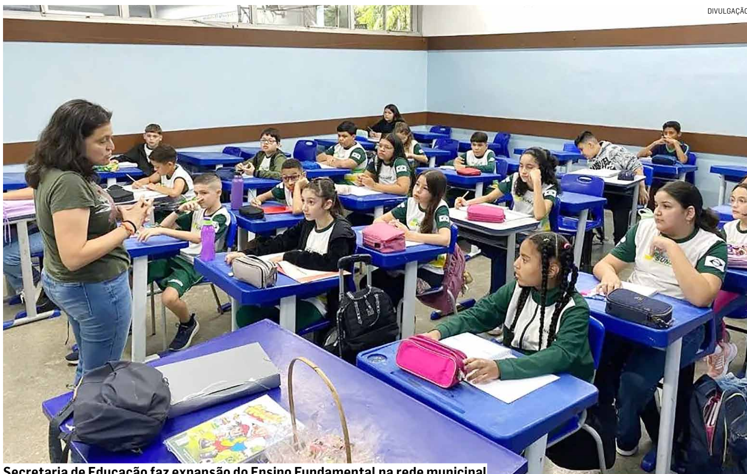
Secretaria de Educação faz expansão do Ensino Fundamental na rede municipal

Segundo o documento, a implantação ocorre de forma gradual. Inicialmente são abertas turmas de 6º ano e, nos anos seguintes, a ex-