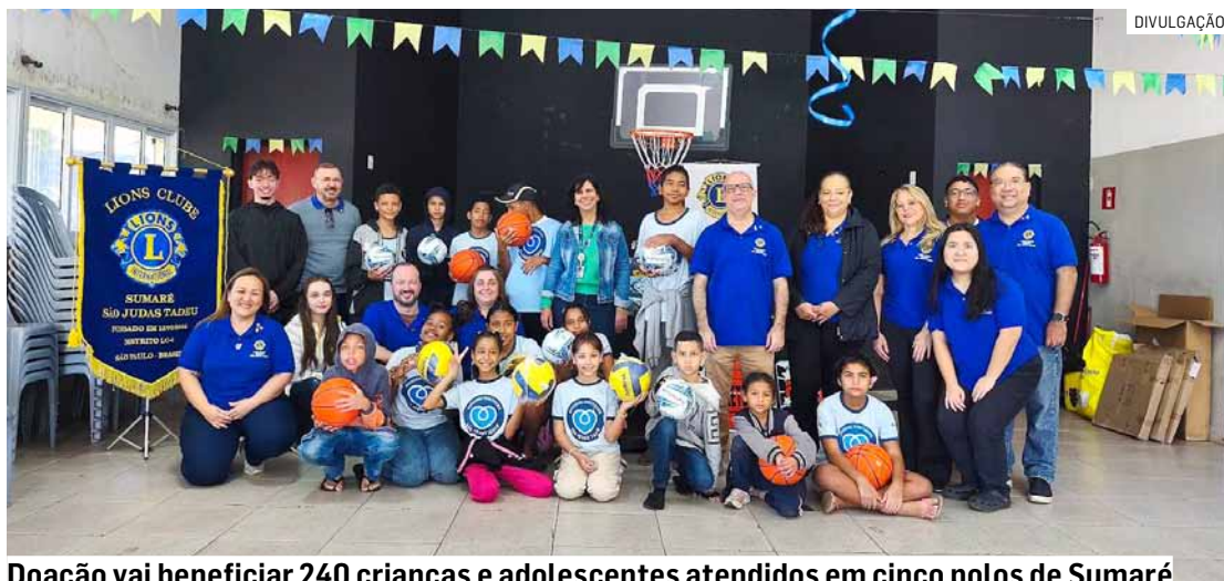
Doação vai beneficiar 240 crianças e adolescentes atendidos em cinco polos de Sumaré

A ação foi viabilizada por meio do Subsídio DCG (Subsídio para o Impacto de Distritos e Clubes