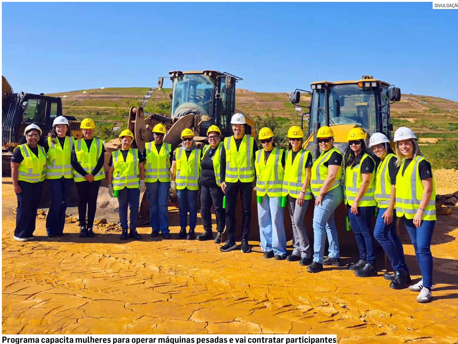
Programa capacita mulheres para operar máquinas pesadas e vai contratar participantes

As aulas do projeto são realizadas nos próprios ecoparques ao longo de cinco sábados, das 8h às 17h, entre os dias 20/6 e 18/7. São ministradas por professores da escola “3X MAIS UP”, voltada para treinamentos para operadores de máquinas pesadas e agrícolas no Brasil.