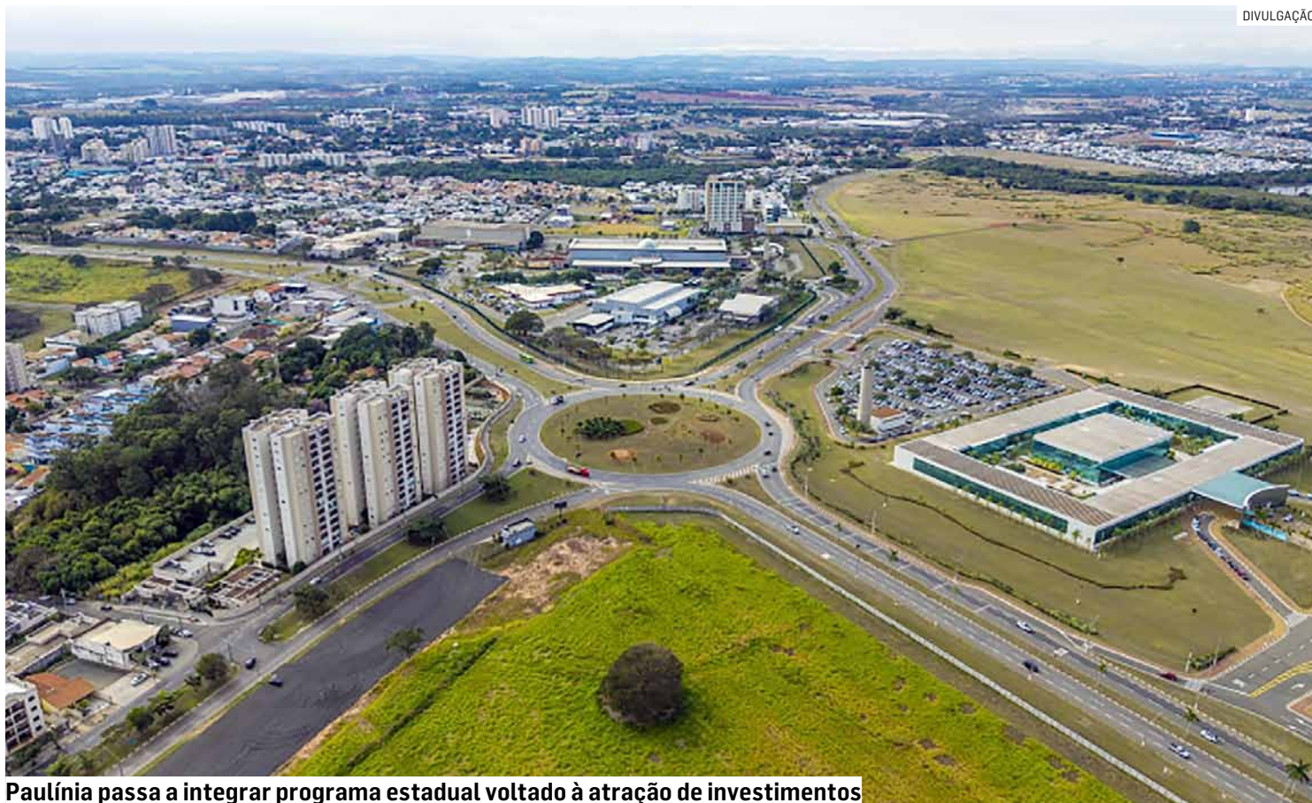
Paulínia passa a integrar programa estadual voltado à atração de investimentos

Segundo a prefeitura, o programa também pretende tornar a cidade ainda mais atrativa para investi-