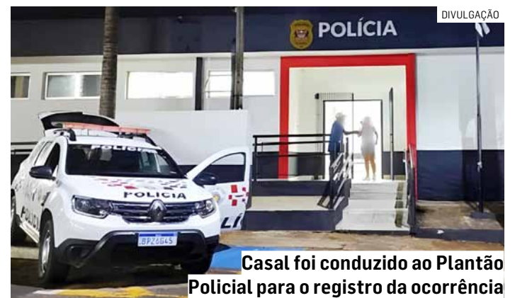
Casal foi conduzido ao Plantão Policial para o registro da ocorrência

Em seguida, o casal foi conduzido ao Plantão Policial para o registro da ocorrência. Após a análise dos fatos pela autoridade policial, o homem permaneceu preso e ficou à disposição da Justiça.