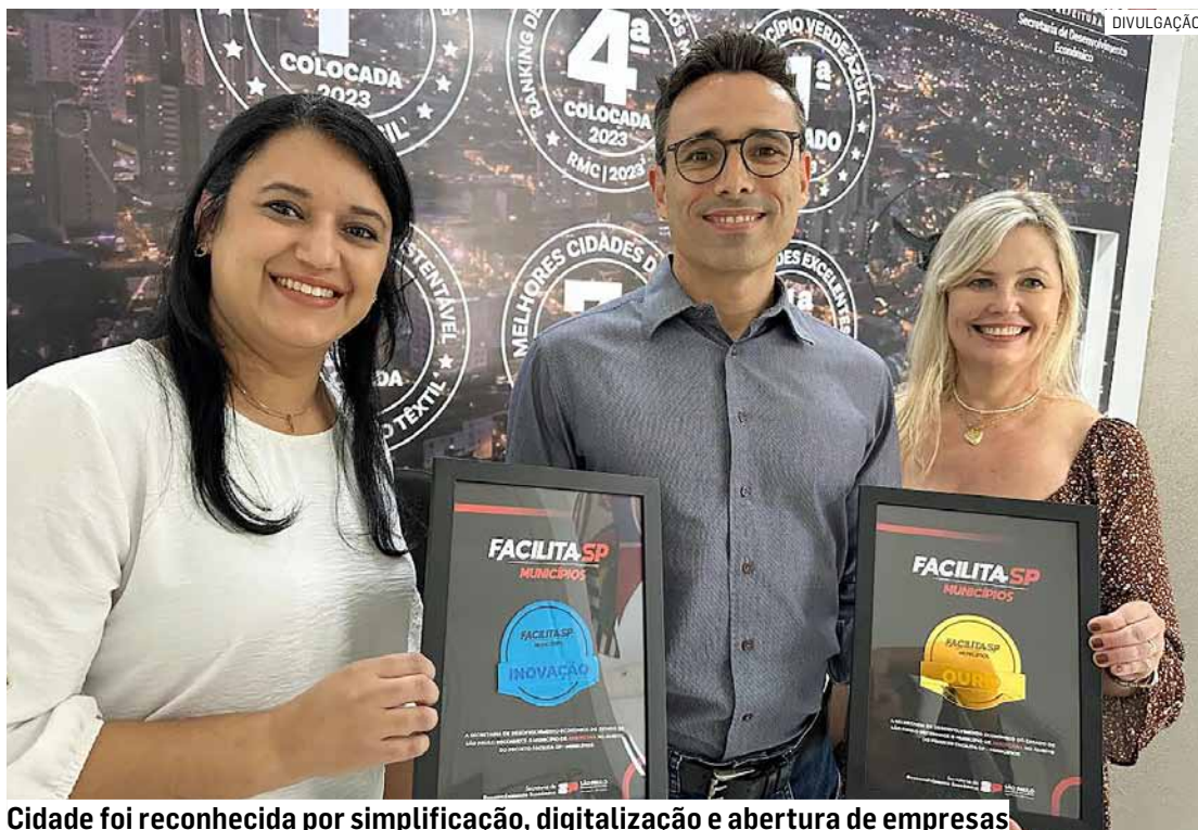
Cidade foi reconhecida por simplificação, digitalização e abertura de empresas

Americana aderiu ao Facilita SP em 2024. O programa estadual incentiva, em parceria com os municípios, a moder-