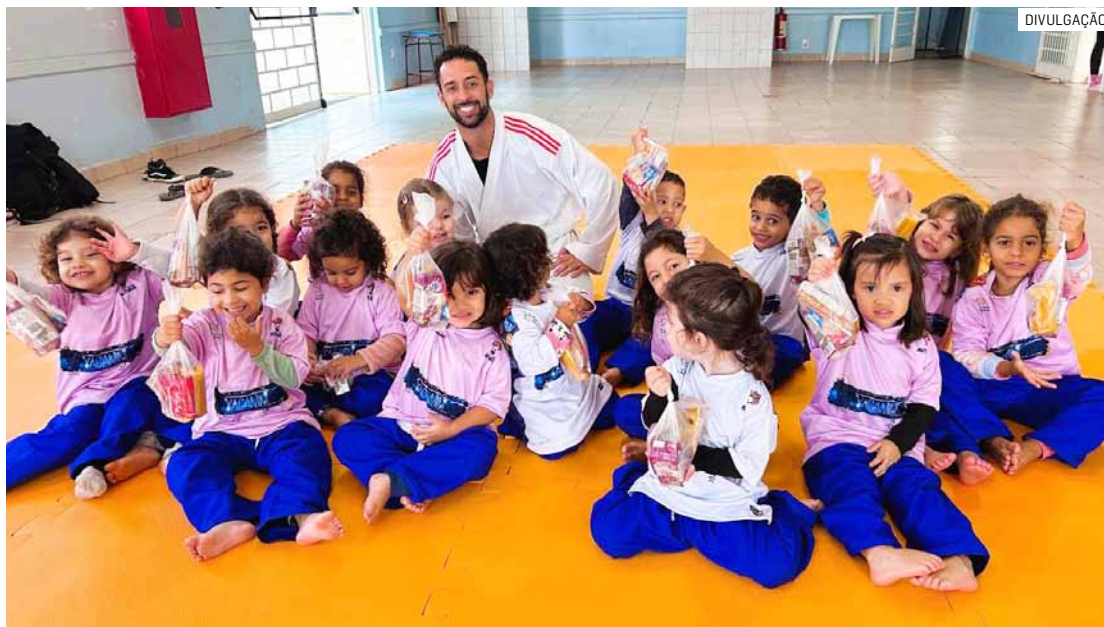
Evento gratuito celebra os 14 meses de projeto e soma 200 participantes em Sumaré

“O Projeto YACAMIN é uma iniciativa esportiva educacional idealizada pelo Instituto AVIVAR 3º SETOR para ampliar o acesso ao esporte nas periferias de Sumaré, garantindo um direito fundamental de crianças e adolescentes previsto