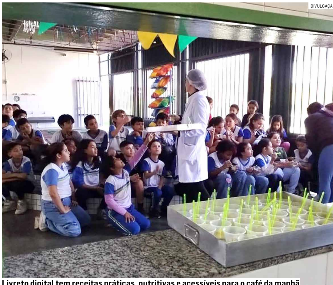
Livreto digital tem receitas práticas, nutritivas e acessíveis para o café da manhã

Alunos da rede municipal de ensino de Nova Odessa continuam recebendo ações voltadas à promoção da saúde, educação nutricional e alimentação adequada. Os trabalhos são desenvolvidos pelo setor de Alimentação Escolar da Secretaria de Educação. As últimas atividades, antes do encerramento do primeiro semestre letivo, ocorreram nas EMEBs Alzira Ferreira Delegá e Maria Cecília Borriero Milani. O projeto “Educação Alimentar que Transforma” contou com Oficina Culinária e a criação de um e-book, visando incentivar escolhas alimentares mais saudáveis, além de valorizar a participação das crianças