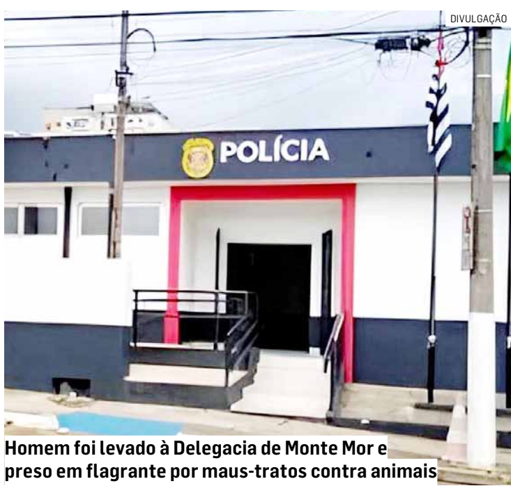
Homem foi levado à Delegacia de Monte Mor e preso em flagrante por maus-tratos contra animais