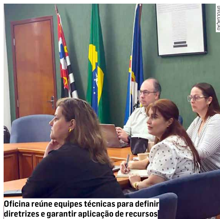
Oficina reúne equipes técnicas para definir diretrizes e garantir aplicação de recursos