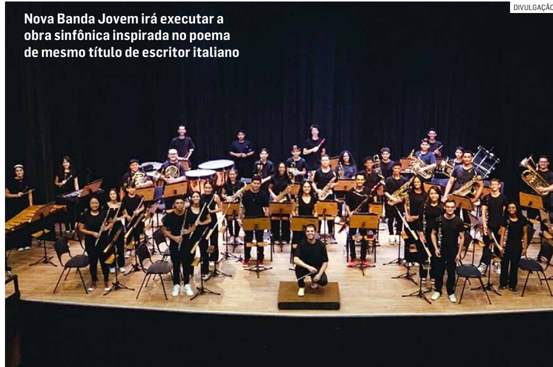
Nova Banda Jovem irá executar a obra sinfônica inspirada no poema de mesmo título de escritor italiano