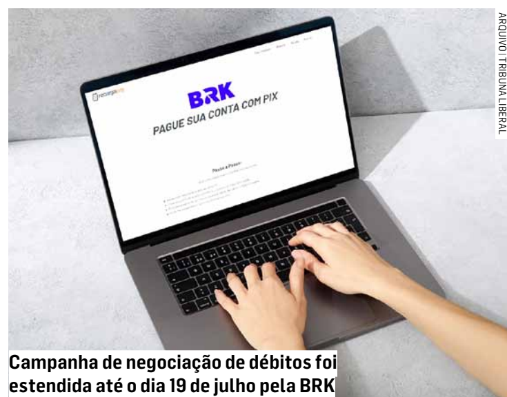
Campanha de negociação de débitos foi estendida até o dia 19 de julho pela BRK