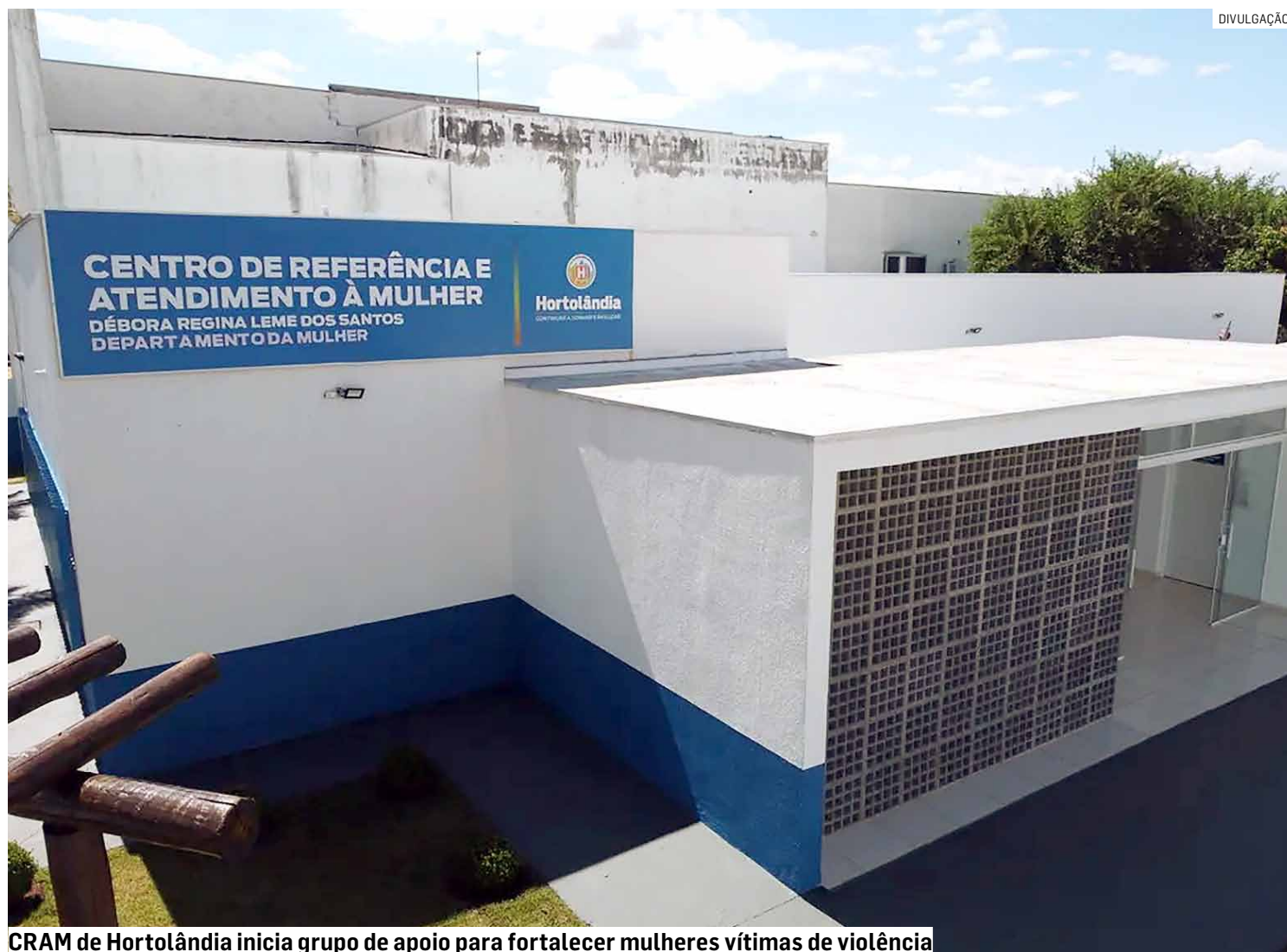
CRAM de Hortolândia inicia grupo de apoio para fortalecer mulheres vítimas de violência

Ação reúne mulheres atendidas pelo Cram em encontros quinzenais com psicólogas e equipe multidisciplinar para autoestima, acolhimento, ampliar autonomia e romper o ciclo da violência; atendimento é feito durante semana