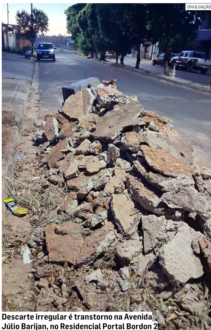
Descarte irregular é transtorno na Avenida Júlio Barijan, no Residencial Portal Bordon 2

Além da sujeira, o morador afirma que os resíduos estão prejudicando a passagem da água pela via, o que pode agravar problemas de drenagem em períodos de chuva. Ele também relata preocupação com o aumento da presença de insetos e possí-