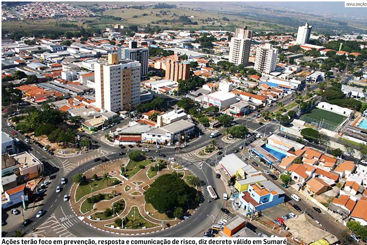
Ações terão foco em prevenção, resposta e comunicação de risco, diz decreto válido em Sumaré

Entre as principais ações anunciadas está a criação da Brigada Municipal de Prevenção e Combate a Incêndios em Cobertura Vegetal, formada especialmente por agentes da Defesa Civil. A equi-