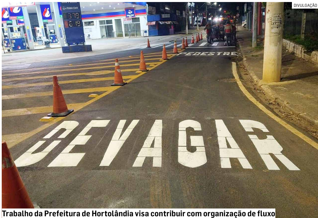
Trabalho da Prefeitura de Hortolândia visa contribuir com organização de fluxo