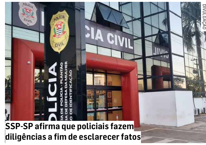
SSP-SP afirma que policiais fazem diligências a fim de esclarecer fatos

A reportagem tentou, mas não conseguiu contato com a clínica até a publicação desta matéria.