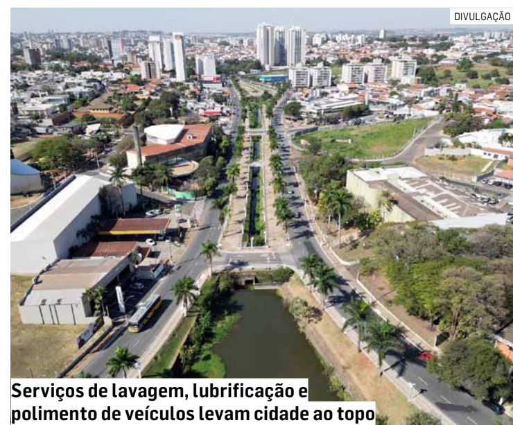
Serviços de lavagem, lubrificação e polimento de veículos levam cidade ao topo