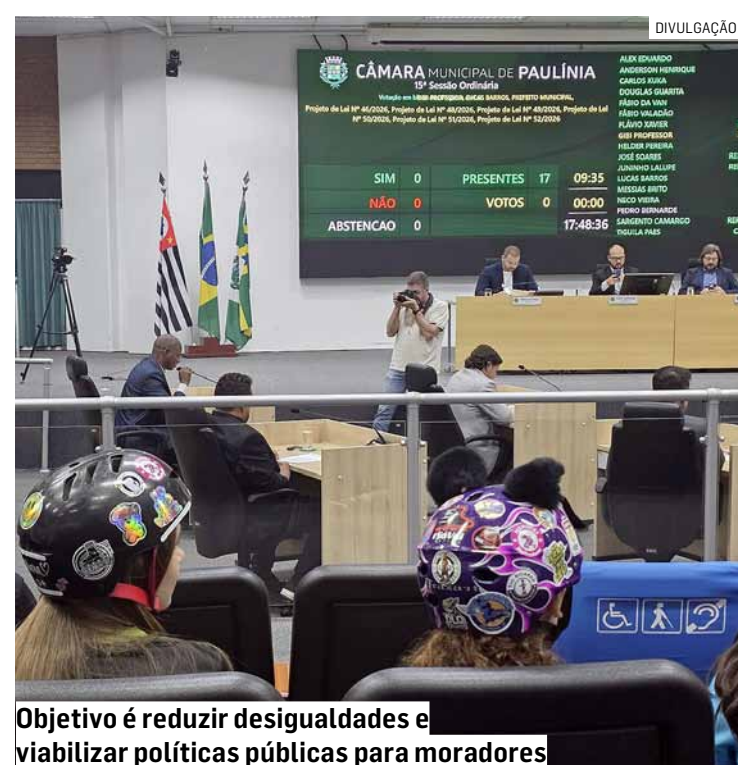
Objetivo é reduzir desigualdades e viabilizar políticas públicas para moradores