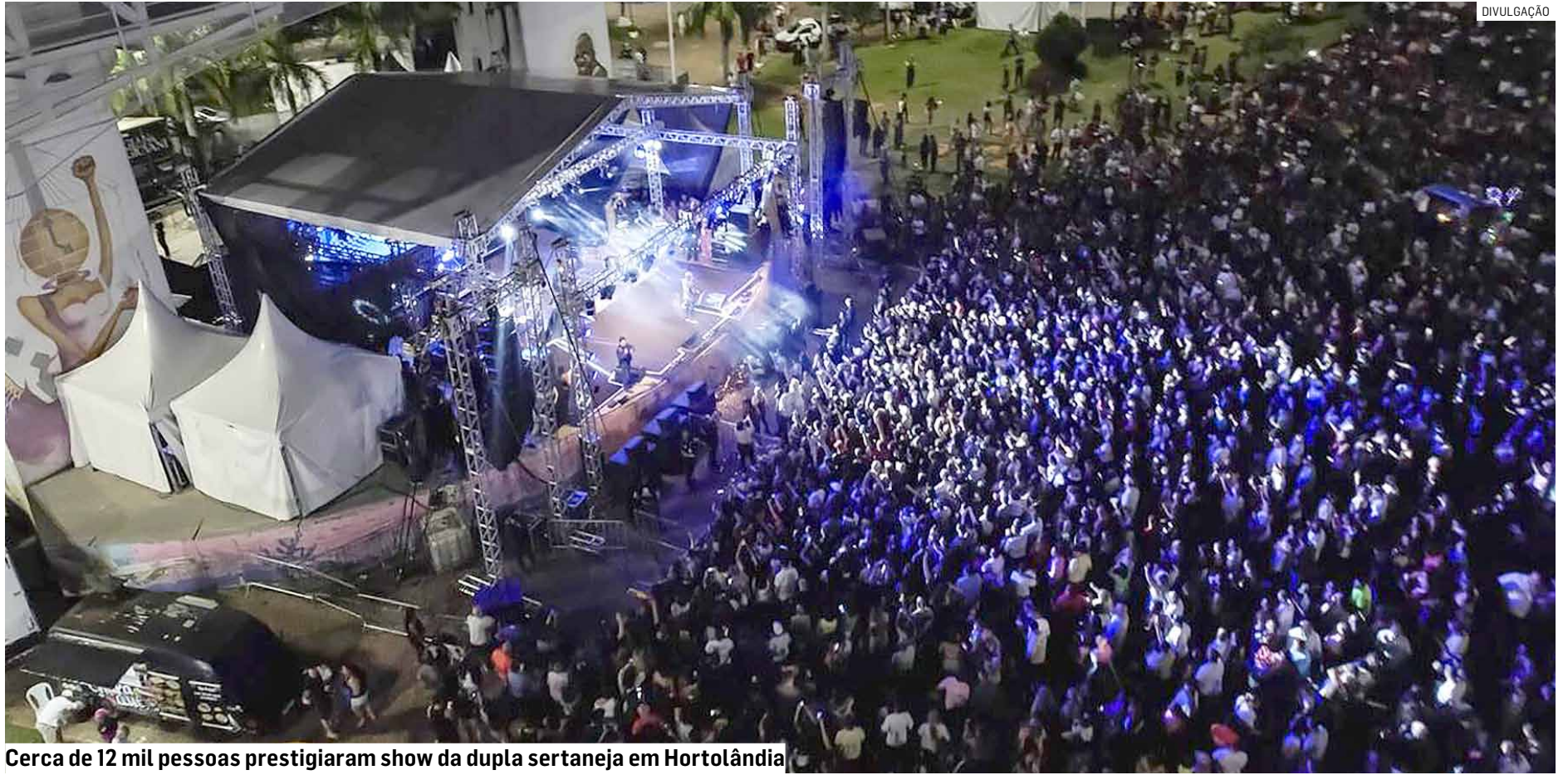
Cerca de 12 mil pessoas prestigiaram show da dupla sertaneja em Hortolândia