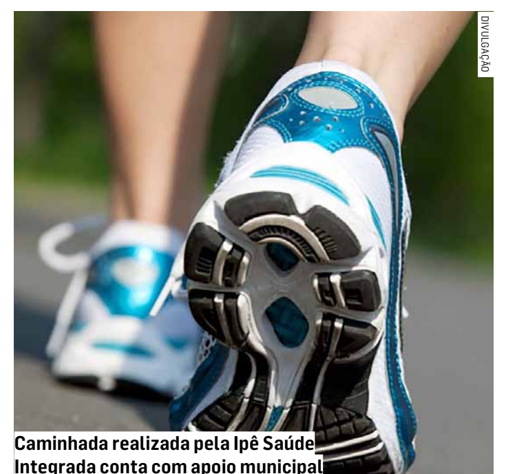
Caminhada realizada pela Ipê Saúde Integrada conta com apoio municipal

A Prefeitura de Monte Mor destacou que apoiar ações esportivas e de promoção à saúde também é uma forma de fortalecer o convívio social, incentivar o cuidado com o bem-estar e valorizar momentos de integração entre as famílias da cidade.