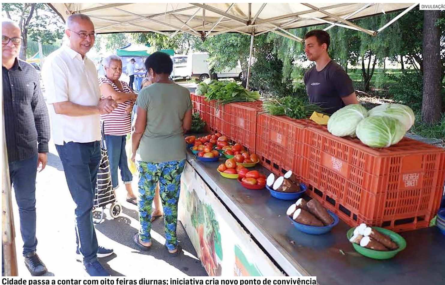
Cidade passa a contar com oito feiras diurnas; iniciativa cria novo ponto de convivência

“Muito além de um espaço de compras, a nova feira nasce como resposta a uma antiga reivindicação da população do Jardim Adelaide. Agora, moradores da região passam a