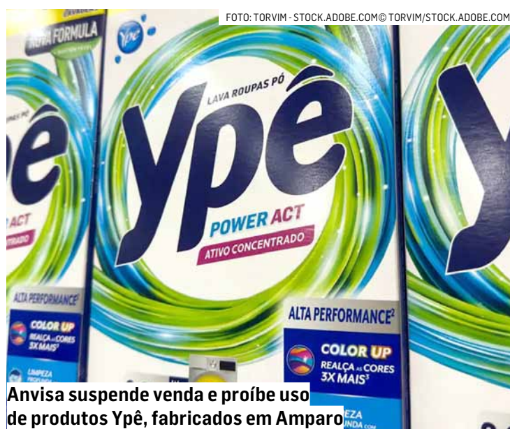
Anvisa suspende venda e proíbe uso de produtos Ypê, fabricados em Amparo

“Foram constatados descumprimentos relevantes em etapas críticas da produ-