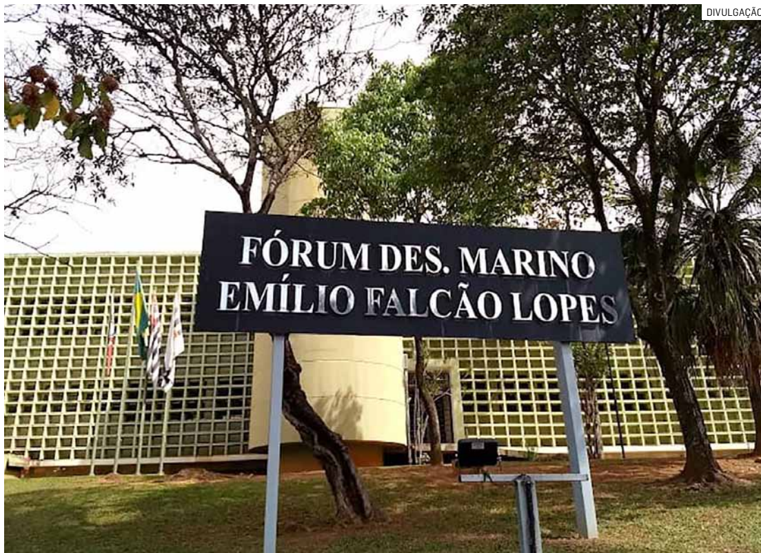
Motorista alcoolizado e até dona de veículo foram condenados por danos morais e estéticos

As duas vítimas tiveram ferimentos graves e passaram por cirurgia. O condutor da motocicleta sofreu fraturas no fêmur e na tí-