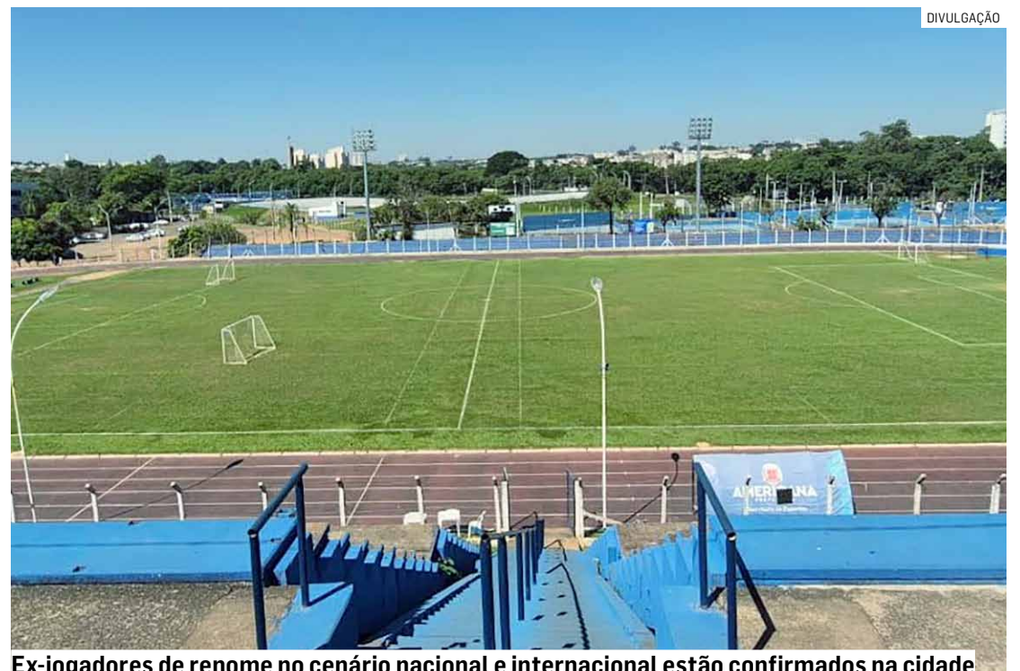
Ex-jogadores de renome no cenário nacional e internacional estão confirmados na cidade

“Trazer grandes nomes do futebol para Americana é também uma forma de valorizar a cidade e inspirar os jovens atletas. Muitos desses jogadores são referências dentro e fora de campo, e estar próximo