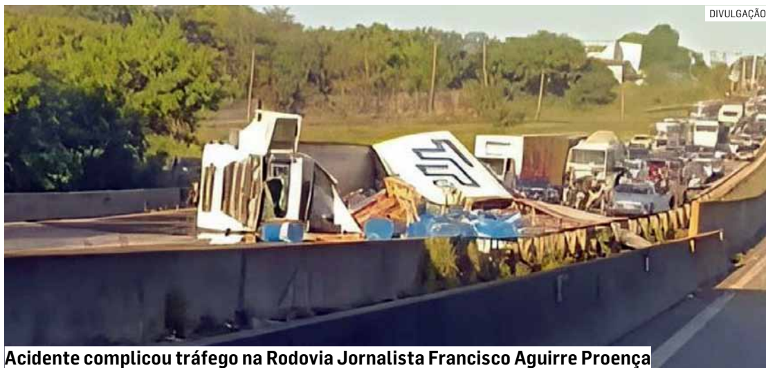
Acidente complicou tráfego na Rodovia Jornalista Francisco Aguirre Proença

Cézar Oliveira • HORTOLÂNDIA tribunaliberal@tribunaliberal.com.br