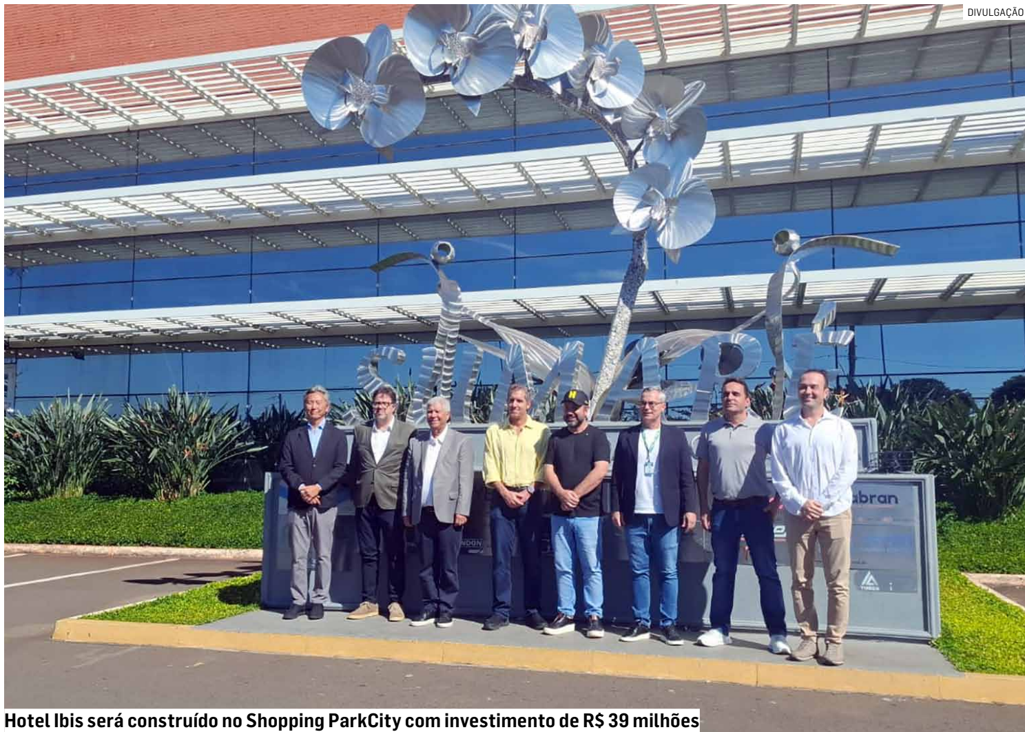
Hotel Ibis será construído no Shopping ParkCity com investimento de R$ 39 milhões

Além da expansão da rede hoteleira, o empreendi-