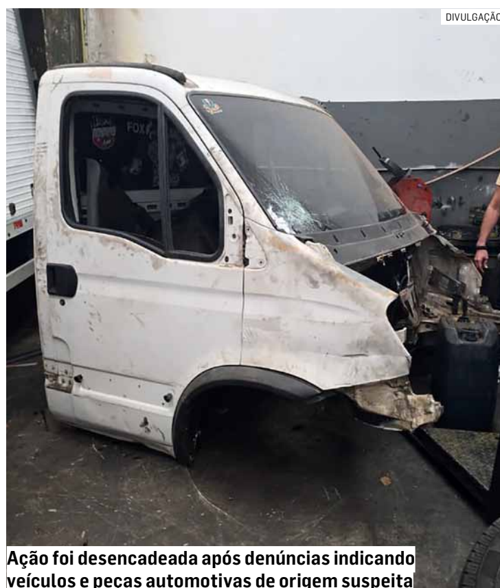
Ação foi desencadeada após denúncias indicando veículos e peças automotivas de origem suspeita

O responsável pelo local, identificado pelas iniciais W.A.G., foi conduzido à sede da DIG de Americana, onde foi autuado em flagrante por recepta-