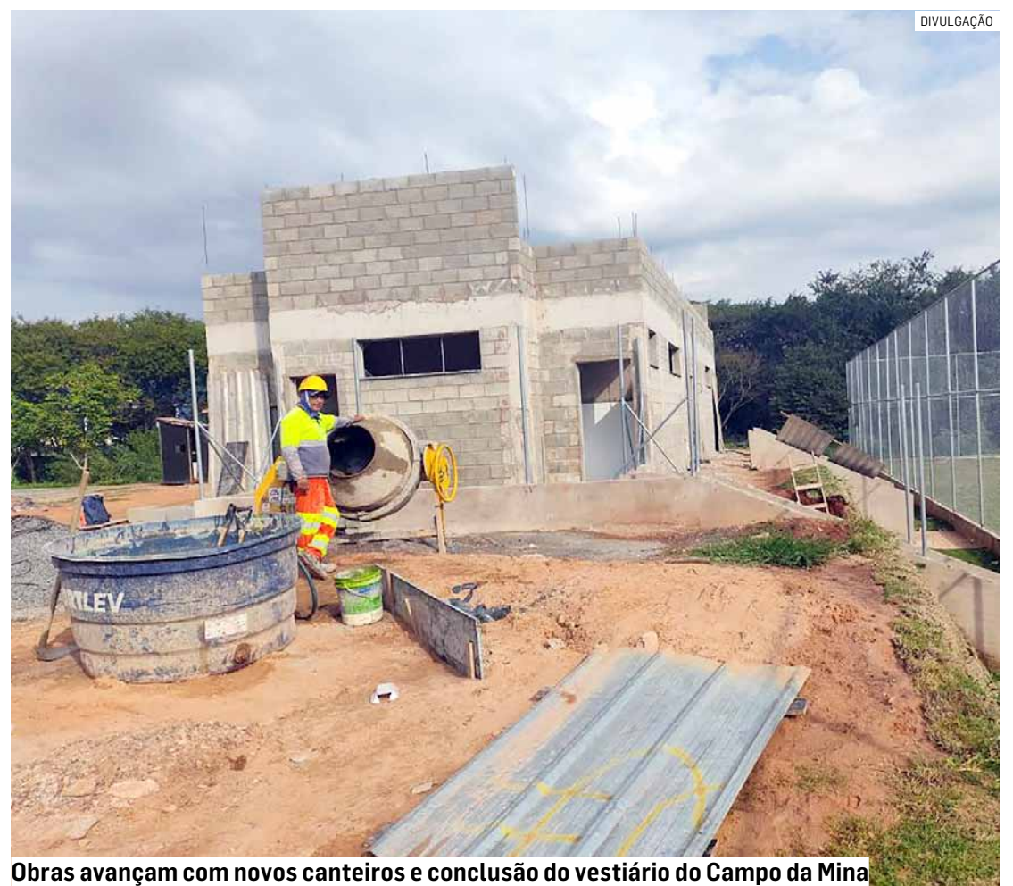
Obras avançam com novos canteiros e conclusão do vestiário do Campo da Mina

Com o avanço de mais intervenções, que incluem também obras de um vertedouro d'água na segunda lagoa, espaços de convívio e bicicletários, o parque terá área de 385.000 metros quadrados e será a maior área de lazer da cidade.