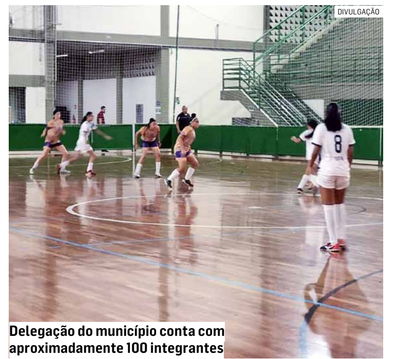
Delegação do município conta com aproximadamente 100 integrantes