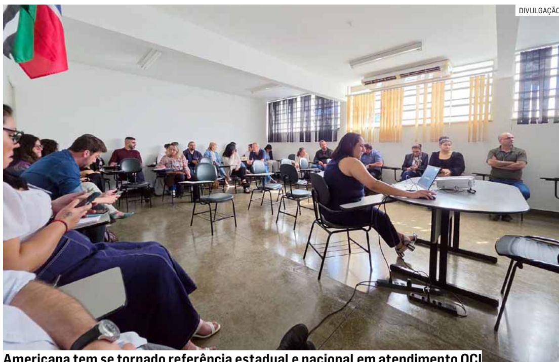
Americana tem se tornado referência estadual e nacional em atendimento OCI

A Secretaria Municipal de Saúde de Americana recebeu a visita de representantes das secretarias do setor de Bragança Paulista, Jundiá e Itatiba. O encontro teve como finalidade apresentar o trabalho desenvolvido no município e as experiências bem-sucedidas na implementação da OCI (Oferta de Cuidados Integrados), promovendo a troca de conhecimentos, o alinhamento de práticas e o fortalecimento das políticas voltadas à qualidade do atendimento à população.