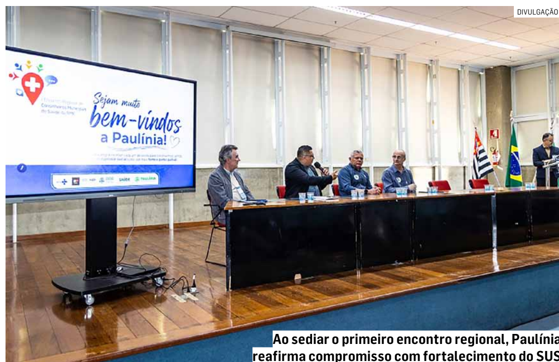
Ao sediar o primeiro encontro regional, Paulínia reafirma compromisso com fortalecimento do SUS

O encontro promoveu a troca de experiências entre gestores, conselheiros e especialistas, reforçando a importância da atuação dos conselhos municipais na fiscalização, no planejamento e na transparência das políticas públicas de saúde.