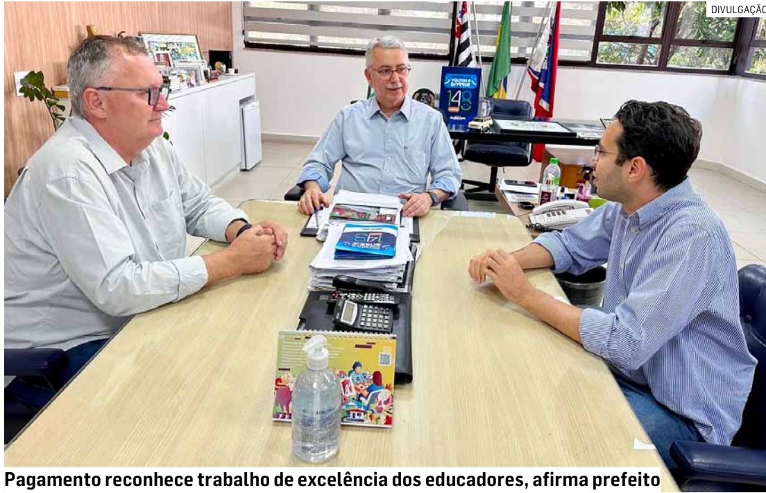
Pagamento reconhece trabalho de excelência dos educadores, afirma prefeito

A Prefeitura de Americana fez o pagamento da diferença salarial referente ao reajuste do Piso Salarial Profissional Nacional do Magistério Público da Educação Básica, que em 2026 passou de R$ 4.867,77 para R$ 5.130,63 para a jornada de 40 horas. Ao todo, 339 profissionais da rede municipal de Educação de Americana foram contemplados. O montante pago na folha de pagamento referente a junho chegou a R$ 117.290,02.