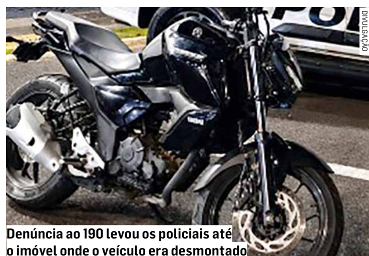
Denúncia ao 190 levou os policiais até o imóvel onde o veículo era desmontado

Após a análise do caso, a autoridade policial ratificou a prisão em flagrante dos dois adultos pelos crimes de receptação e corrupção de menores. Os adolescentes foram ouvidos e liberados. Os dois presos permaneceram à disposição da Justiça.