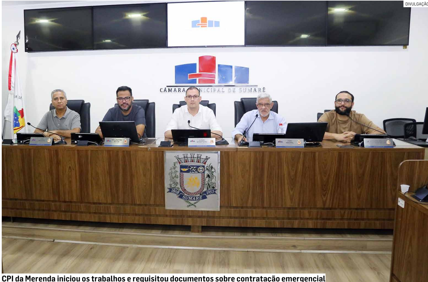
CPI da Merenda iniciou os trabalhos e requisitou documentos sobre contratação emergencial