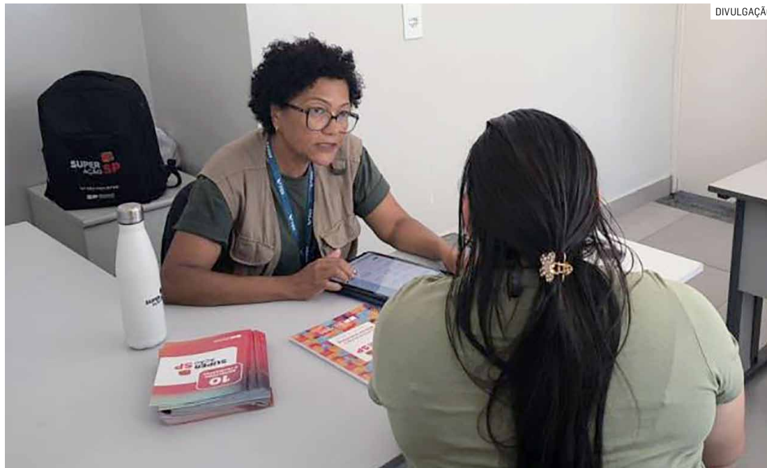
Município integra programa estadual que une políticas públicas e oferece plano personalizado

Em Nova Odessa, os trabalhos estão sendo executados desde maio, em parceria com a Diretoria de Promoção Social. Um dos diferenciais do programa está no acompanhamento personalizado das famílias. Por meio de um convênio com a Fundação Getú-