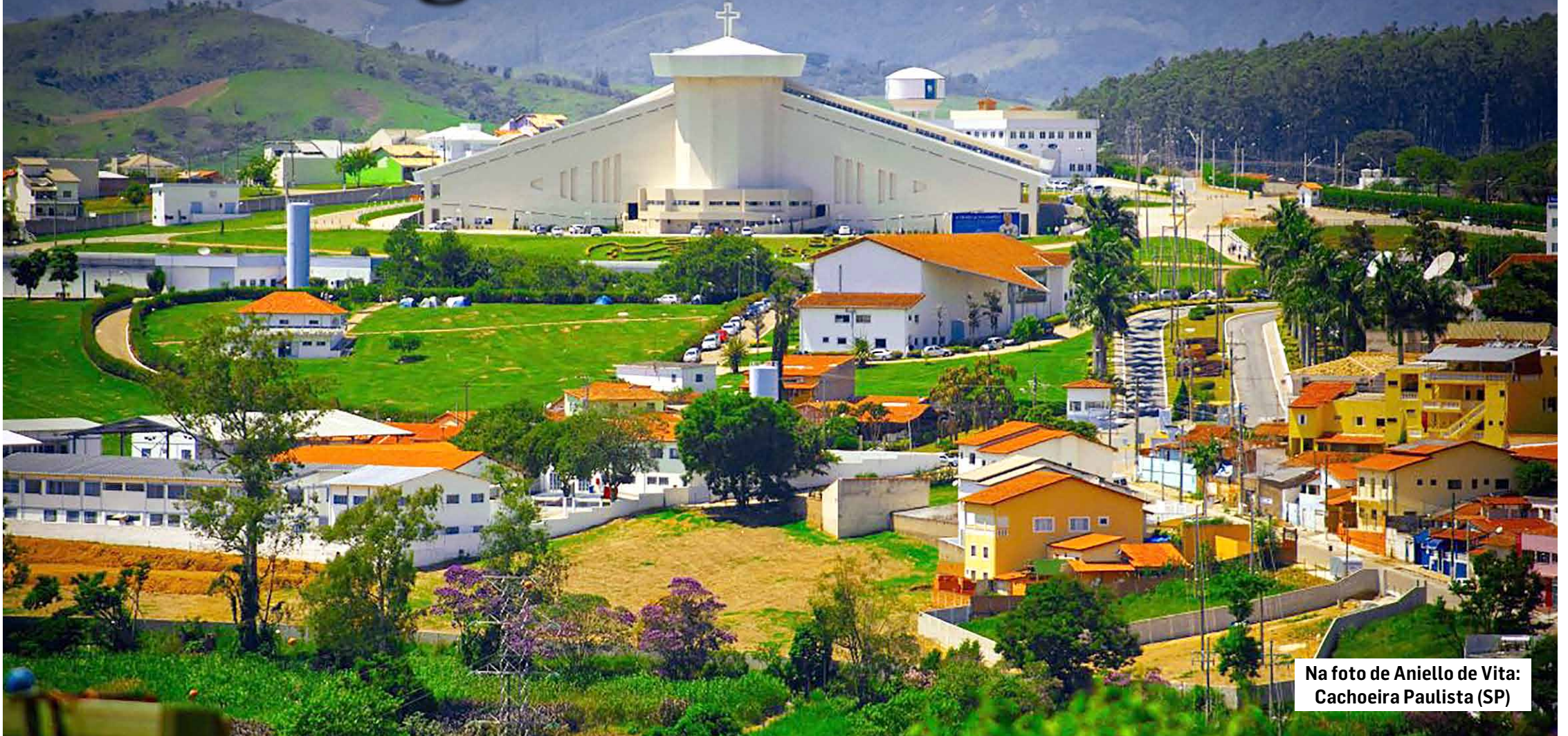
Cachoeira Paulista (SP)

Eis aqui uma Rota Turística, parte conhecida, parte a ser explorada. São 11 cidades: Aparecida, Cachoeira Paulista, Potim, Roseira, Tremembé, Canas, Lagoinha, Cunha, Lorena, Guaratinguetá e Piquete. A mais famosa, Aparecida, além do Santuário Nacional visita-se a Feira Livre, a cidade do Romeiro e muitas de suas festas. Em Cachoeira Paulista conheça a Canção Nova, o Santuário de Santa Cabeça e as ruínas da velha estação ferroviária. Em Tremembé visite a Basílica do Senhor Bom Jesus, além da sua estação ferroviária. Estando aos pés da serra da Mantiqueira, você também aproveita a exuberante natureza do Rio Paraíba.