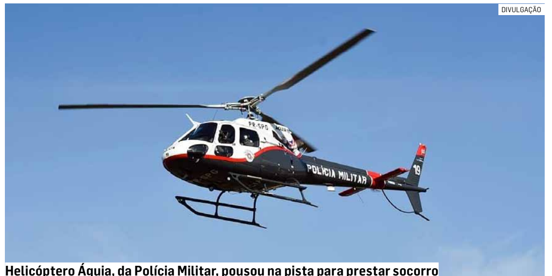
Helicóptero Águia, da Polícia Militar, pousou na pista para prestar socorro

Durante o atendimento da ocorrência, a pista precisou ser totalmente interditada. As causas do acidente serão apuradas pelas autoridades competentes.