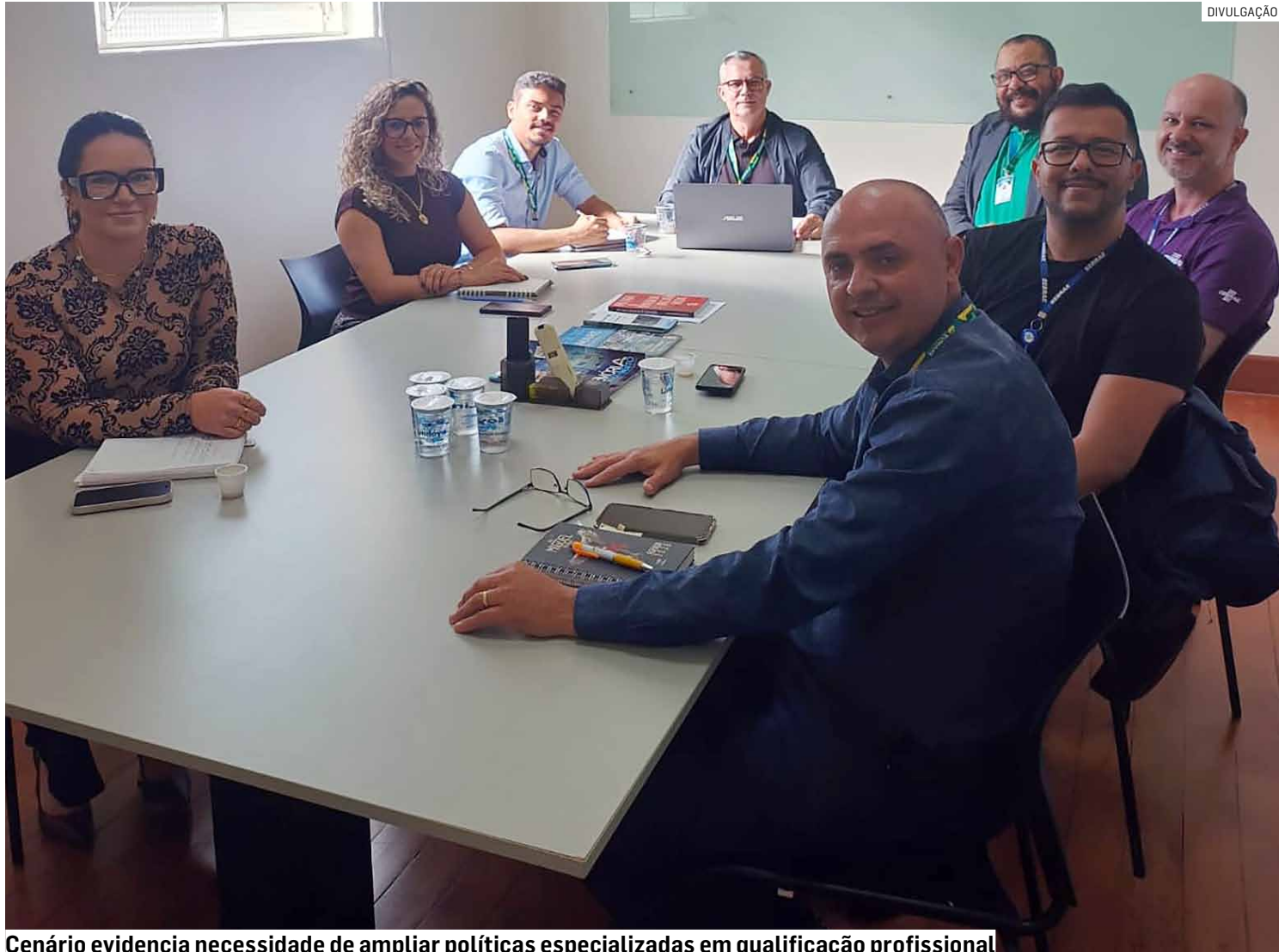
Cenário evidencia necessidade de ampliar políticas especializadas em qualificação profissional

Segundo o levantamento, a taxa de informalidade em Sumaré atingiu 70,524% da População Economicamen-