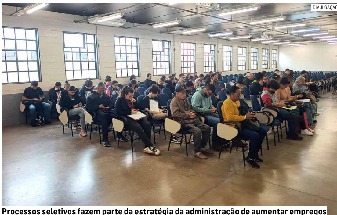
Processos seletivos fazem parte da estratégia da administração de aumentar empregos

A iniciativa, segundo a secretaria, integra as ações permanentes desenvolvidas pela administração municipal para ampliar as oportunidades de emprego, aproximando empresas que estão contratando trabalhadores de Sumaré e região e fortalecendo o de-