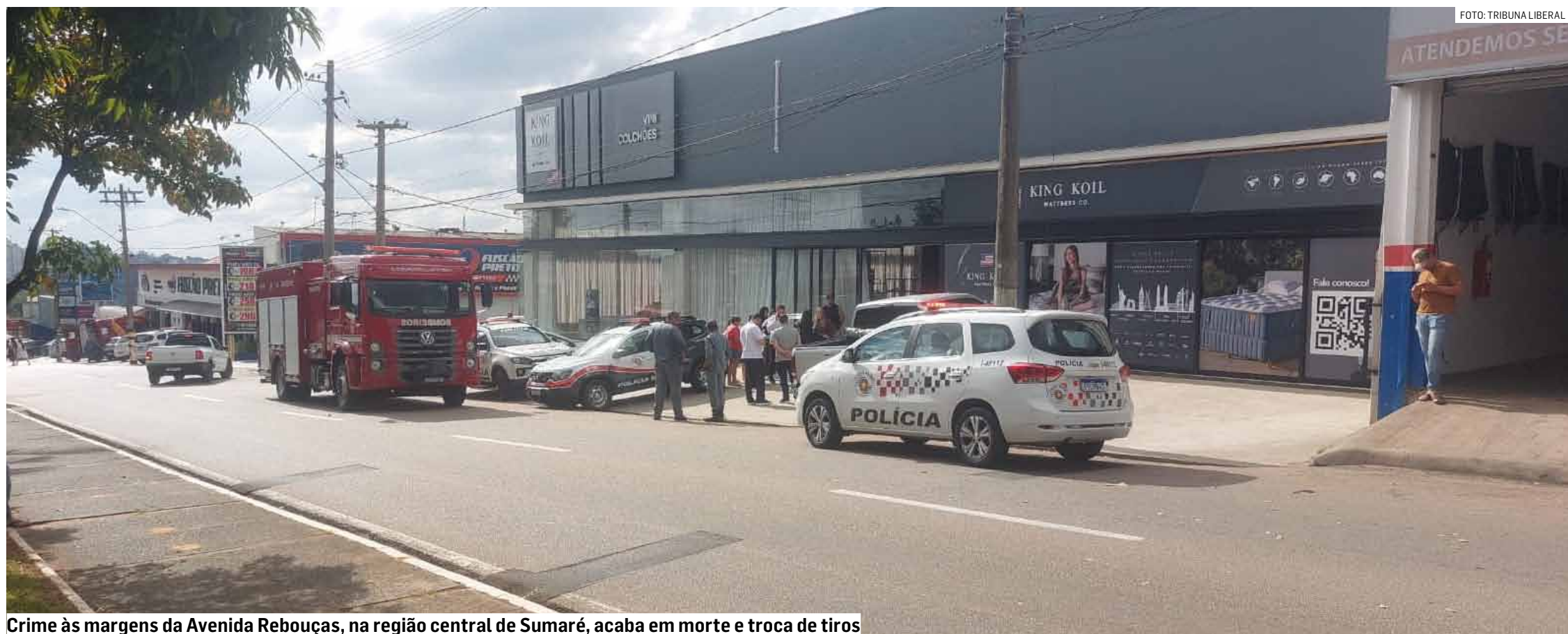
Crime às margens da Avenida Rebouças, na região central de Sumaré, acaba em morte e troca de tiros

Troca de tiros durante tentativa de roubo teve um dos suspeitos atingido e dono de loja ferido na mão; policiais civis investigam as circunstâncias da ocorrência e procuram o segundo envolvido no episódio depois de conseguir a fuga