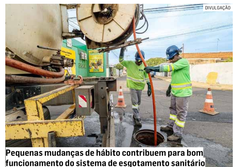
Pequenas mudanças de hábito contribuem para bom funcionamento do sistema de esgotamento sanitário

“Para garantir o funcionamento do sistema de esgotamento sanitário, a gente mantém um trabalho permanente de manutenção das redes. Ao longo de todo o ano, equipes especializadas realizam inspeções, limpezas preventivas e monitoramento dos sistemas, além de atender prontamente as ocorrências registradas pela população. A colaboração dos moradores, com o descarte correto dos resíduos, complementa esse trabalho e contribui para preservar a infraestrut-