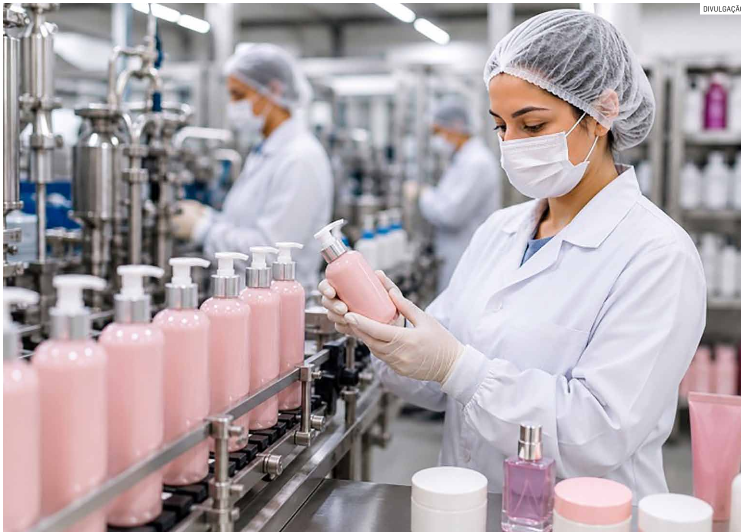
Indústria e segmentos como fabricação de colchões puseram Monte Mor entre os dez maiores saldos de empregos do país

Outro segmento em que o município lidera o ranking estadual é a fabricação de colchões, atividade que também coloca Mon-