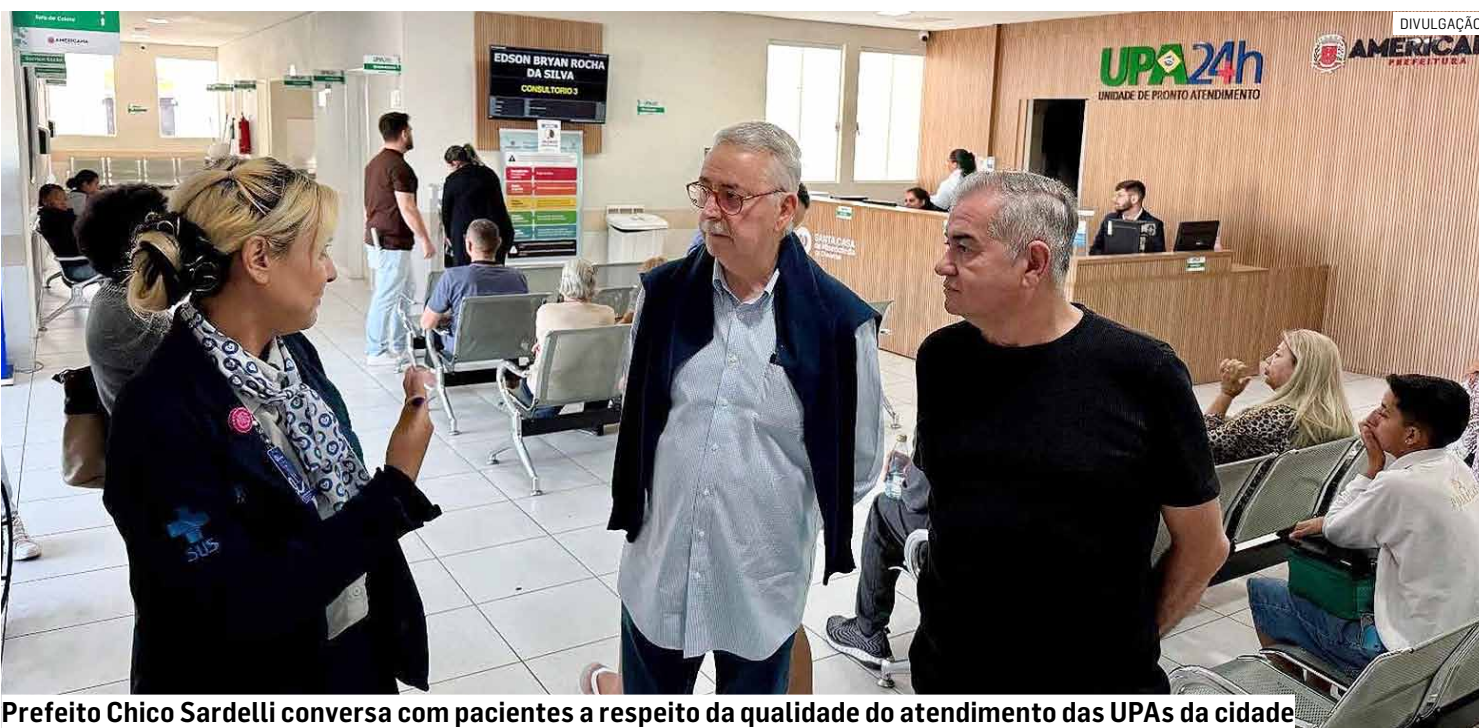
Prefeito Chico Sardelli conversa com pacientes a respeito da qualidade do atendimento das UPAs da cidade

Unidades de Pronto Atendimento Dona Rosa e São José passam a receber novos incentivos federais após atenderem as exigências do Ministério da Saúde; verba adicional reforçará o custeio dos serviços de urgência e emergência no município