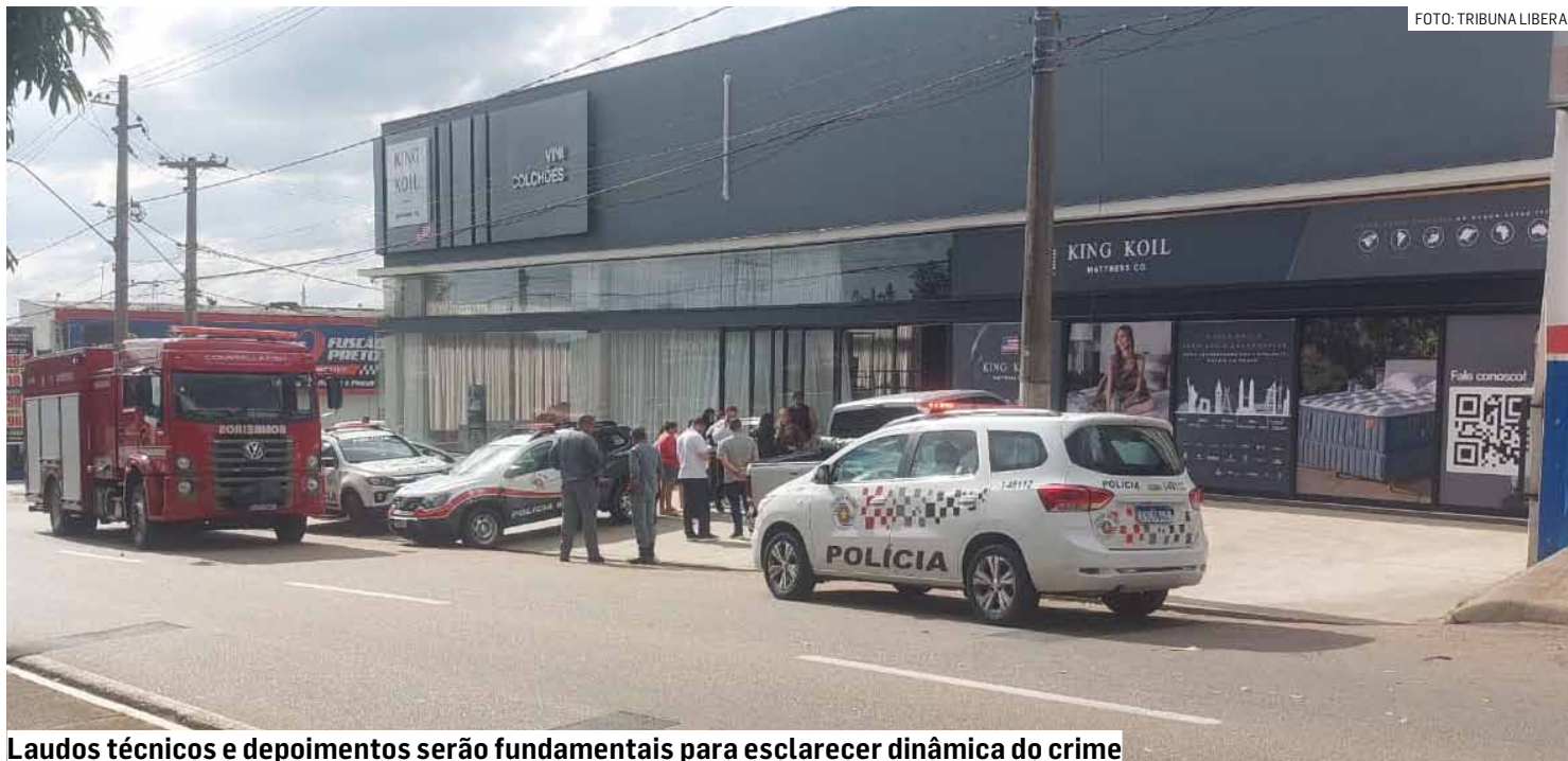
Laudos técnicos e depoimentos serão fundamentais para esclarecer dinâmica do crime

Investigação agora busca localizar possível comparsa que aguardava o criminoso em uma motocicleta ao lado de fora do estabelecimento comercial; polícia analisa imagens de câmeras e do sistema Smart Suma para esclarecer participação