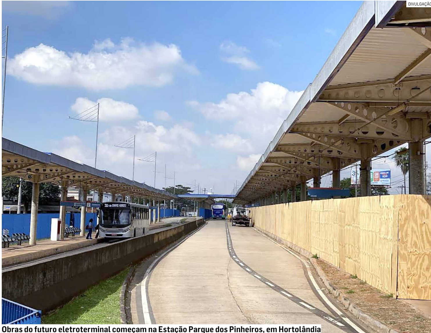
Obras do futuro eletroterminal começam na Estação Parque dos Pinheiros, em Hortolândia

O eletroterminal também terá segurança reforçada com a implantação de uma cabine com câmeras inteligentes. Esses equipamentos estarão integrados