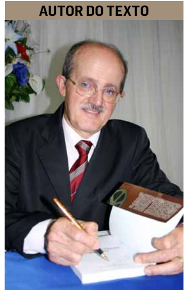
AUTOR DO TEXTO