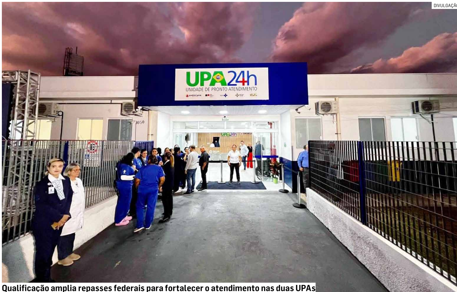
Qualificação amplia repasses federais para fortalecer o atendimento nas duas UPAs

A UPA Dona Rosa, localizada na região do Par-