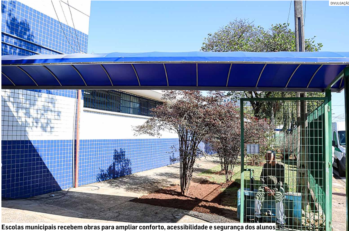
Escolas municipais recebem obras para ampliar conforto, acessibilidade e segurança dos alunos

A unidade ainda passou por reparos hidráulicos nos banheiros e recebeu materiais educativos voltados à preservação dos