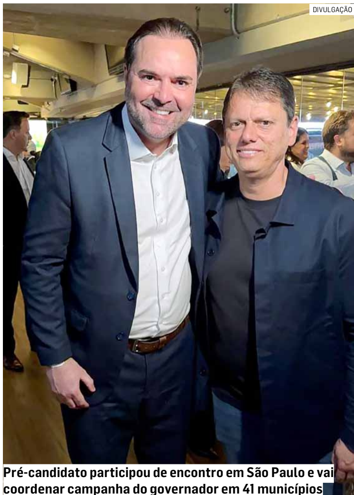
Pré-candidato participou de encontro em São Paulo e vai coordenar campanha do governador em 41 municípios