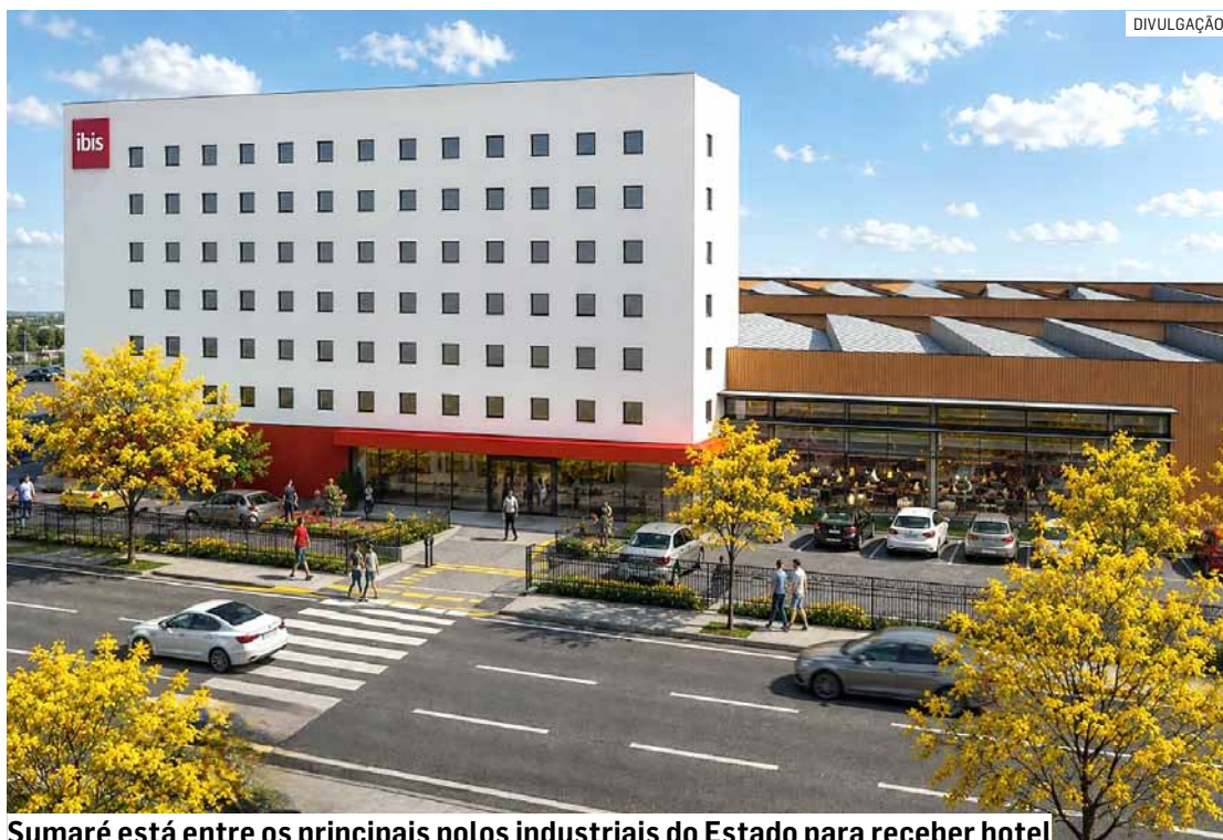
Sumaré está entre os principais polos industriais do Estado para receber hotel

“A assinatura do Ibis Sumaré representa mais um passo importante na estratégia de expansão da Accor em cidades com forte dinamismo econômico e demanda crescente por hospedagem. A integração ao Shopping ParkCity Sumaré agrega conveniência e uma experiência mais completa aos hóspedes, reunindo hospedagem, gastronomia, serviços e lazer em um único destino, ao mesmo tempo em que fortalece a infraestrutura hoteleira da região”, afirmou.