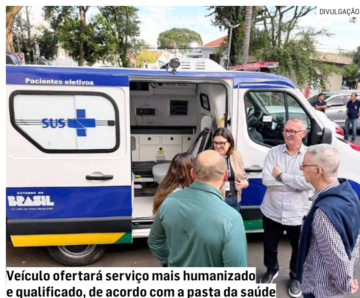
Veículo ofertará serviço mais humanizado, e qualificado, de acordo com a pasta da saúde

O veículo é voltado ao transporte individualizado de pacientes com restrição de mobilidade e clinicamente estáveis. Conta com compartimento exclusivo para transporte do paciente, maca retrátil, banco para acompanhante, sistema de climatização, iluminação interna, dispositivos de fixa-