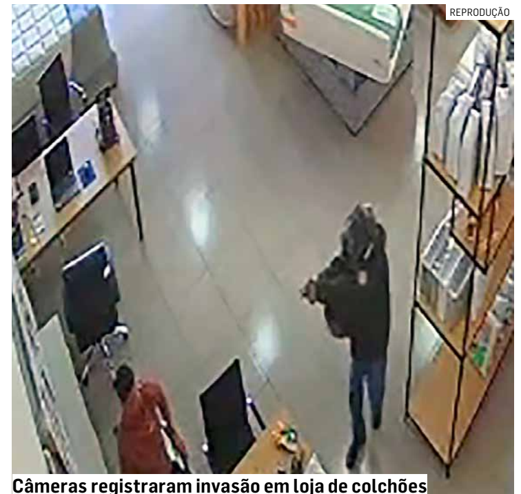
Câmeras registraram invasão em loja de colchões

César Oliveira • SUMARÉ tribunaliberal@tribunaliberal.com.br