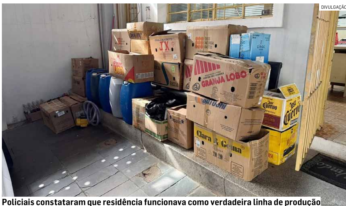
Policiais constataram que residência funcionava como verdadeira linha de produção

No local, foram apreendidas centenas de garrafas vazias, galões contendo lí-