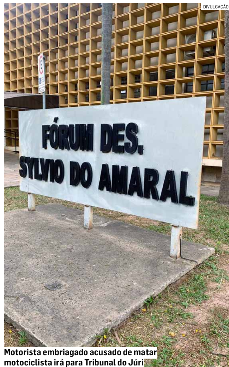
Motorista embriagado acusado de matar motociclista irá para Tribunal do Júri

Como o réu respondeu ao processo em liberdade e cumpriu as medidas impostas pela Justiça, o magistrado autorizou que ele permaneça solto até o julgamento.