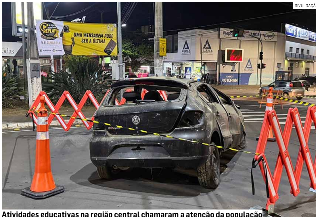
Atividades educativas na região central chamaram a atenção da população

A iniciativa teve como principal objetivo conscientizar a população sobre as consequências da imprudência no trânsito e reforçar a importância de atitudes responsáveis para