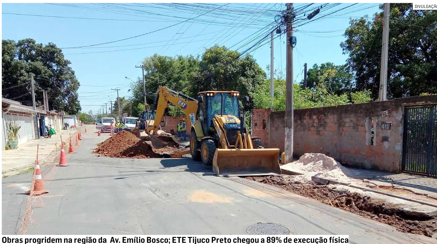
Obras progredem na região da Av. Emílio Bosco; ETE Tijuco Preto chegou a 89% de execução física

As obras da Bacia Tijuco Preto contemplam a implantação de aproximadamente 13 quilômetros de interceptores. Com 3 quilômetros já executados, as equipes avançam com a