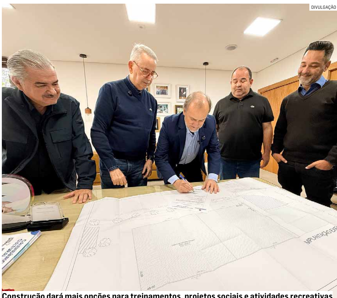
Construção dará mais opções para treinamentos, projetos sociais e atividades recreativas