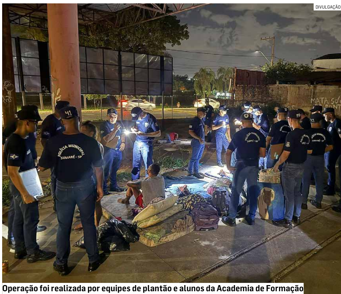
Operação foi realizada por equipes de plantão e alunos da Academia de Formação

Além do trabalho operacional, a participação dos alunos da Academia de Formação também teve caráter educativo e técnico, permitindo que os futuros agentes acompanhassem de perto os procedimentos de abordagem, fiscalização e atuação preventiva.