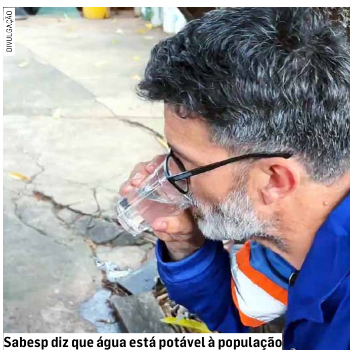
Sabesp diz que água está potável à população

Homem recebeu pena de nove anos de prisão em regime fechado por crime que tem relação com débitos envolvendo drogas; vítima sofreu socos, chutes e pauladas na cabeça; ataque foi descrito pela Justiça como 'emboscada violenta' e só parou com a chegada da Polícia Militar