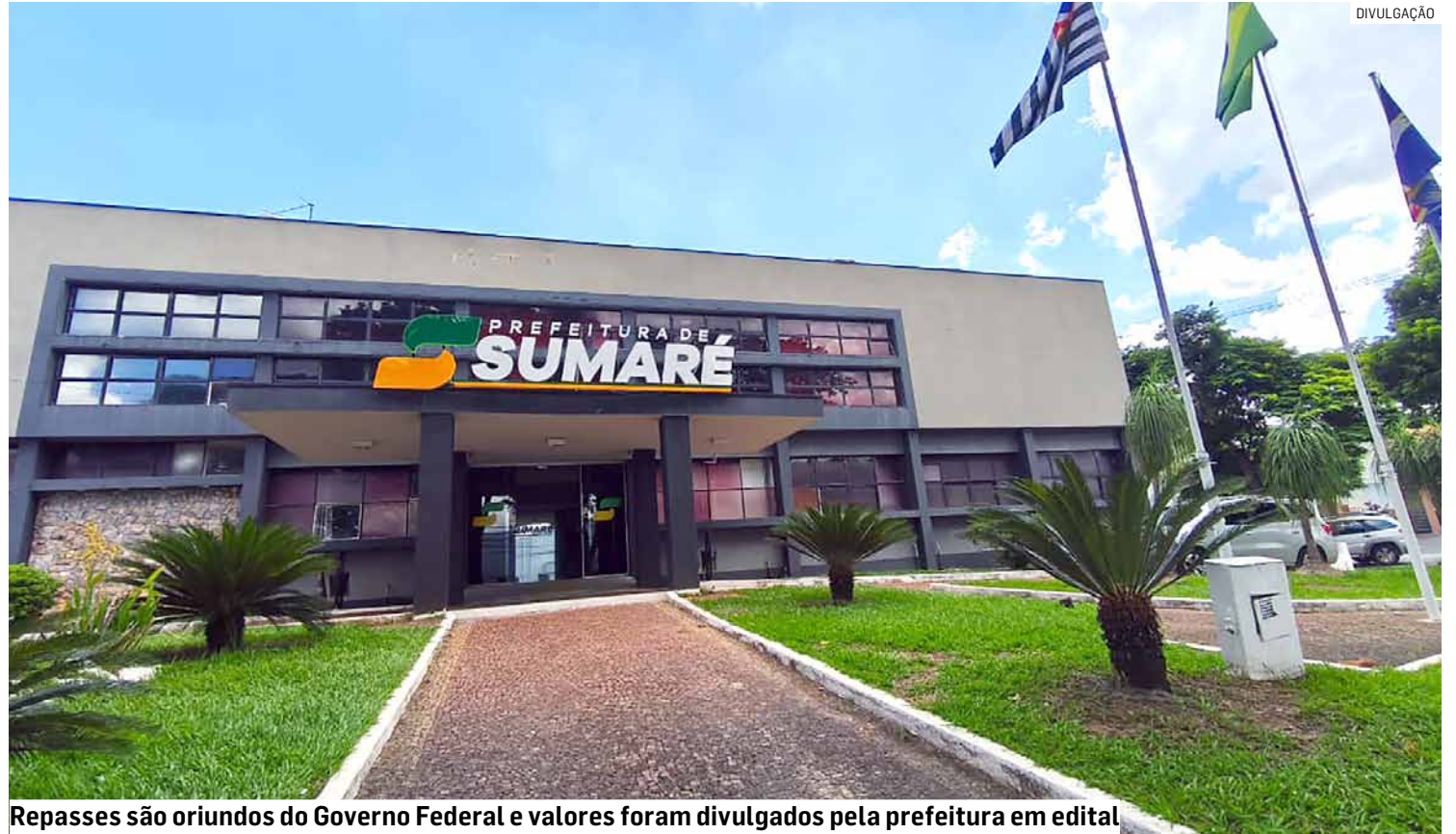
Repases são oriundos do Governo Federal e valores foram divulgados pela prefeitura em edital

Na saúde, os repasses ultrapassaram R$ 1,5 milhão e contemplaram ações da atenção primária, saúde bucal, agentes comunitários, equipes multiprofissionais e assistência farmacêutica.