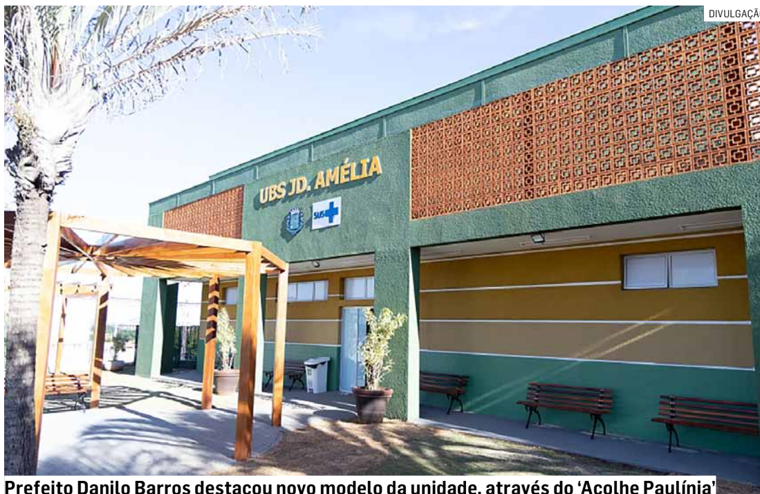
Prefeito Danilo Barros destacou novo modelo da unidade, através do 'Acolhe Paulínia'

A UBS Jardim Amélia foi o projeto piloto da implantação do “Acolhe Paulínia”, uma iniciativa que envolve um novo jeito de cuidar da saúde pública, envolvendo as premissas da Estratégia de Saúde da Família (ESF), criada pelo Governo Federal e implementada pelo Sistema Único de Saúde.