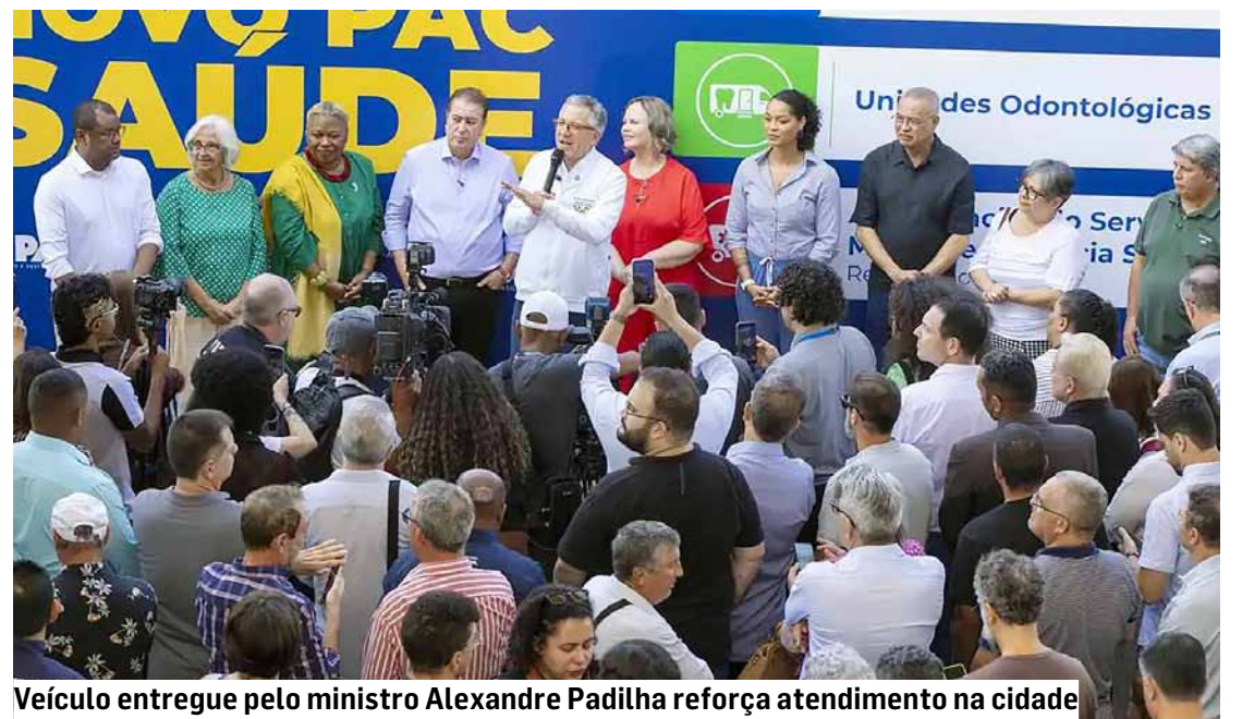
Veículo entregue pelo ministro Alexandre Padilha reforça atendimento na cidade

Além da nova ambulância, Nova Odessa foi recentemente contemplada pelo PAC com combos de modernização para as UBSs 1 (Centro) e 3 (Jardim São Manoel), além de um kit multimídia para teleconsultas, iniciativas que continuam em fase de implantação. | Da Redação