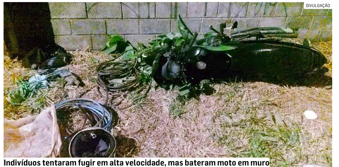
Indivíduos tentaram fugir em alta velocidade, mas bateram moto em muro

Ao perceberem a aproximação da viatura, os indivíduos tentaram fugir em alta velocidade, transitando inclusive pela contramão em vias de intenso movimento. Durante a fuga, a motocicleta acabou batendo em um muro e um