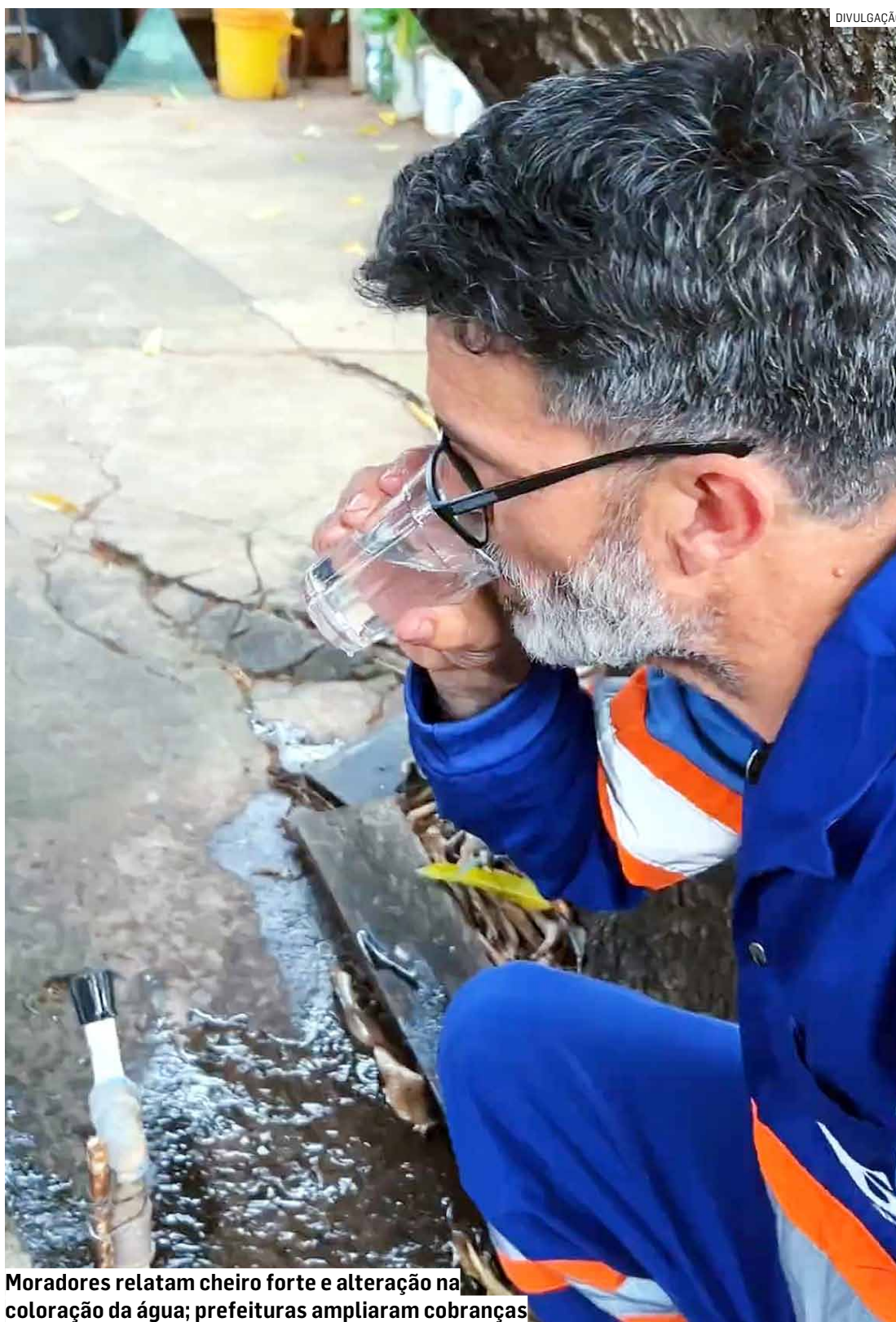
Moradores relatam cheiro forte e alteração na coloração da água; prefeituras ampliaram cobranças

Segundo a Prefeitura de Hortolândia, relatório da Arsesp apontou que técnicos identificaram gosto e