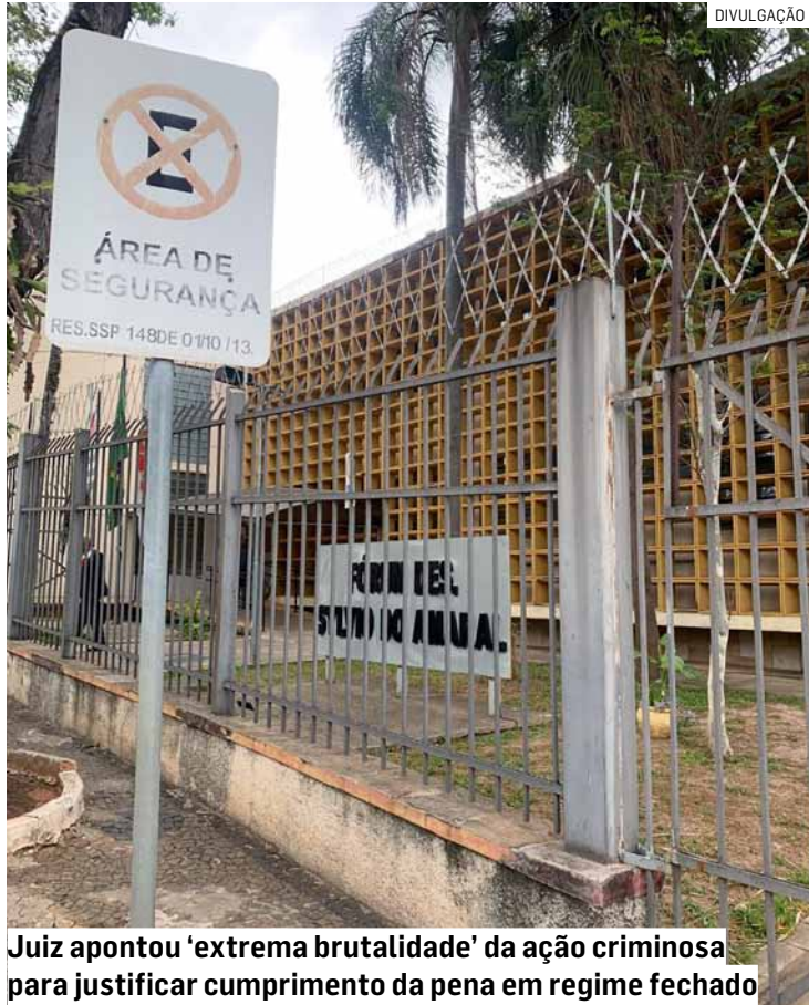
Juiz apontou 'extrema brutalidade' da ação criminosa para justificar cumprimento da pena em regime fechado

Réu vai cumprir pena de nove anos de prisão em regime fechado por tentativa de homicídio triplamente qualificado e receptação; na ocasião, homem atacou com pauladas e agrediu violentamente a vítima por dívida relacionada a drogas