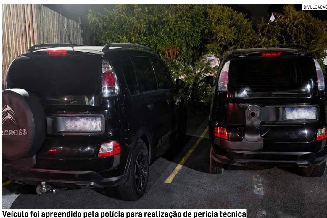
Veículo foi apreendido pela polícia para realização de perícia técnica

De acordo com a corporação, o motorista desobedeceu a determinação e ainda tentou atingir a viatura policial, iniciando uma fuga por diversas ruas da cidade e também por rodovias da região. Durante o acompa-