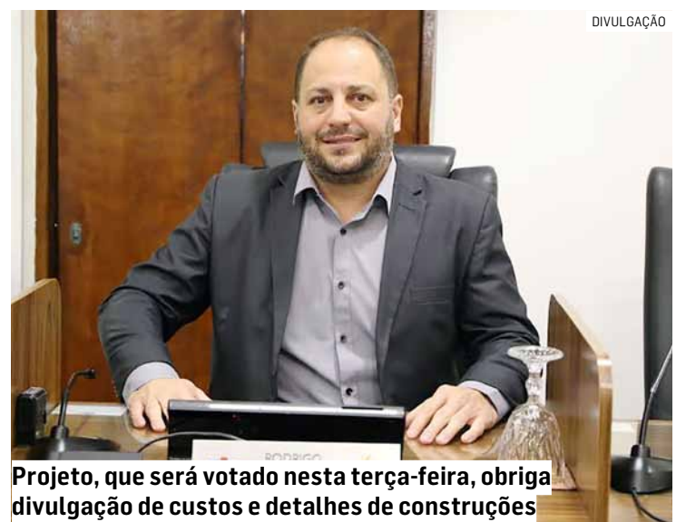
Projeto, que será votado nesta terça-feira, obriga divulgação de custos e detalhes de construções