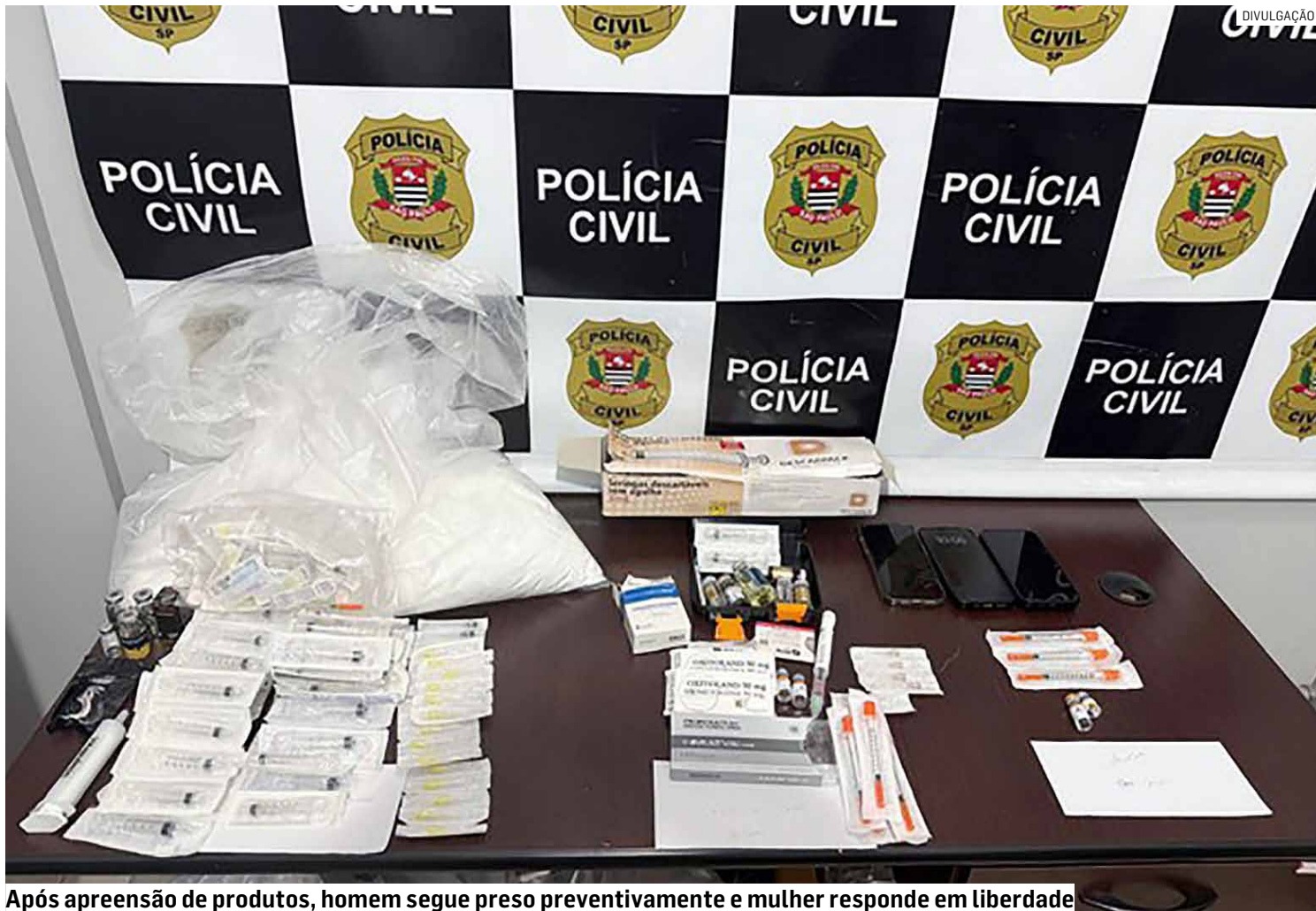
Após apreensão de produtos, homem segue preso preventivamente e mulher responde em liberdade

Segundo a denúncia da Promotoria, o casal teria utilizado imóveis em Americana e Santa Bárbara d'Oeste entre 2025 e 2026 para armazenar, distribuir e aplicar substâncias terapêuticas de origem irregu-