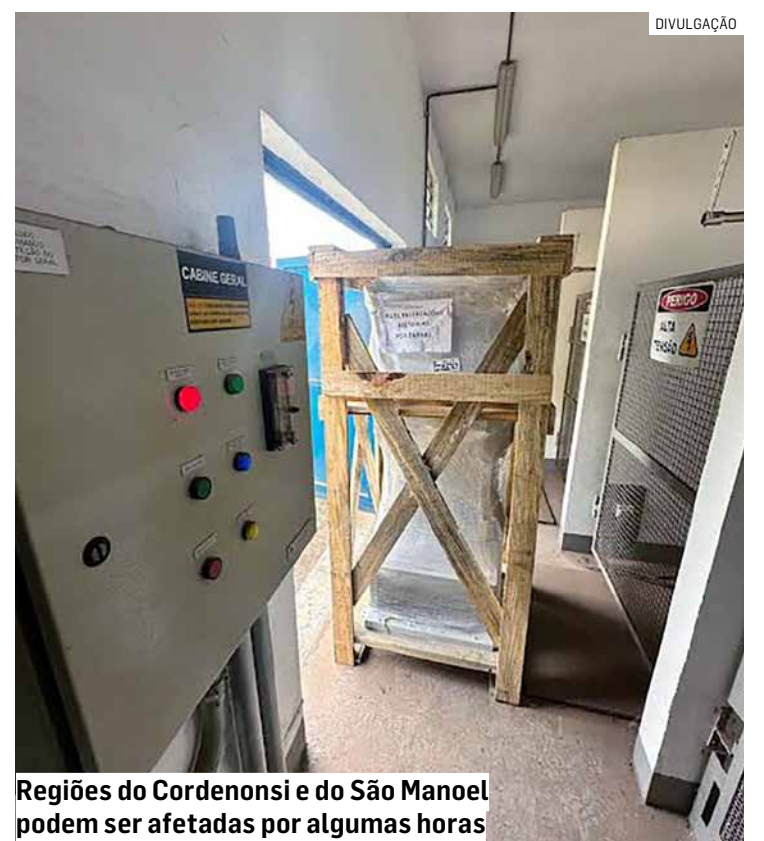
Regiões do Cordenonsi e do São Manoel podem ser afetadas por algumas horas

O DAE orienta a população das regiões afetadas a utilizar água de forma consciente, principalmente durante o período da manutenção.