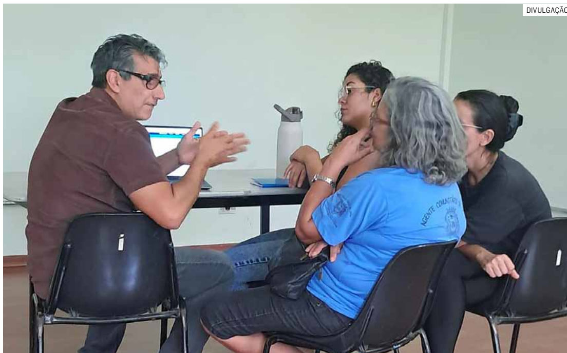
Iniciativa oferece suporte técnico às equipes e fortalece qualidade dos registros em saúde

Entre os temas abordados estiveram cadastro de usuários, lançamento de produção, indicadores da APS, e-SUS APS, envio e monitoramento de dados, além de dúvidas relacionadas aos fluxos de trabalho.