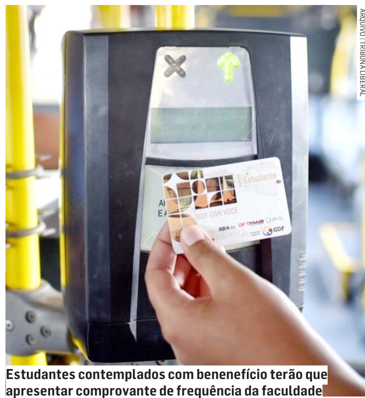
Estudantes contemplados com benefício terão que apresentar comprovante de frequência da faculdade

Aqueles que solicitarem o auxílio transporte devem apresentar conta bancária no Banco Santander. Caso não possuam conta no banco indicado, é necessário acessar o site: http://www.santander.com.br/universitarios .