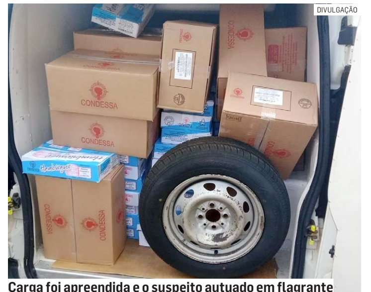
Carga foi apreendida e o suspeito autuado em flagrante

Os policiais visualizaram o veículo saindo de uma residência e de imediato fizeram a abordagem. Após o condutor desembarcar do