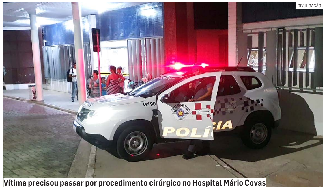
Vítima precisou passar por procedimento cirúrgico no Hospital Mário Covas

A ocorrência foi registrada no Plantão Policial de Hortolândia, onde o caso será investigado.