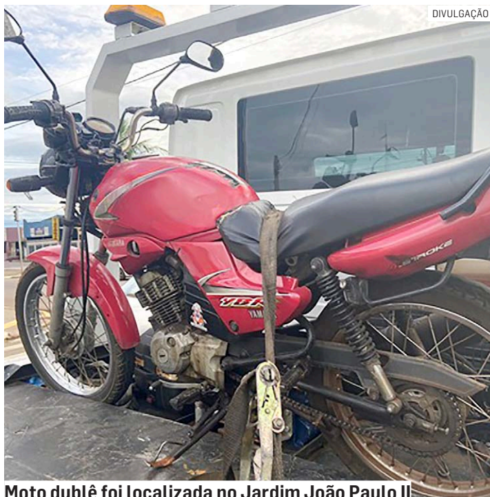
Moto dublê foi localizada no Jardim João Paulo II

Durante a abordagem, a PM constatou que a motocicleta se tratava de uma Yamaha YBR 125, e as informações da placa correspondiam a uma motocicleta de cor e modelo diferentes. Os sinais de identifica-