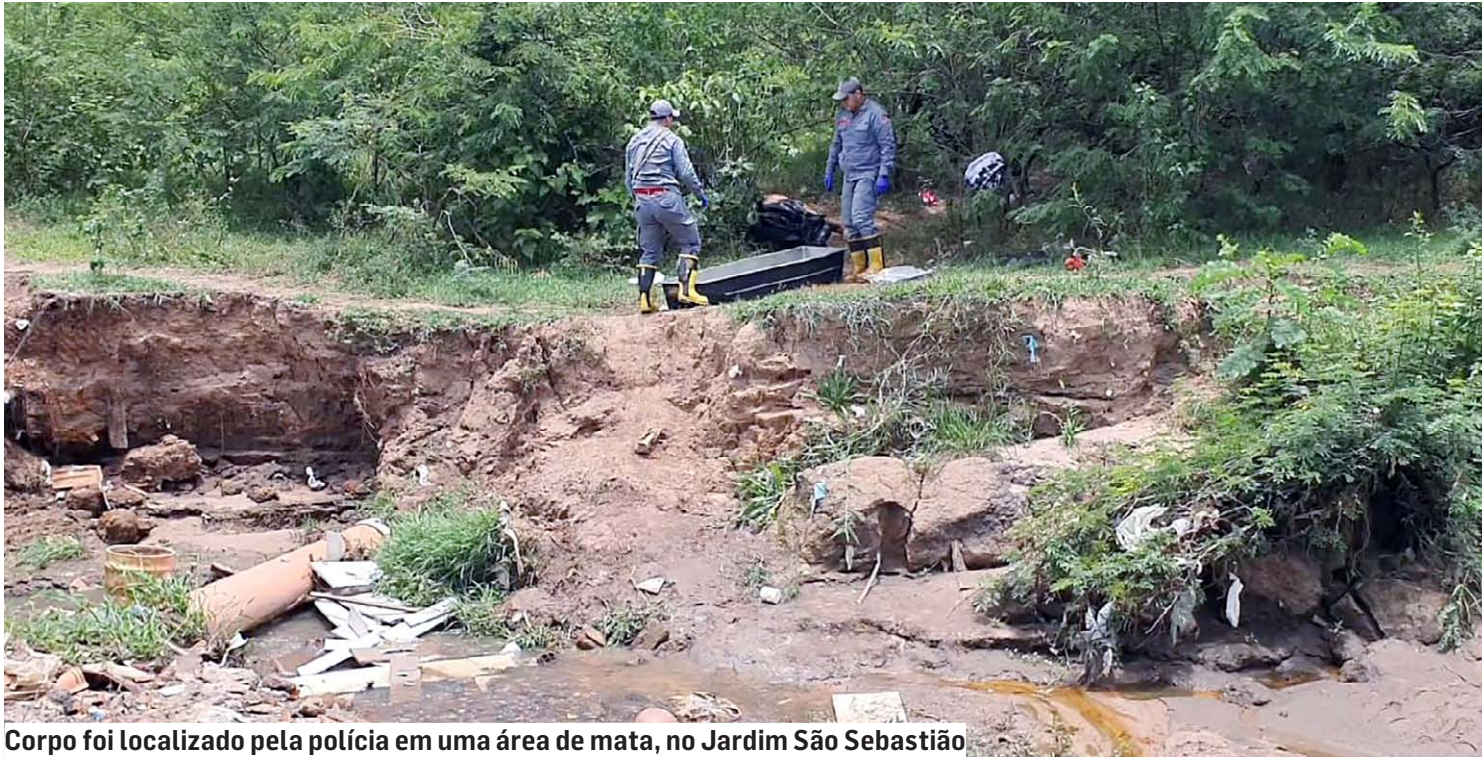
Corpo foi localizado pela polícia em uma área de mata, no Jardim São Sebastião

Vítima tentou escapar dos disparos e correu até uma área de mata no Jardim São Sebastião, mas não resistiu aos ferimentos e caiu ao chão; autor dos tiros teria abandonado um veículo depois do crime, fugindo em meio à mata