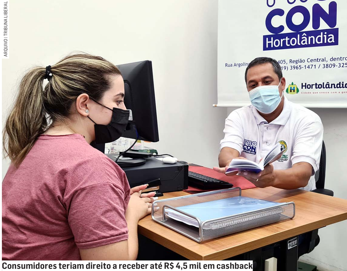
Consumidores teriam direito a receber até R$ 4,5 mil em cashback

Essas empresas também teriam que devolver para os consumidores uma certa quantia em cashback por cada compra já feita. A quantia pode chegar ao valor de até R$ 4.500. Para resgatar essa quantia, a pessoa tem que clicar num link que vem na mensagem.