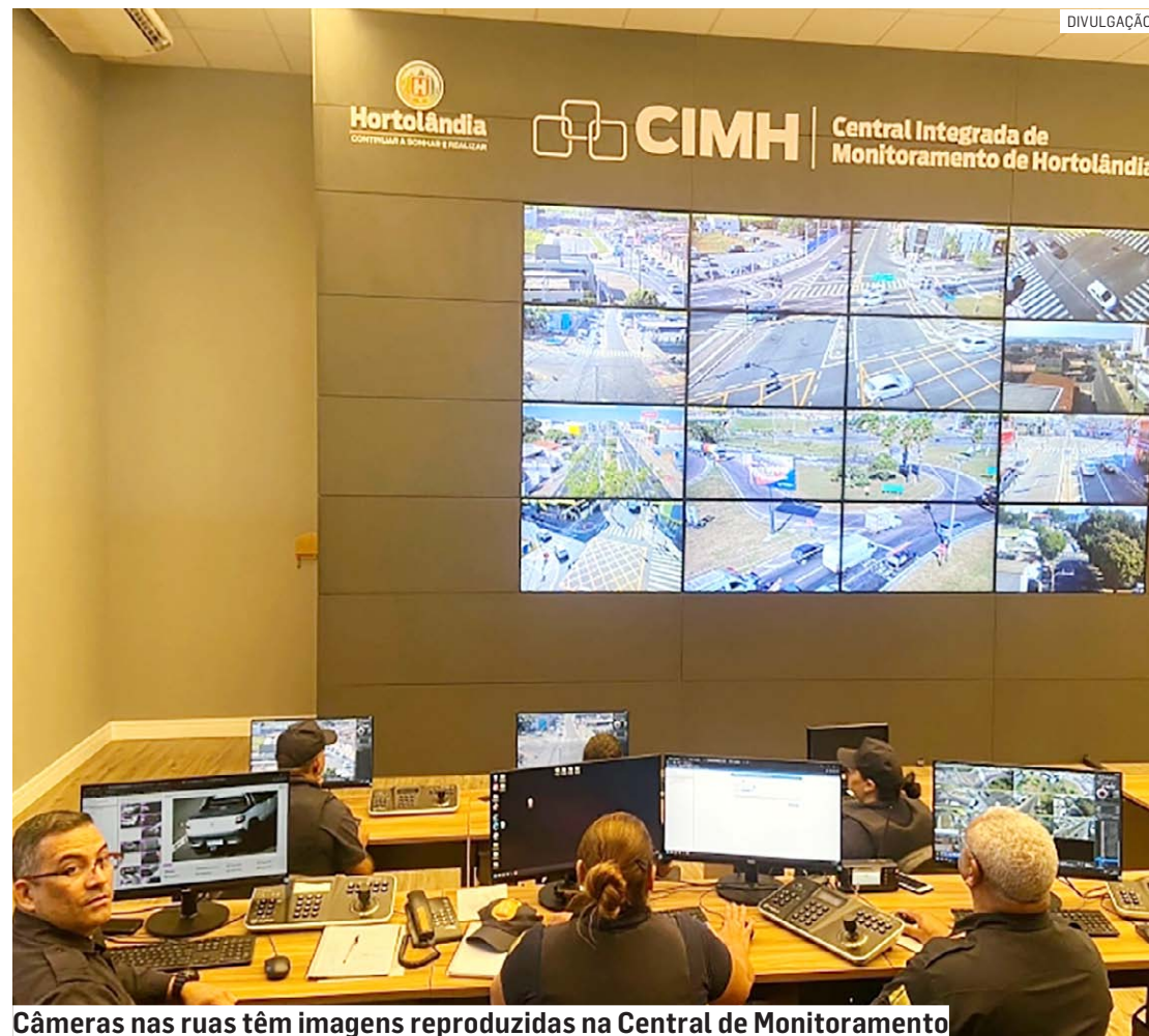
Câmeras nas ruas têm imagens reproduzidas na Central de Monitoramento

De acordo com a Secretaria de Mobilidade Urbana, no ano passado, os cruzamentos entre as avenidas Olívio Franceschini e Emancipação (Pq. dos Pinheiros), avenida Santa-