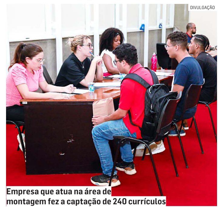
Empresa que atua na área de montagem fez a captação de 240 currículos

Mais informações podem ser obtidas pelo (19) 3874-5669. O atendimento ocorre de segunda a sexta-feira, das 8h às 17h.