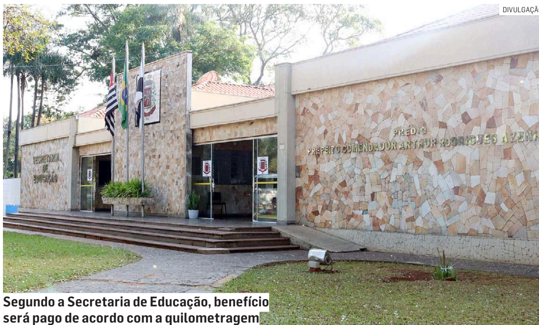
Segundo a Secretaria de Educação, benefício será pago de acordo com a quilometragem

O repasse do benefício do auxílio-transporte terá início em fevereiro de 2024, mas devido à dinâmica de recebimento dos documentos, conferência e divulgação dos contemplados, ocorrerá de forma retroativa, após a conclusão dos trâmites. A Secretaria