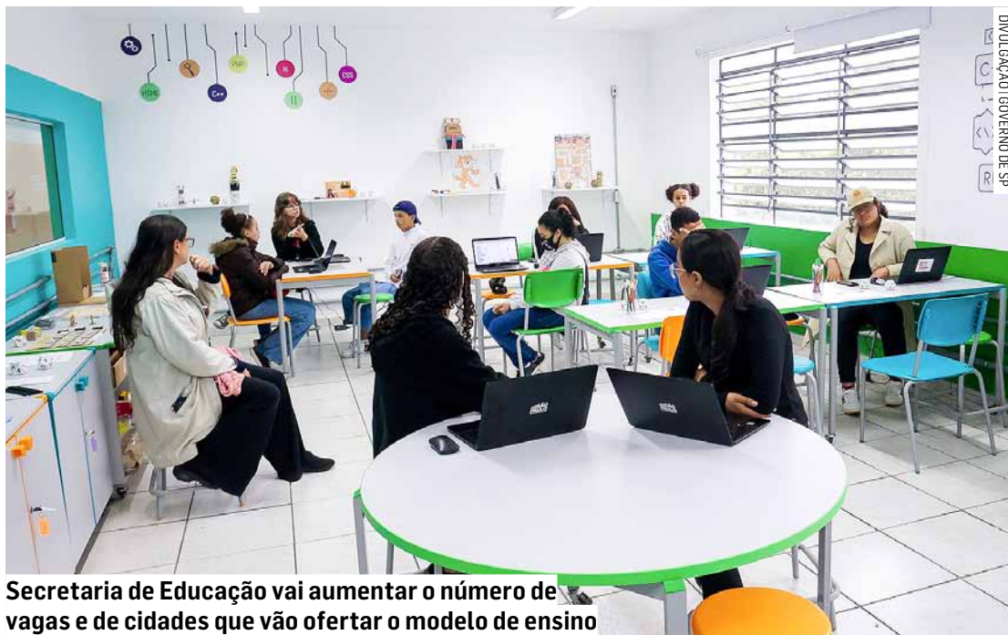
Secretaria de Educação vai aumentar o número de vagas e de cidades que vão ofertar o modelo de ensino

A Secretaria da Educação ampliará, ainda, o número de cidades que terão a oferta de ensino técnico na rede — das atuais 349 para uma perspectiva de estar em 463 municípios, um aumento de 32,6%. Em 2022, o técnico era oferecido a alunos de 161 cidades paulistas.