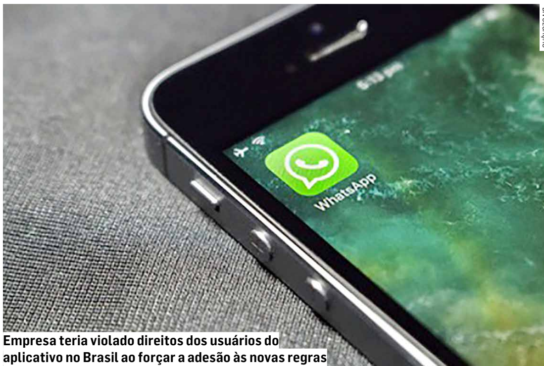
Empresa teria violado direitos dos usuários do aplicativo no Brasil ao forçar a adesão às novas regras

A indenização exigida se baseia em valores que o Whatsapp já foi condenado a pagar na Europa por irregularidades semelhantes, considerando a proximidade das legislações brasileira e europeia sobre proteção de dados. De 2021 a 2023, a União Europeia impôs à empresa multas de 230,5 milhões de euros por omissões e ilegalidades na política de privacidade do aplicativo que ampliaram o compartilhamento de informações pessoais dos usuários no continente. Após