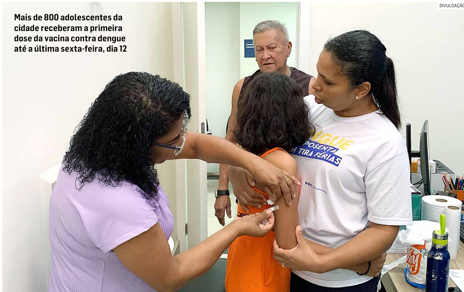
Mais de 800 adolescentes da cidade receberam a primeira dose da vacina contra dengue até a última sexta-feira, dia 12

Os pais e responsáveis devem levar os adolescentes que já tomaram a primeira dose à UBS (Unidade Básica de Saúde) da sua região. São sete unidades espalhadas pela cidade, que atendem diariamen-