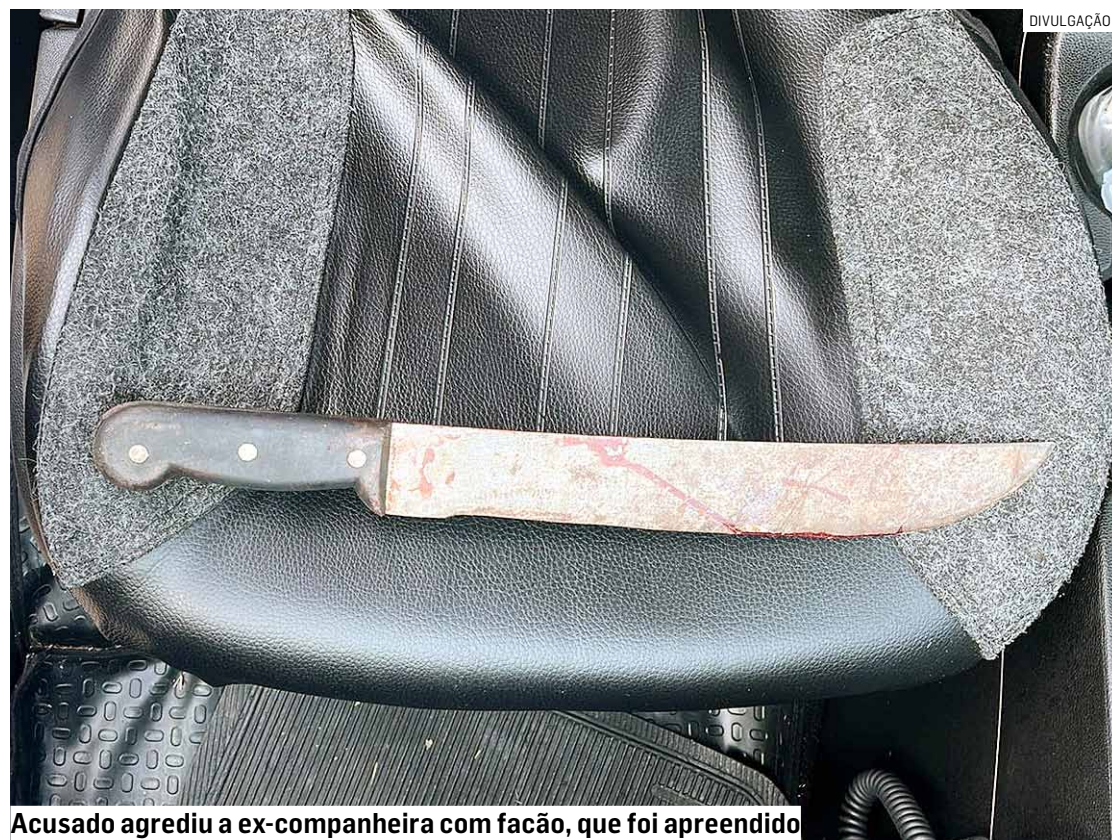
Acusado agrediu a ex-companheira com facão, que foi apreendido

A mulher informou que namora o acusado há cerca de um ano, e que há um mês ele passou a morar na casa dela contra a sua vontade, se recusando a sair.