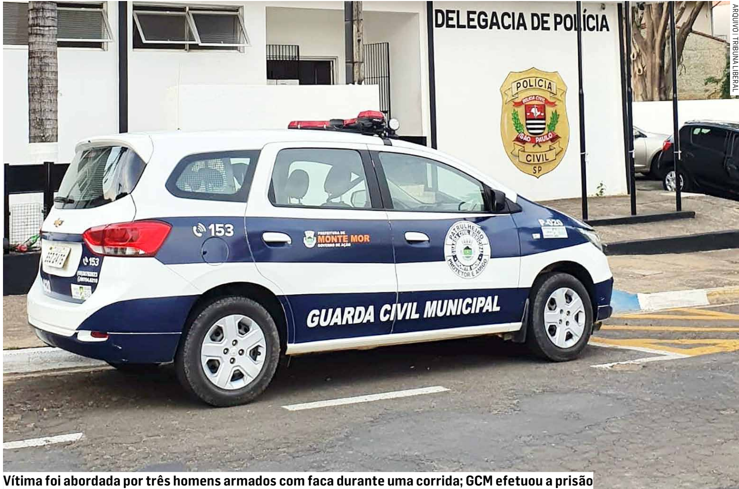
Vítima foi abordada por três homens armados com faca durante uma corrida; GCM efetuou a prisão