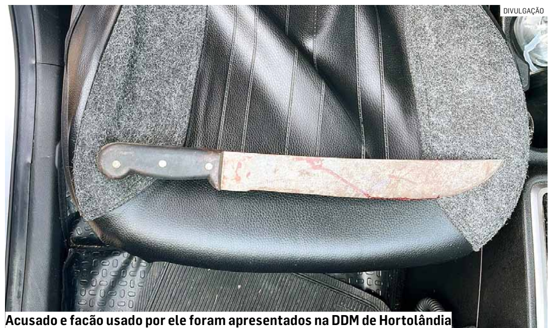
Acusado e facão usado por ele foram apresentados na DDM de Hortolândia