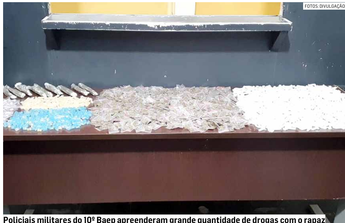
Policiais militares do 10º Baep apreenderam grande quantidade de drogas com o rapaz

Já o carro usado por ele, foi recolhido ao pátio do DER (Departamento de Estradas de Rodagem), por