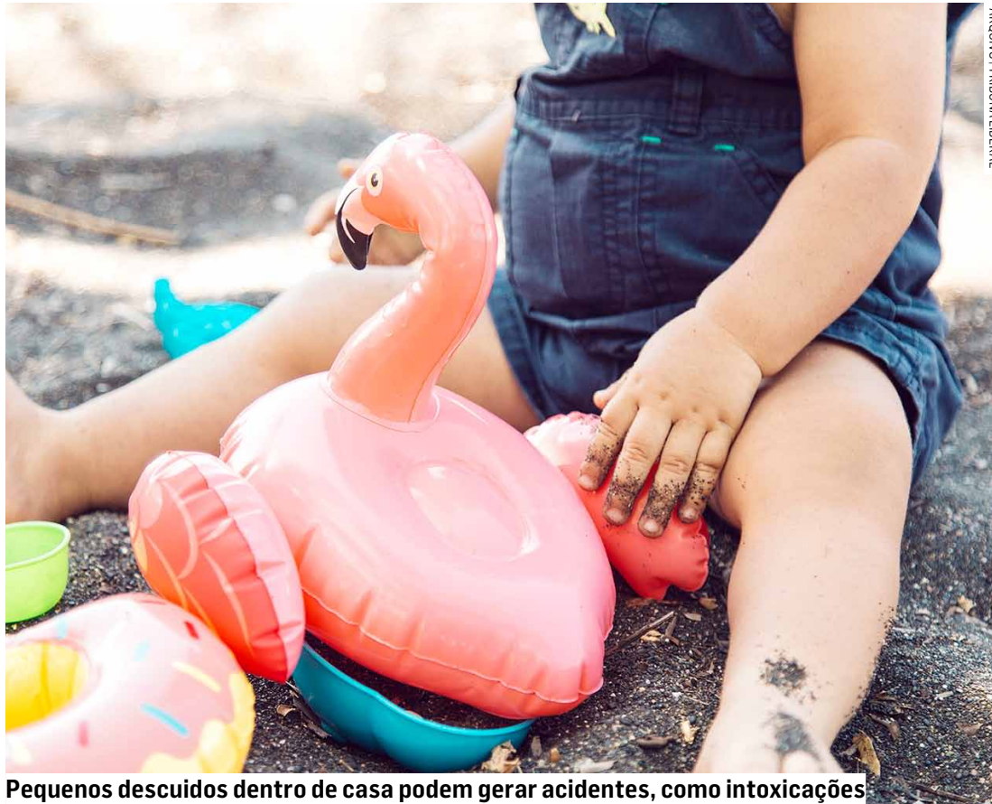
Pequenos descuidados dentro de casa podem gerar acidentes, como intoxicações