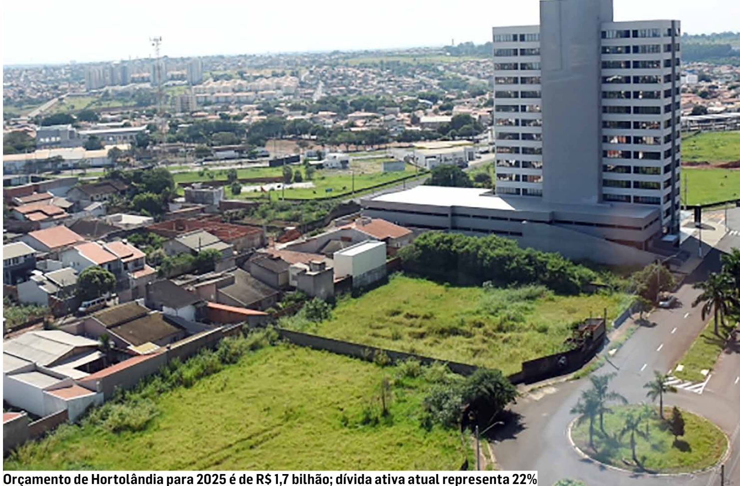
Orçamento de Hortolândia para 2025 é de R$ 1,7 bilhão; dívida ativa atual representa 22%

Além disso, segundo a secretaria, 14,96% das pendências correspondem às dívidas não tributárias, tais como ressarcimentos e multas diversas, como penalidades por queimadas, uso de cerol, perturbação do sossego, podas de árvores, entre outras (exceto multas de trânsito).