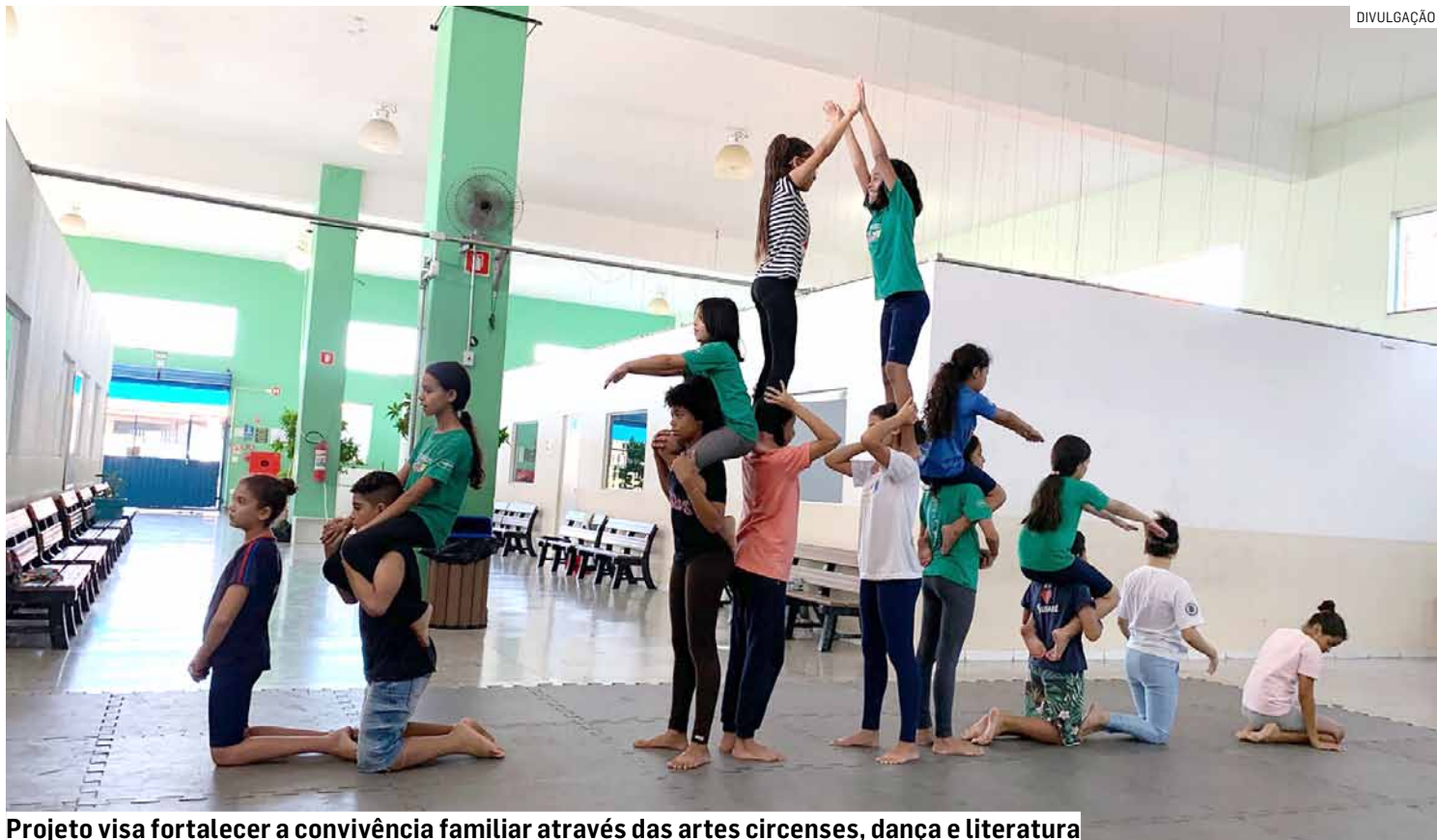
Projeto visa fortalecer a convivência familiar através das artes circenses, dança e literatura

Com o objetivo de promover o respeito aos direi-