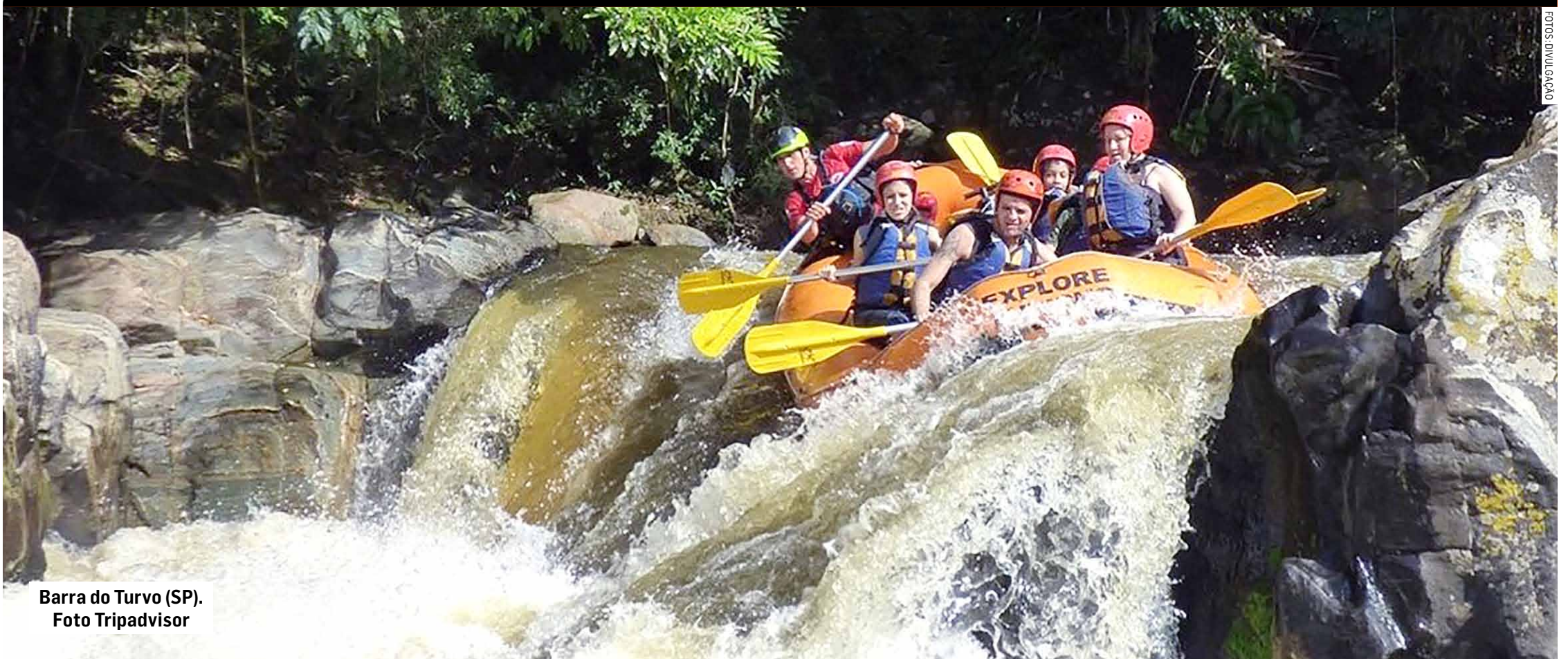
Barra do Turvo (SP).