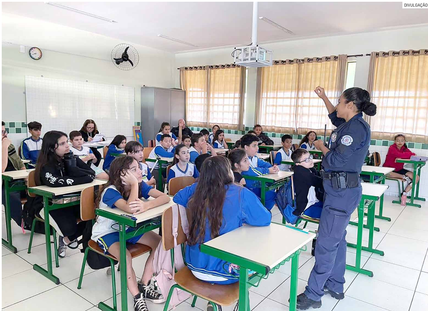
GCM visitou 12 escolas municipais que possuem o quinto ano do Ensino Fundamental I durante o primeiro semestre de 2024