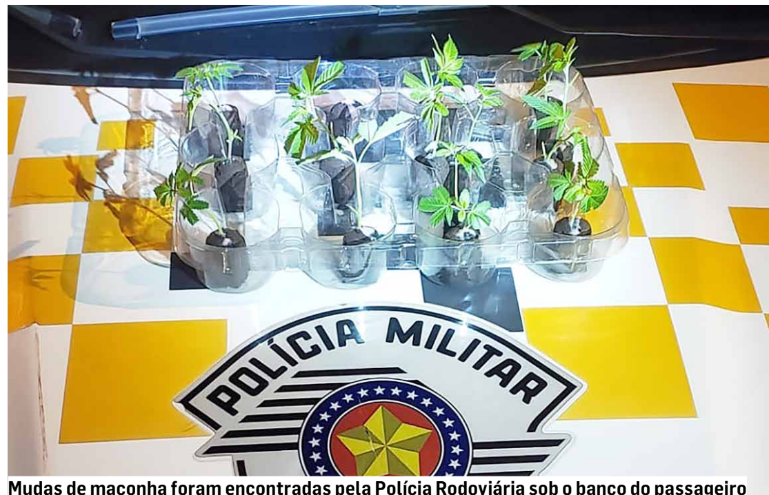
Mudas de maconha foram encontradas pela Polícia Rodoviária sob o banco do passageiro