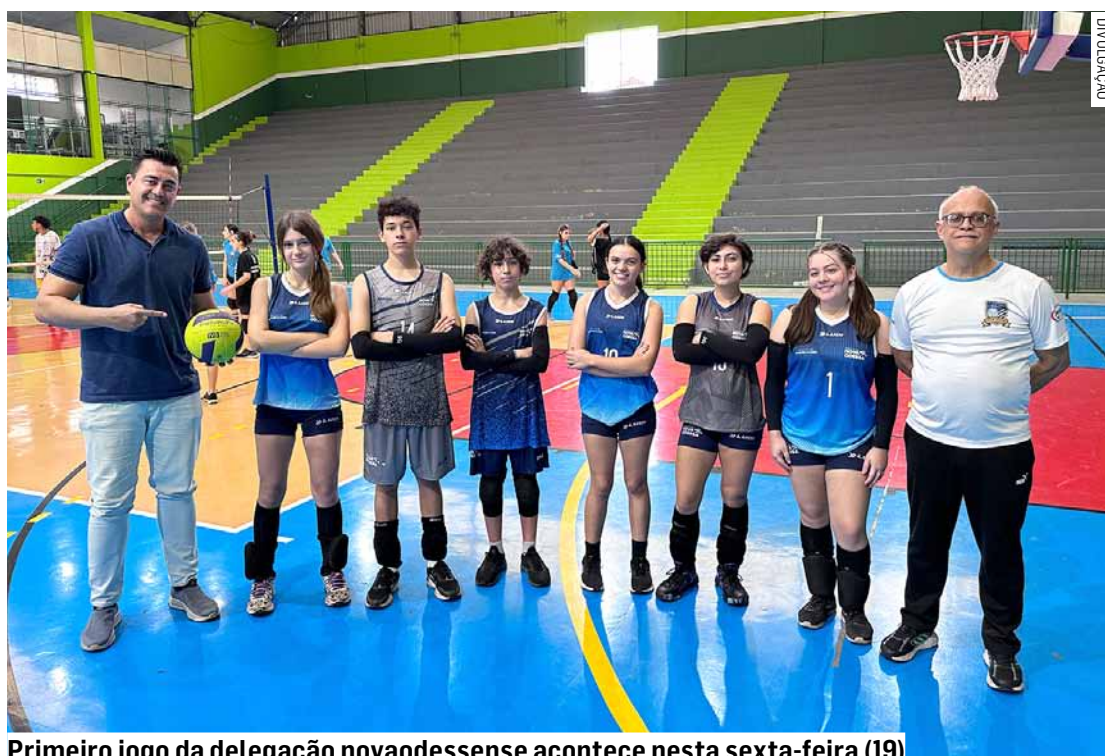
Primeiro jogo da delegação novaodessense acontece nesta sexta-feira (19)

Foram investidos R$ 58 mil pela administração municipal. São, no total, cerca de 400 kits, com 1.782 peças novas e padronizadas. O kit de uniforme