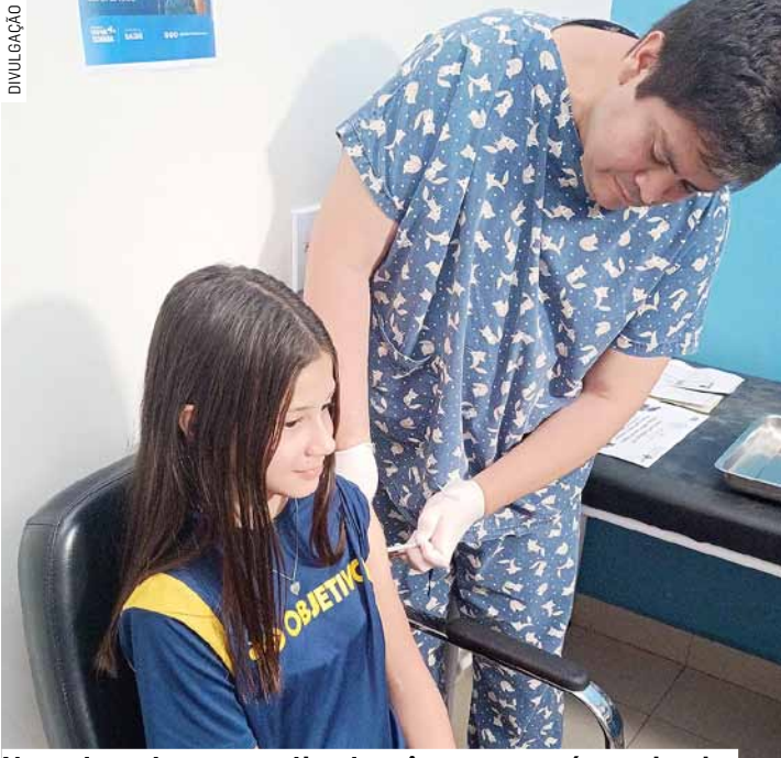
Nova dose deve ser aplicada três meses após a primeira

A Secretaria de Saúde de Nova Odessa iniciou nesta terça-feira (16) a aplicação da segunda dose da nova vacina contra a dengue em adolescentes de dez a 14 anos de idade. A segunda dose é necessária para completar o esquema vacinal e garantir a imunização contra a doença para a vida toda, e deve ser aplicada três meses após a primeira. Nova Odessa foi a primeira cidade da RMC (Região Metropolitana de Campinas) a aplicar a nova vacina, em abril.