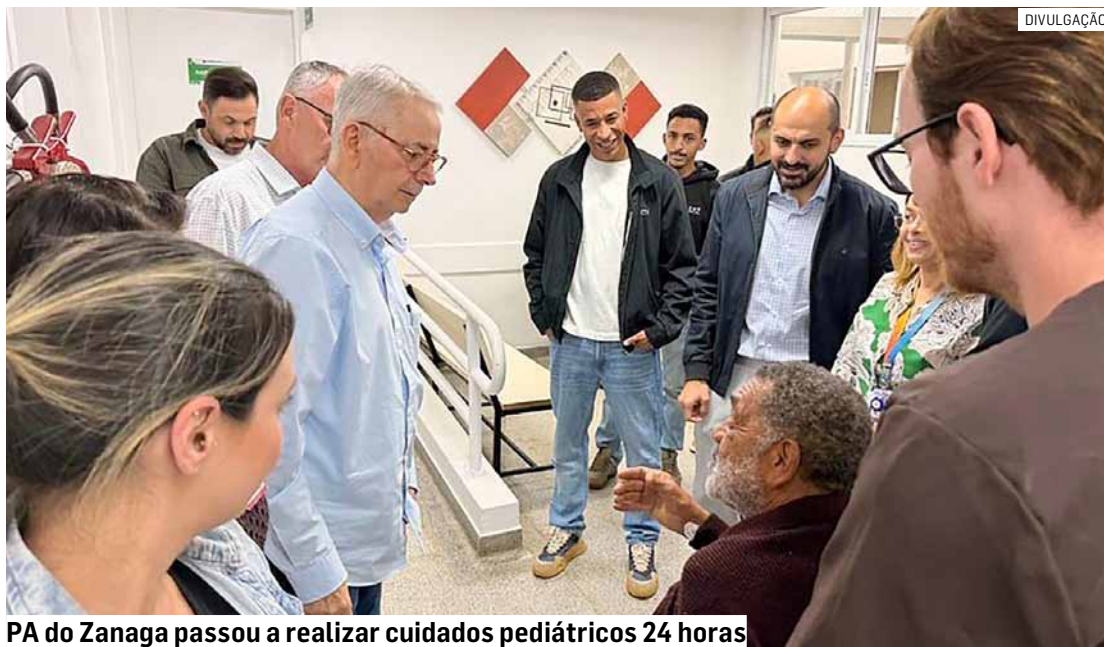
PA do Zanaga passou a realizar cuidados pediátricos 24 horas