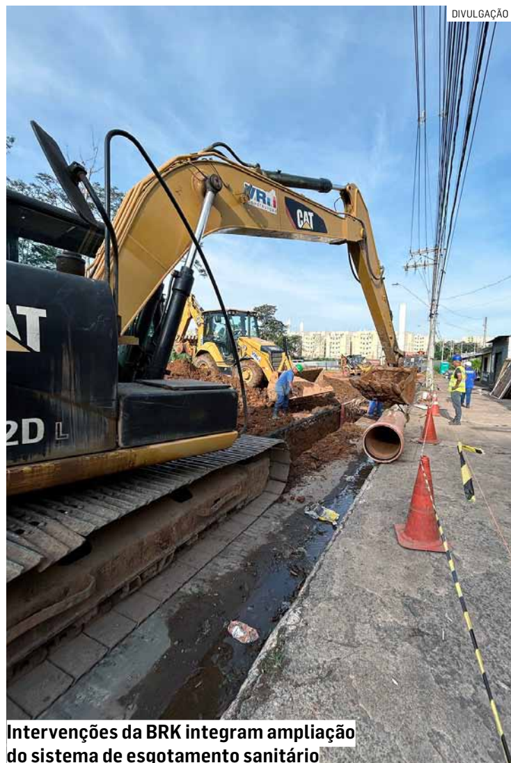
Intervenções da BRK integram ampliação do sistema de esgotamento sanitário