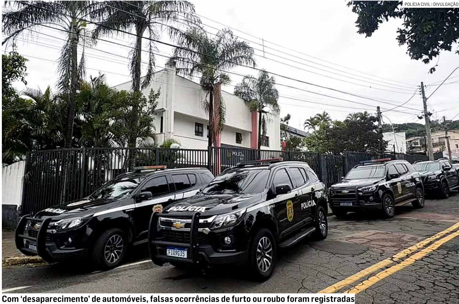
Com 'desaparecimento' de automóveis, falsas ocorrências de furto ou roubo foram registradas

Segundo as investigações, os veículos eram levados até a região de fronteira com o Paraguai, passando por Ponta Porã (MS). Após o desaparecimento dos automóveis, os proprietários registravam falsas ocorrências de furto ou roubo para acionar o seguro.