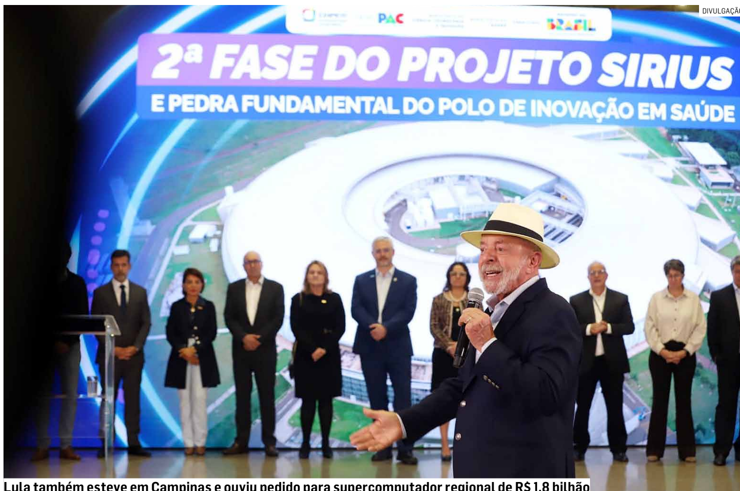
Lula também esteve em Campinas e ouviu pedido para supercomputador regional de R$ 1,8 bilhão

Parte do valor anunciado, cerca de R$ 6 bilhões, será destinada à Replan, localizada em Paulínia. A refinaria é considerada a maior unidade da Petrobras e responde pelo abastecimento de mais de 30% do território nacional. Pelo faturamento