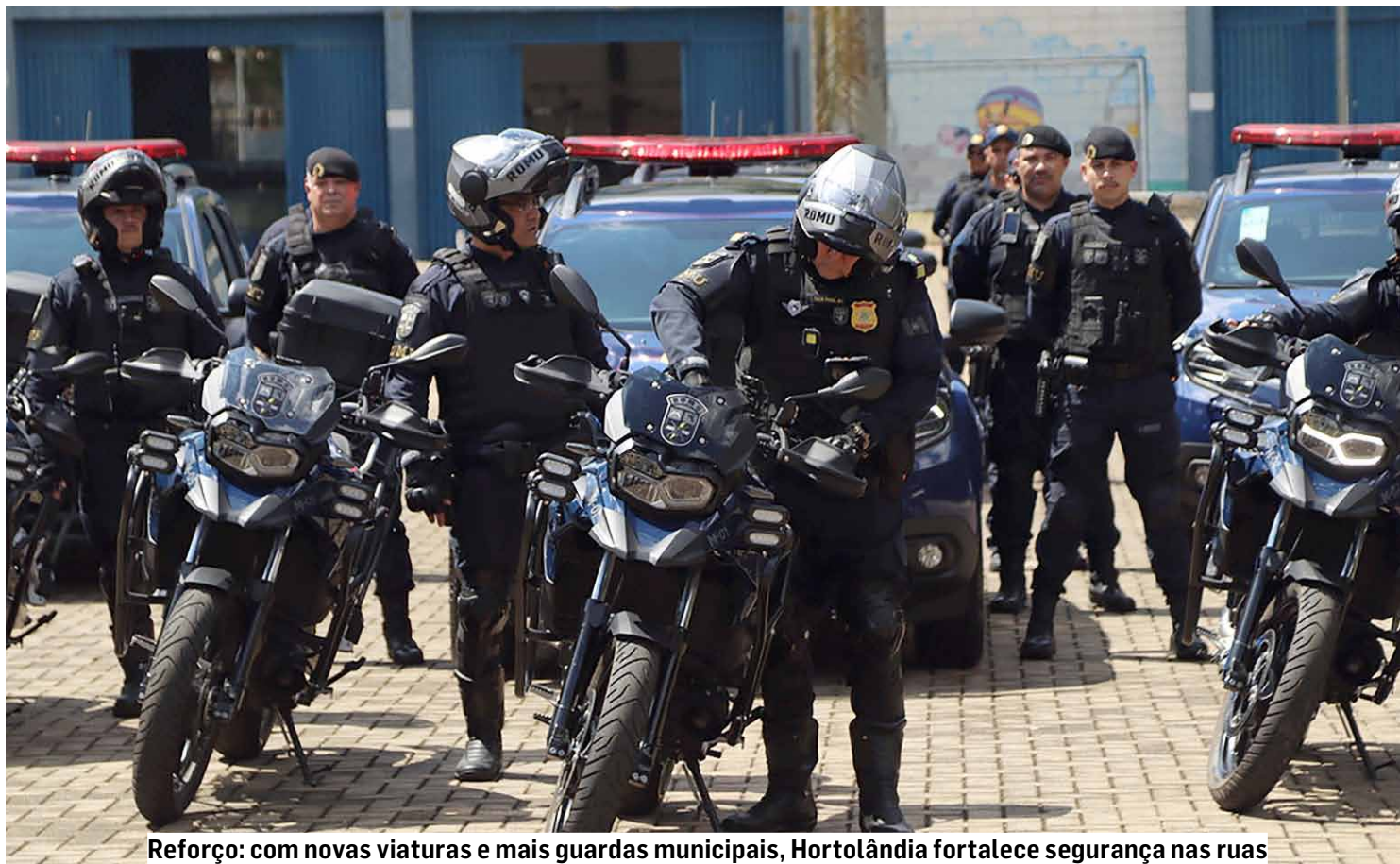
Reforço: com novas viaturas e mais guardas municipais, Hortolândia fortalece segurança nas ruas

A ronda aérea, com recursos da tecnologia, faz parte do pacote de medidas para fortalecer a segurança anunciadas pelo governo municipal em fevereiro deste ano, durante a entrega de novos veículos para a Guarda Municipal.