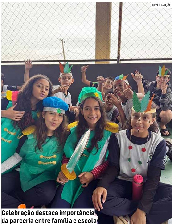
Celebração destaca importância da parceria entre família e escola

Durante a programação, os alunos apresentaram diversas atividades desenvolvidas nas oficinas oferecidas pela rede municipal, mostrando talentos artísticos, musicais e culturais trabalhados ao longo do ano letivo. As apresentações encantaram o público ao homenagear as diferentes regiões do Brasil, valorizando a diversidade cultural do país por meio de danças, músicas e manifestações típicas.