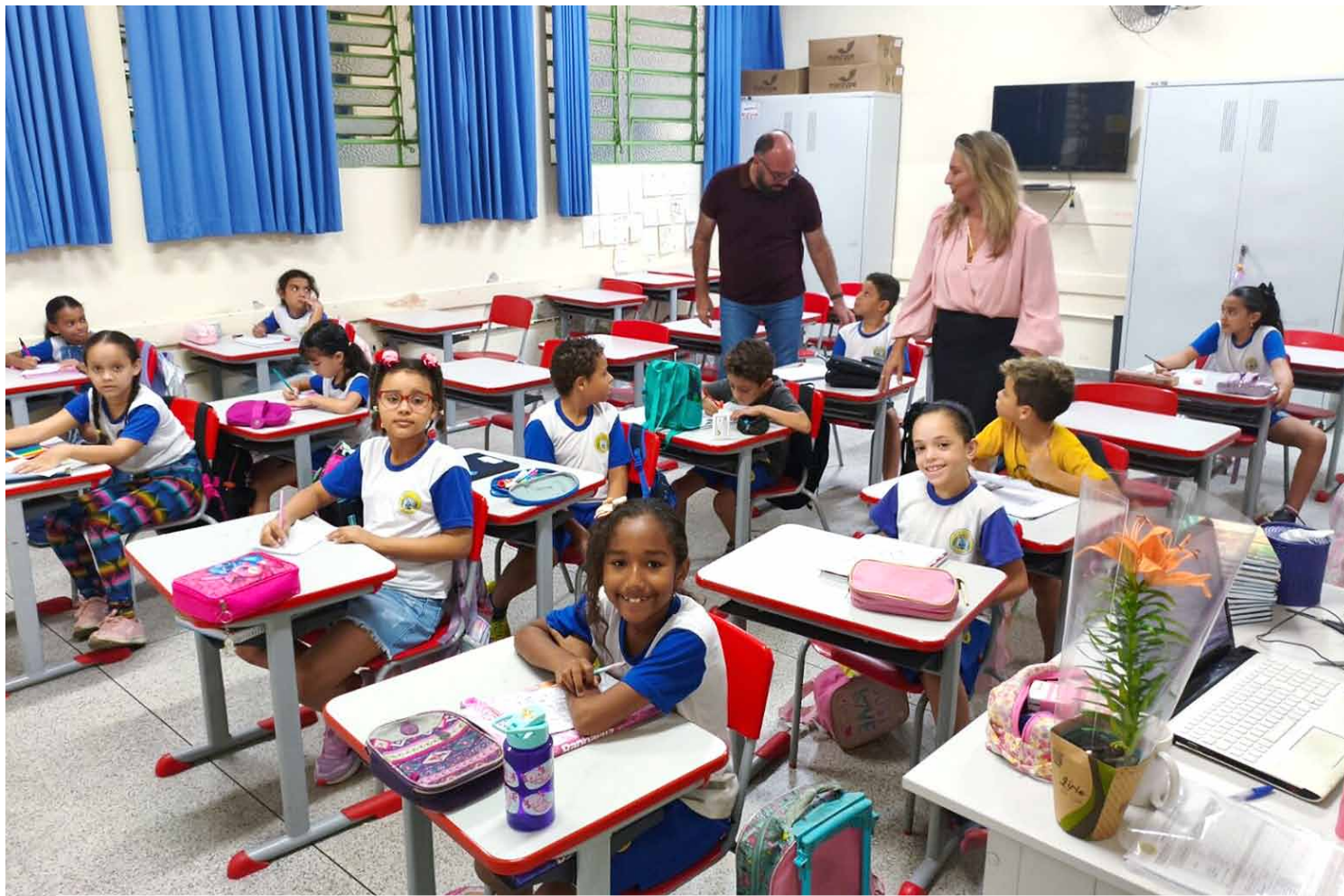
Educação Nota 10: desempenho dos alunos garantiu ao município prêmio estadual pela eficiência na alfabetização

O prêmio reconhece as unidades escolares que atingiram as metas de alfabetização e desempenho no SARESP (Sistema de Avaliação de Rendimento Escolar do Estado de São Pau-