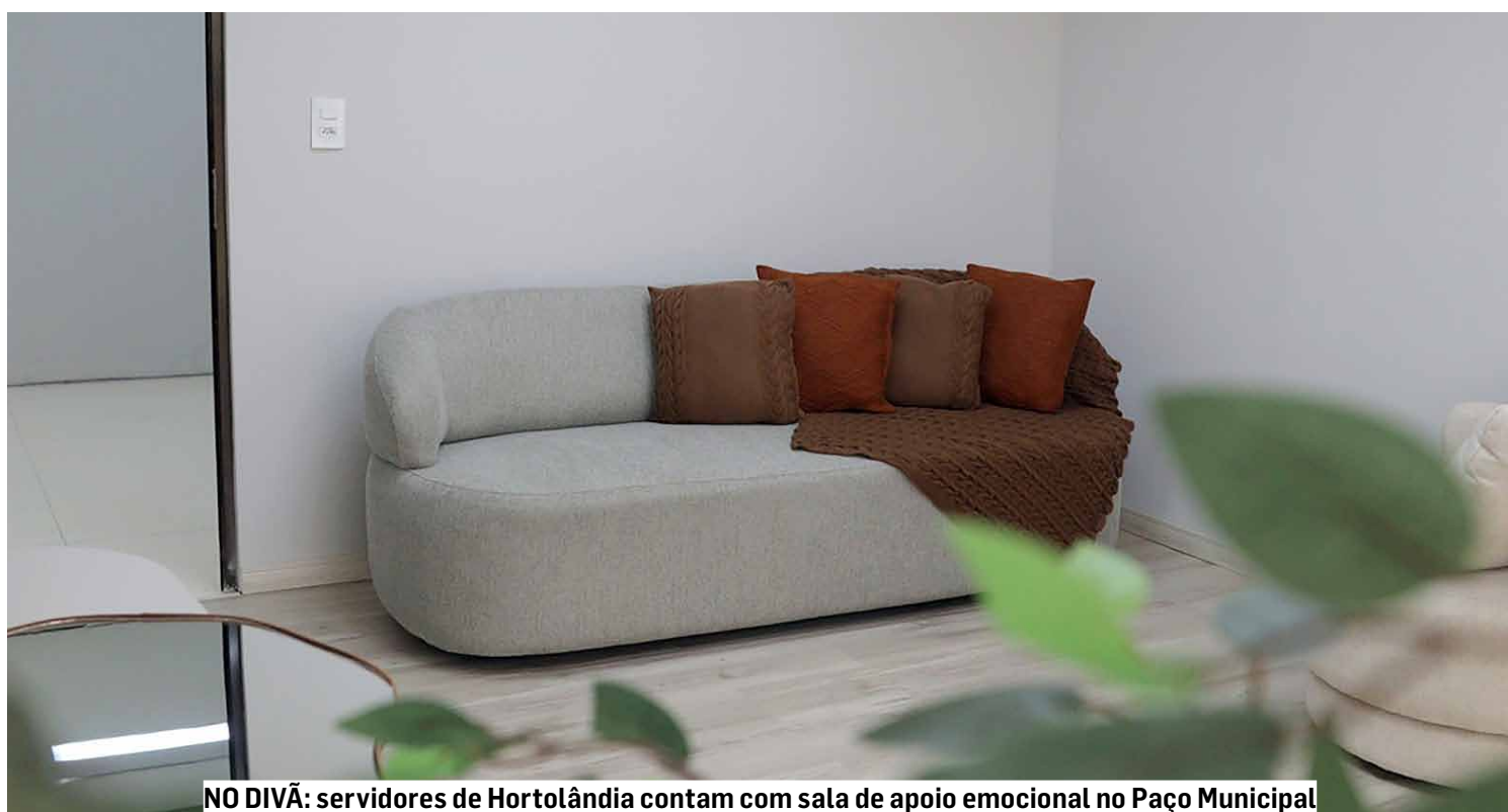
NO DIVÃ: servidores de Hortolândia contam com sala de apoio emocional no Paço Municipal

Os dois espaços fazem parte do Programa de Saú-