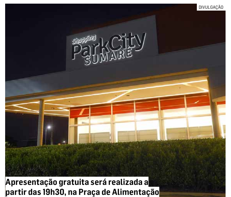
Apresentação gratuita será realizada a partir das 19h30, na Praça de Alimentação