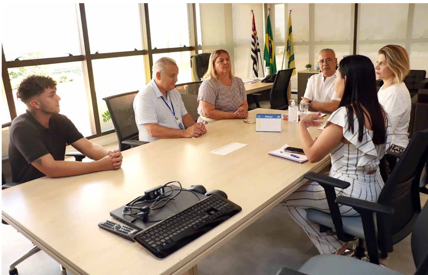
Agora, população surda tem central de Intérpretes de Libras para acessar serviços e buscar informações no Paço Municipal