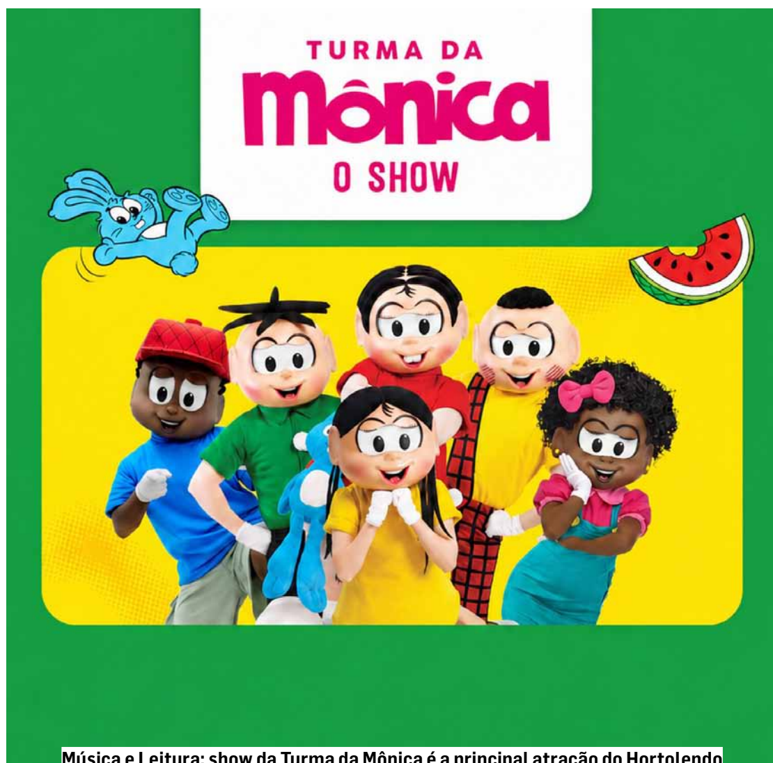
Música e Leitura: show da Turma da Mônica é a principal atração do Hortolendo

O 16º Hortolendo terá duas atrações especiais para divertir e envolver o público da tradicional festa literária: os shows da Turma da Mônica e apresentação de hip hop com o MC Paixonex. O evento será no próximo dia 31 de maio, das 11h às 17h, no Parque Socioambiental Irmã Dorothy Stang, no Jd. Nossa Senhora de Fátima.