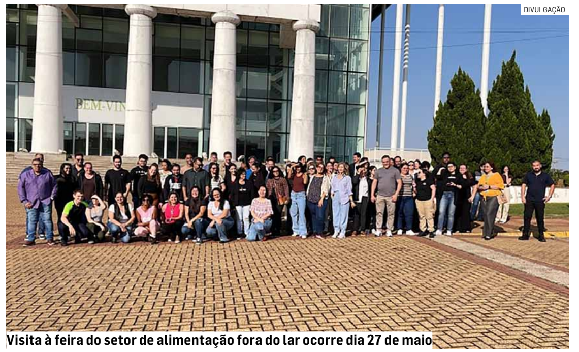
Visita à feira do setor de alimentação fora do lar ocorre dia 27 de maio

A Fispal reúne empresas, fornecedores, especialistas e profissionais do setor de alimentação, apresentando tendências, inovações e oportunidades de negócios voltadas ao mercado food service.