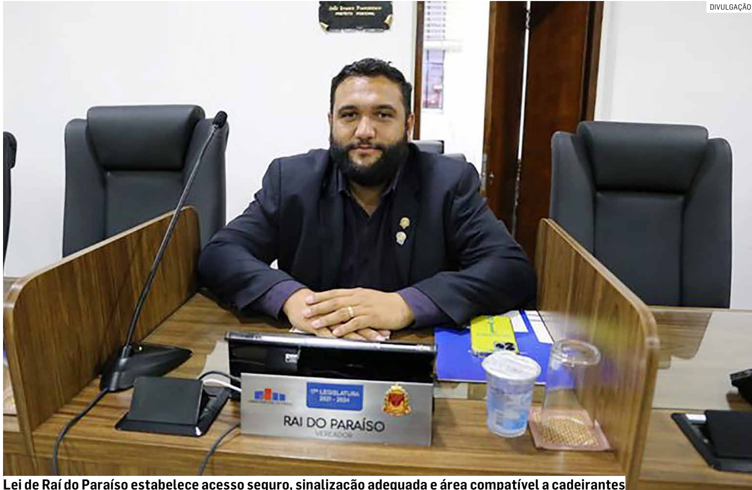
Lei de Raí do Paraíso estabelece acesso seguro, sinalização adequada e área compatível a cadeirantes

A lei também determina que os locais reservados sejam compatíveis com a permanência de cadeirantes e demais pessoas com mobilidade reduzida, respeit