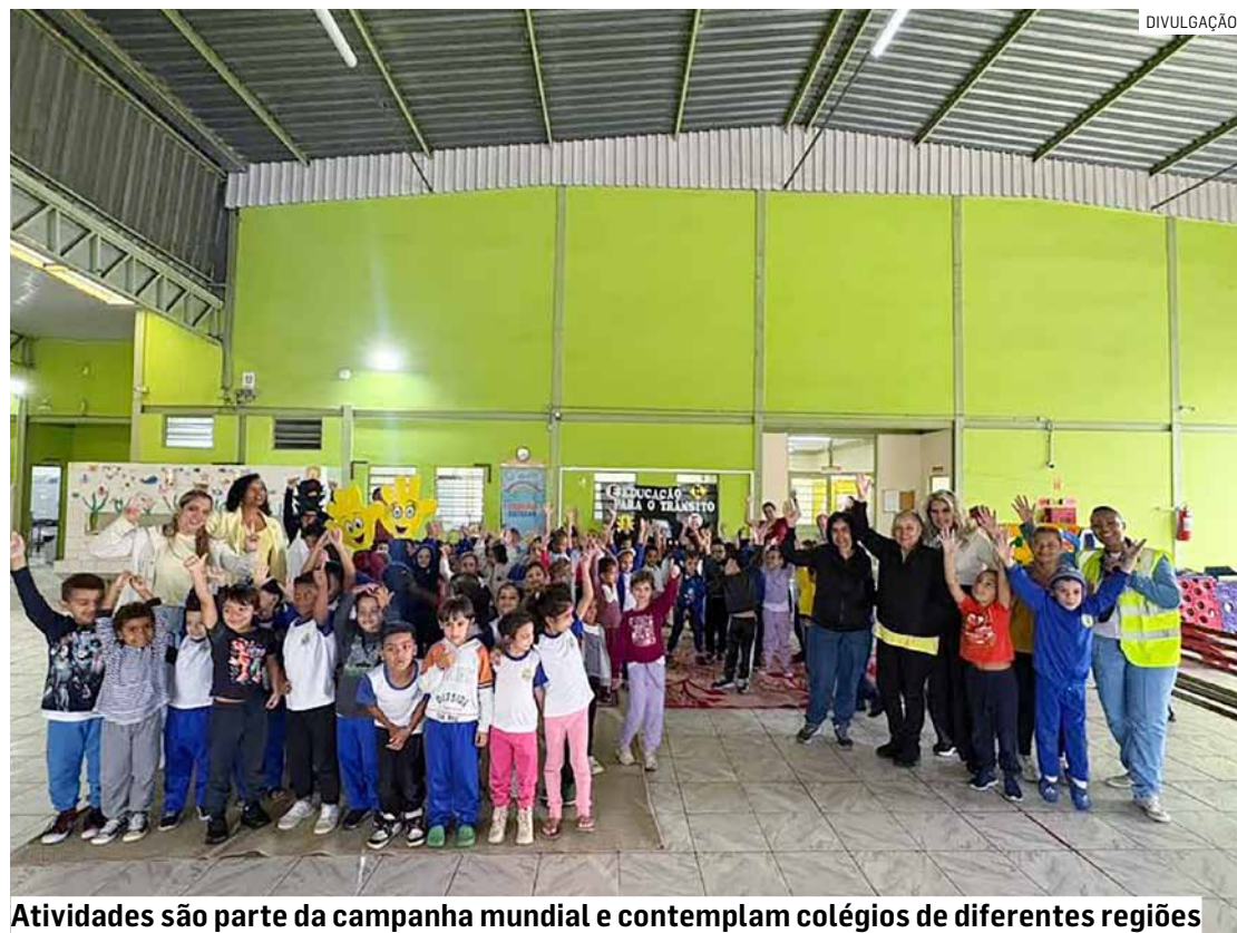
Atividades são parte da campanha mundial e contemplam colégios de diferentes regiões

Da Redação • HORTOLÂNDIA tribunaliberal@tribunaliberal.com.br