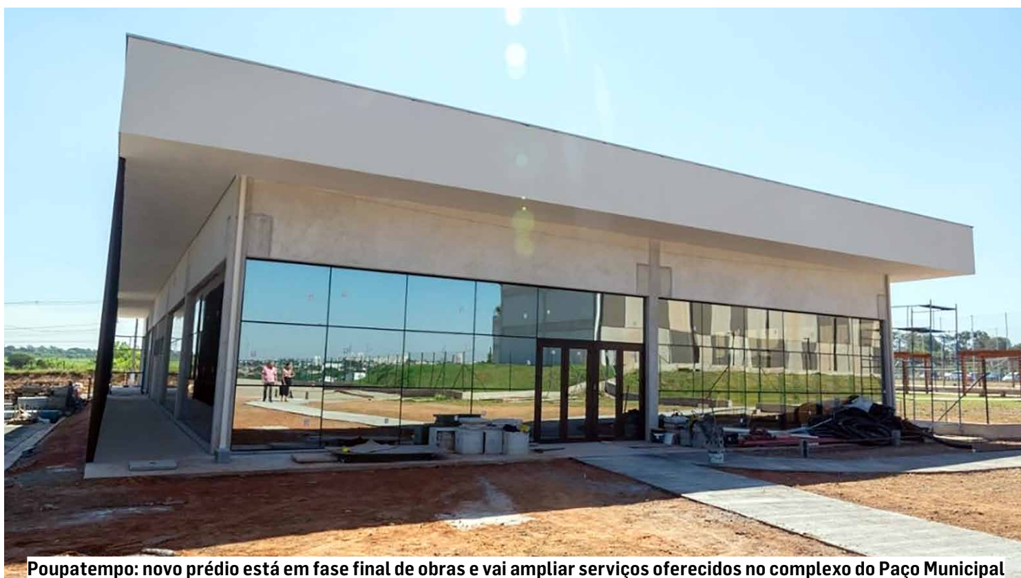
Poupatempo: novo prédio está em fase final de obras e vai ampliar serviços oferecidos no complexo do Paço Municipal

No prédio da Prefeitura, o cidadão já encontra atendimentos para serviços relacionados à IPTU (Imposto Predial Territorial Urbano), PAT (Posto de Atende-