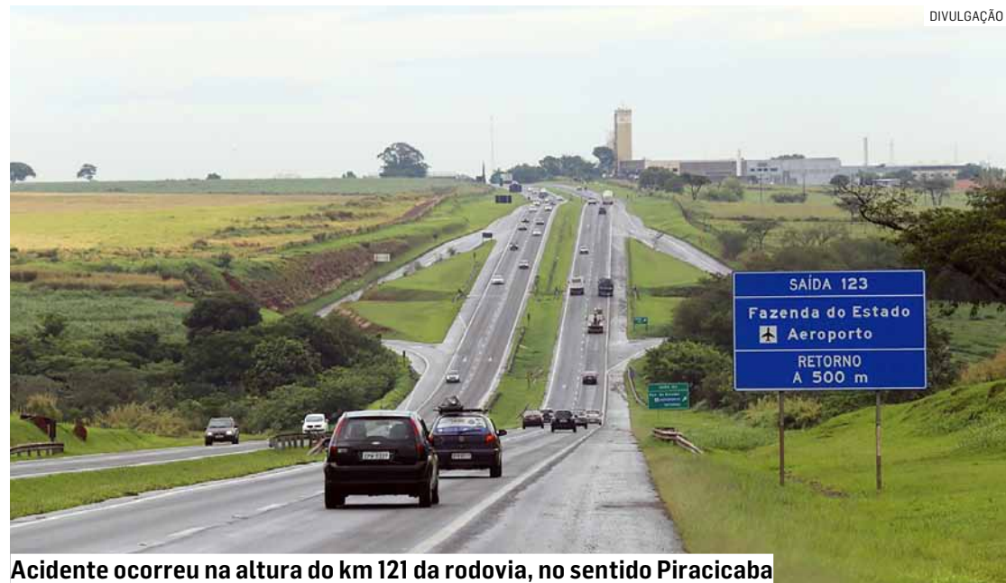
Acidente ocorreu na altura do km 121 da rodovia, no sentido Piracicaba

Cézar Oliveira • AMERICANA tribunaliberal@tribunaliberal.com.br