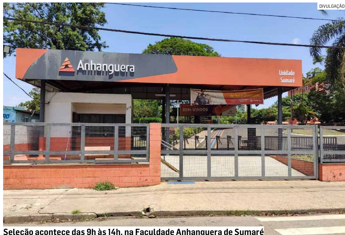
Seleção acontece das 9h às 14h, na Faculdade Anhanguera de Sumaré

A organização reforça a importância de que os candidatos realizem previamente o cadastro por meio dos links disponibilizados,