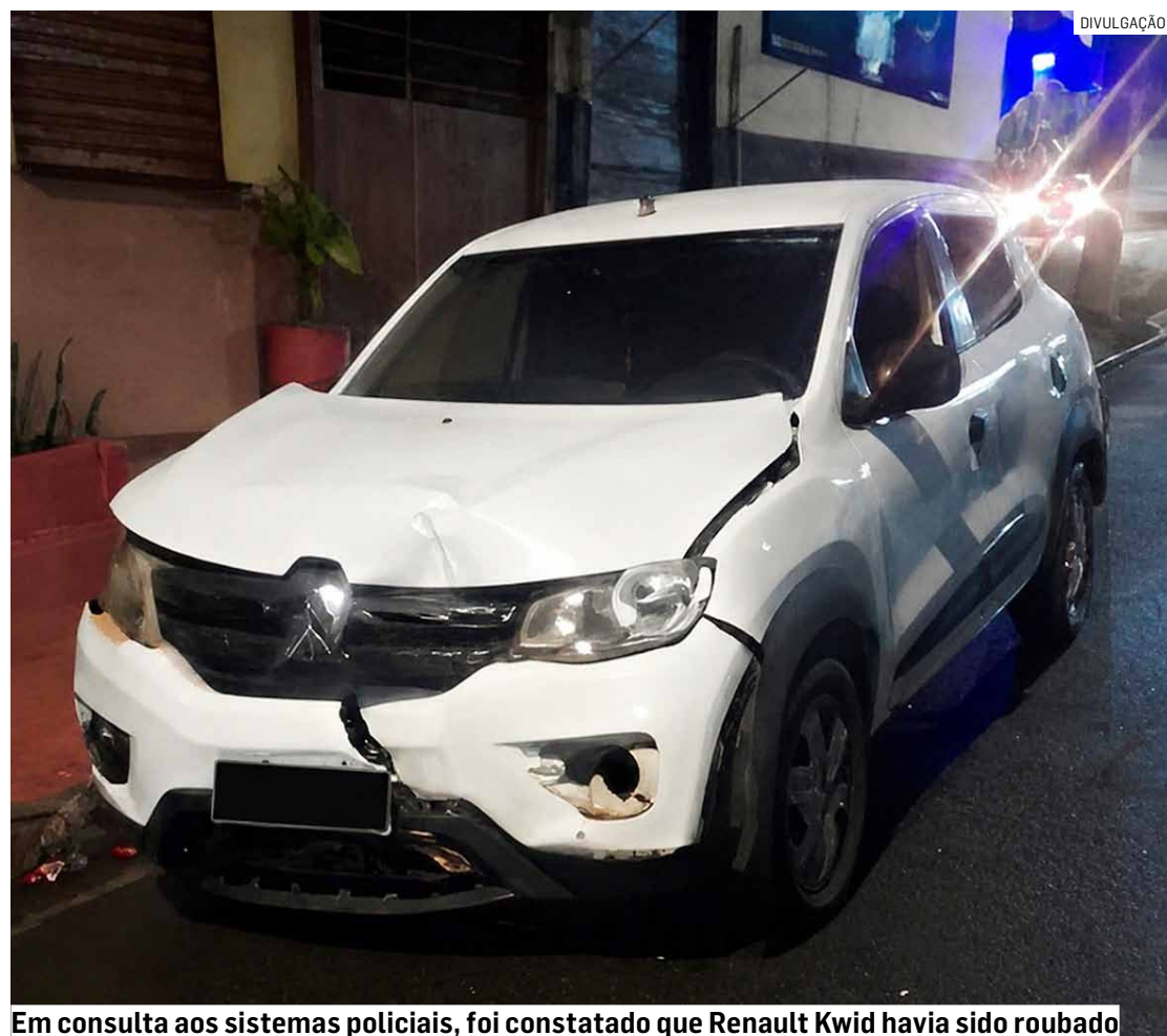
Em consulta aos sistemas policiais, foi constatado que Renault Kwid havia sido roubado

O caso foi registrado como embriaguez ao volante, roubo e lesão corporal culposa na direção de veículo automotor. O homem permaneceu preso e à disposição da Justiça.