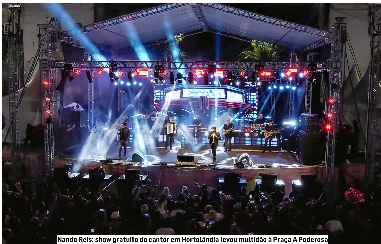
Nando Reis: show gratuito do cantor em Hortolândia levou multidão à Praça A Poderosa

“A cultura deixou de ser algo concentrado apenas em datas específicas. Hoje temos um calendário cultural ativo durante todo o ano, com grandes shows, festivais, oficinas, apresentações e ações comunitárias. Isso fortalece a identidade cultural da cidade e aproxima ainda mais a população dos espaços públicos e transforma Hortolândia em referência cultural