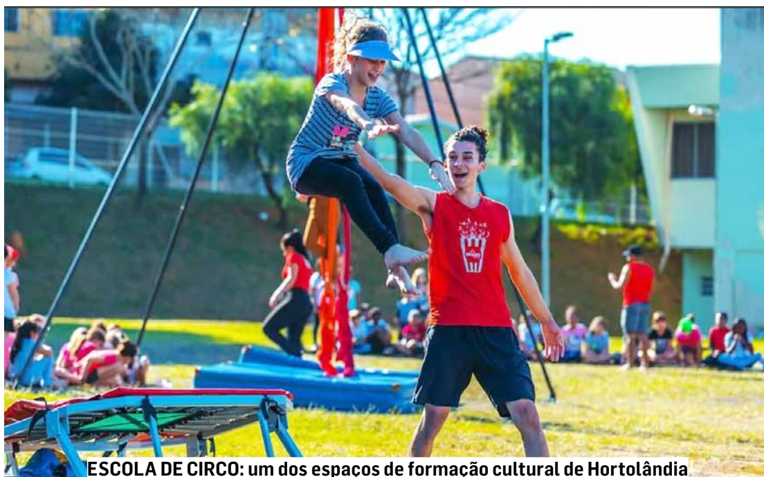
ESCOLA DE CIRCO: um dos espaços de formação cultural de Hortolândia

De acordo com a Secretaria de Cultura, mais de 3 mil alunos são atendidos nas formações culturais oferecidas pela Prefeitura em diversos espaços.