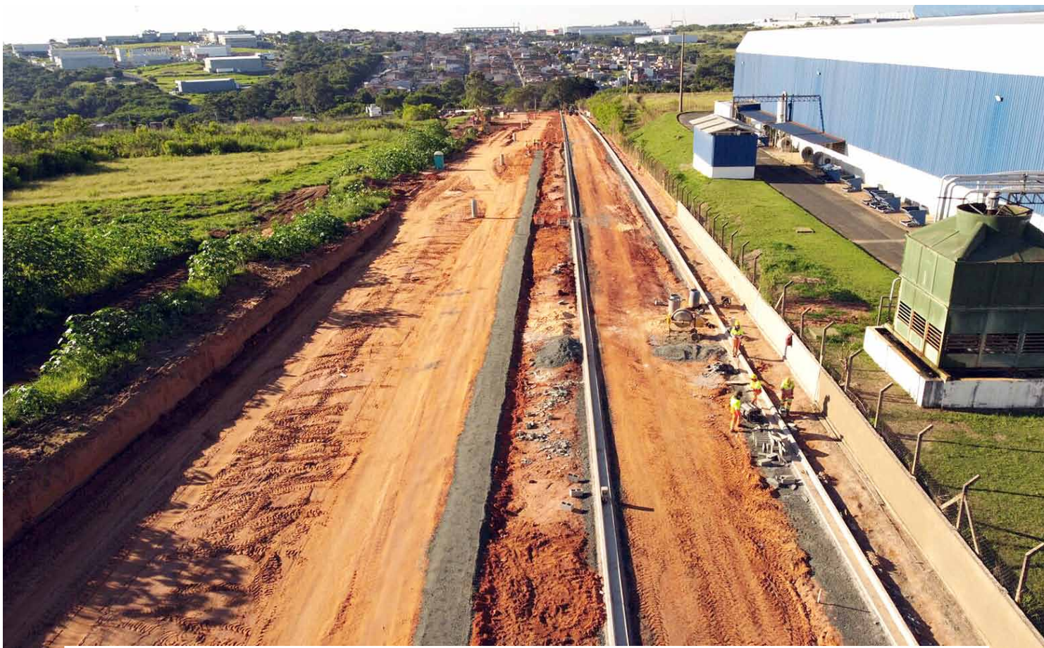
Avenida Panaíno: com as obras de prolongamento, via terá 4 km de extensão e integrará várias regiões da cidade

Para acompanhar o desenvolvimento urbano de Hortolândia, a Prefeitura realiza investimentos robustos na área da mobilidade. O município avança na obra de prolongamento da avenida Panaíno, sentido Jd. Nova Europa.