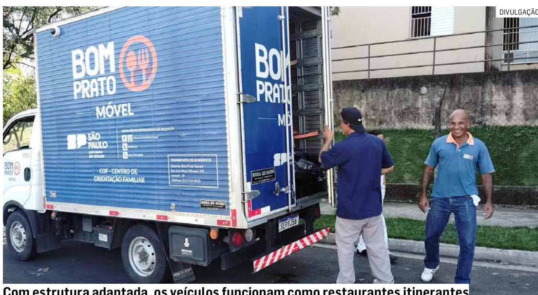
Com estrutura adaptada, os veículos funcionam como restaurantes itinerantes

Moradores do Jardim Conceição e do Parque Itália, em Sumaré, estão sendo beneficiados com a presença da unidade do Programa Bom Prato Móvel, que oferece refeições a baixo custo e contribui para a segurança alimentar da população. No Parque Itália, o Bom Prato estará na Rua Palmares, 155, das 11h às 12h. Já no Jardim Conceição, o