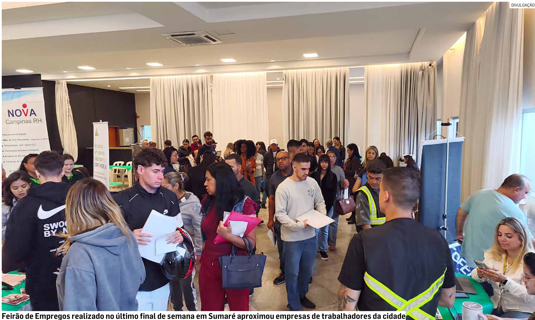
Feirão de Empregos realizado no último final de semana em Sumaré aproximou empresas de trabalhadores da cidade

A melhor colocada da região foi Sumaré, que terminou o trimestre na 11ª posição estadual e na 2ª colocação da Região Metropolitana de Campinas (RMC), atrás apenas de Campinas. O município registrou saldo positivo de 2.891 empregos formais, resultado de 12.856 admissões contra 9.965 desligamentos.