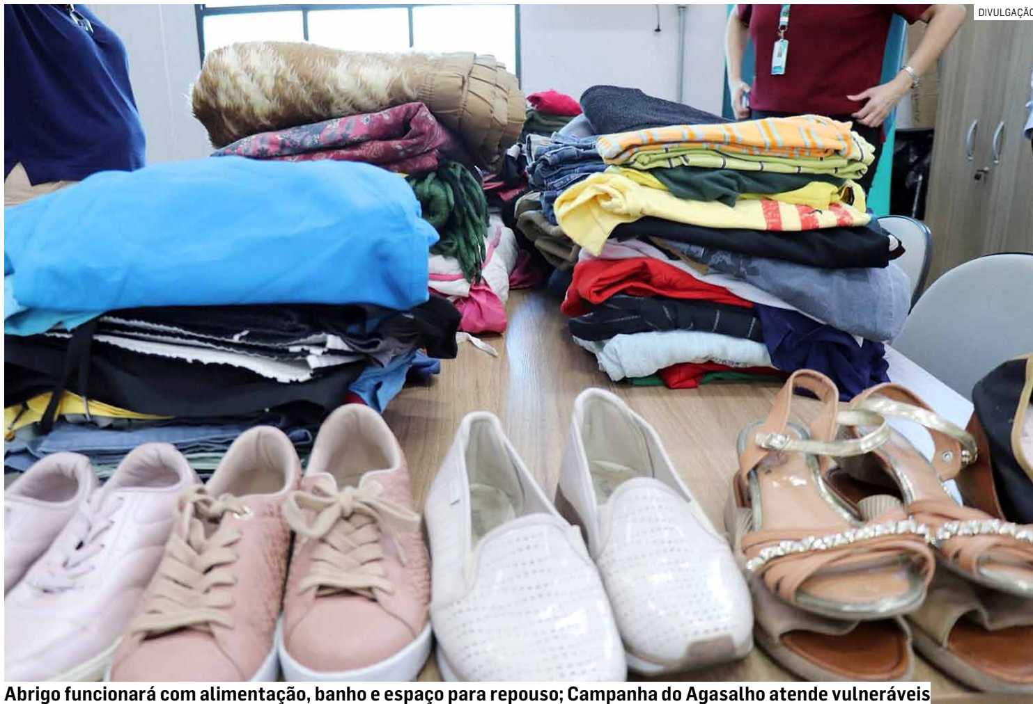
Abriço funcionará com alimentação, banho e espaço para repouso; Campanha do Agasalho atende vulneráveis

De acordo com o decreto, o projeto será coordenado pela Secretaria Municipal de Desenvolvimento Econômico e Social, em conjunto com o Fundo Social de Solidariedade, Secretaria de Saúde e Secretaria de Segurança, podendo ainda contar com apoio de mais órgãos públicos, entidades da sociedade civil, instituições religiosas, empresas e voluntários.