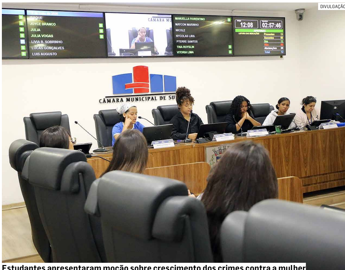
Estudantes apresentaram moção sobre crescimento dos crimes contra a mulher