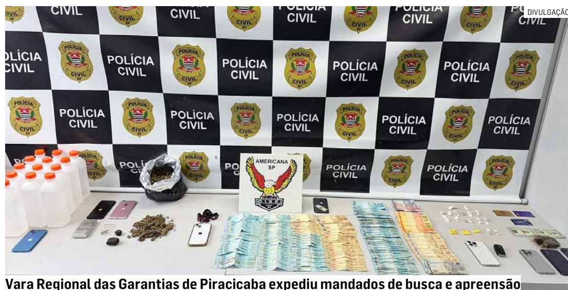
Vara Regional das Garantias de Piracicaba expediu mandados de busca e apreensão

Segundo a Dise, as apurações começaram após denúncias e informações relacionadas à intensa movimentação suspeita em um dos apartamentos do condomínio. Durante as investigações, os policiais identificaram sete pessoas diretamente ligadas ao esquema criminoso de comercialização e distribuição de entorpecentes.