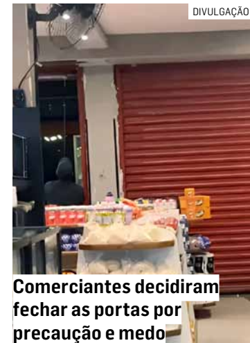
Comerciantes decidiram fechar as portas por precaução e medo

Após o barulho do tiro, pessoas que estavam nas ruas buscaram abrigo e alguns comerciantes decidiram fechar as portas por precaução. Uma padaria localizada nas pro-