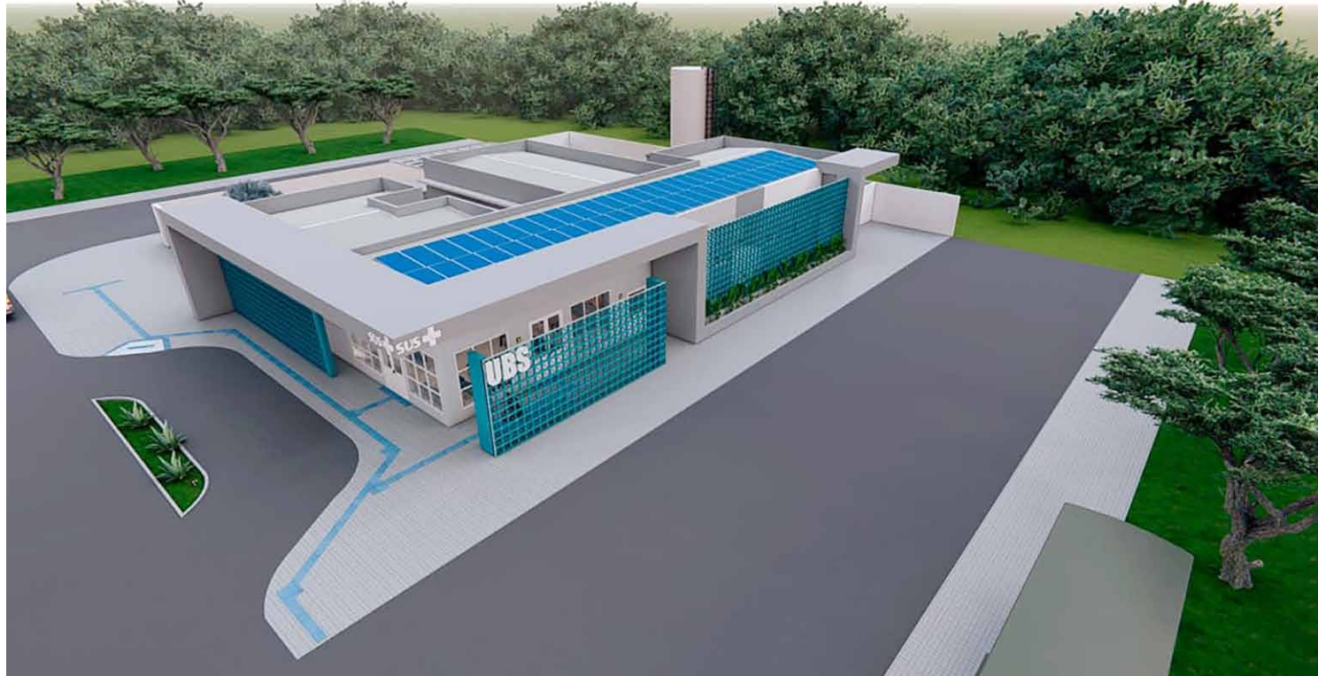
TERRAS DE SANTA MARIA: imagem projetada pelo Ministério da Saúde da UBS de grande porte já em construção no bairro

De acordo com o prefeito Zezé Gomes, a construção da unidade acompanha o crescimento da cidade. “Hortolândia cresce com planejamento e de forma sustentável. Nossa rede municipal de saúde precisa acompanhar esse crescimento, ofertando novos espaços para atendimento público e fortalecendo o trabalho de prevenção realizado com excelência pelas equipes de saúde da família”, destacou o prefeito.