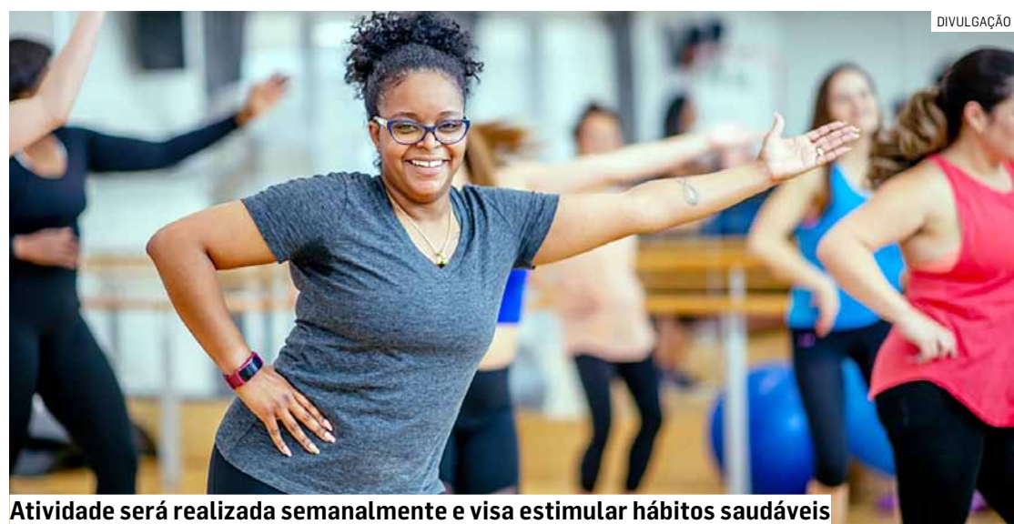
Atividade será realizada semanalmente e visa estimular hábitos saudáveis

além de contribuir para a prevenção de doenças e melhoria da saúde física e mental dos participantes. A prefeitura reforçou a importância da prática regular de exercícios físicos como aliada na promoção da saúde e na melhoria da qualidade de vida da comunidade.