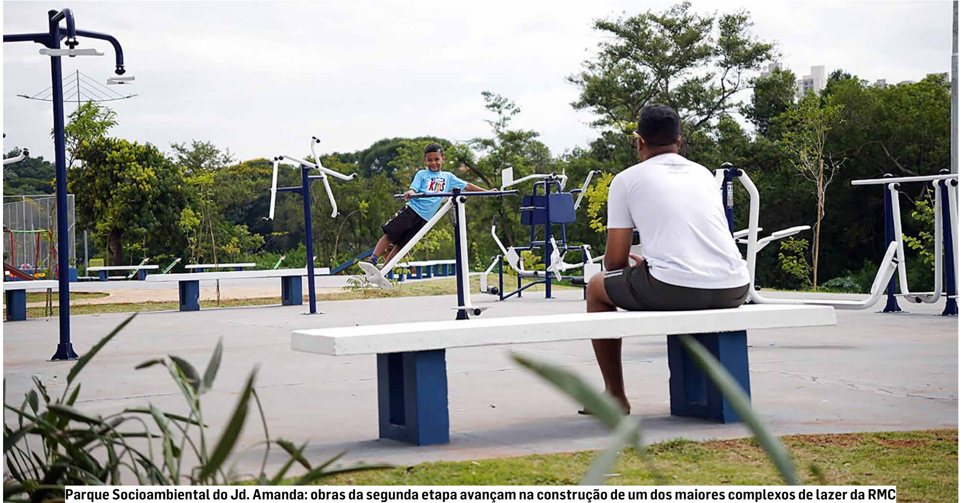
Parque Socioambiental do Jd. Amanda: obras da segunda etapa avançam na construção de um dos maiores complexos de lazer da RMC

Segundo a Prefeitura, quando estiver pronto, o parque socioambiental do Jardim Amanda será um dos maiores da RMC (Região Metropolitana de Campinas) com 385 mil m 2 de área de lazer e quase 6 quilômetros de extensão.