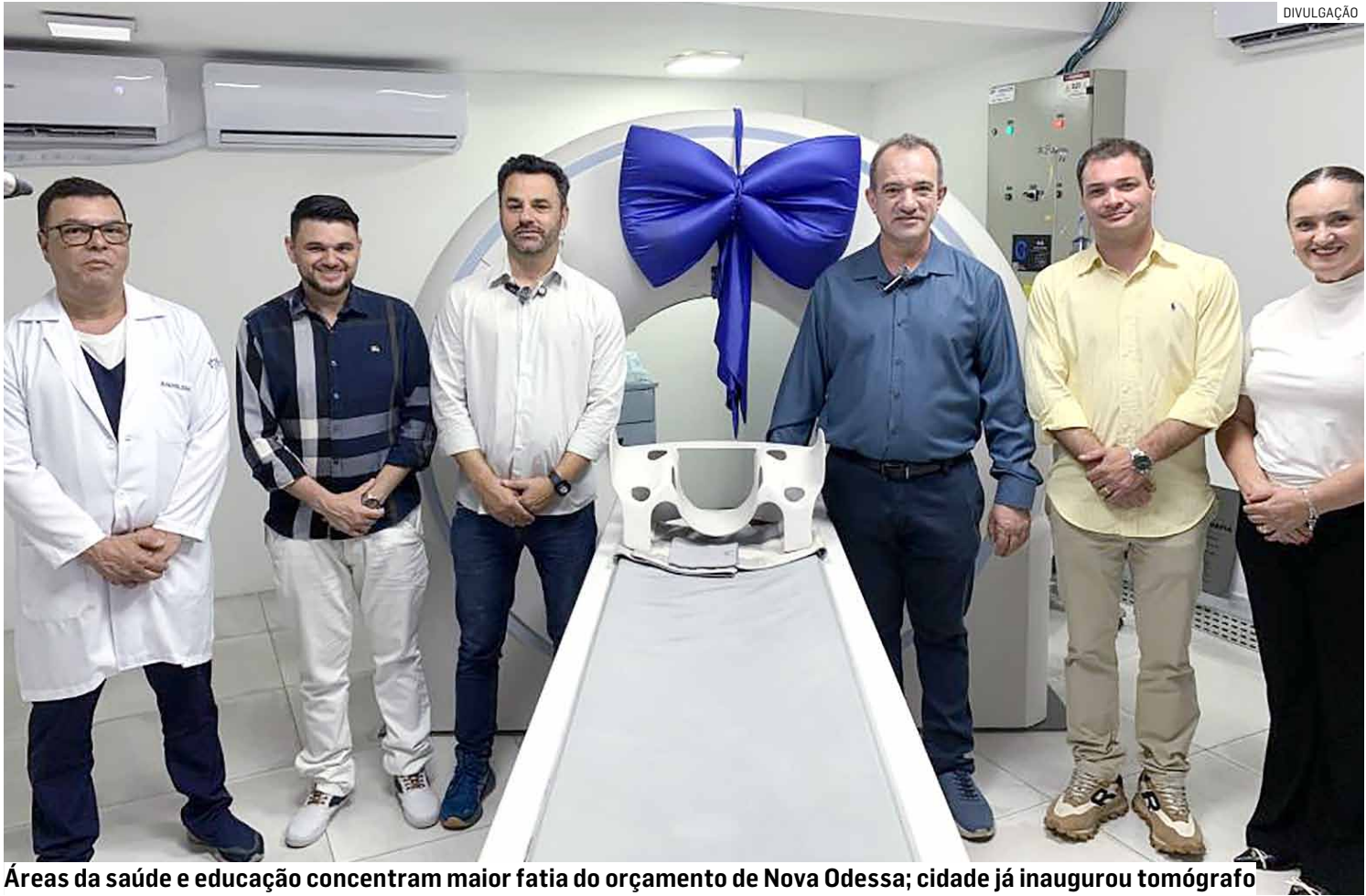
Áreas da saúde e educação concentram maior fatia do orçamento de Nova Odessa; cidade já inaugurou tomógrafo

De acordo com o texto, a receita municipal será obtida por meio da arrecadação de tributos, rendas e outras fontes correntes e de capital. Já as despesas estão distribuídas por função de governo e categoria econômica.