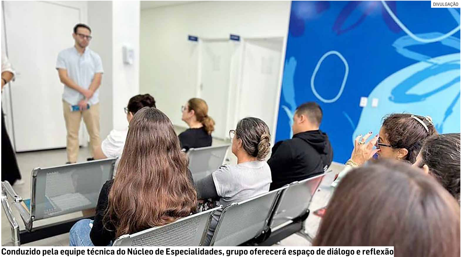
Conduzido pela equipe técnica do Núcleo de Especialidades, grupo oferecerá espaço de diálogo e reflexão

O projeto é uma iniciativa da Prefeitura de Americana, por meio da Secretaria de Saúde, e será conduzido pela equipe técnica do Núcleo de Especialidades. Os encontros acontecerão quinzenalmente, sempre às quintas-feiras, das 10h às 11h, no próprio Espaço TEA (Rua Goiânia, 80 - Vila Nossa Senhora de Fátima). Não é necessário