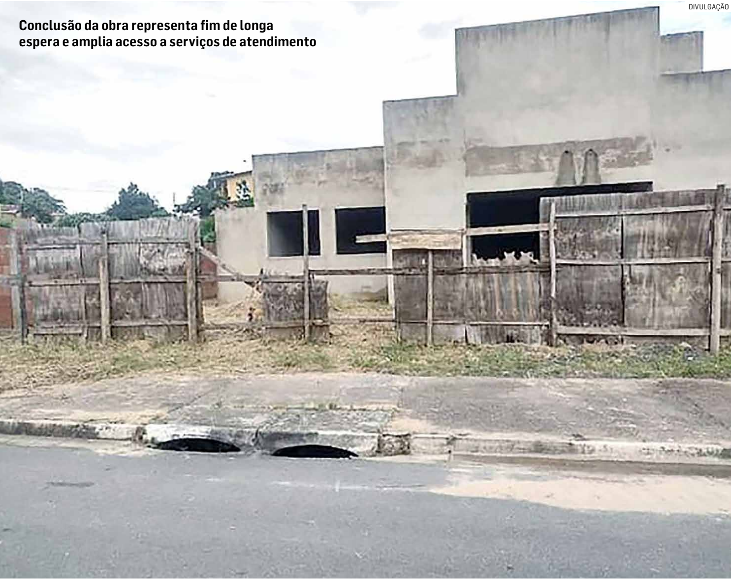
Conclusão da obra representa fim de longa espera e amplia acesso a serviços de atendimento