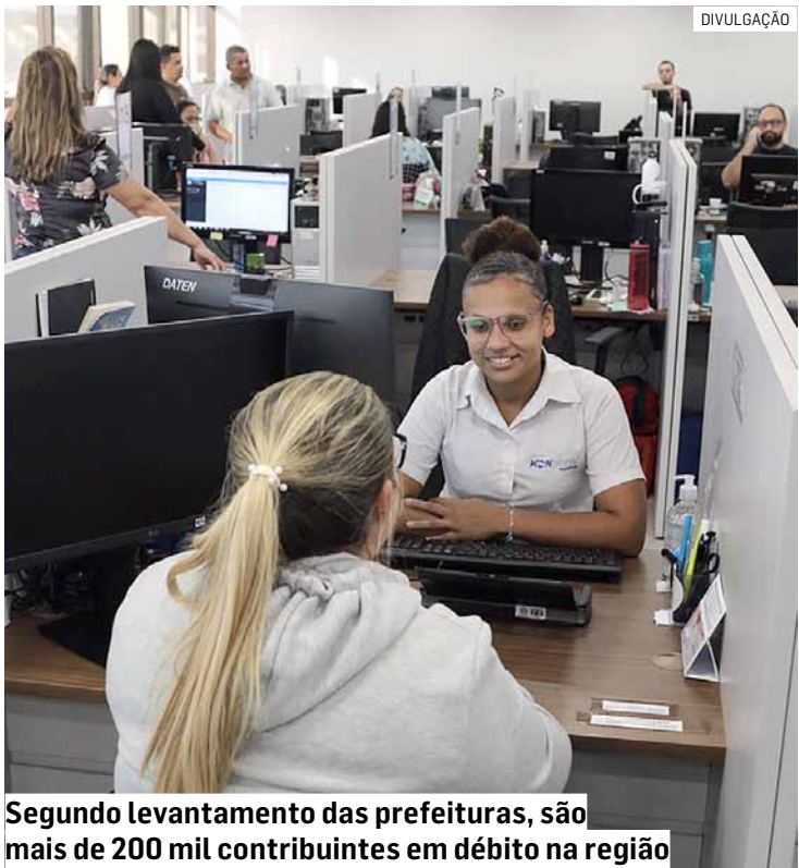
Segundo levantamento das prefeituras, são mais de 200 mil contribuintes em débito na região