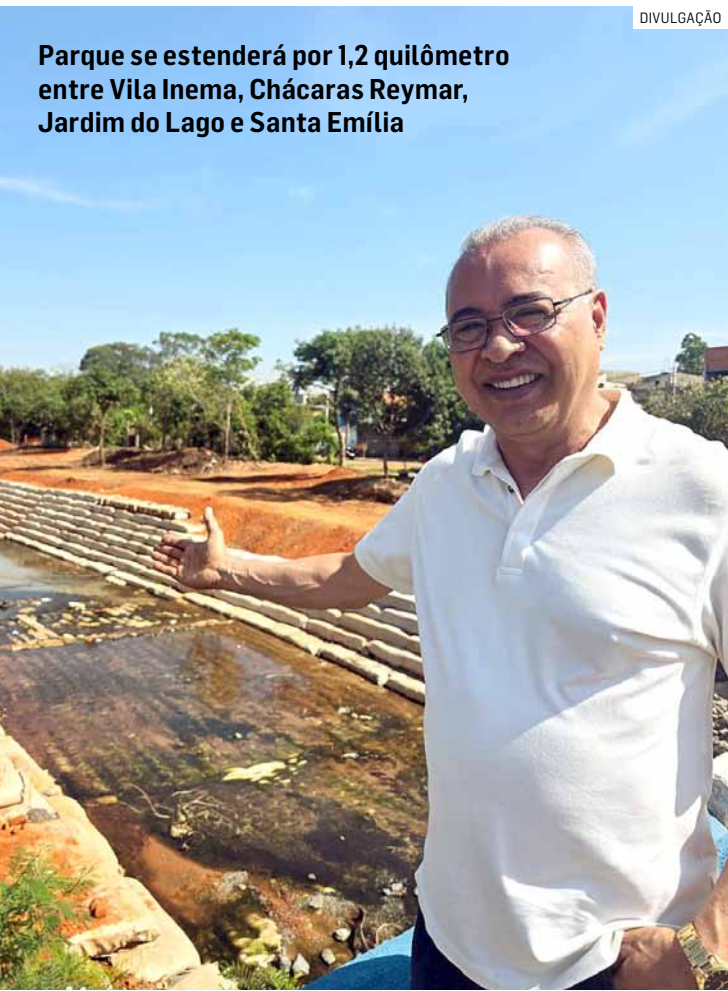
Parque se estenderá por 1,2 quilômetro entre Vila Inema, Chácaras Reymar, Jardim do Lago e Santa Emília

O futuro parque, que se estenderá por 1,2 quilômetro entre os bairros Vila Inema, Chácaras Reymar, Jardim do Lago e Santa Emília, representa um novo marco de integração entre infraestrutura, meio ambiente e qualidade de vida. No passado, a área era ocupada por construções irregulares às