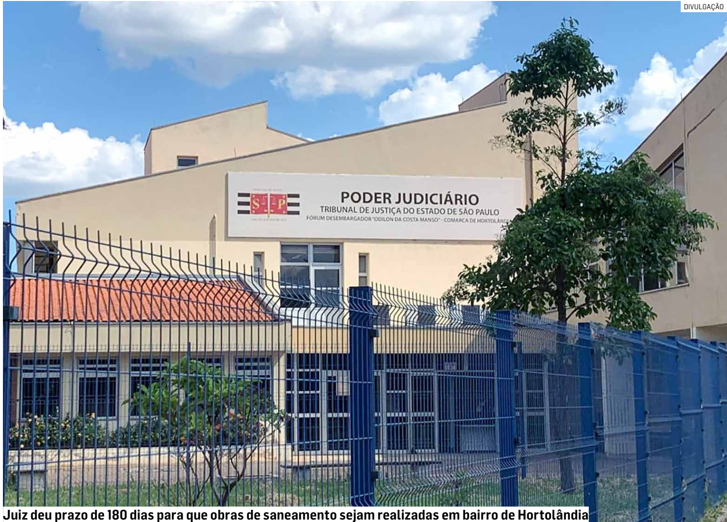
Juiz deu prazo de 180 dias para que obras de saneamento sejam realizadas em bairro de Hortolândia

O ambiente descrito também é infestado de moscas e mosquitos, in-