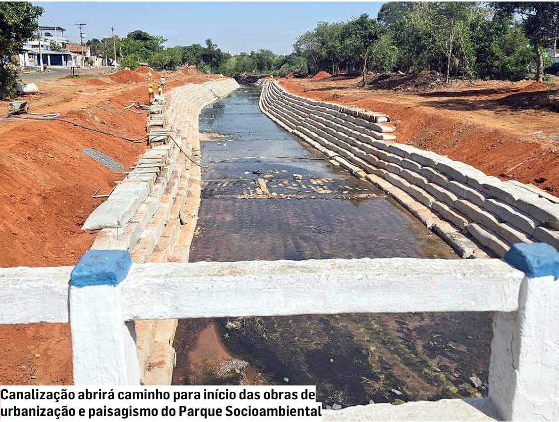
Canalização abrirá caminho para início das obras de urbanização e paisagismo do Parque Socioambiental

A canalização do Ribeirão Jacuba compreende 232 metros de extensão, dos quais cerca de 200 metros já foram executados entre as ruas Carmen Savala e Dorvalino Bueno, até a ponte da Avenida Antônio Ferreira Ariel. O trecho final, de aproximadamente 32 metros, segue em andamento em direção ao Jardim do Lago. A concretagem da base e as estruturas de contenção estão sendo concluídas, com o objetivo de prevenir enchentes, melhorar o escoamento das águas pluviais e preparar o solo para as etapas seguintes do projeto urbanístico.