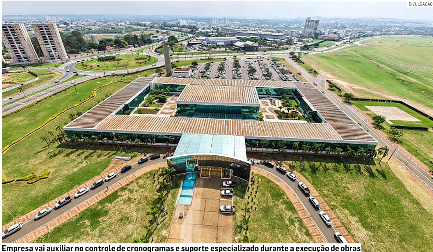
Empresa vai auxiliar no controle de cronogramas e suporte especializado durante a execução de obras

De acordo com o edital da Concorrência Eletrônica 5/2026, as empresas interessadas poderão en-