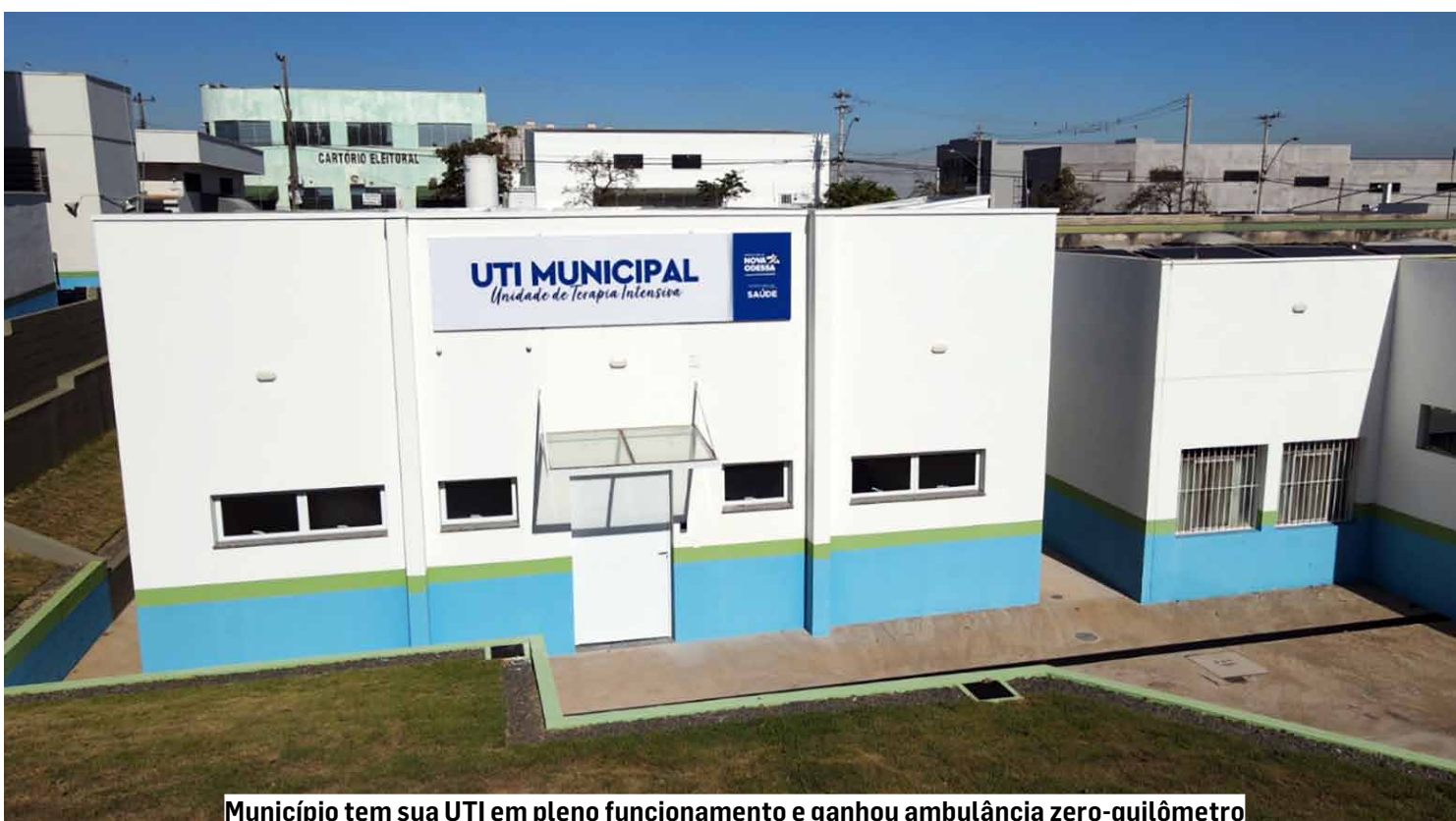
Município tem sua UTI em pleno funcionamento e ganhou ambulância zero-quilômetro