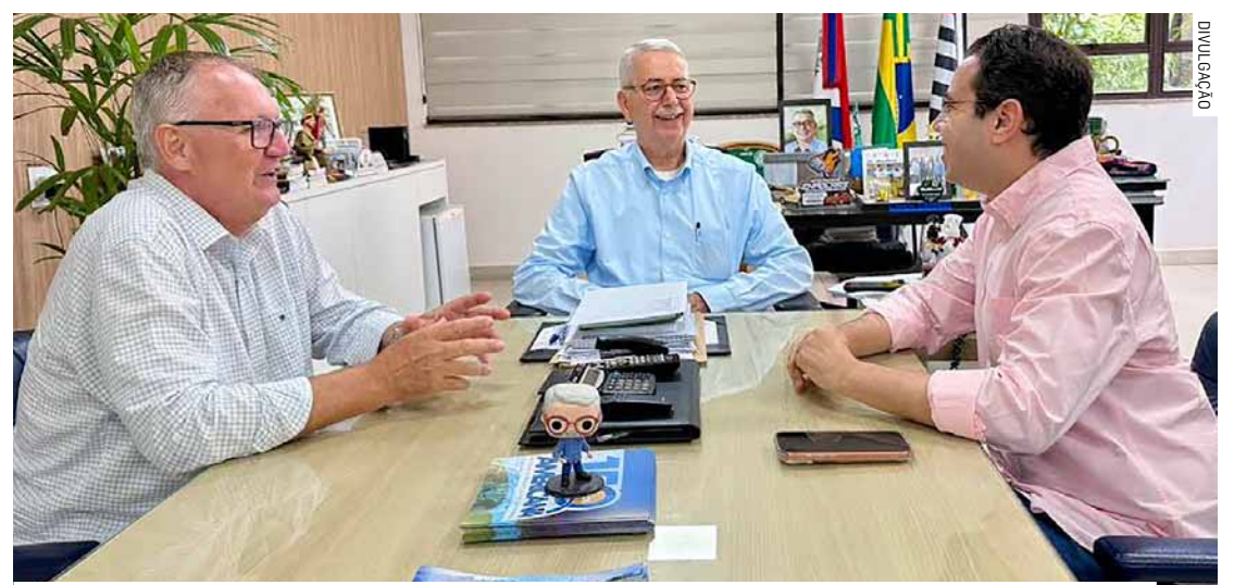
Secretaria de Educação quer aumentar total de cuidadores nas escolas de 160 para 200

Da Redação • AMERICANA tribunaliberal@tribunaliberal.com.br