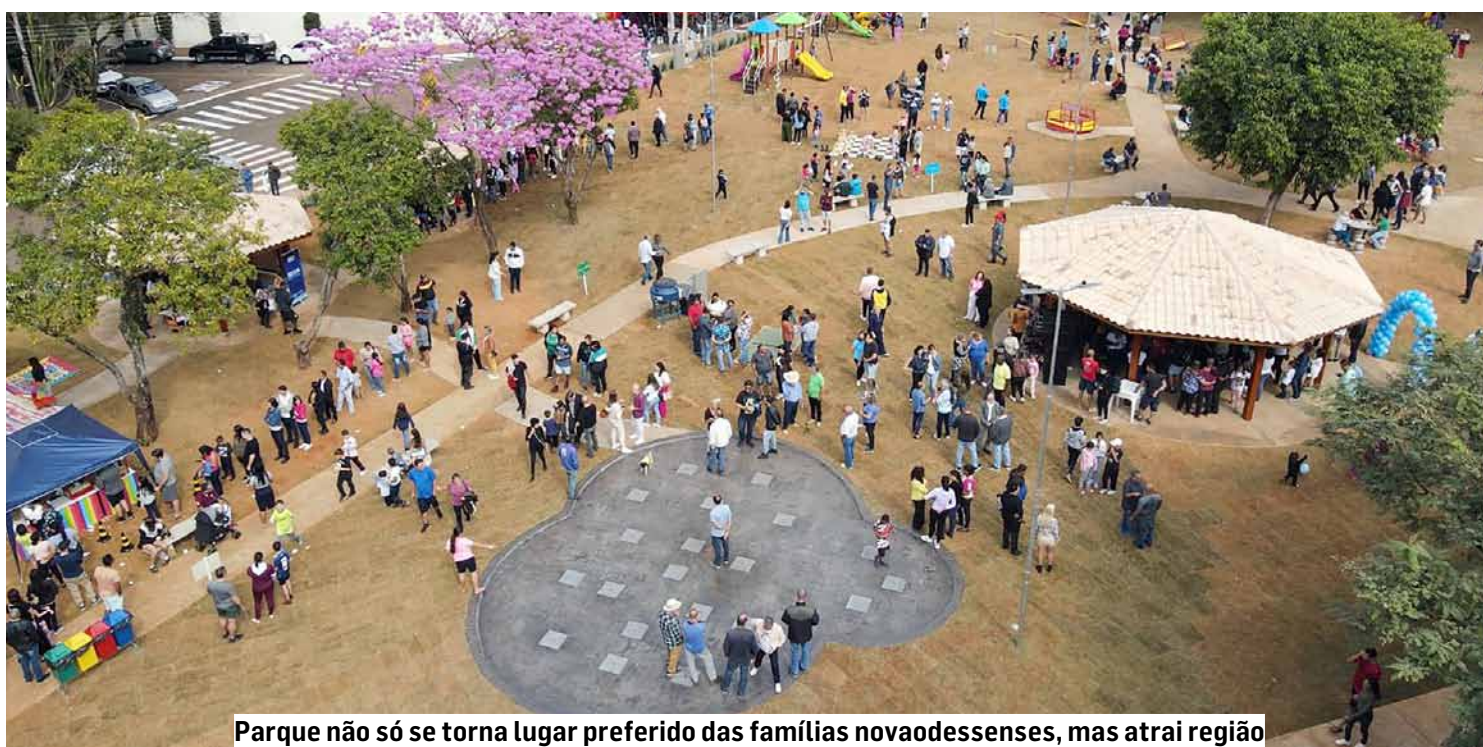
Parque não só se torna lugar preferido das famílias novaodessenses, mas atrai região

O sucesso foi imediato e avassalador. O parque não só se tornou um lugar preferido das famílias novaodessenses, mas passou a atrair visitantes de toda a região, comprovando a importância de se investir em lazer público de alto nível. E para reforçar sua vocação como polo cultural, o espaço já sedia uma programação diversificada, com