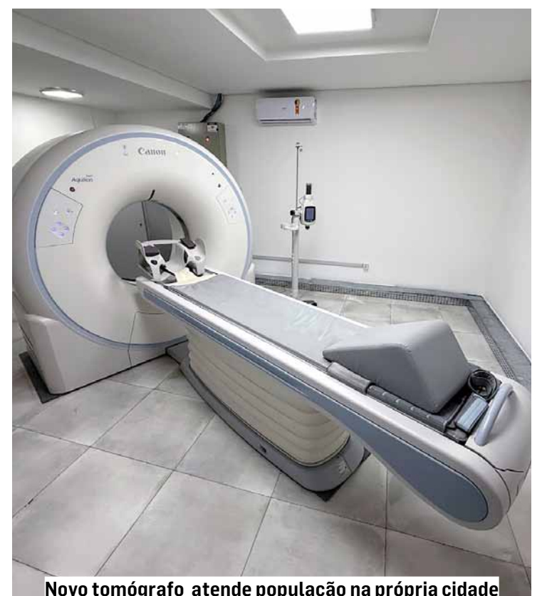
Novo tomógrafo atende população na própria cidade

Nos últimos anos, a saúde municipal deu um salto que antes parecia distante. A Unidade de Terapia Intensiva (UTI) própria, com cinco leitos de alta complexidade, já salvou centenas de vidas, evitando remoções de risco para outras cidades. Em 2025, entrou em operação o Serviço de Tomografia no Hospital Municipal, equipamento essencial para diagnósticos rápidos