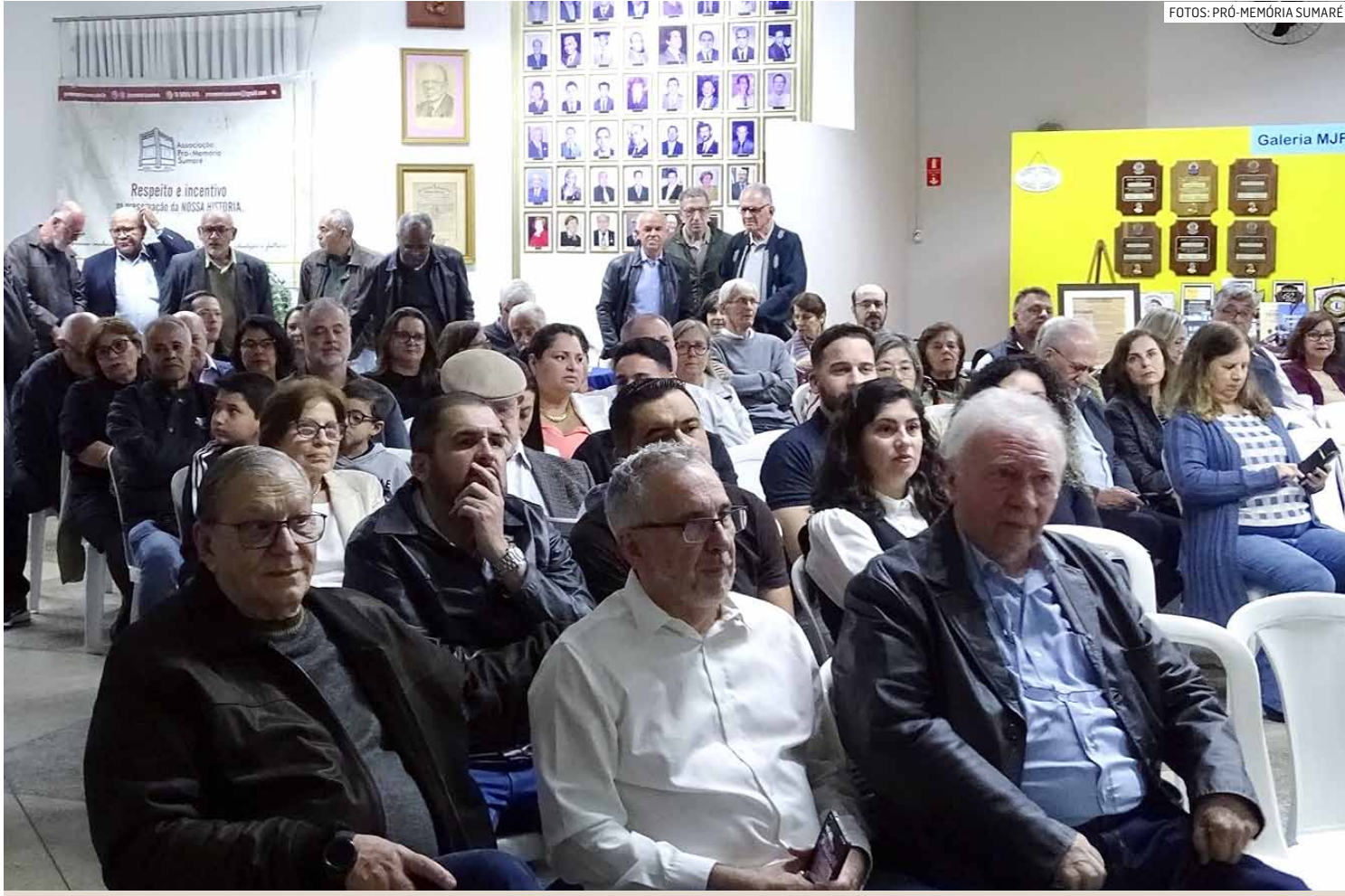
Foto geral do evento