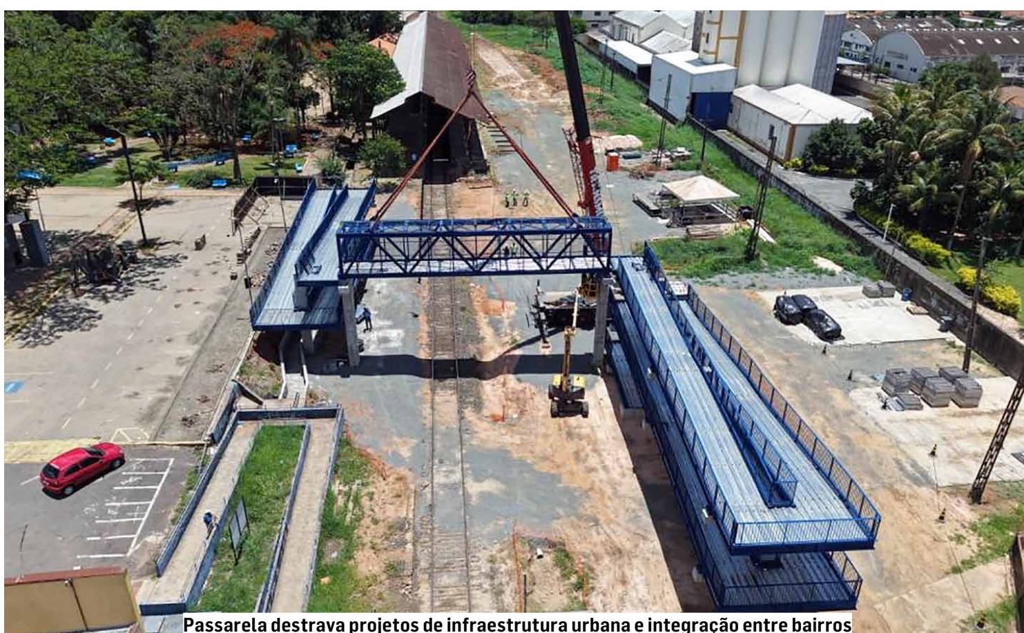
Passarela debruça projetos de infraestrutura urbana e integração entre bairros

Outro marco recente foi a entrega da nova passare-