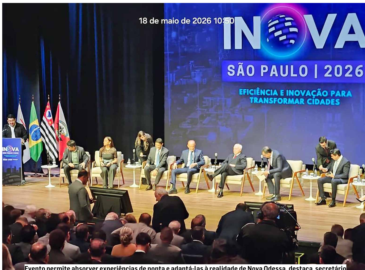
Evento permite absorver experiências de ponta e adaptá-las à realidade de Nova Odessa, destaca secretário

Em busca de referências e boas práticas para modernizar a gestão pública, a Prefeitura de Nova Odessa marcou presença no recente evento “INFOS - INOVA SP 2026”, realizado no Teatro do SESI-SP, na capital paulista, para discutir a transformação das cidades por meio da eficiência, da desburocratização e da governança de dados.