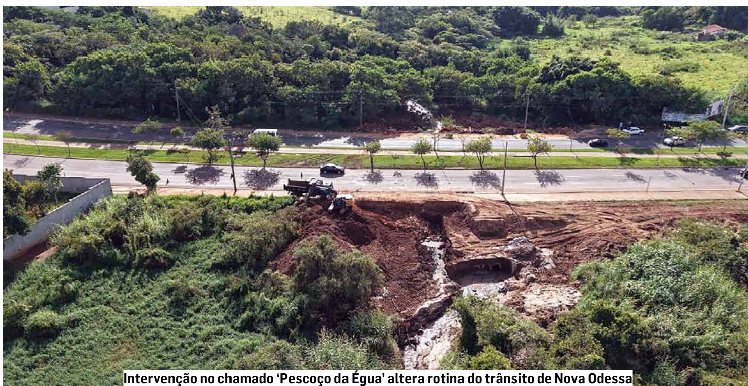
Intervenção no chamado 'Pescoço da Égua' altera rotina do trânsito de Nova Odessa

Mesmo com lentidão e congestionamentos registrados principalmente nos horários de pico, a população tem demonstrado apoio à intervenção, consi-