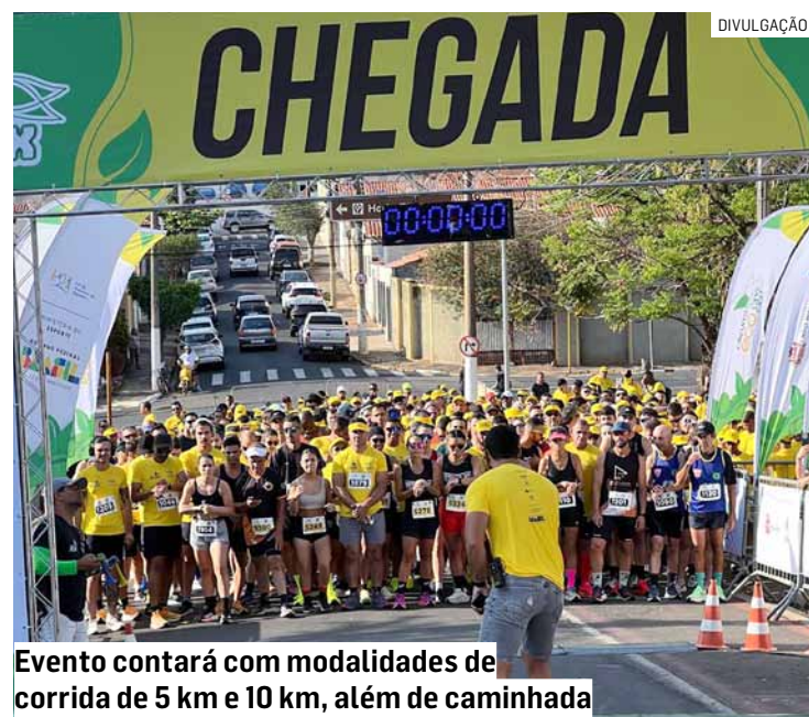
Evento contará com modalidades de corrida de 5 km e 10 km, além de caminhada

O “Esporte e Bem-Estar XI” é patrocinado pela Honda, por meio da Lei Paulista de Incentivo ao Esporte (Lei nº 13.918/2009), do Governo do Estado de São Paulo.