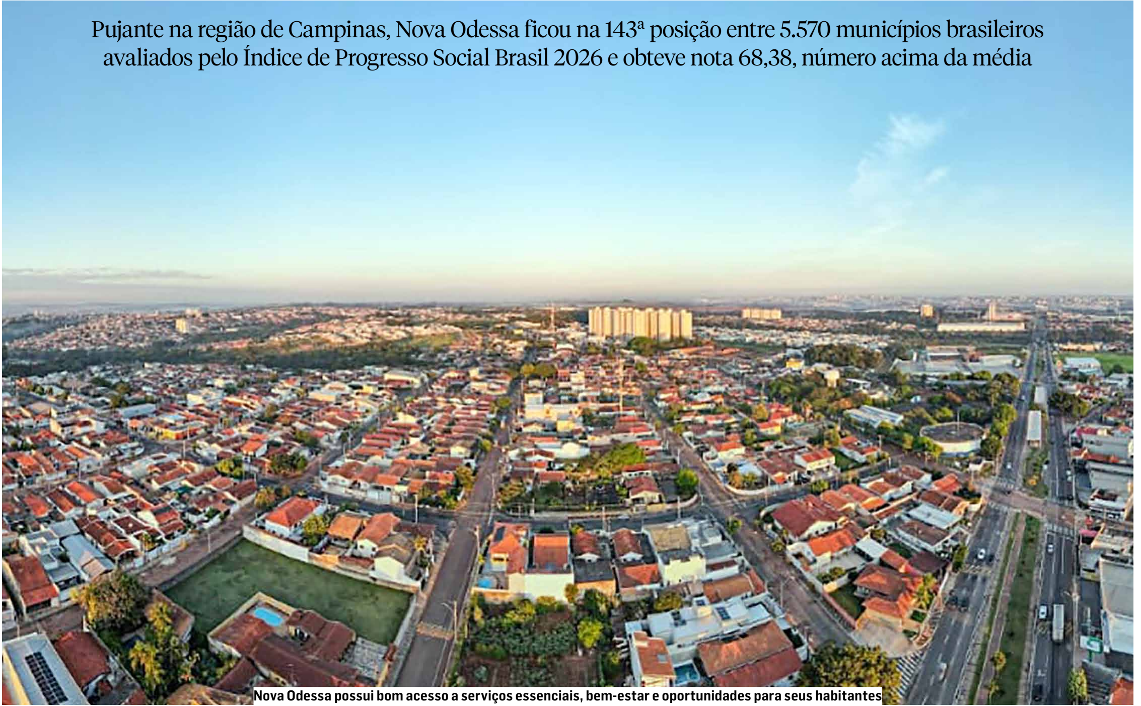
Nova Odessa possui bom acesso a serviços essenciais, bem-estar e oportunidades para seus habitantes

Pujante na região de Campinas, Nova Odessa ficou na 143ª posição entre 5.570 municípios brasileiros avaliados pelo Índice de Progresso Social Brasil 2026 e obteve nota 68,38, número acima da média