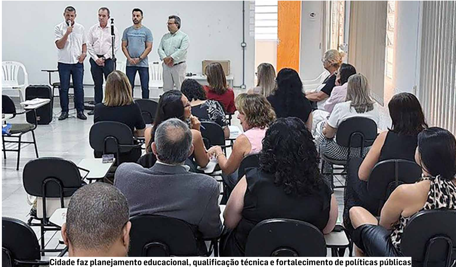
Cidade faz planejamento educacional, qualificação técnica e fortalecimento de políticas públicas

“Precisamos definir juntos a escola que Nova Odessa deseja e ajustar isso ao orçamento”, afirmou o secretário durante encontro promovido pela prefeitura com profissionais da Educação.