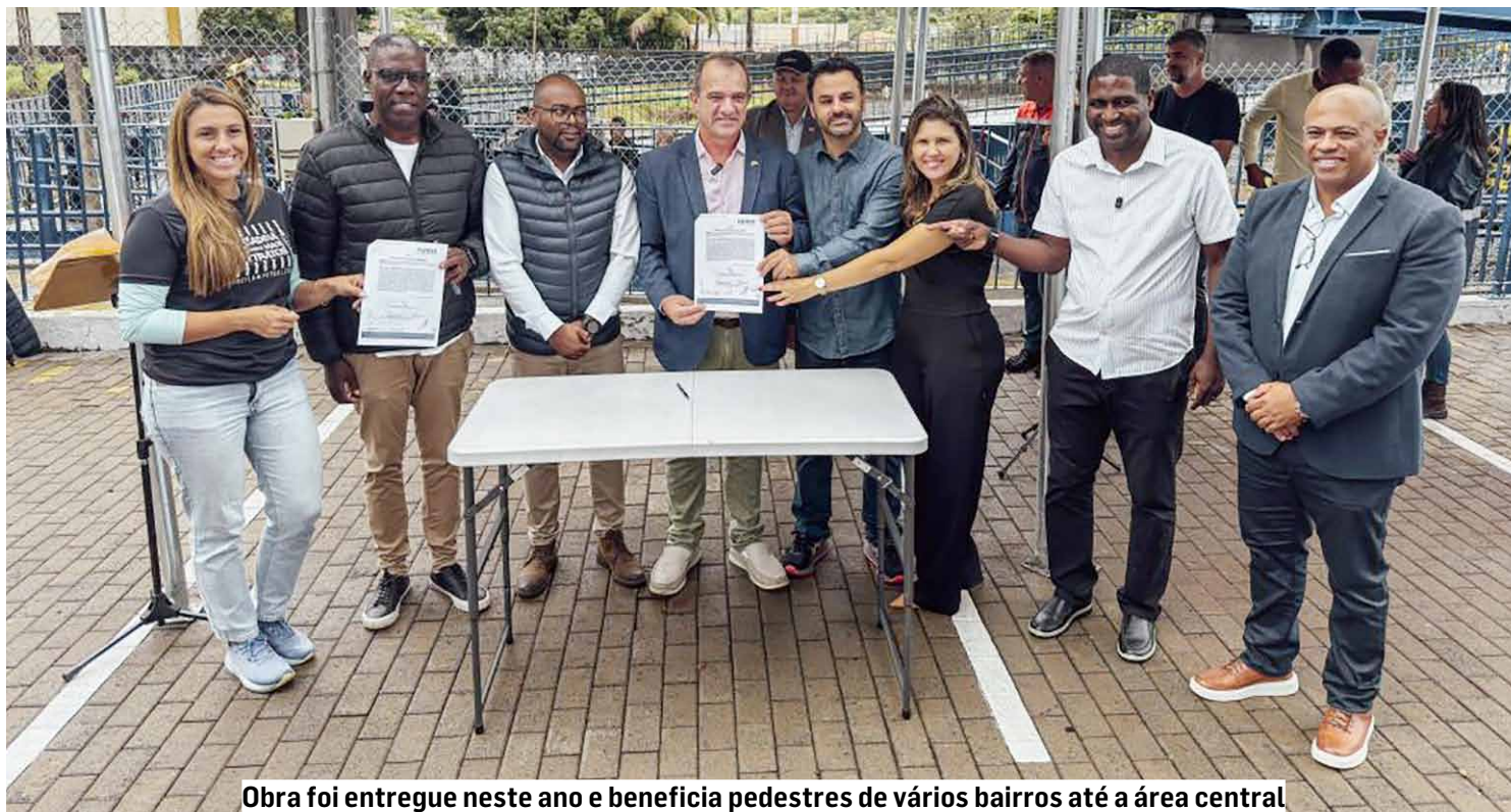
Obra foi entregue neste ano e beneficia pedestres de vários bairros até a área central

la de pedestres construída sobre a linha férrea na área central da cidade. A estrutura foi inaugurada em fevereiro deste ano pela concessionária Rumo em parceria com a prefeitura.