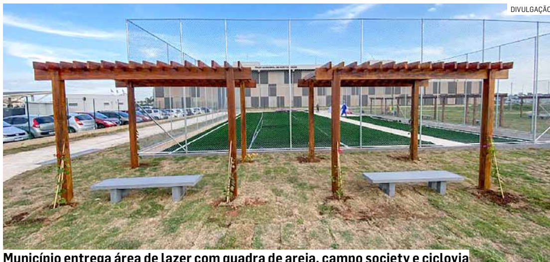
Município entrega área de lazer com quadra de areia, campo society e ciclovia

A nova Praça Esportiva de Hortolândia, localizada no complexo do Paço Municipal Palácio dos Migrantes “Ângelo Augusto Perugini”, será inaugurada na terça-feira (26). O evento organizado pela prefeitura acontece às 16h, no local onde ficam as quadras de futebol society e de areia. Haverá apresentação de