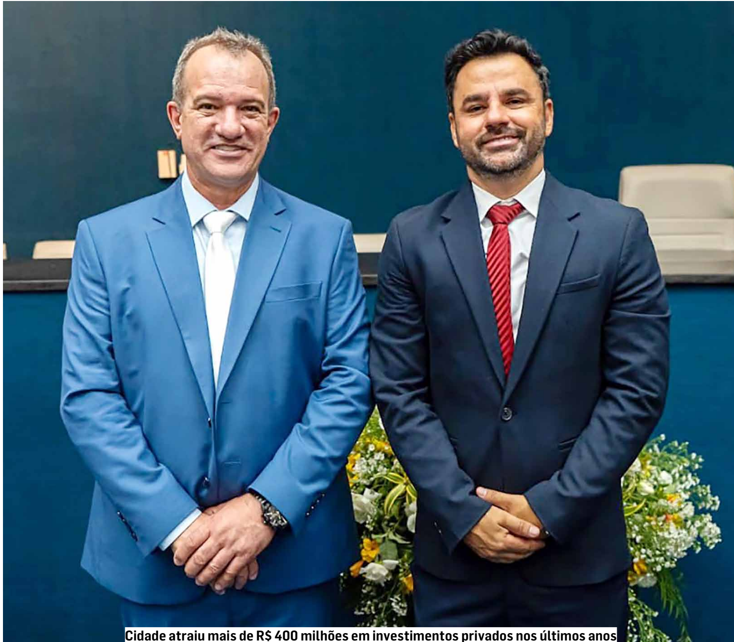
Cidade atraiu mais de R$ 400 milhões em investimentos privados nos últimos anos

Na Segurança Pública, a cidade conquistou sua própria sede do Corpo de