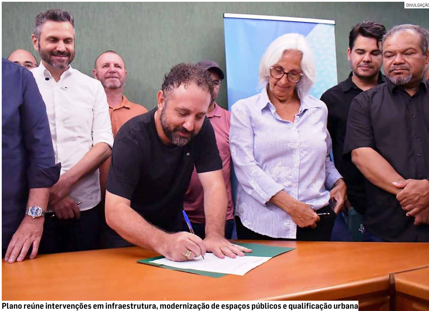
Plano reúne intervenções em infraestrutura, modernização de espaços públicos e qualificação urbana

“Precisamos reviver, dar vida novamente para Sumaré, rejuvenescendo o Centro da cidade para fomentar o comércio, melhorar a segurança dos comércios dentro dos bairros (...) a gente acabou com a Zona Azul, Sumaré não tem mais Zona Azul, e quando você acaba com a Zona