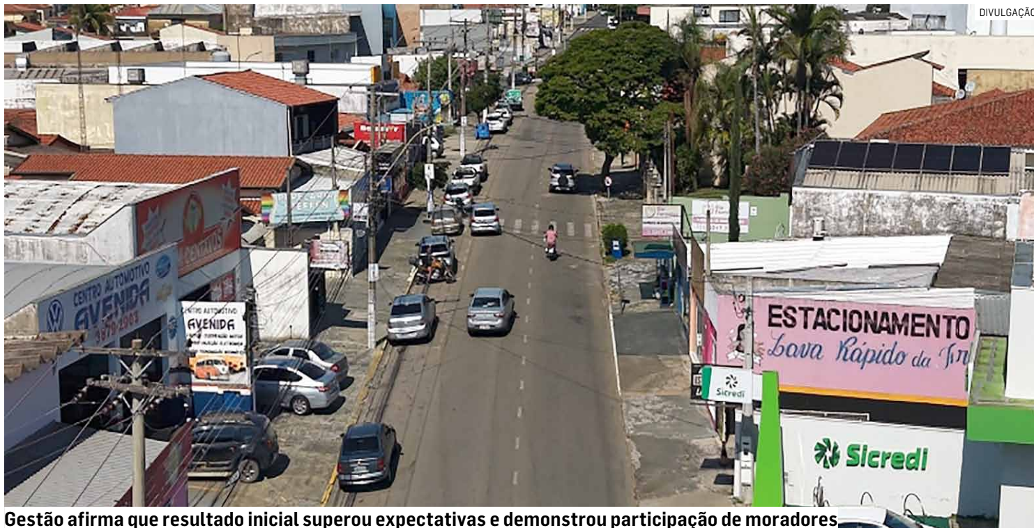
Gestão afirma que resultado inicial superou expectativas e demonstrou participação de moradores

A coleta seletiva acontece diretamente nas residências, com cronograma