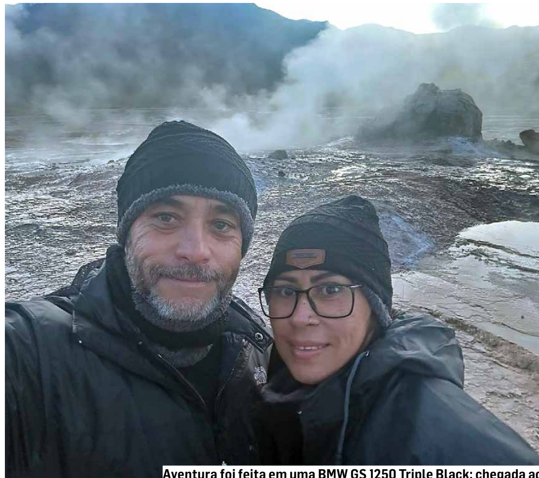
Aventura foi feita em uma BMW GS 1250 Triple Black; chegada ao deserto marcou realização de sonho

Segundo Carlos, a viagem exigiu muito preparo e coragem, principalmente por ser a primeira experiência do casal rodando fora do Brasil.