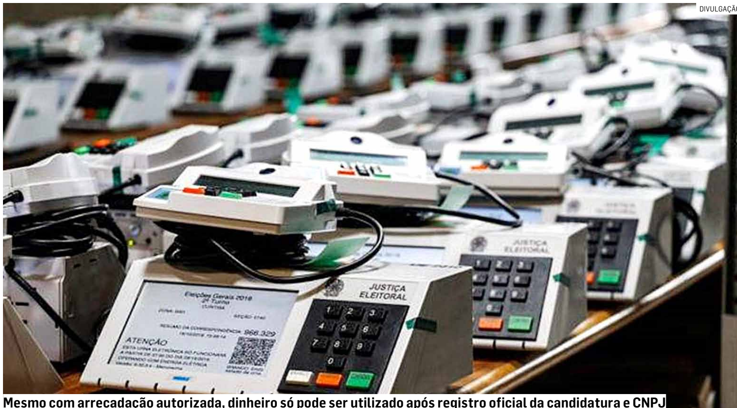
Mesmo com arrecadação autorizada, dinheiro só pode ser utilizado após registro oficial da candidatura e CNPJ

A medida deve impactar diretamente o cenário político regional, que já registra movimentação intensa de nomes ligados a cidades como Sumaré, Hortolândia, Americana, Paulínia e No-