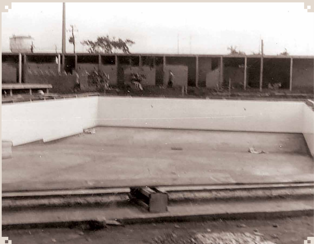
Foto da piscina do Clube Recreativo Sumaré, ainda em construção no Conjunto Poliesportivo da Avenida Rebouças. Esse trabalho aconteceu no mandato de João Rubens Gigo. Essa era a piscina principal; ao lado dela tinha uma piscina infantil. Ao fundo, o Conjunto Fisioterápico, ainda em construção.