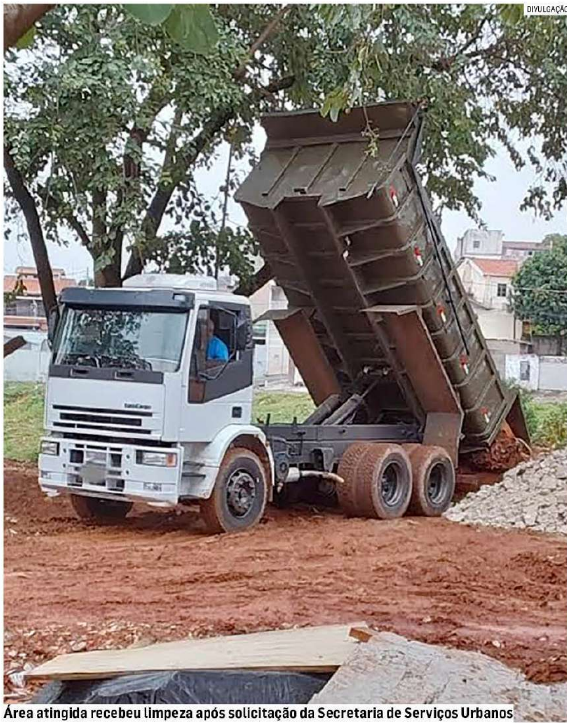
Área atingida recebeu limpeza após solicitação da Secretaria de Serviços Urbanos

Desde março deste ano, agentes de fiscalização ambiental atuam na CIMH (Central Integrada de Monitoramento da Prefeitura de Hortolândia). A central reúne equipes de Mobilidade Urbana, Defesa Civil, Guarda Municipal e Polícia Militar, garantindo monitoramento abrangente e resposta ágil a ocorrências em toda a cidade. A equipe realiza rondas três vezes por semana e, desde o início das operações, já foram lavrados 76 Autos de Infração referentes a transporte de re-