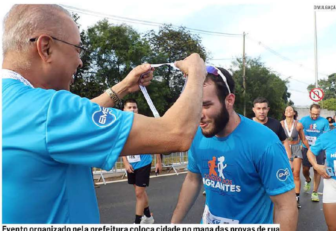
Evento organizado pela prefeitura coloca cidade no mapa das provas de rua

O recorde de participantes foi quebrado em mais uma edição da Corrida dos Migrantes, organizada pela Prefeitura de Hortolândia. A largada foi pontualmente dada às 7h30 de domingo (24), na Avenida Panafno, onde milhares de competidores se aglomeraram formando um "mar azul". Eram diversas pessoas, de diferentes idades e cidades participando do evento que já é conhecido no circuito das corridas de rua. Com avenidas modernas, estruturadas e planejadas, Hortolândia es-