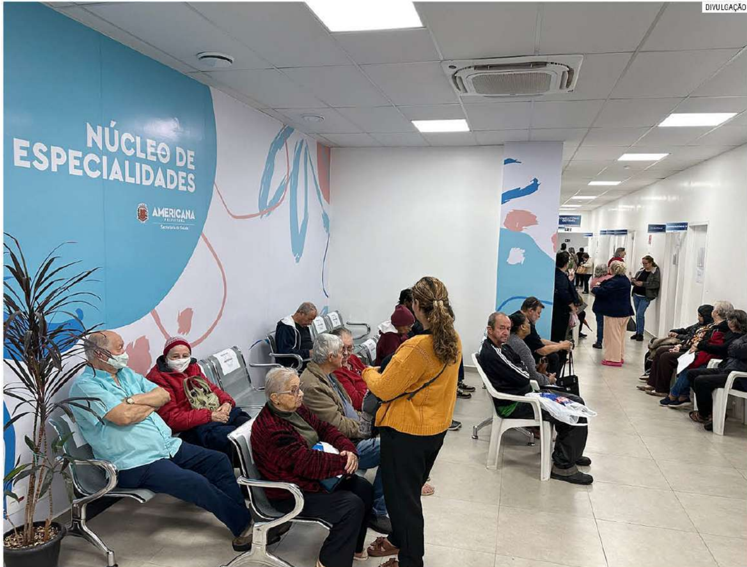
Programa é realizado mensalmente desde outubro de 2025 e reúne consultas e exames para reduzir tempo de espera no SUS

“O número de atendimentos, se compararmos com o de abril, tem se mantido elevado, e isso revela uma grande adesão da po-