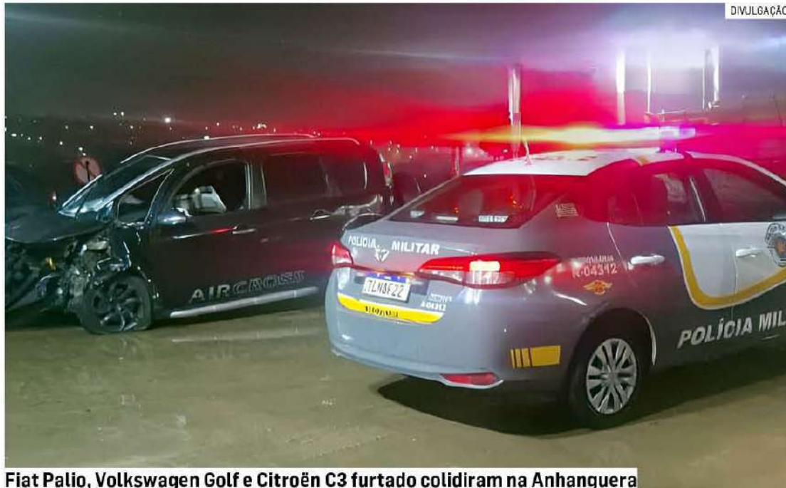
Fiat Palio, Volkswagen Golf e Citroën C3 furtado colidiram na Anhanguera

De acordo com a corporação, houve uma sequência de colisões entre os veículos, mobilizando equipes de resgate da concessionária AutoBAN e poli-