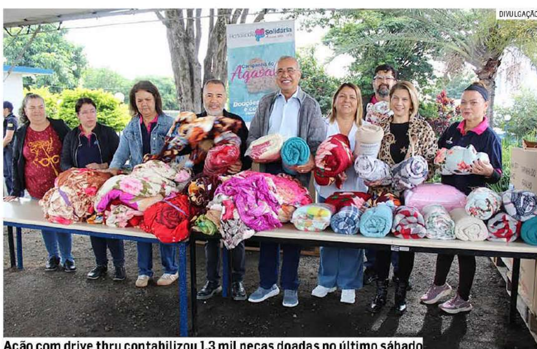
Ação com drive thru contabilizou 1,3 mil peças doadas no último sábado

“Foi muito bom o Dia D. Durante todo o dia, a população nos procurou, fez