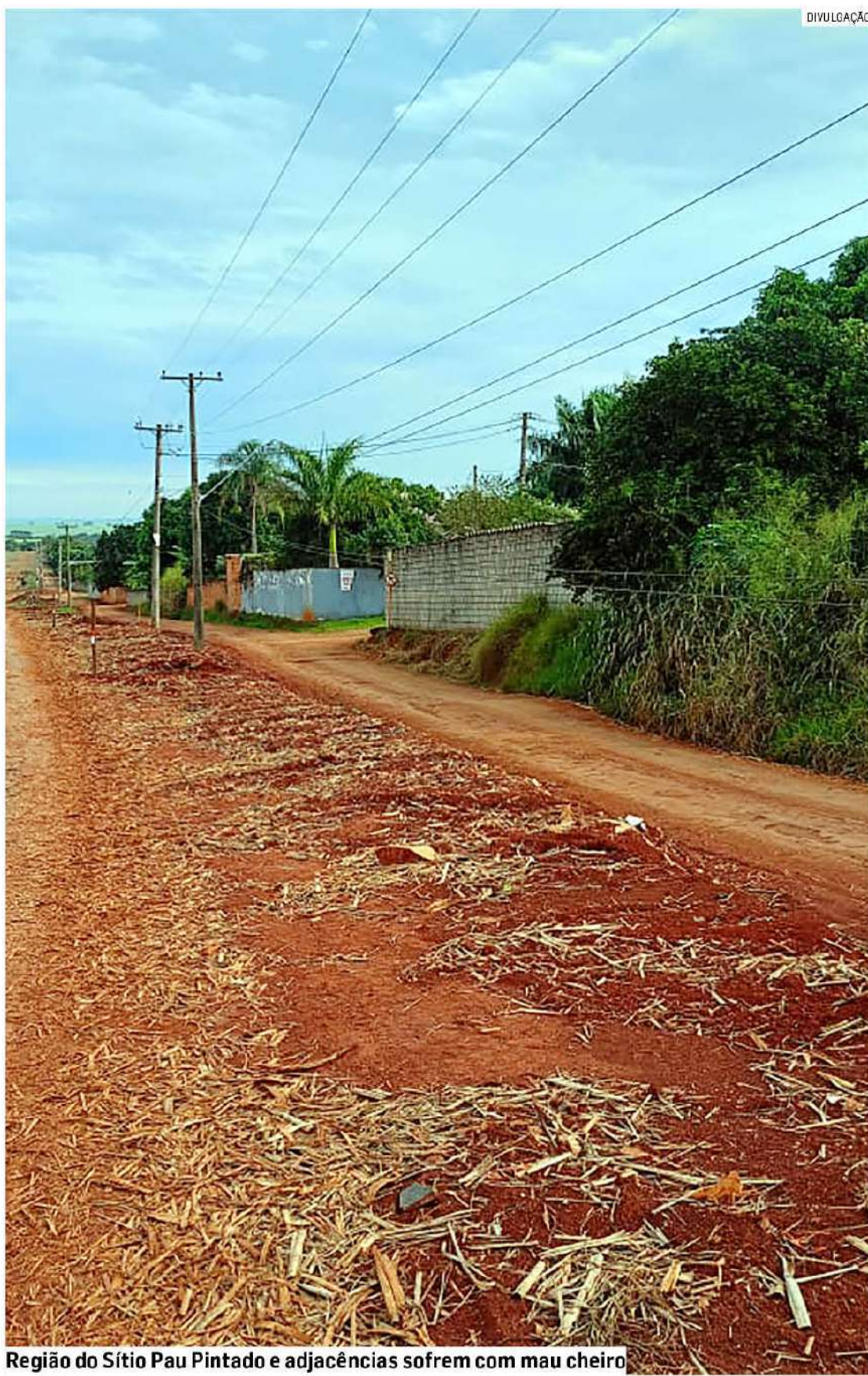
Região do Sítio Pau Pintado e adjacências sofrem com mau cheiro

O documento prevê que a apuração inclua a identi-