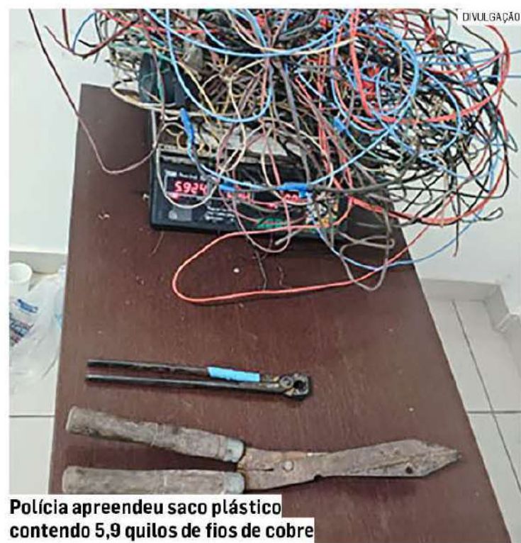
Polícia apreendeu saco plástico contendo 5,9 quilos de fios de cobre

O homem foi encaminhado ao Plantão Policial de Sumaré, onde a prisão foi ratificada pela autoridade de plantão. Ele permaneceu preso e ficou à disposição da Justiça.