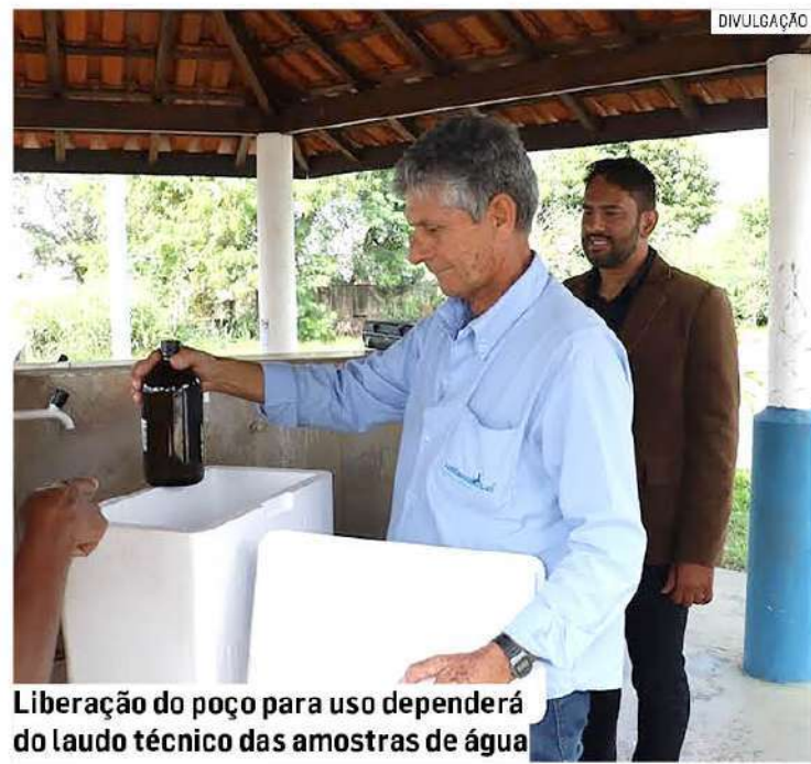
Liberação do poço para uso dependerá do laudo técnico das amostras de água

Da Redação • HORTOLÂNDIA tribunaliberal@tribunaliberal.com.br