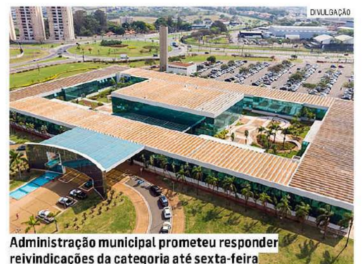
Administração municipal prometeu responder reivindicações da categoria até sexta-feira

Em nota, a administração destacou que segue aberta ao diálogo com os servidores públicos e afirmou que as negociações estão sendo conduzidas com responsabilidade fiscal, transparência e “compromisso com a população e os trabalhadores municipais”.