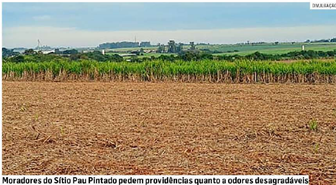
Moradores do Sítio Pau Pintado pedem providências quanto a odores desagradáveis

Forte odor atribuído a estabelecimentos provoca reclamações em diferentes bairros de Sumaré; moradores afirmam que cheiro se tornou mais intenso nas últimas semanas, causando desconforto, dores de cabeça e situações de mal-estar