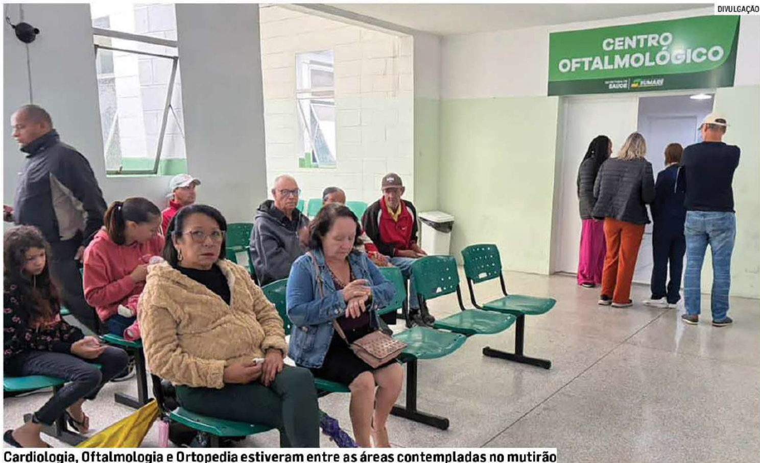
Cardiologia, Oftalmologia e Ortopedia estiveram entre as áreas contempladas no mutirão

Segundo a Secretaria Municipal de Saúde, o objetivo do programa é ampliar o acesso da população aos atendimentos especializados, oferecendo mais rapidez nos encami-