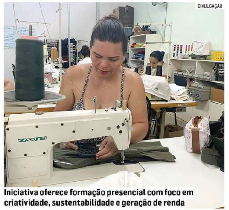
Iniciativa oferece formação presencial com foco em criatividade, sustentabilidade e geração de renda

Pelo ProAC ICMS- Programa de Ação Cultural da Secretaria da Cultura, Economia e Indústria Criativas do Estado de São Paulo, o projeto Despertar das Artes conta com patrocínio da Solenis e apoio do Grupo São Vicente.