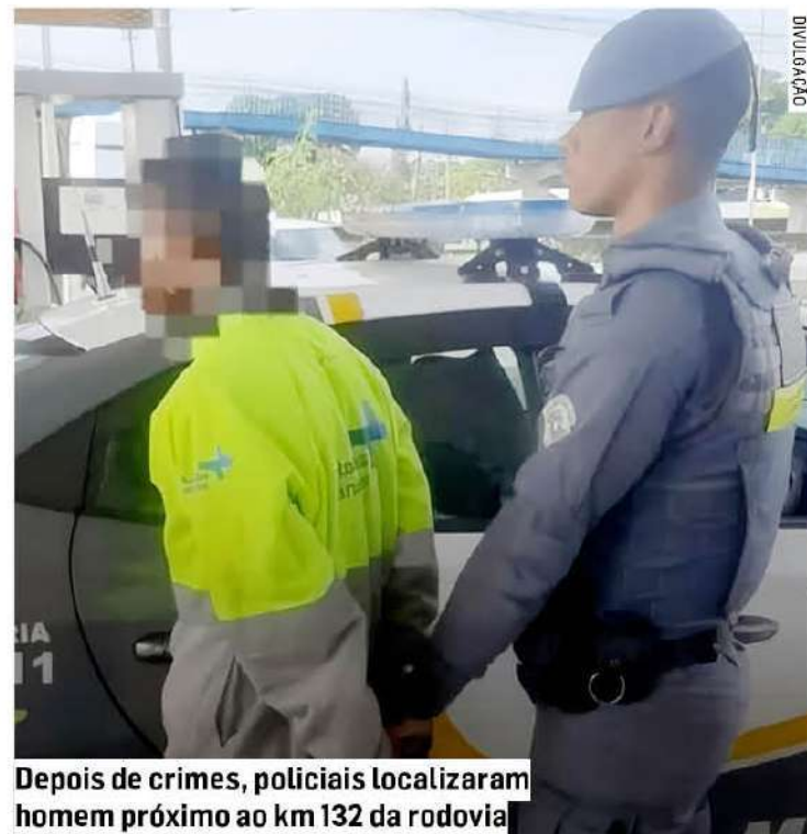
Depois de crimes, policiais localizaram homem próximo ao km 132 da rodovia

Após o registro do caso, o homem permaneceu preso e ficou à disposição da Justiça.