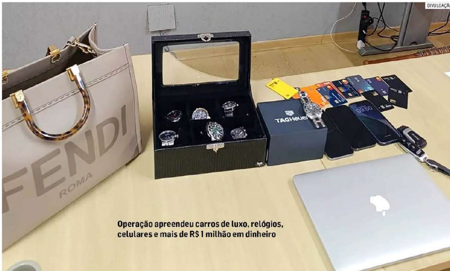
Operação apreendeu carros de luxo, relógios, celulares e mais de R$ 1 milhão em dinheiro

Durante o cumprimento de mandados judiciais na residência do suspeito, agentes da 2ª Delegacia de Investigações Sobre Entorpecentes (Dise) apreenderam veículos de luxo, relógios de alto valor, celulares, equipamentos eletrônicos e uma quantia superior a R$