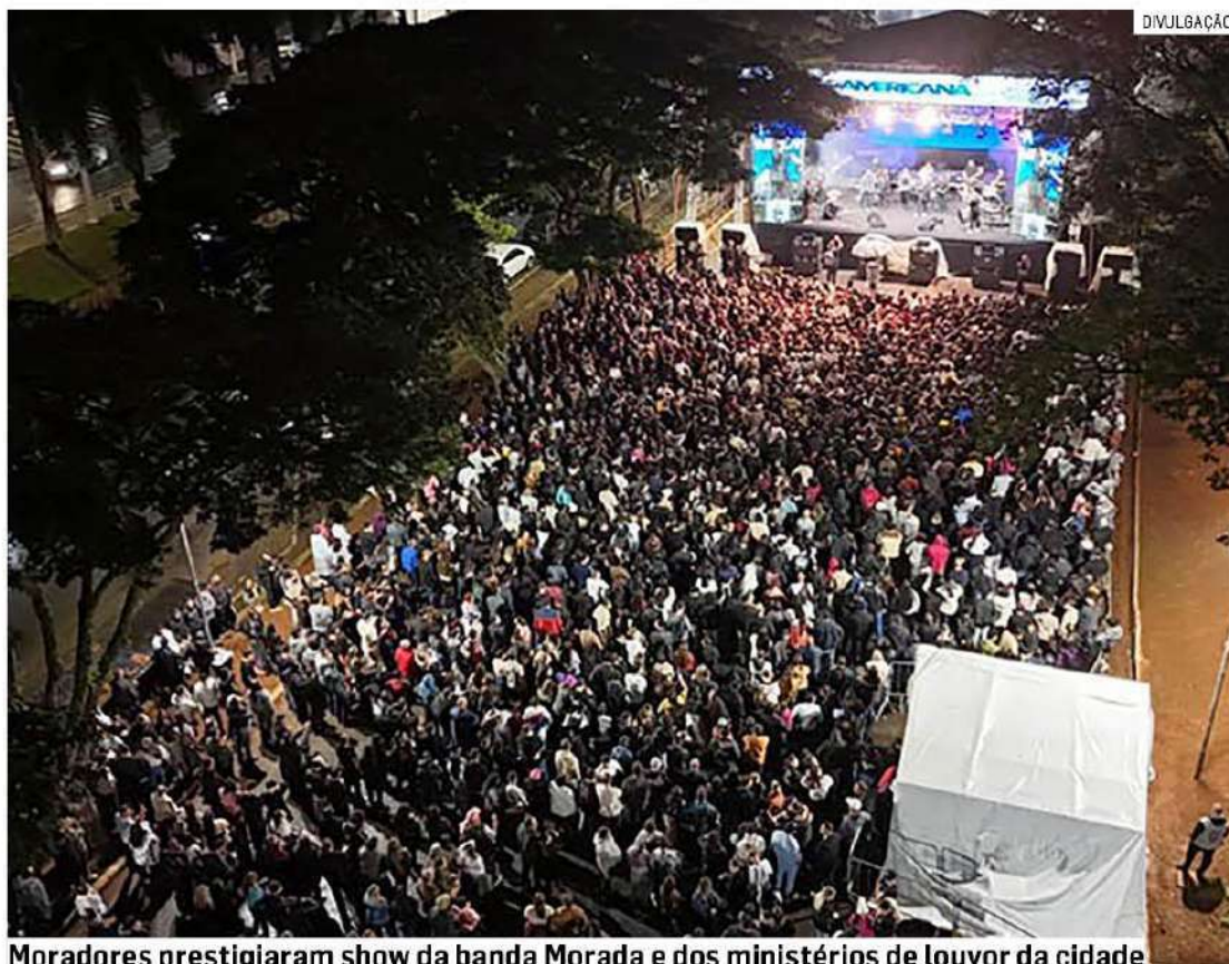
Moradores prestigiaram show da banda Morada e dos ministérios de louvor da cidade

“Agradeço o público de Americana por mais um evento de sucesso. As famílias compareceram e mesmo sob chuva prestigiaram nossos artistas e as atrações preparadas com muito carinho pela equipe da Secretaria de Cultura e Turismo”, declarou o prefeito Chico Sardelli (PL).