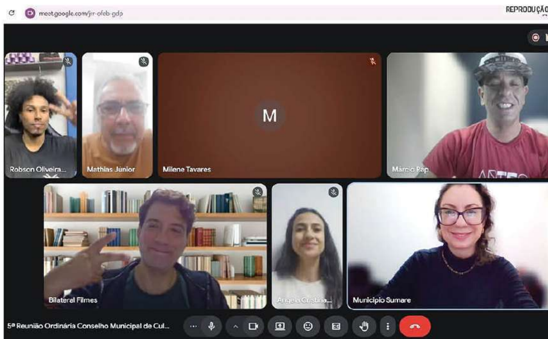
Secretaria de Cultura e Turismo detalhou andamento de repasses e Edital de Mestres e Mestras

O empenho institucional foi formalmente elogiado e