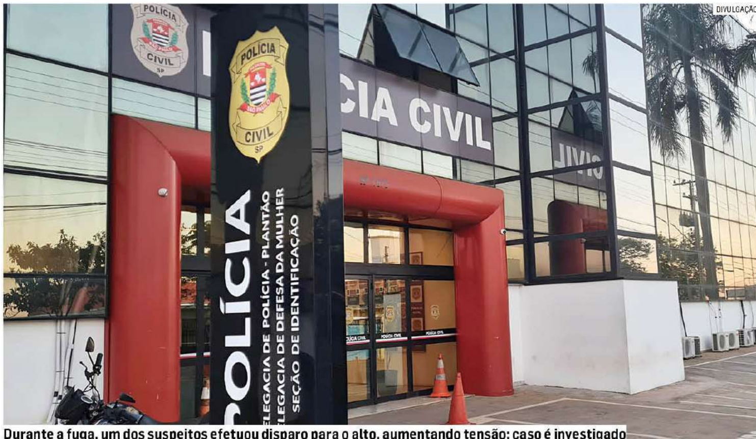
Durante a fuga, um dos suspeitos efetuou disparo para o alto, aumentando tensão; caso é investigado

De acordo com o relato, quatro homens encapuzados chegaram ao local em