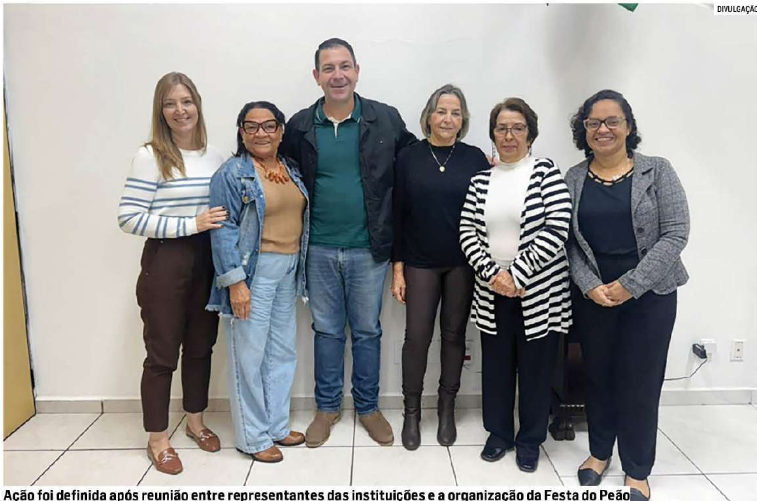
Ação foi definida após reunião entre representantes das instituições e a organização da Festa do Peão

A definição da ação aconteceu em uma reunião entre representantes das instituições e a organização da Festa do Peão, responsável pela parte operacional da campanha. Segundo a Prefeitura de Monte Mor, toda a arrecadação