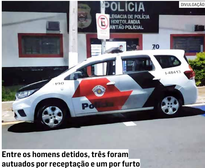
Entre os homens detidos, três foram autuados por receptação e um por furto

O produto era armazenado em barris, o que levantou a suspeita de furto de carga. Diante da situação, os agentes realizaram