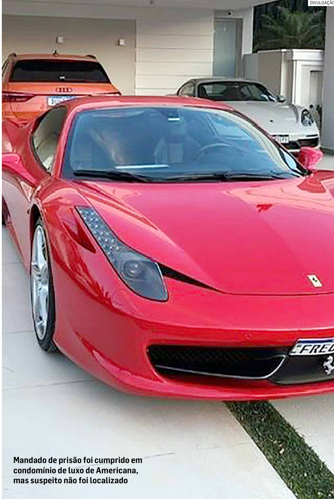
Mandado de prisão foi cumprido em condomínio de luxo de Americana, mas suspeito não foi localizado

A Polícia Federal tentou cumprir mandado de prisão contra Thiago nesta quarta-feira (25), na casa dele, mas ele não foi localizado. A ação ocorreu em um condomínio de alto padrão de Americana. No momento da abordagem, o suspeito não estava no imóvel. Há indícios de