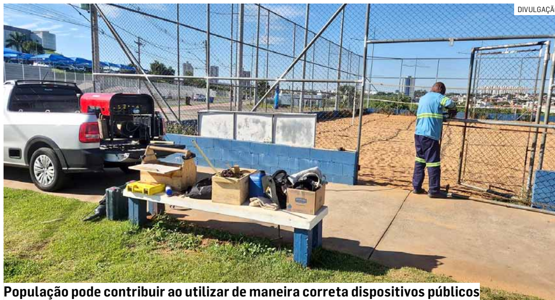
População pode contribuir ao utilizar de maneira correta dispositivos públicos

Agora, foi iniciado o reparo dos alambrados das quadras esportivas, além da troca de aparelhos danificados tanto dentro das quadras como das academias de ginástica ao ar livre e dos playgrounds. A próxima etapa é a retomada