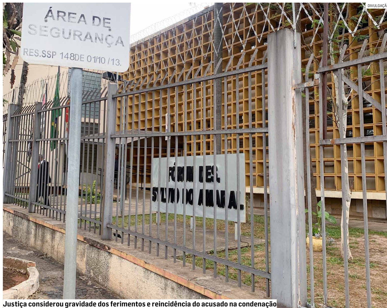
Justiça considerou gravidade dos ferimentos e reincidência do acusado na condenação

Na época do crime, em dezembro de 2023, réu tentou assassinar vítima com golpes na cabeça e foi preso em flagrante; jurados reconheceram autoria e motivo fútil no ataque praticado pelo autor; pena inicial será cumprida em regime fechado