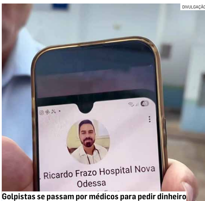
Golpistas se passam por médicos para pedir dinheiro