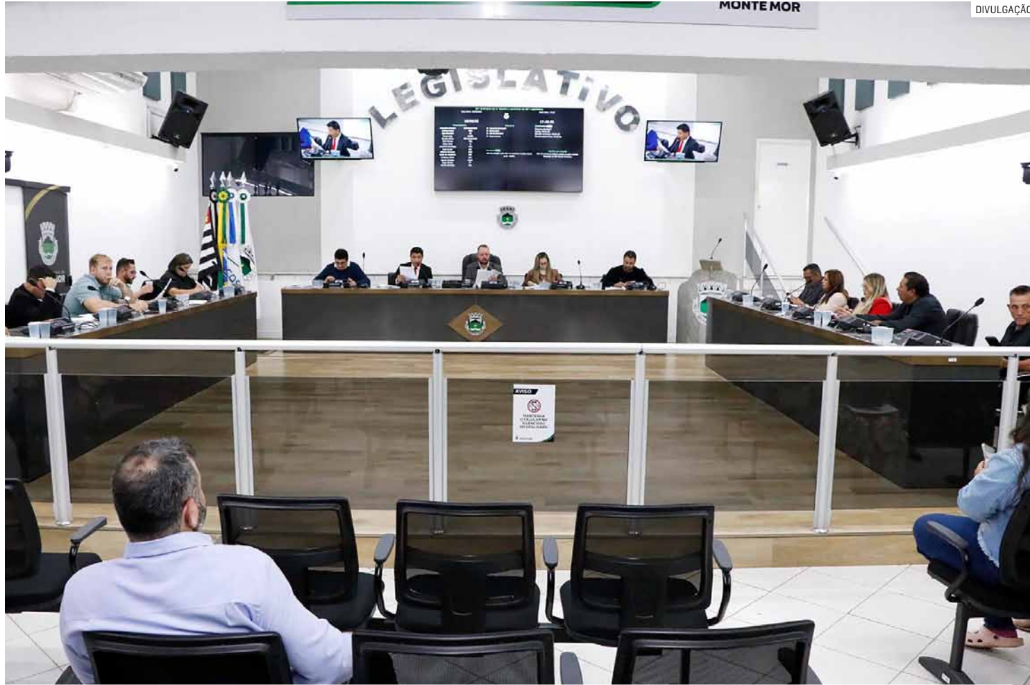
Suspeita recai sobre fraude na classificação de candidata aprovada; caso foi revelado pelo Tribuna Liberal em setembro

De acordo com os autos, o concurso foi conduzido pela empresa Embrasil Desenvolvimento Institucional e de Carreiras Ltda e teve como candidata aprovada uma mulher que é oficialmente investigada por fraude.