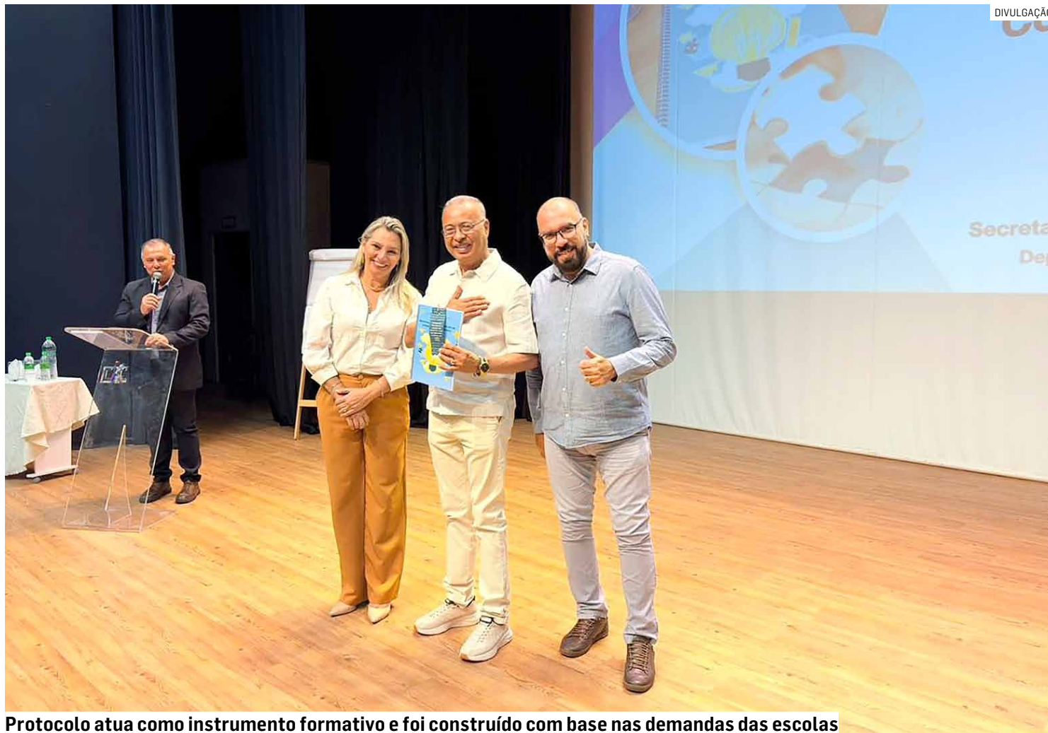
Protocolo atua como instrumento formativo e foi construído com base nas demandas das escolas

“Essa é mais uma ferramenta que chega para fortalecer o trabalho pedagógico nas escolas e, principalmente, garantir ainda mais qualidade no ensino oferecido aos nossos mais de 26 mil alunos. O coordenador pedagógico tem um papel fundamental dentro da escola. É ele quem acompanha de perto o desenvolvimento do ensino, orienta os professores e ajuda a construir caminhos para que cada estudante tenha a melhor oportunidade de aprender e se desenvolver. Hortolândia tem dado passos importantes na educação. Fomos pioneiros ao implantar o nosso currículo próprio, uma inovação que hoje já