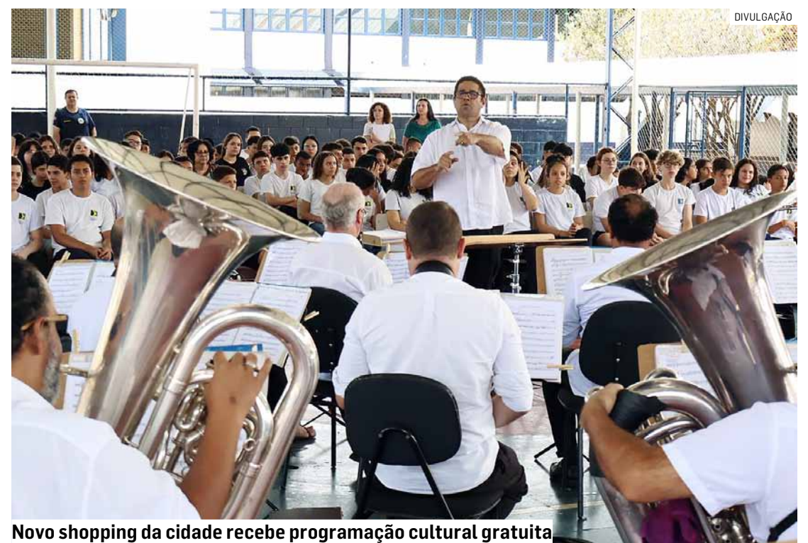
Novo shopping da cidade recebe programação cultural gratuita