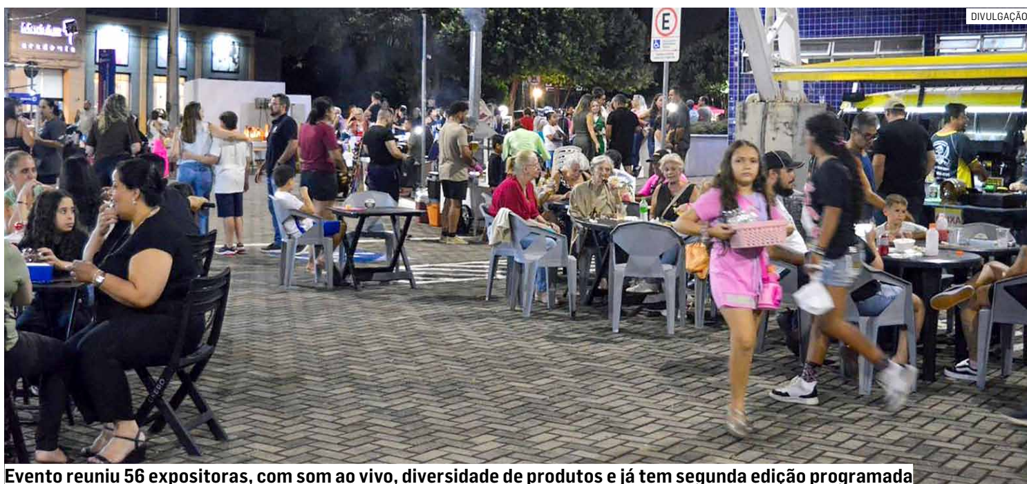
Evento reuniu 56 expositoras, com som ao vivo, diversidade de produtos e já tem segunda edição programada

Da Redação • NOVA ODESSA tribunaliberal@tribunaliberal.com.br