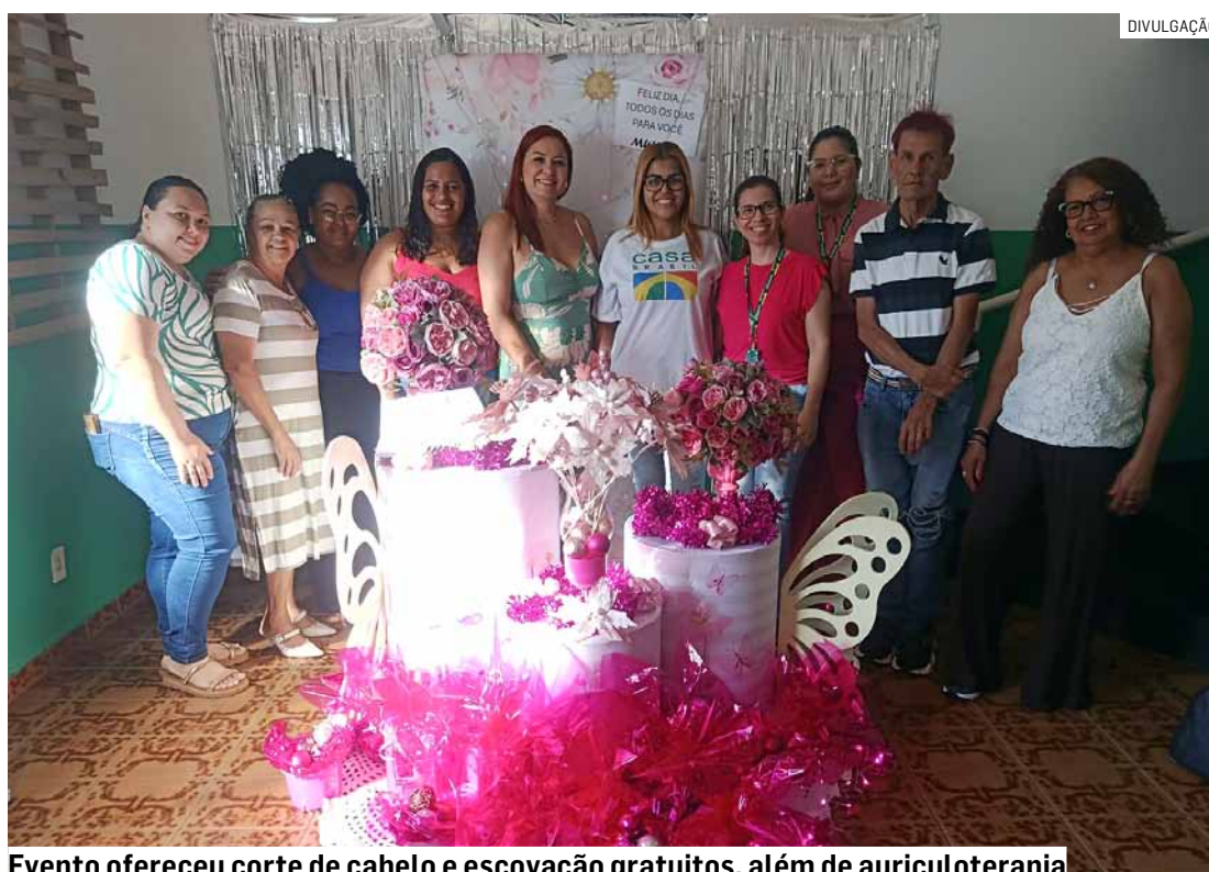
Evento ofereceu corte de cabelo e escovação gratuitos, além de auriculoterapia

O evento ofereceu uma série de serviços gratuitos à população. Entre as atividades, foram disponibiliza-