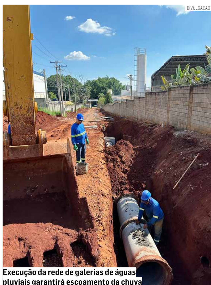
Execução da rede de galerias de águas pluviais garantirá escoamento da chuva