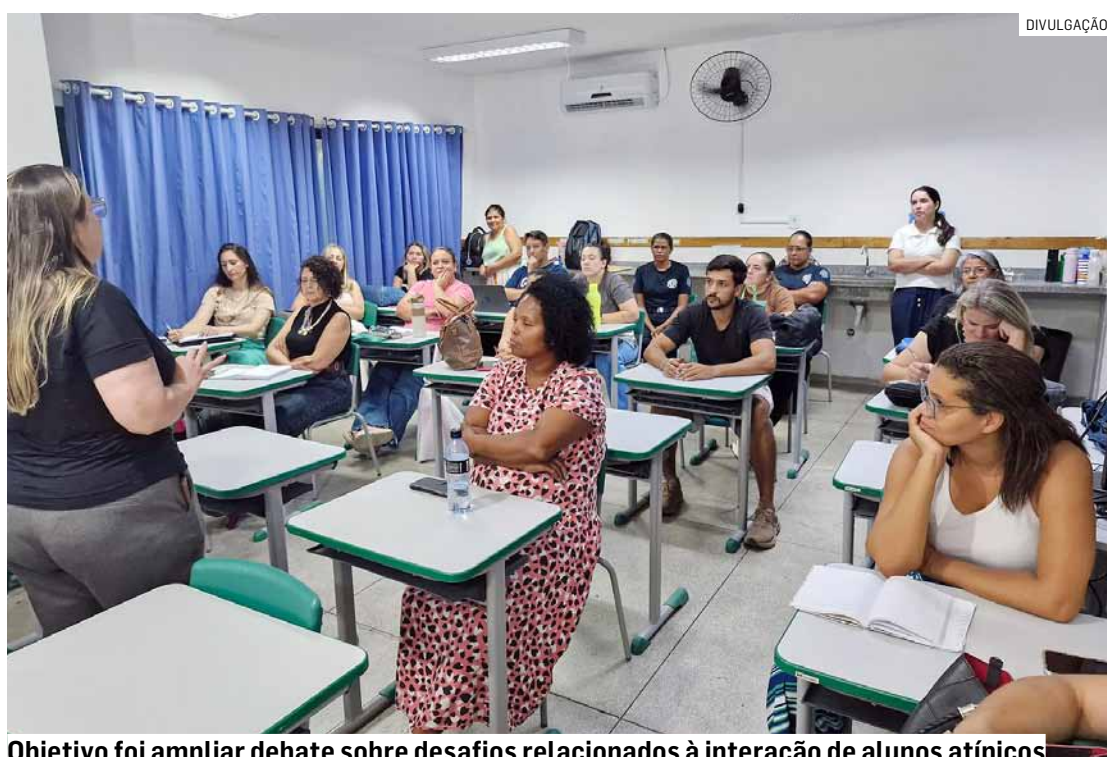
Objetivo foi ampliar debate sobre desafios relacionados à interação de alunos atípicos

O encontro, segundo a pasta, teve como principal objetivo ampliar o debate