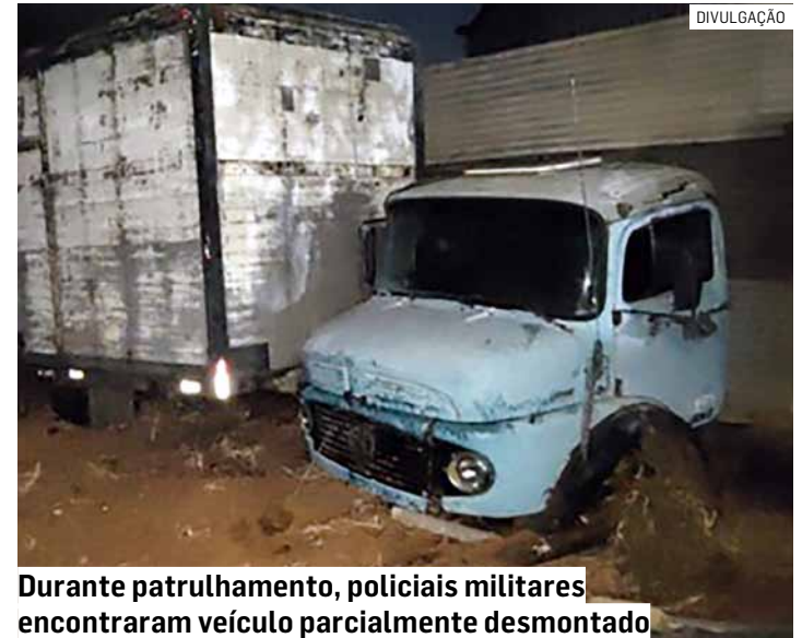
Durante patrulhamento, policiais militares encontraram veículo parcialmente desmontado

Segundo o suspeito, ele teria contratado um