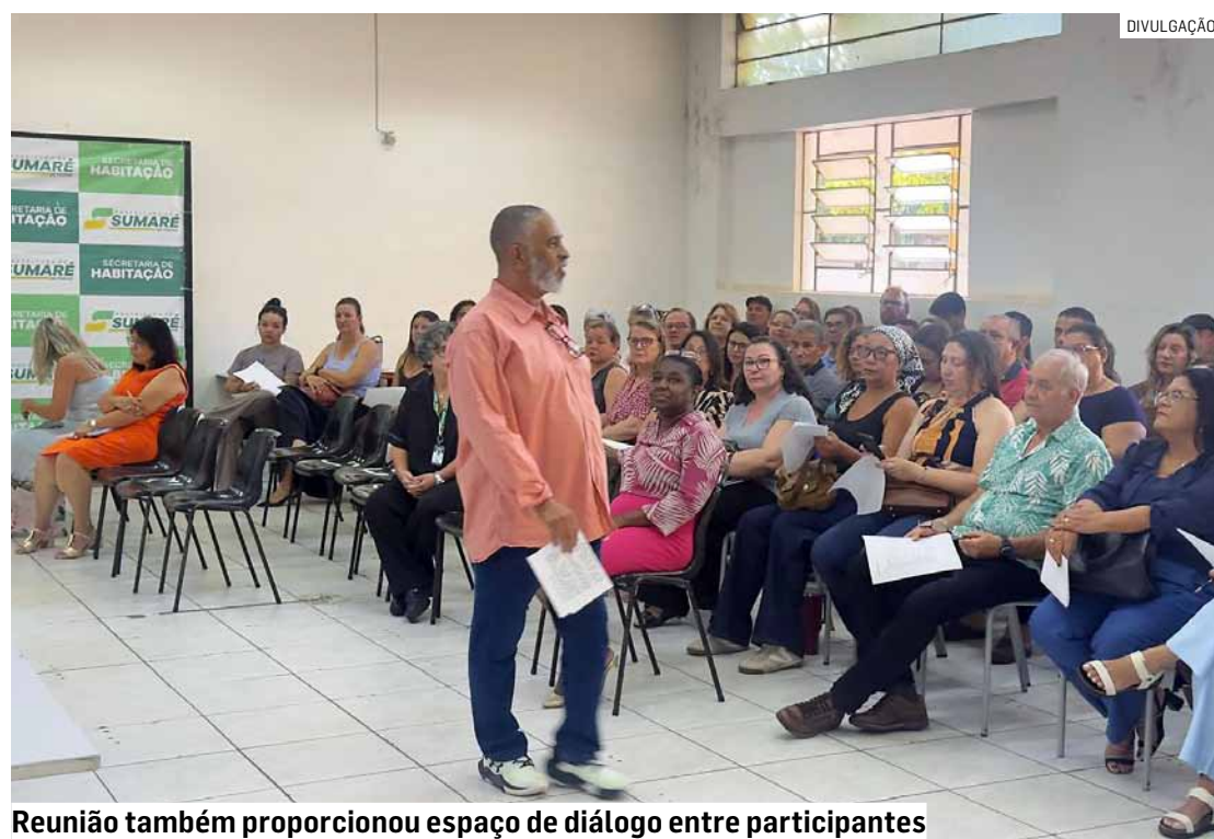
Reunião também proporcionou espaço de diálogo entre participantes

Durante o encontro, foi destacado que a coleta adequada dessas informações permite o mapeamento das desigualdades e contribui diretamente para a formulação de políticas públicas mais assertivas. A rede municipal conta com o suporte de sistemas de gestão e ensino para garantir a precisão dos dados e fortalecer a tomada de decisões baseada em evidências.