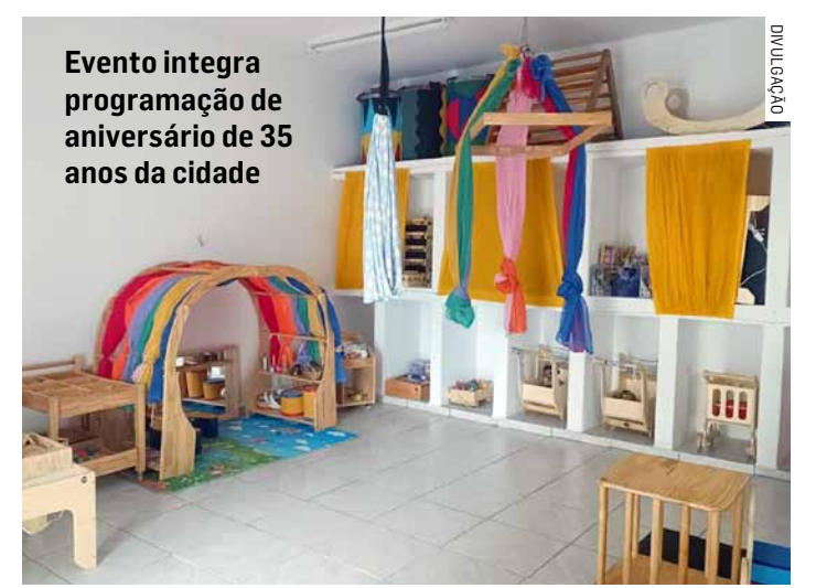
Evento integra programação de aniversário de 35 anos da cidade

A Sala de Estimulação Pedagógica contará com materiais de madeira, recursos de luz e sombra, cama do tipo "dossel", blocos lógicos, brinquedos de encaixe, instrumentos sonoros e musicais, entre outros recursos pedagógicos que potencializam as experiências de aprendizagem e desenvolvimento infantil. Segundo a Secretaria de Educação, Ciência e Tecnologia, estes materiais e recursos específicos poderão ser usados em propostas relacionadas ao brincar, ao faz de conta, à exploração sensorial e ao desenvolvimento cognitivo, motor e socioemocional.