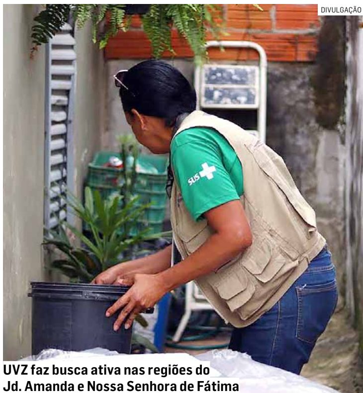
UVZ faz busca ativa nas regiões do Jd. Amanda e Nossa Senhora de Fátima