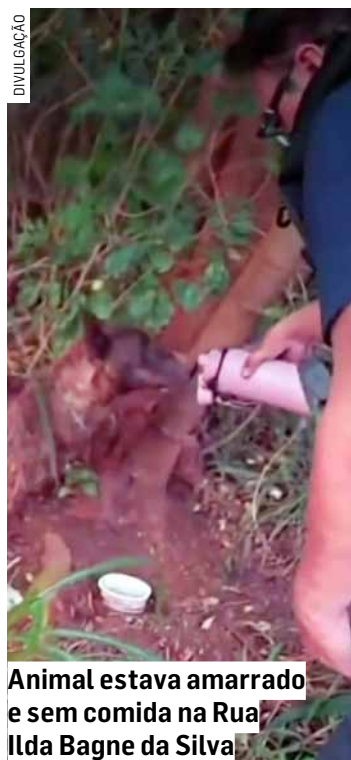
Animal estava amarrado e sem comida na Rua Ilda Bagne da Silva

O caso será apurado pelas autoridades para identificar o responsável pelos maus-tratos.