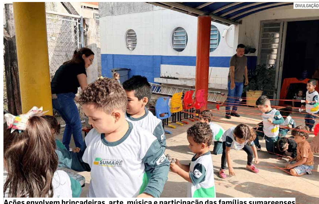
Ações envolvem brincadeiras, arte, música e participação das famílias sumareenses

mes, ressaltou o compromisso das escolas da rede com práticas pedagógicas que valorizam a infância e promovem reflexão sobre o papel do brincar no desenvolvimento humano. "Nossas unidades escolares realizam um trabalho muito importante ao proporcionar atividades que valorizam o brincar como parte do processo educativo. A Semana Municipal do Brincar mostra a importância pedagógica dessas experiências e amplia a participação das famílias nesse processo de aprendizagem e convivência", destacou o secretário.