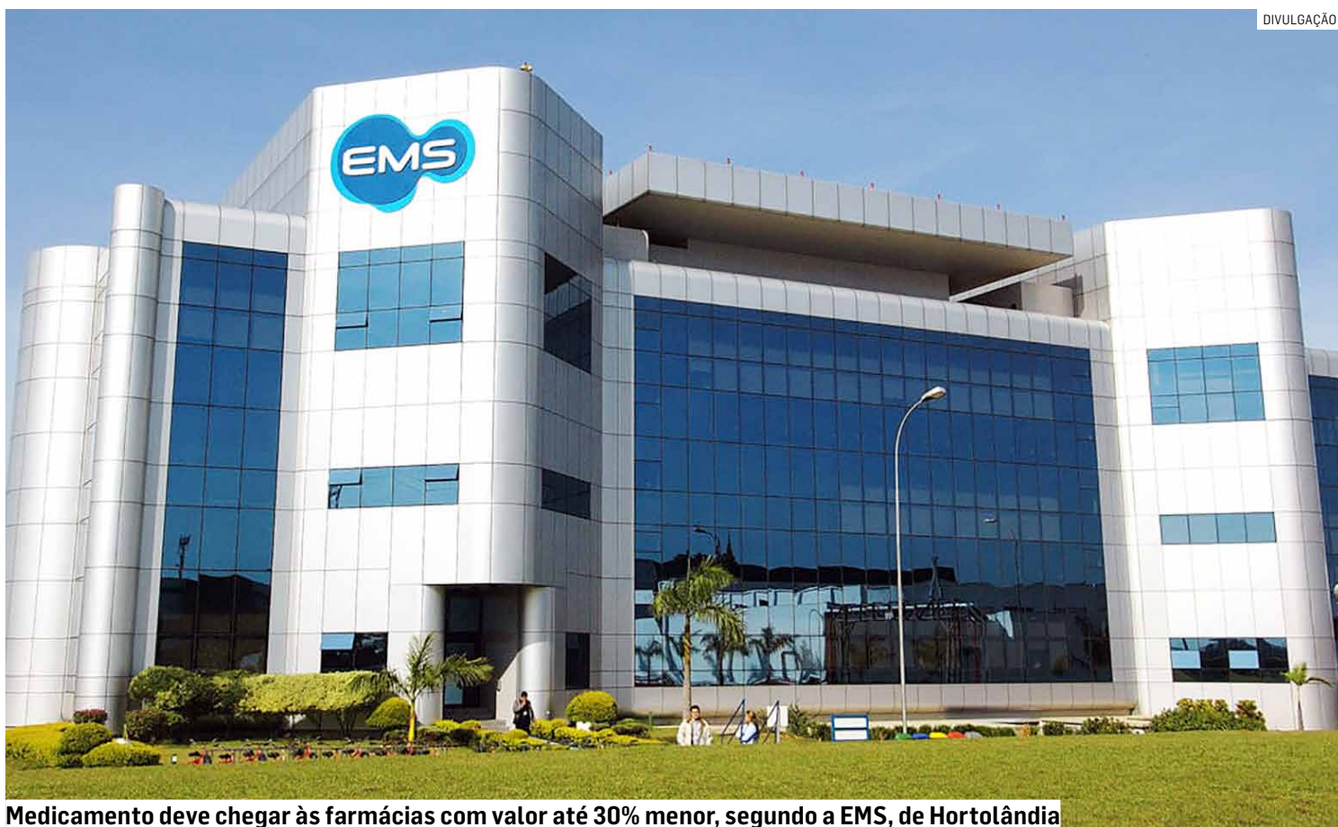
Medicamento deve chegar às farmácias com valor até 30% menor, segundo a EMS, de Hortolândia

O mercado de medicamentos injetáveis para emagrecimento vive forte expansão no Brasil e no exterior, impulsionado prin-