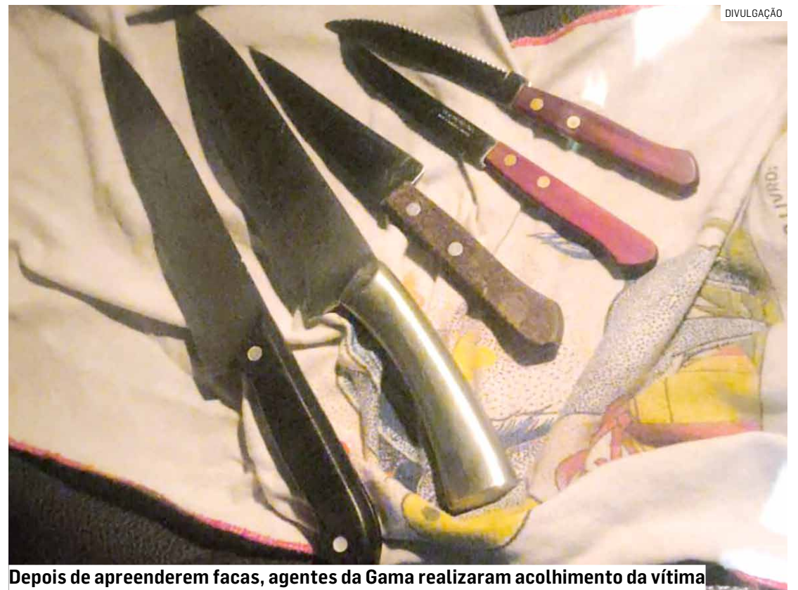
Depois de apreenderem facas, agentes da Gama realizaram acolhimento da vítima

Após o registro da ocorrência, o homem permaneceu à disposição da Justiça.