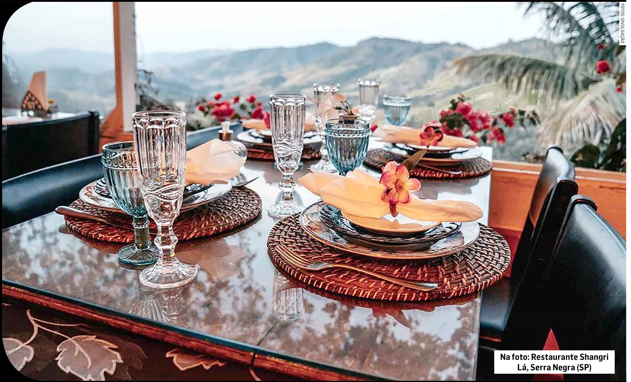
Na foto: Restaurante Shangri Lá, Serra Negra (SP)

Bem próximo à Capital paulistana existe uma “Rota Queijo e Vinho” que você precisa curtir, até porque nosso Estado é pródigo em italianos e seus respectivos produtos. Esta recomendação tem por destino a Rodovia SP-105, entre a cidade de Serra Negra e a cidade de Amparo, onde você encontra dois locais enraizados nesse mister: o Sítio Bom Retiro e a Fazenda Chapadão. Em ambos, você vai se deliciar com a degustação que lhes é oferecida. E é uma rota com ótimas pousadas e restaurantes diferenciados.