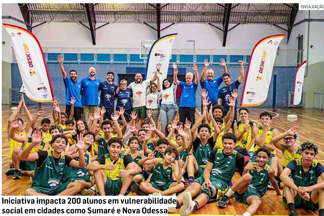
Iniciativa impacta 200 alunos em vulnerabilidade social em cidades como Sumaré e Nova Odessa