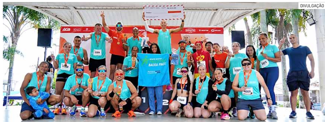
Equipe montemorense foi destaque na competição realizada em Santo Antônio de Posse

Da Redação • MONTE MOR tribunaliberal@tribunaliberal.com.br