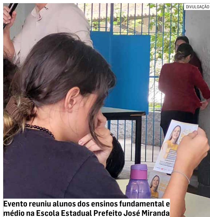
Evento reuniu alunos dos ensinos fundamental e médio na Escola Estadual Prefeito José Miranda