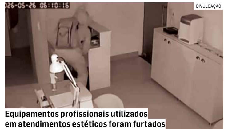
Equipamentos profissionais utilizados em atendimentos estéticos foram furtados

Segundo informações apuradas, o invasor entrou no estabelecimento e furtou diversos objetos, entre eles dinheiro em espécie, uma televisão, uma cafeteira e equipamentos profissionais utilizados nos atendimentos estéticos.