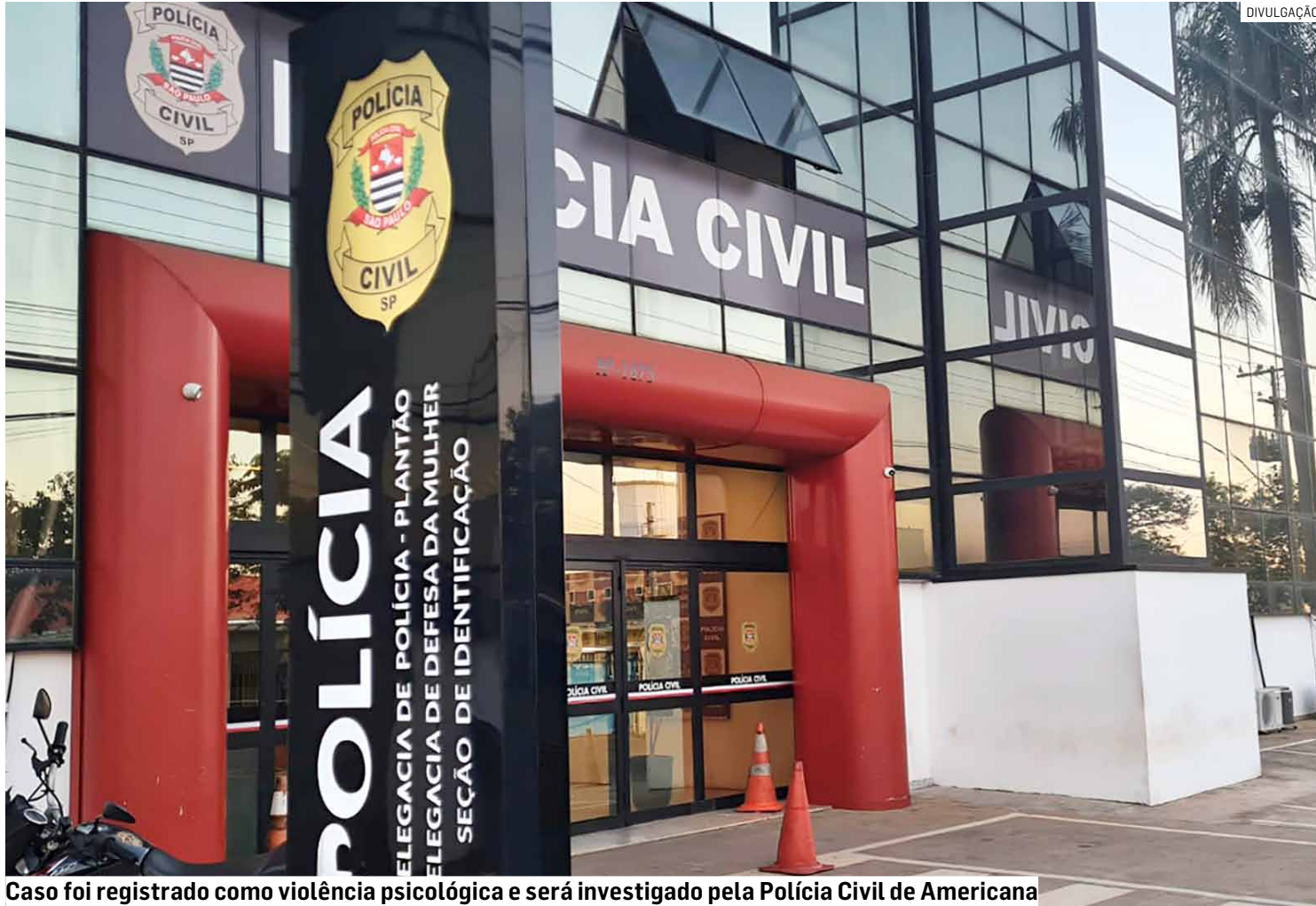
Caso foi registrado como violência psicológica e será investigado pela Polícia Civil de Americana

Dias depois, outra funcionária da mesma empresa também passou a rece-