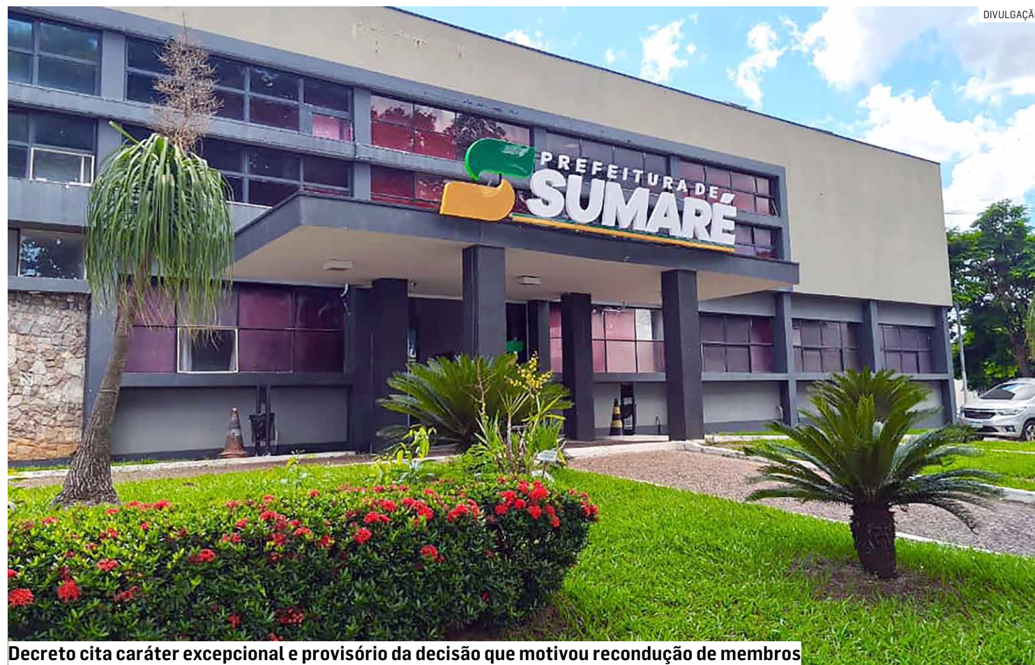
Decreto cita caráter excepcional e provisório da decisão que motivou recondução de membros

Decreto da prefeitura nomeia integrantes dos Conselhos Administrativo e Fiscal do Fundo de Previdência Social do município e atende determinação da 1ª Vara Cível local, restabelecendo a composição anterior dos colegiados