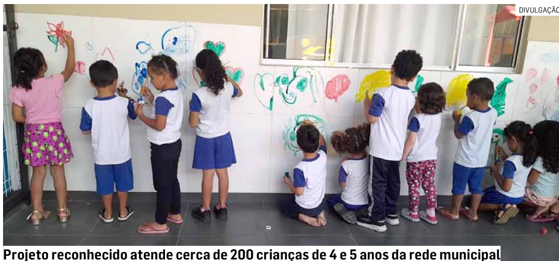
Projeto reconhecido atende cerca de 200 crianças de 4 e 5 anos da rede municipal

A Administração Municipal já conta com um Programa de Educação Integral. Mas até então, essa modalidade de ensino era voltada somente ao chamado pri-