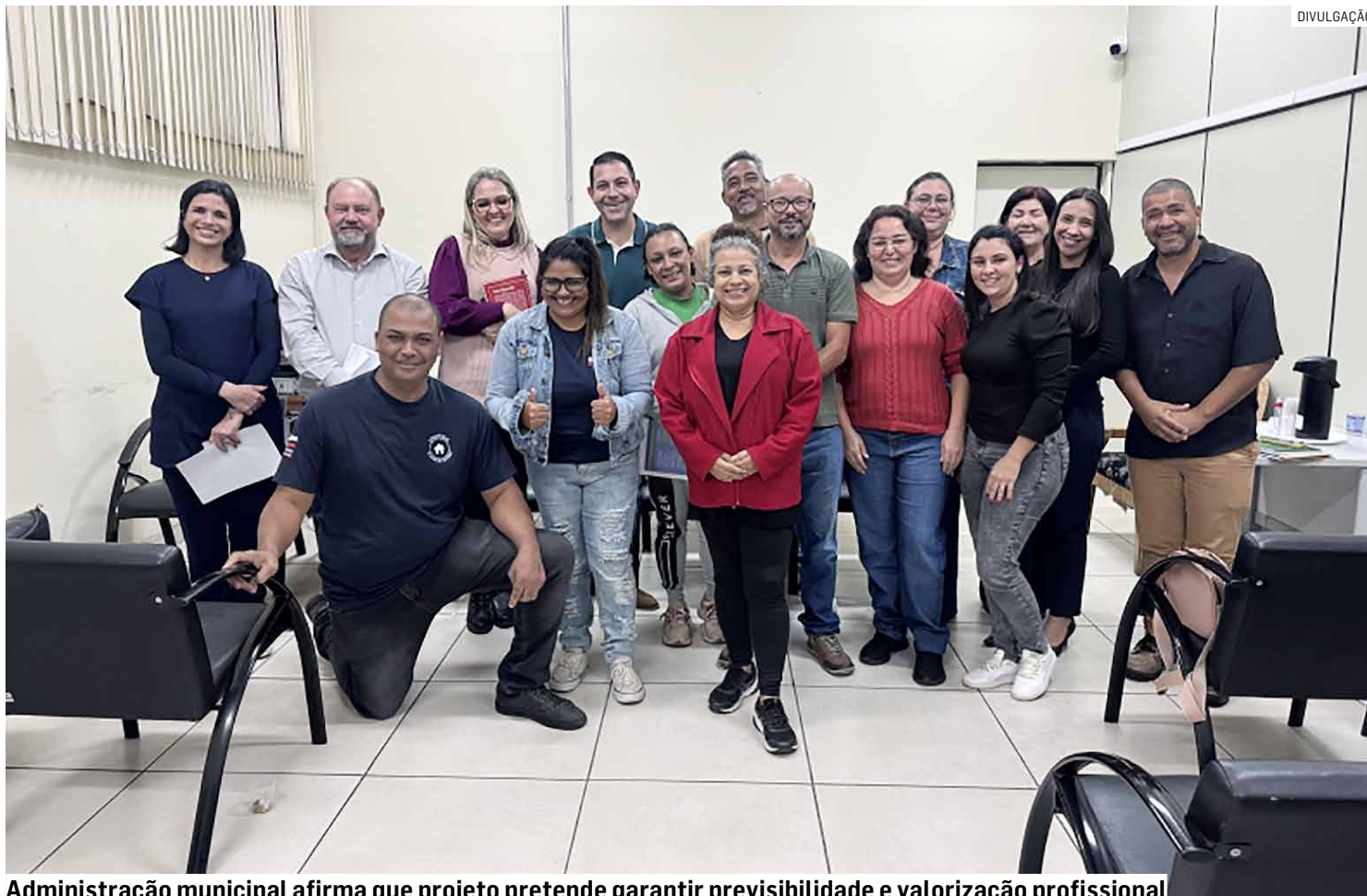
Administração municipal afirma que projeto pretende garantir previsibilidade e valorização profissional

A proposta prevê que os reajustes anuais ocorram a partir de fevereiro de 2027, incluindo também a correção do vale-alimentação conforme os