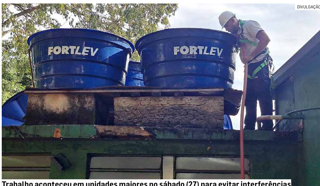
Trabalho aconteceu em unidades maiores no sábado (27) para evitar interferências

A higienização foi iniciada pela Escola Municipal de Educação Infan-