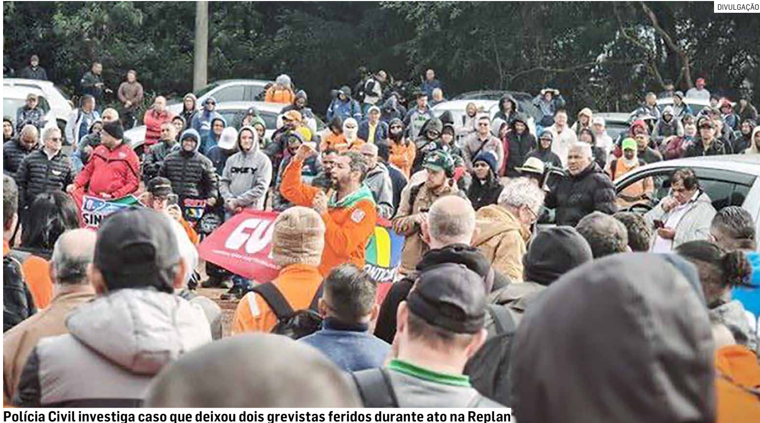
Polícia Civil investiga caso que deixou dois grevistas feridos durante ato na Replan

A paralisação reúne empregados de empresas contratadas para atividades