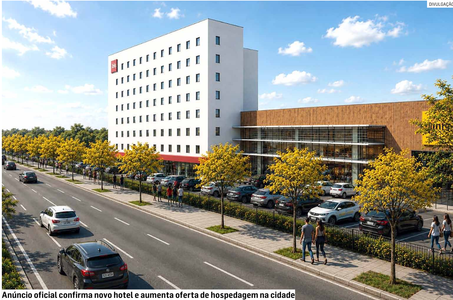
Anúncio oficial confirma novo hotel e aumenta oferta de hospedagem na cidade

A chegada do Ibis atende a uma demanda crescente por hospedagem em Sumaré. Nos últimos anos, o mu-