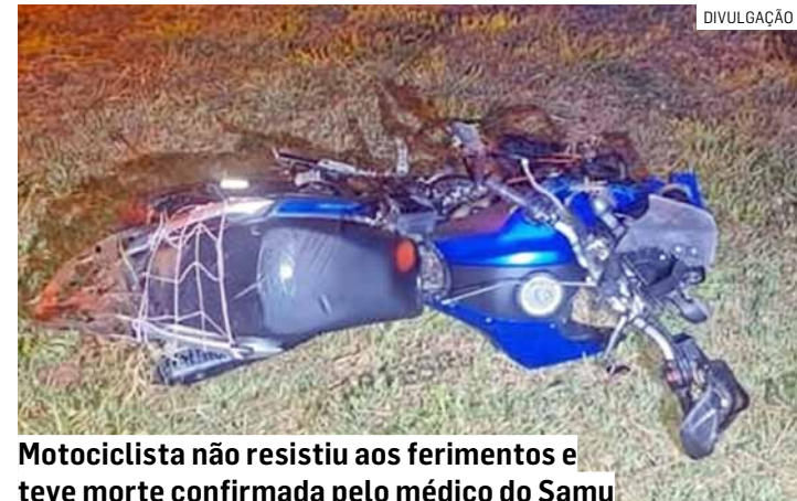
Motociclista não resistiu aos ferimentos e teve morte confirmada pelo médico do Samu

De acordo com as informações apuradas no local, o acidente aconteceu por volta de 2h40, na altura do km 114, no sentido Norte. O motociclista conduzia uma Yamaha Lander 250 quando, por motivos ainda desconhecidos, perdeu o controle do veículo. Após atin-