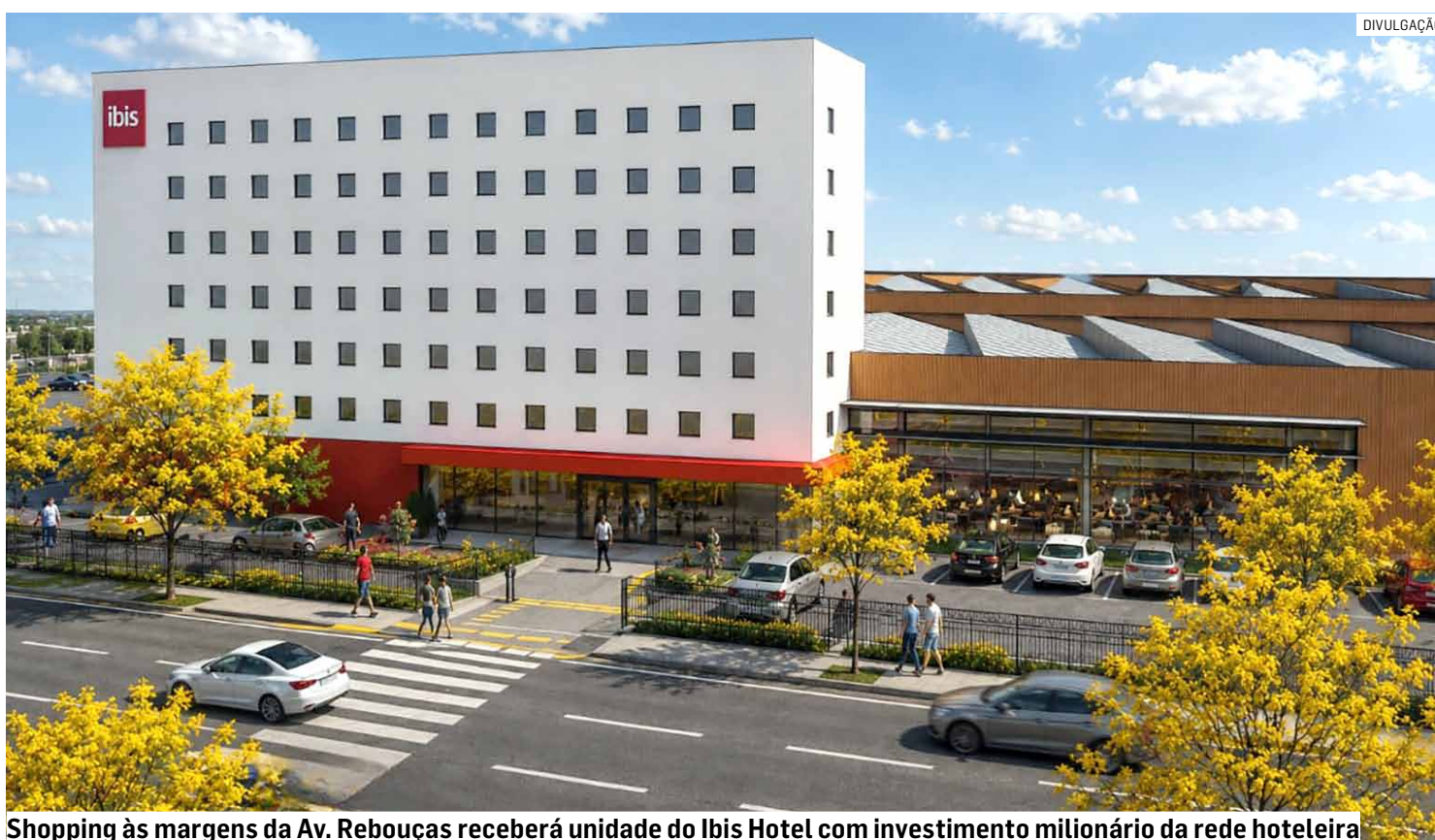
Shopping às margens da Av. Rebuças receberá unidade do Ibis Hotel com investimento milionário da rede hoteleira

Rede de hotelaria oficializou nesta segunda-feira (29), a implantação de unidade no empreendimento, totalizando 114 apartamentos, com inauguração prevista no 2º semestre de 2028, gerando 80 empregos