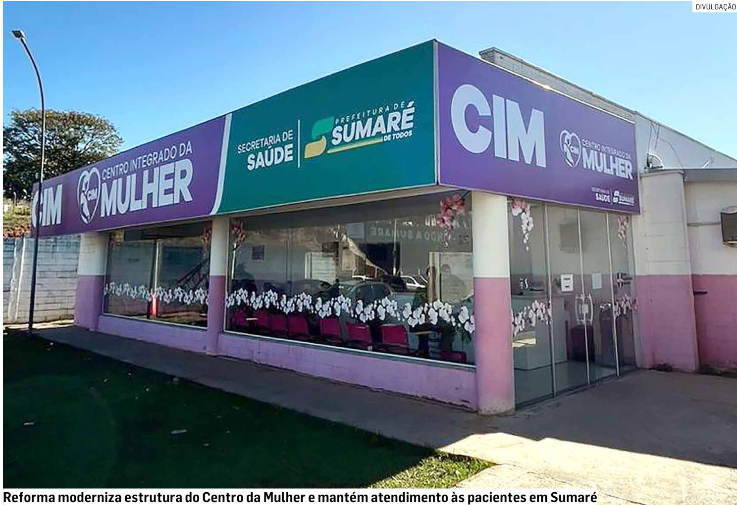
Reforma moderniza estrutura do Centro da Mulher e mantém atendimento às pacientes em Sumaré

Durante a execução dos serviços, o atendimento à população será mantido. No entanto, a Secretaria de Saúde informa que poderão ocorrer ajustes pontuais na agenda de consultas e procedimentos, conforme o andamento da obra.