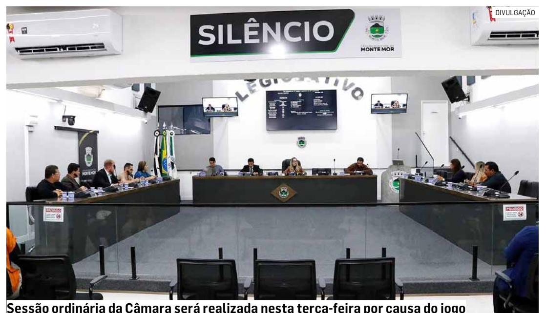
Sessão ordinária da Câmara será realizada nesta terça-feira por causa do jogo

O ato administrativo também destaca a tradição nacional de acompanhar os jogos da Seleção Brasileira em competições oficiais de grande relevância e ressalta que a suspensão parcial do expediente é uma prática adotada por diversos órgãos públicos e instituições em todo o país quando ocorrem partidas do Brasil.