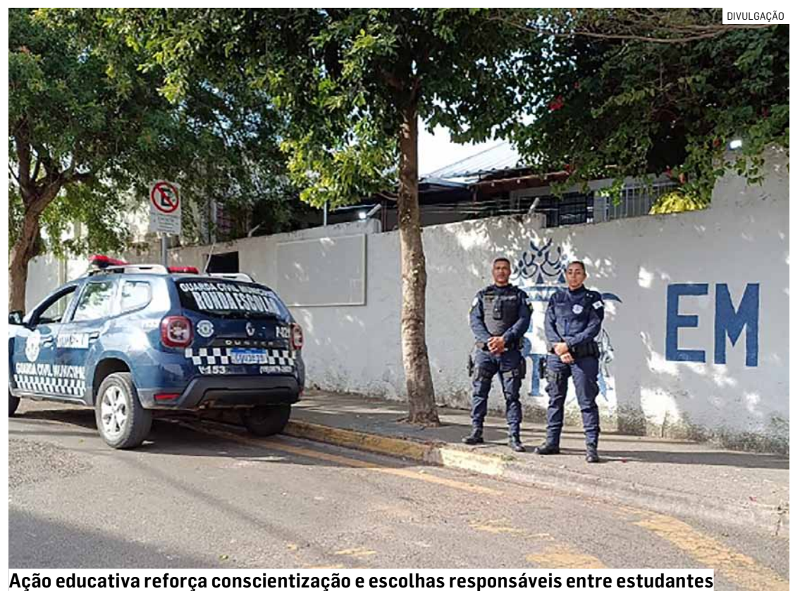
Ação educativa reforça conscientização e escolhas responsáveis entre estudantes

A Prefeitura de Monte Mor destacou que investir em ações educativas é fundamental para promover uma cultura de prevenção, contribuindo para a formação de jovens mais conscientes e preparados para fazer escolhas que favoreçam seu desenvolvimento e qualidade de vida.