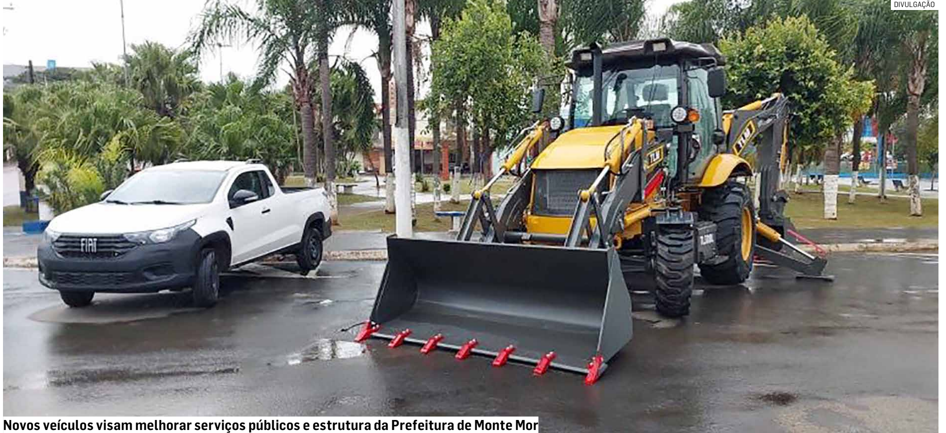
Novos veículos visam melhorar serviços públicos e estrutura da Prefeitura de Monte Mor

Outra importante conquista é uma retroscavadeira destinada à Secretaria de Planejamento e Obras. O equipamento foi adquirido por meio de emenda parlamentar do deputado fede-