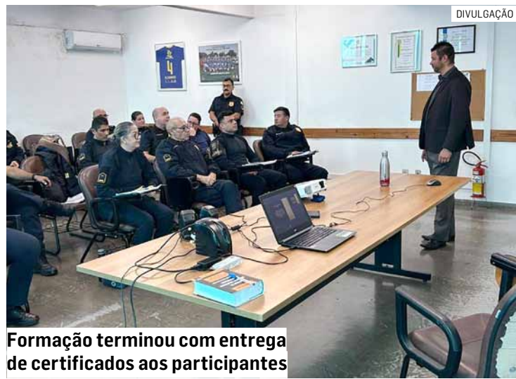
Formação terminou com entrega de certificados aos participantes

Da Redação • HORTOLÂNDIA tribunaliberal@tribunaliberal.com.br