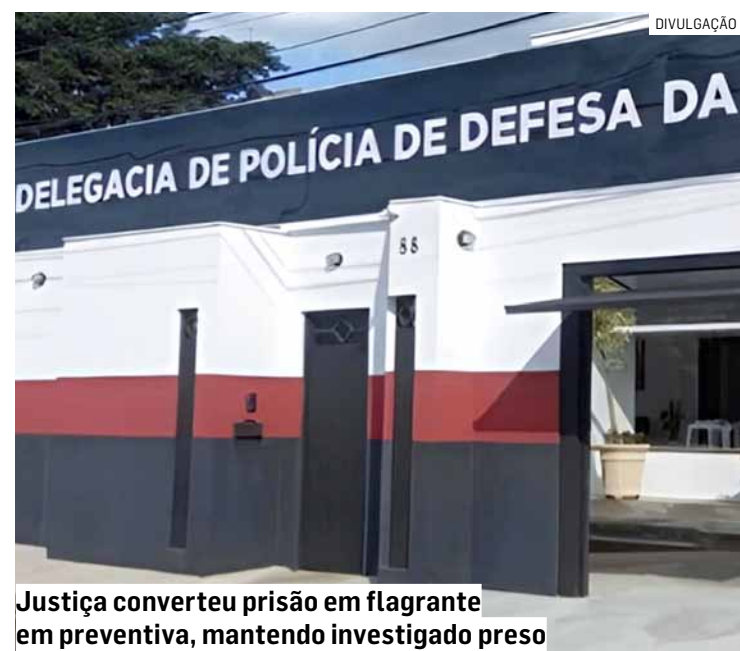
Justiça converteu prisão em flagrante em preventiva, mantendo investigado preso

A Polícia Civil prossegue com as investigações para esclarecer a dinâmica dos fatos, apurar a extensão dos crimes denunciados e reunir novos elementos que possam reforçar o inquérito policial.