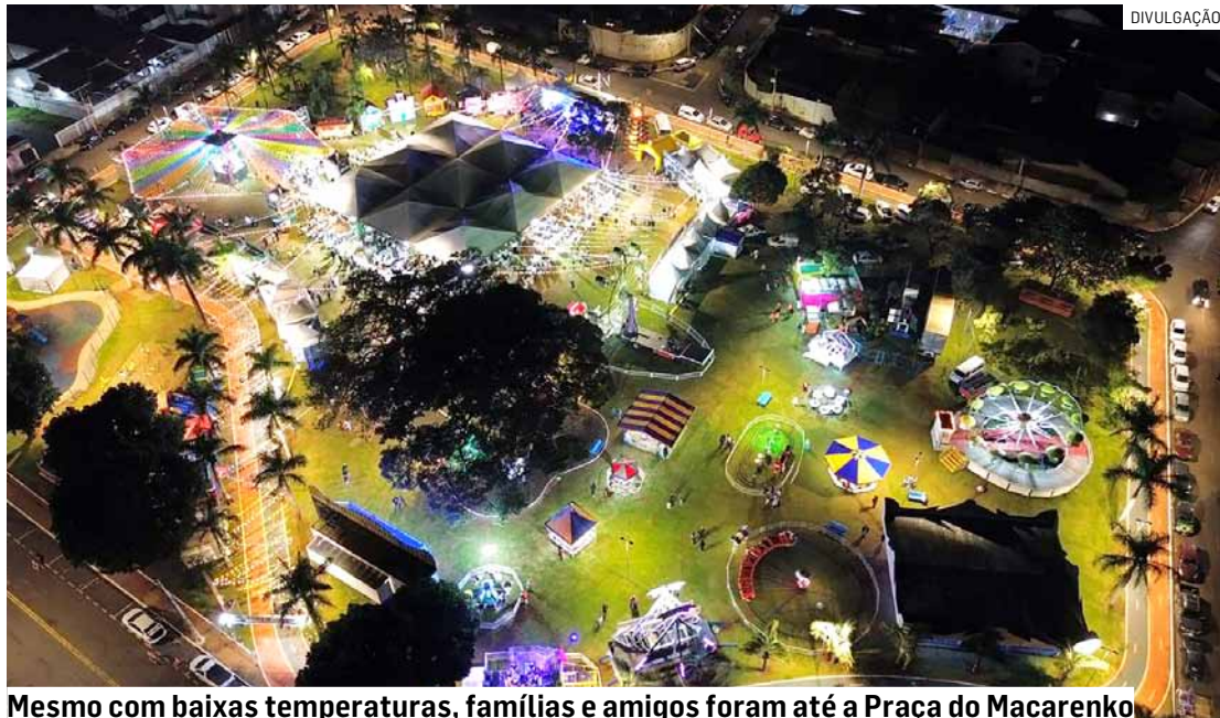
Mesmo com baixas temperaturas, famílias e amigos foram até a Praça do Macarenko

O grande destaque da abertura ficou por conta de um momento que encantou adultos e crianças. O evento recebeu as visitas do Mickey e da Minnie, que, acompanhados por um simpático Espantalho, espalharam brilho, encan-