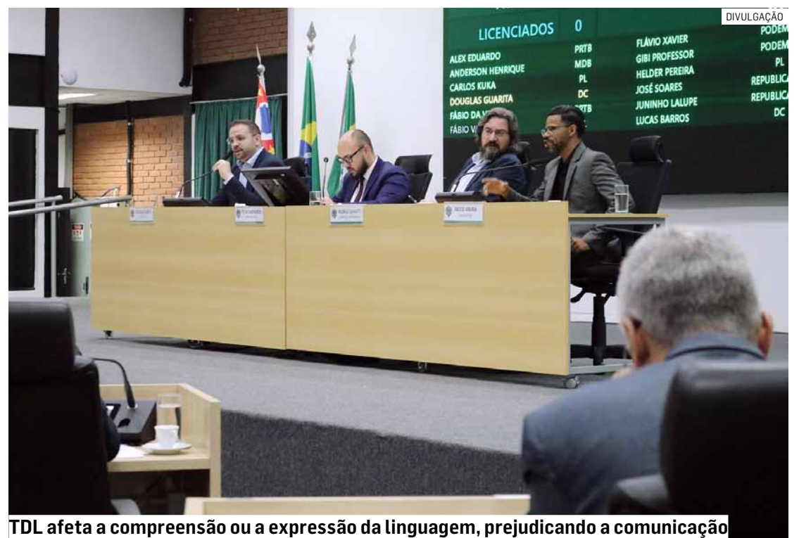
TDL afeta a compreensão ou a expressão da linguagem, prejudicando a comunicação

O TDL é uma condição neurodesenvolvimental que compromete a compreensão ou a expressão da linguagem, afetando diretamente a comunicação, a aprendizagem, o desenvolvimento escolar e as relações sociais da criança. Muitas vezes, o transtorno é confundido com dificuldades escolares comuns, atrasando o acompanhamento especializado.