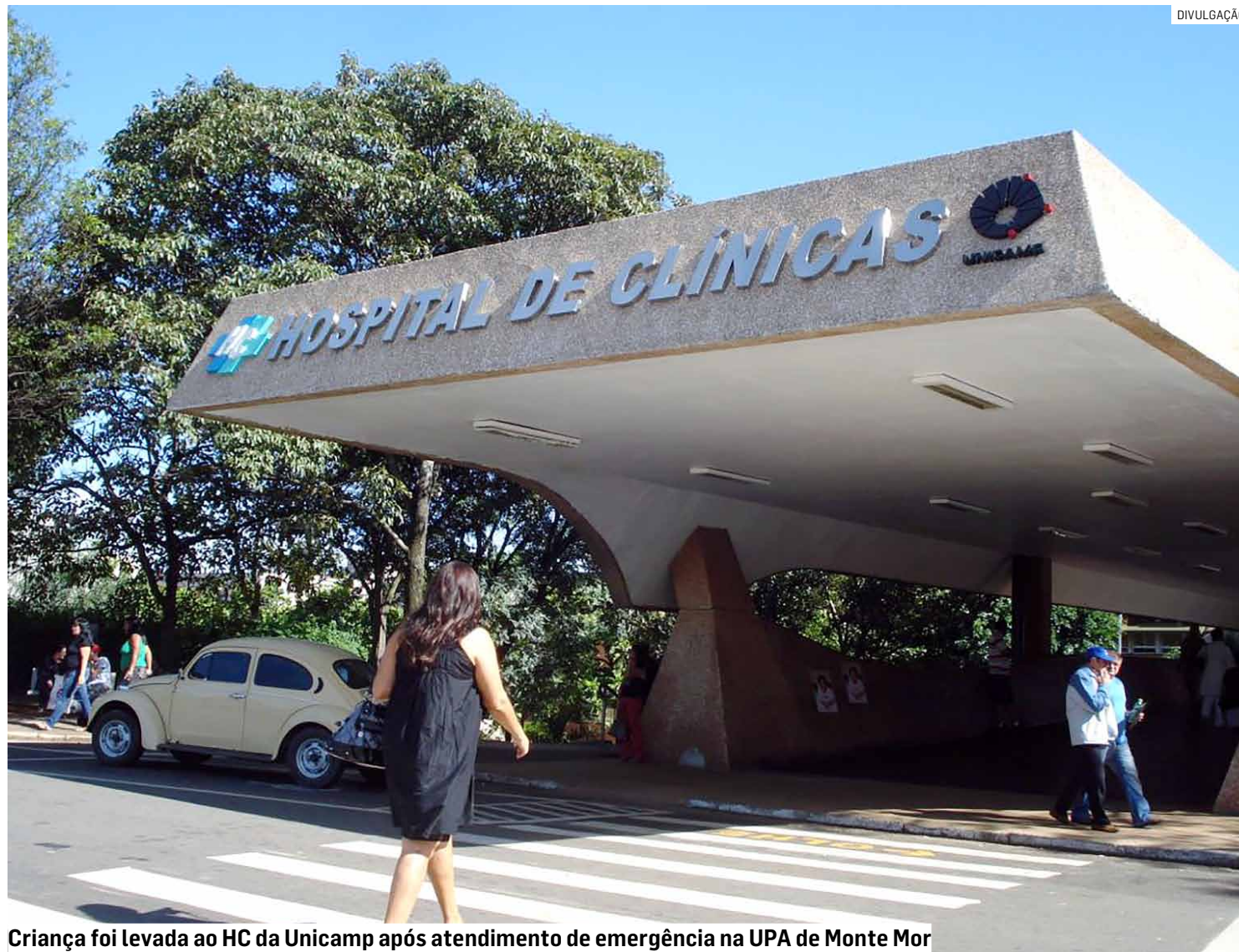
Criança foi levada ao HC da Unicamp após atendimento de emergência na UPA de Monte Mor

Menino teve 36% do corpo queimado e precisou ser intubado depois de explosão em meio ao acendimento de tacho; vítima foi transferida para o HC da Unicamp, enquanto o padrasto, também ferido, foi hospitalizado na metrópole