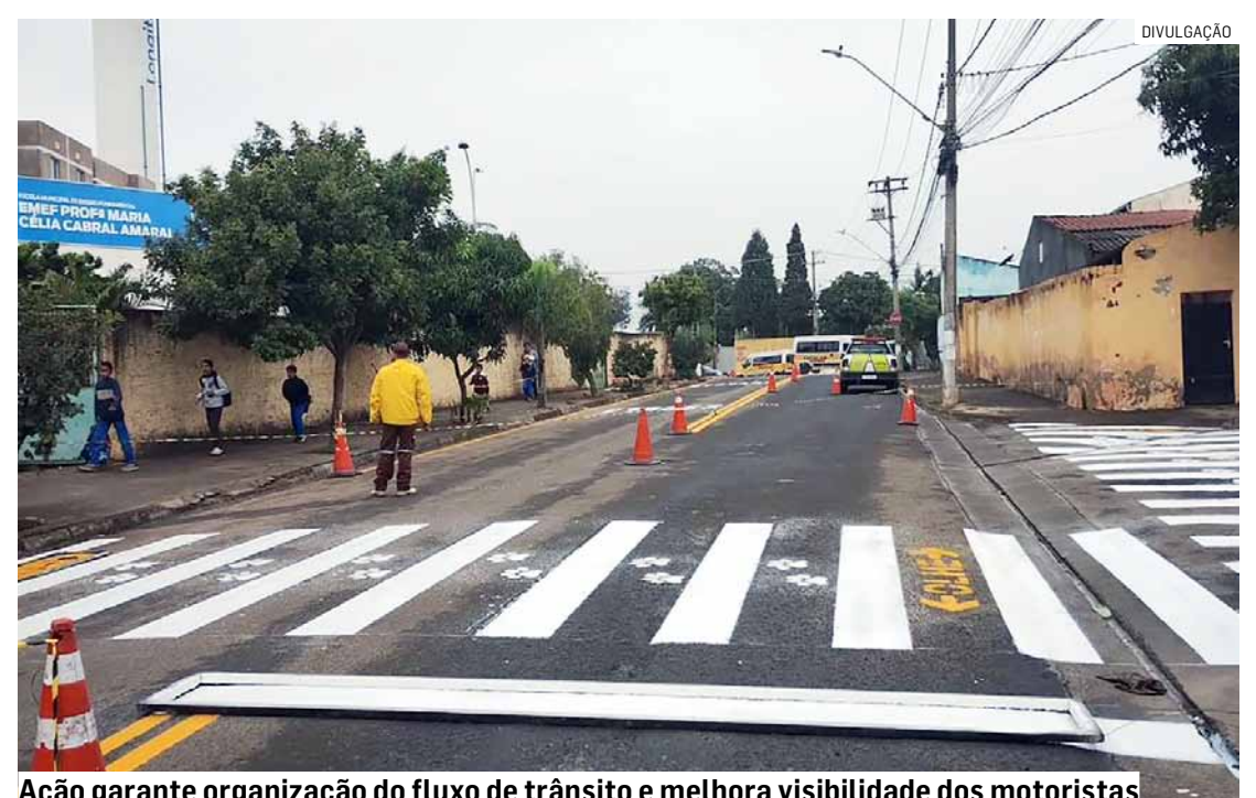
Ação garante organização do fluxo de trânsito e melhora visibilidade dos motoristas

A sinalização de solo também já aconteceu na Rua da Coruja, no Jardim Boa Esperança, contemplando diversos cruzamentos e no Jardim Interlagos, na Rua Rio Tapajós, próximo de uma escola e da área que recebe modernização da prefeitura. Vias localizadas entre o Jardim Carmen Cristina e o Jardim Minda e ruas do Jardim Santa Fé foram outros espaços contemplados.