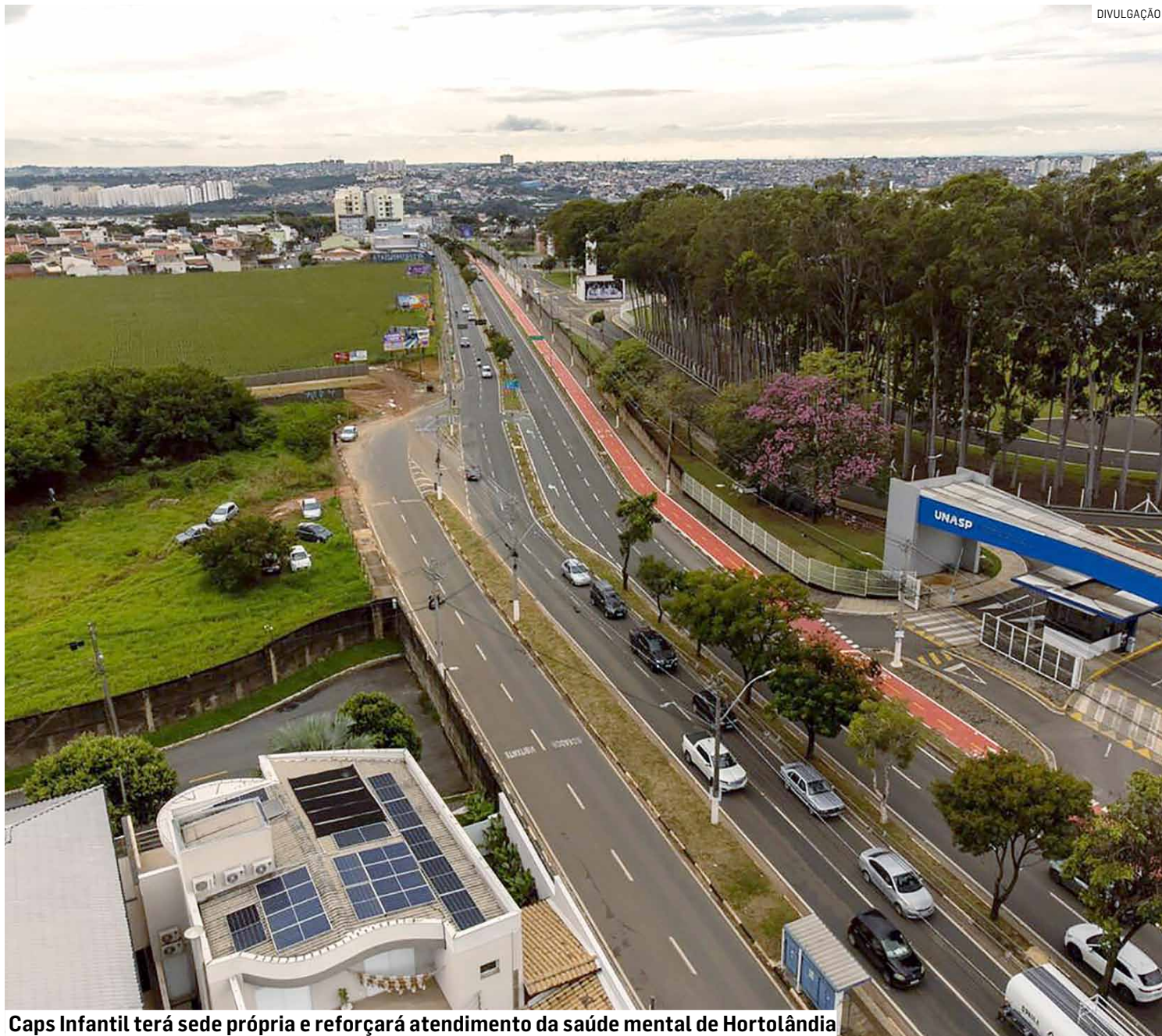
Caps Infantil terá sede própria e reforçará atendimento da saúde mental de Hortolândia

O novo prédio substituirá as atuais instalações do serviço, que hoje funcionam em um imóvel alugado no Parque Residencial Maria de Lourdes. O projeto prevê uma estrutura mais ampla e moderna, com sala de enfermagem, farmácia, três consultórios para atendimento individual, três salas destinadas a atividades coletivas, quarto coletivo, recepção, área de acolhimento, vestiários, ambientes administrativos, além de copa, almoxarifado e outros espaços de apoio.