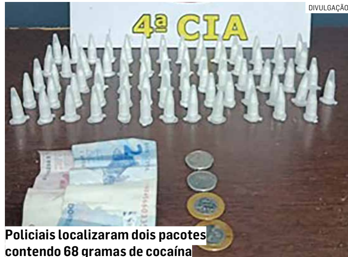
Policiais localizaram dois pacotes contendo 68 gramas de cocaína

Na revista, os policiais localizaram dois invólucros plásticos contendo, ao