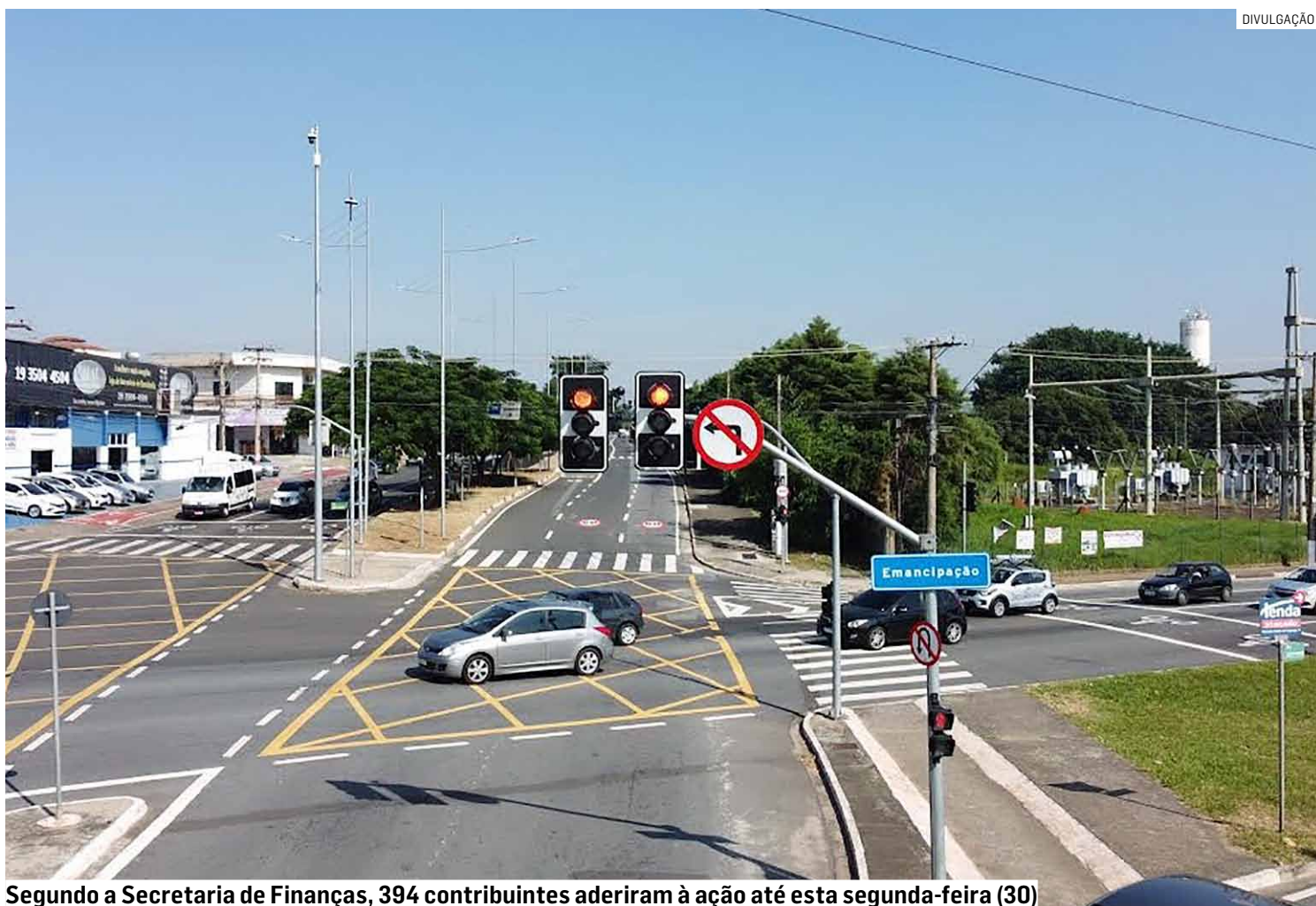
Segundo a Secretaria de Finanças, 394 contribuintes aderiram à ação até esta segunda-feira (30)

A iniciativa permite à Administração Municipal devolver valores entre R$ 340 e R$ 748, referentes a despesas com licenciamento ou transferência do veículo para Hortolândia. O ressarcimento varia de acordo com o valor venal do automóvel. Para veículos novos e usados com valor superior a R$ 80.001, o