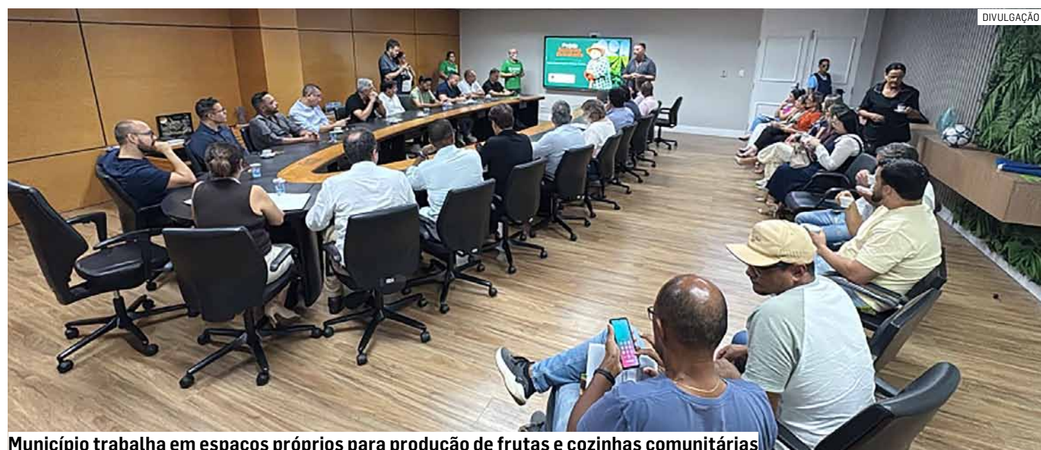
Município trabalha em espaços próprios para produção de frutas e cozinhas comunitárias