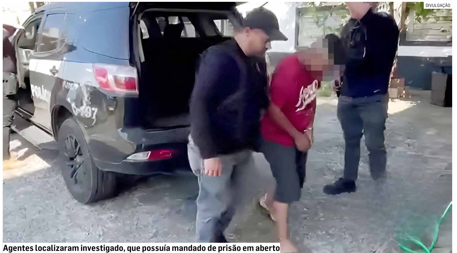
Agentes localizaram investigado, que possuía mandado de prisão em aberto

Ainda durante a operação, os agentes localizaram o investigado, que possuía mandado de prisão temporária em aberto. Ele foi detido e encami-