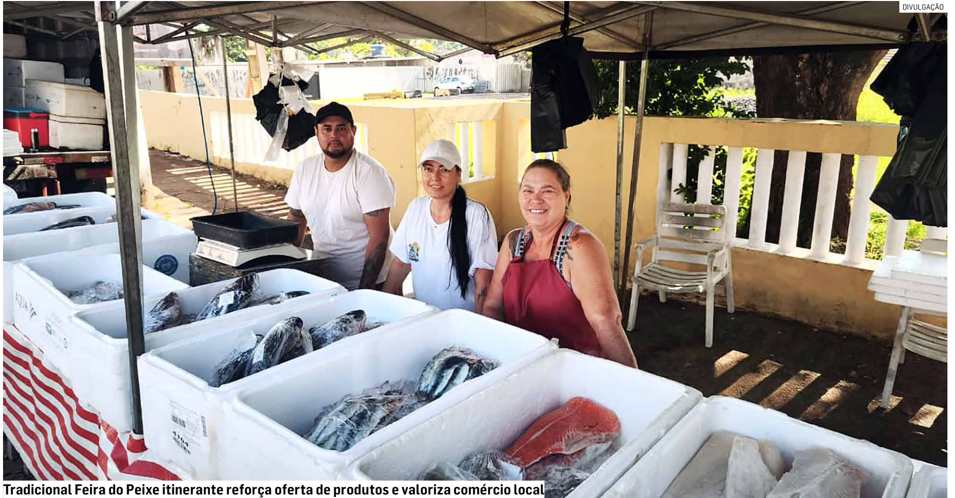
Tradicional Feira do Peixe itinerante reforça oferta de produtos e valoriza comércio local

Na região do Picerno, os moradores poderão adquirir peixes frescos na Avenida Fuad Assaf Maluf, no local da feira livre, durante toda a semana, nos mesmos horários. Ainda no bairro, haverá ponto adicional na sexta-feira, das 8h às 12h, na Rua Fuad Assaf Maluf, esquina com a