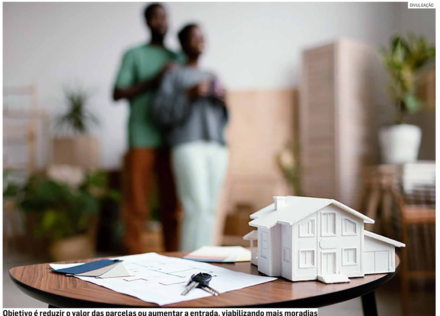
Objetivo é reduzir o valor das parcelas ou aumentar a entrada, viabilizando mais moradias

Segundo o Estado, o modelo adotado pelo programa tem se mostrado eficaz na inclusão de famílias de menor renda no mercado imobiliário. Dados recen-