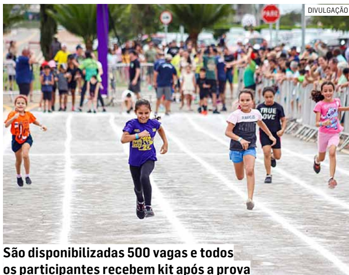
São disponibilizadas 500 vagas e todos os participantes recebem kit após a prova

Podem participar crianças de 0 anos a adolescentes de até 12 anos e haverá uma categoria especial pa-