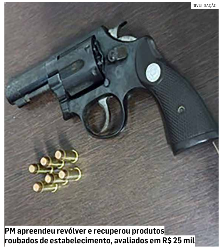
PM apreendeu revólver e recuperou produtos roubados de estabelecimento, avaliados em R$ 25 mil

O segundo envolvido foi detido ainda na motocicleta utilizada na fuga, que apresentava sinais de adulteração. Ambos foram encaminhados ao 1º Distrito Policial de Sumaré, onde permaneceram à disposição da Justiça pelos crimes de roubo, receptação e adulteração de veículo.