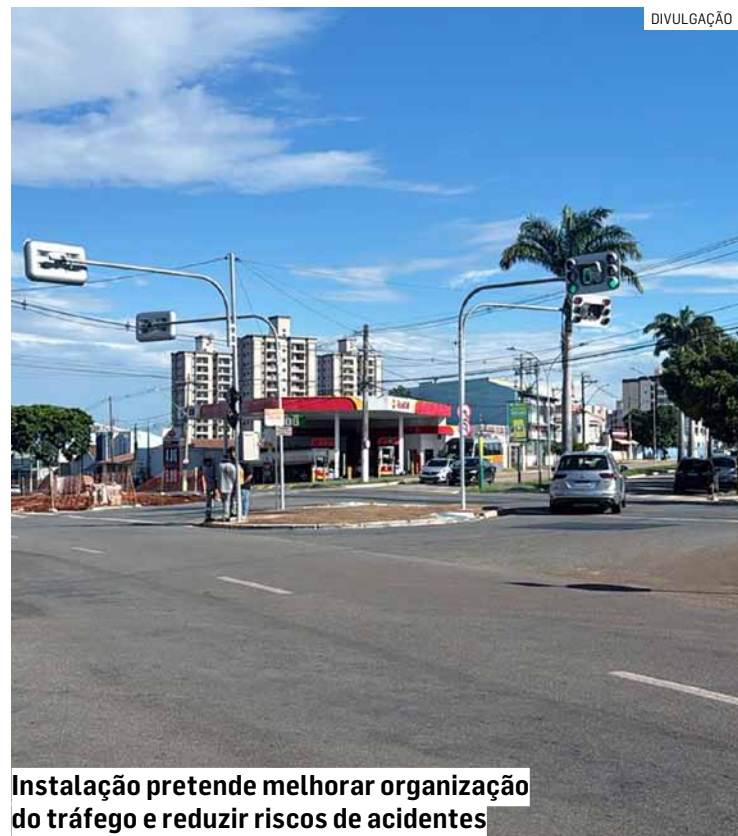
Instalação pretende melhorar organização do tráfego e reduzir riscos de acidentes