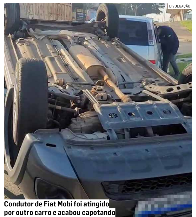
Condutor de Fiat Mobi foi atingido por outro carro e acabou capotando

Durante a travessia, um Ford Ka, conduzido por uma mulher, não percebeu a manobra e acabou colidindo lateralmente contra o HR-V. A motorista foi socorrida e encaminhada ao Hospital Municipal de Nova Odessa.