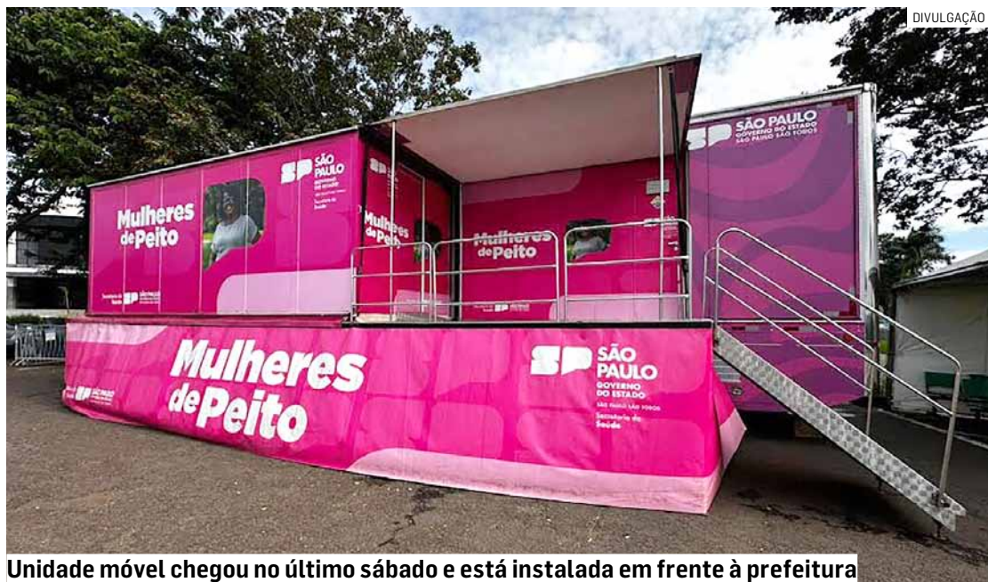
Unidade móvel chegou no último sábado e está instalada em frente à prefeitura

Podem realizar o exame mulheres a partir dos 35 anos.