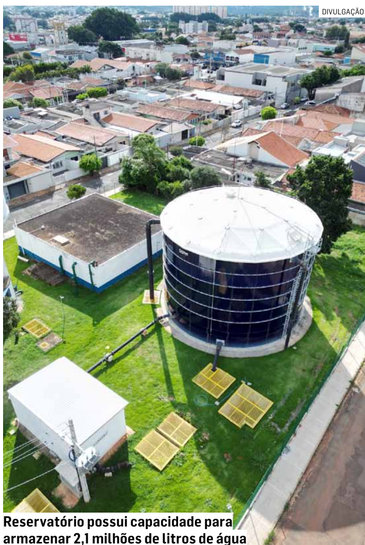
Reservatório possui capacidade para armazenar 2,1 milhões de litros de água

O superintendente do DAE, Fábio Renato de Oliveira, destacou o papel estratégico da nova estrutura. “Esse reservatório é fundamental para dar mais equilíbrio ao sistema, principalmente em momentos de maior consumo ou em situações opera-