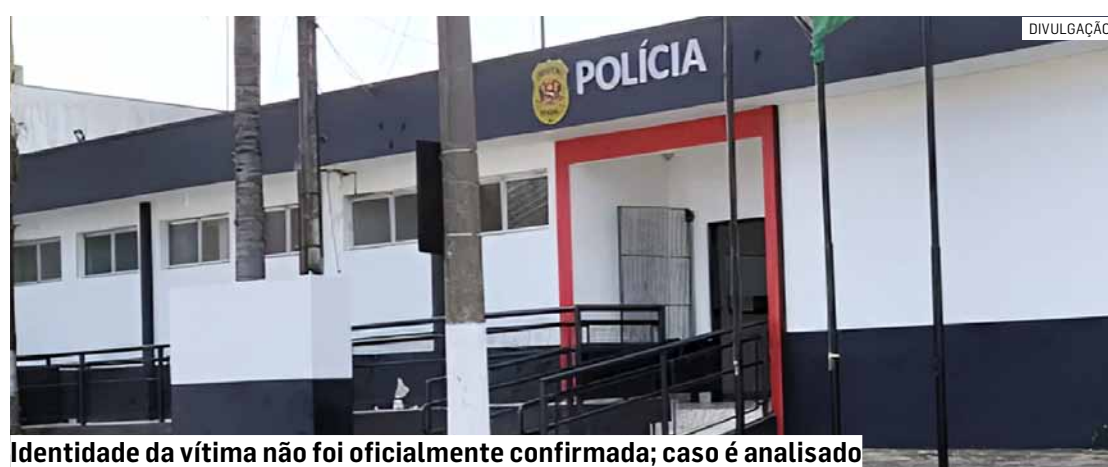
Identidade da vítima não foi oficialmente confirmada; caso é analisado

Segundo informações preliminares, equipes da Polícia Militar foram as primeiras a chegar ao local e encontraram o corpo já parcialmente carbonizado na noite de sexta-feira (27). A área foi isolada para o trabalho da perícia técnica, que deve auxiliar na identificação da vítima e na apuração das circunstâncias do crime.