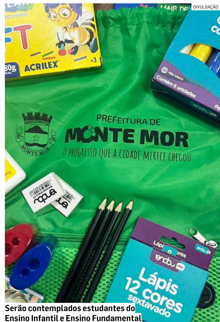
Serão contemplados estudantes do Ensino Infantil e Ensino Fundamental.

Os kits incluem itens essenciais como lápis, cadernos, régua, lápis de cor, cola, borracha e tesoura. Neste ano, uma novidade foi incluída: mochila tipo sacola personalizada, que substitui as antigas pastas, trazendo mais praticidade e conforto para os estudantes. As unidades escolares já estão comunicando pais e responsáveis sobre a organização e o cronograma de entrega, que será realizado de forma planejada em cada escola.