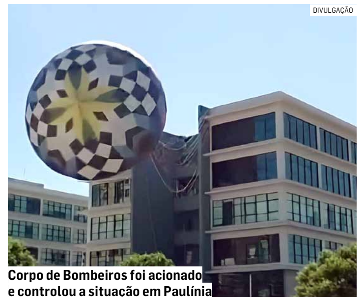
Corpo de Bombeiros foi acionado e controlou a situação em Paulínia

De acordo com informações preliminares, o artefato ainda estava em chamas durante a queda, o que elevou o risco de incêndio no local. A situação levou ao acionamento imediato de equipes do Corpo de Bombeiros e da Polícia Militar, que se deslocaram até a área para realizar o atendimento da ocorrência e garantir a segurança.