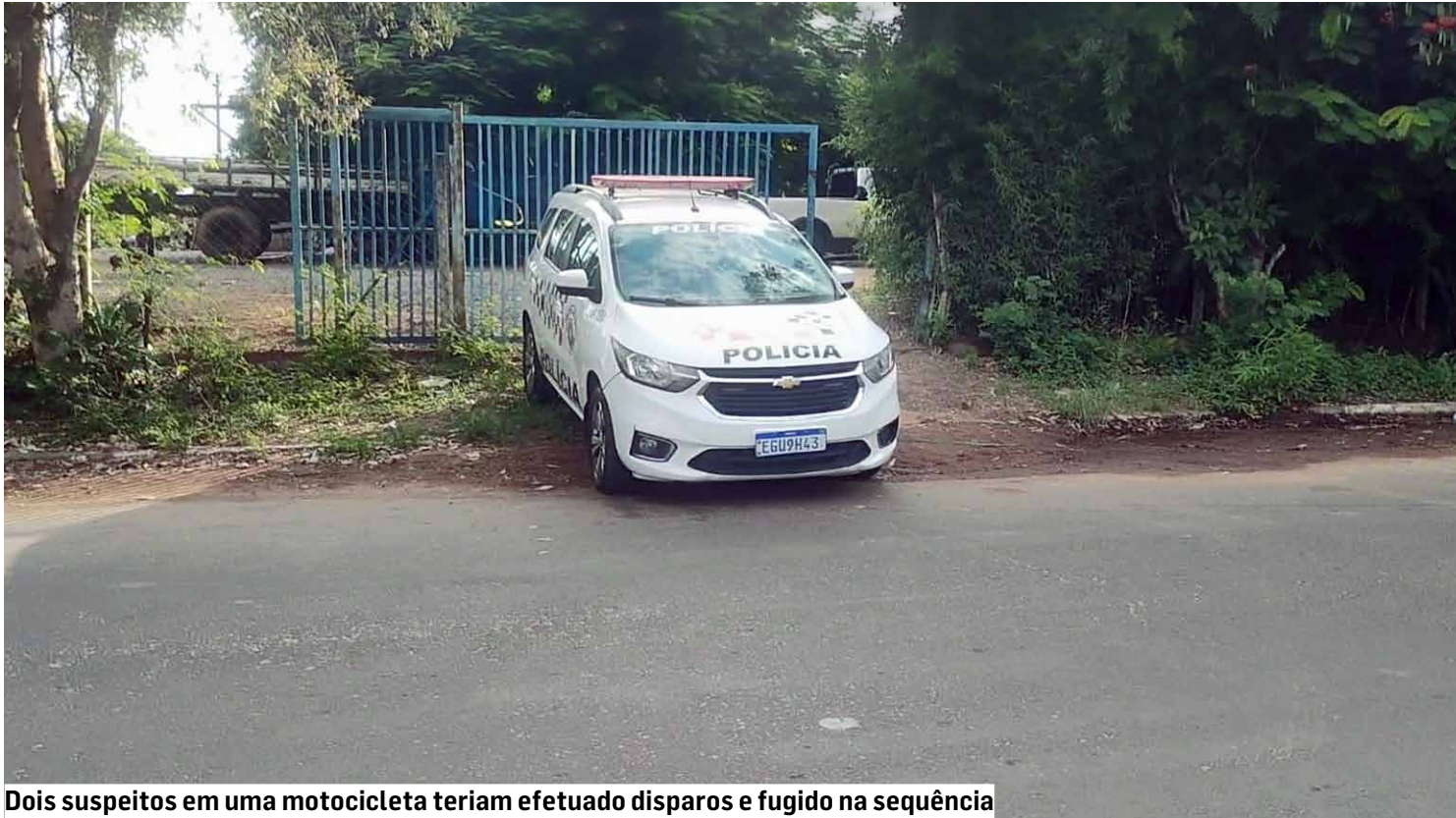
Dois suspeitos em uma motocicleta teriam efetuado disparos e fugido na sequência

Homicídio foi registrado na tarde desta segunda-feira (30) em estabelecimento comercial instalado na Avenida Brasil; vítima, de 46 anos, era cliente e chegou a ser levada à Unidade de Pronto Atendimento, mas não resistiu a ferimentos