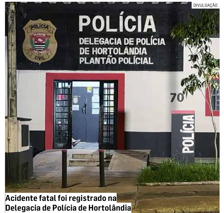
Acidente fatal foi registrado na Delegacia de Polícia de Hortolândia

O caso foi encaminhado à Delegacia de Polícia, onde será investigado para esclarecer as causas do acidente e eventuais responsabilidades.